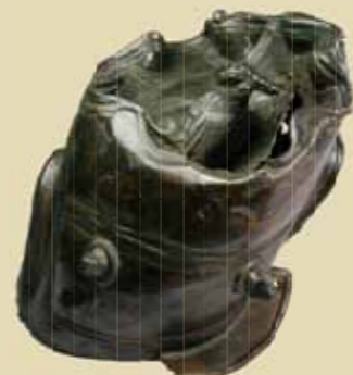
Slávnostná prilba vojenského hodnostára, typ Guisborough, 2. stor. po Kr., bohato zdobená plastickou a rytou výzdobou.