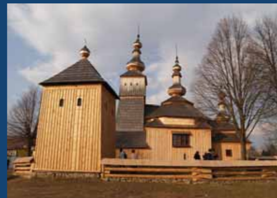
Drevené chrámy v slovenskej časti Karpatského oblúka, Ladomirová, SR.