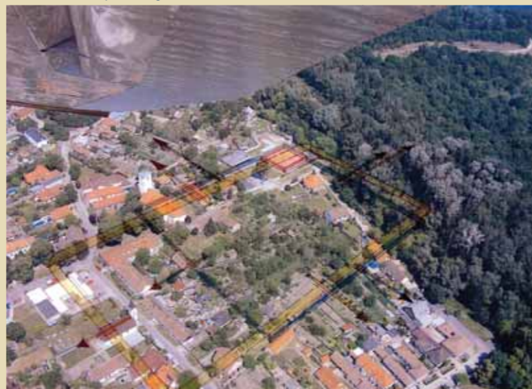
Letecká snímka na pôdorys kastela Gerulata.

Hlavnou stavebnou aktivitou 4. stavebnej etapy bolo vybudovanie pevnosti v severnom rohu tábora. Celková plocha kastela sa tak v tejto etape výrazne zmenšila. Vežovitá pevnosť mala 12 mohutných pilierov, ktoré tvorili nádvorie a základové murivo pilierov a obvodových múrov siahalo až do hĺbky 3 – 4 metrov. Preto možno predpokladať až trojposchodovú stavbu, v strede ktorej bola asymetricky umiestnená studňa. Na stavbu pevnosti boli sekundárne použité kamenné výtvarné diela, ktoré sú vystavené v Múzeu Antická Gerulata.