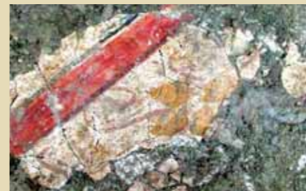
Maďarská ulica. Interiérová ometka zdobená florálnymi motívmi.