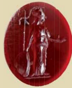
Maďarská ulica. Gema s Minervou – patrónkou remesiel.