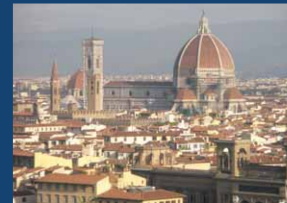
Historické centrum Florencie, Taliansko