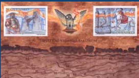
Poštová známka Limes Romanus, Gerulata – Carnuntum. Spoločné vydanie poštových známok Slovenska s Rakúskom spojilo opäť antickú Gerulatu a Carnuntum. Autor výtvarného návrhu známky a hárčeka: Igor Piačka; rytec známky: Martin Činovský