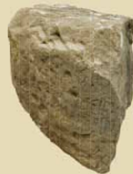
Mílnik. Vznik nápisu môžeme datovať do obdobia medzi januárom r. 252 a augustom r. 253. V poslednom riadku nápisu je zrejme uvedená vzdialenosť medzi náleziskom a caput viae . Keďže Gerulata ležala pri limitnej ceste, caput viae mohlo byť v tomto prípade iba Carnuntum.