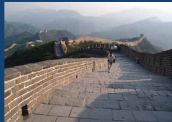
Veľký čínsky múr, Čína, Foto: L. Pinčíková