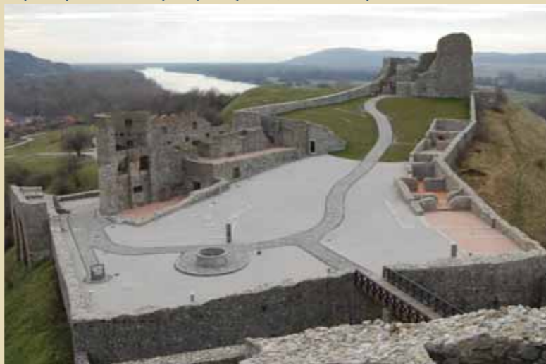
Devín nad sútokom Dunaja a Moravy. Nádvorie stredného hradu so studňou a vyznačenými základmi stavby z doby rímskej (3. stor.).