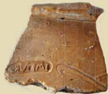
Prvý a jediný nález tehly s kolkom jednotky Ala I Cannanefatum. (Gerulata, Hájová ulica).