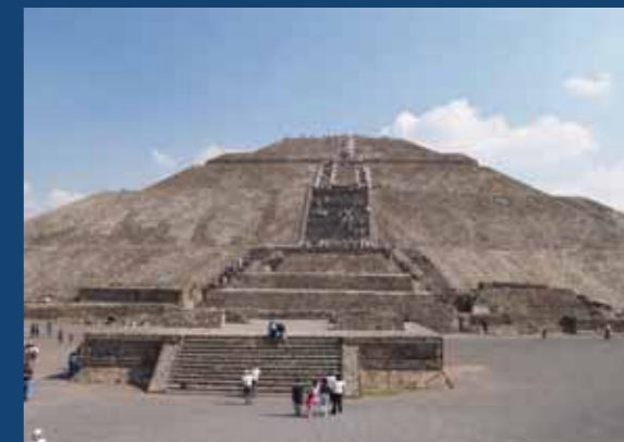
Predhispiánske mesto Teotihuacan, Pyramída Slnka, Mexiko.