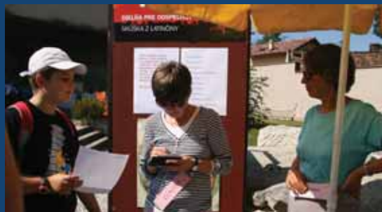
Rímske hry v Rusovciach, september 2011.

Autorky: Jaroslava Schmidtová, Olga Gáfríková, Ľubica Pinčíková Grafické spracovanie: Grafoman s.r.o., Katarína Harvaníková