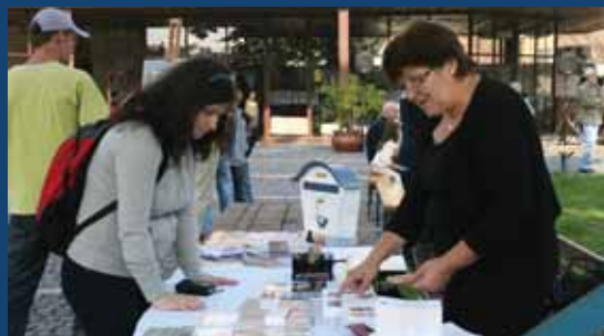
Novú známku slávnostne uviedla Slovenská pošta a Múzeum mesta Bratislavy 12. septembra 2009 na Rímskych hrách v antickej Gerulate v Rusovciach.