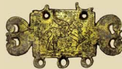
Kováčsova ulica. Bronzové zoomorfné kovanie opasku s Pegasom.