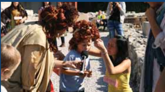
Rímske hry v Rusovciach, september 2011.