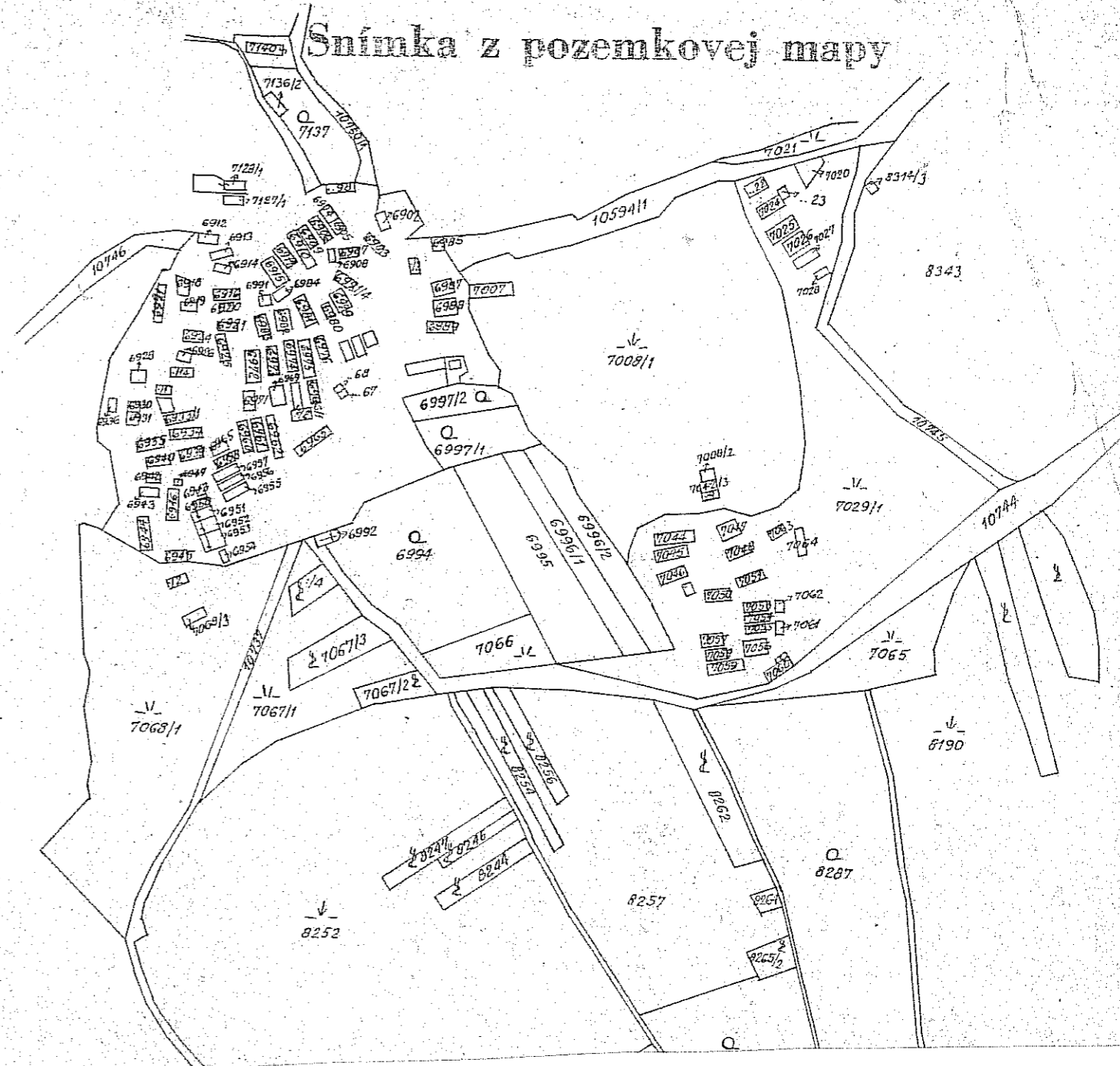
Snímka z pozemkovej mapy s vyznačením územia (intravilánu) lokality osady Sebechleby - Stará Hora v mierke 1 : 2880.