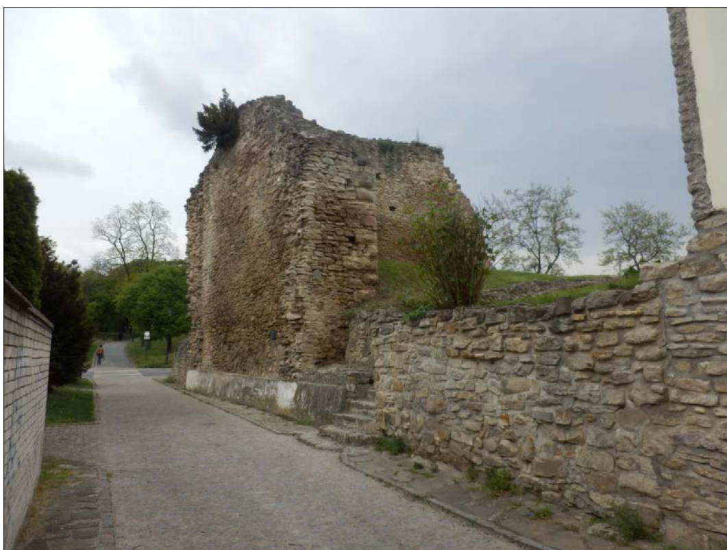
Obr.3 : Severná brána mestského opevnenia, spojovacia ulička z Potočnej ul., chránený pohľad z interiéru PZ, úsek I.