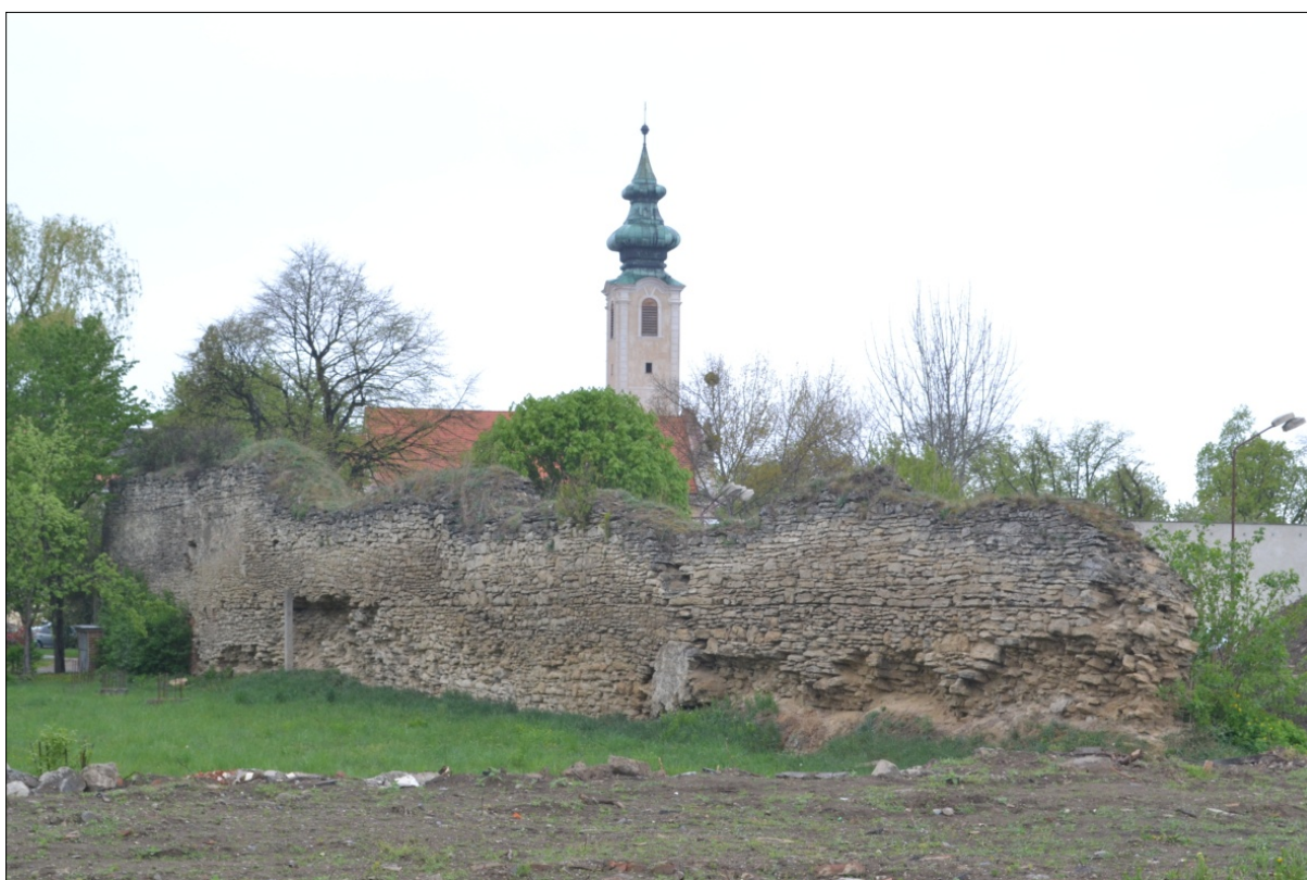
Obr. 47 : Hradba v areáli nemocnice s priehľadom na kostol a vežu milosrdných bratov, Chránený pohľad z exteriéru PZ, úsek V.