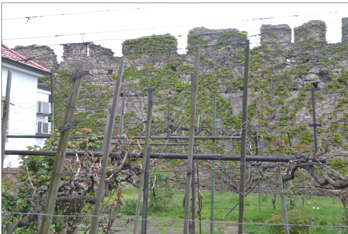
Obr.51 (detail obr.50): ulica Pplk.Pljušťa, pohľad na hradbu s cimburím z exteriéru PZ, úsek VI.