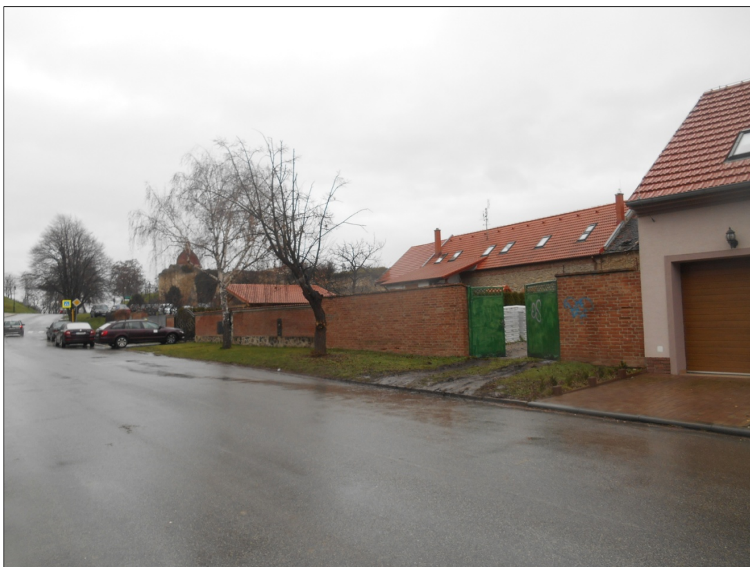
Obr.8: ulica Pod Kalváriou, Línia exteriérových chránených pohľadov, úsek I.