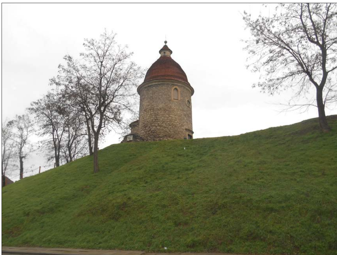
Obr.14: ulica Pod Kalváriou, Línia exteriérových chránených pohľadov, úsek I.