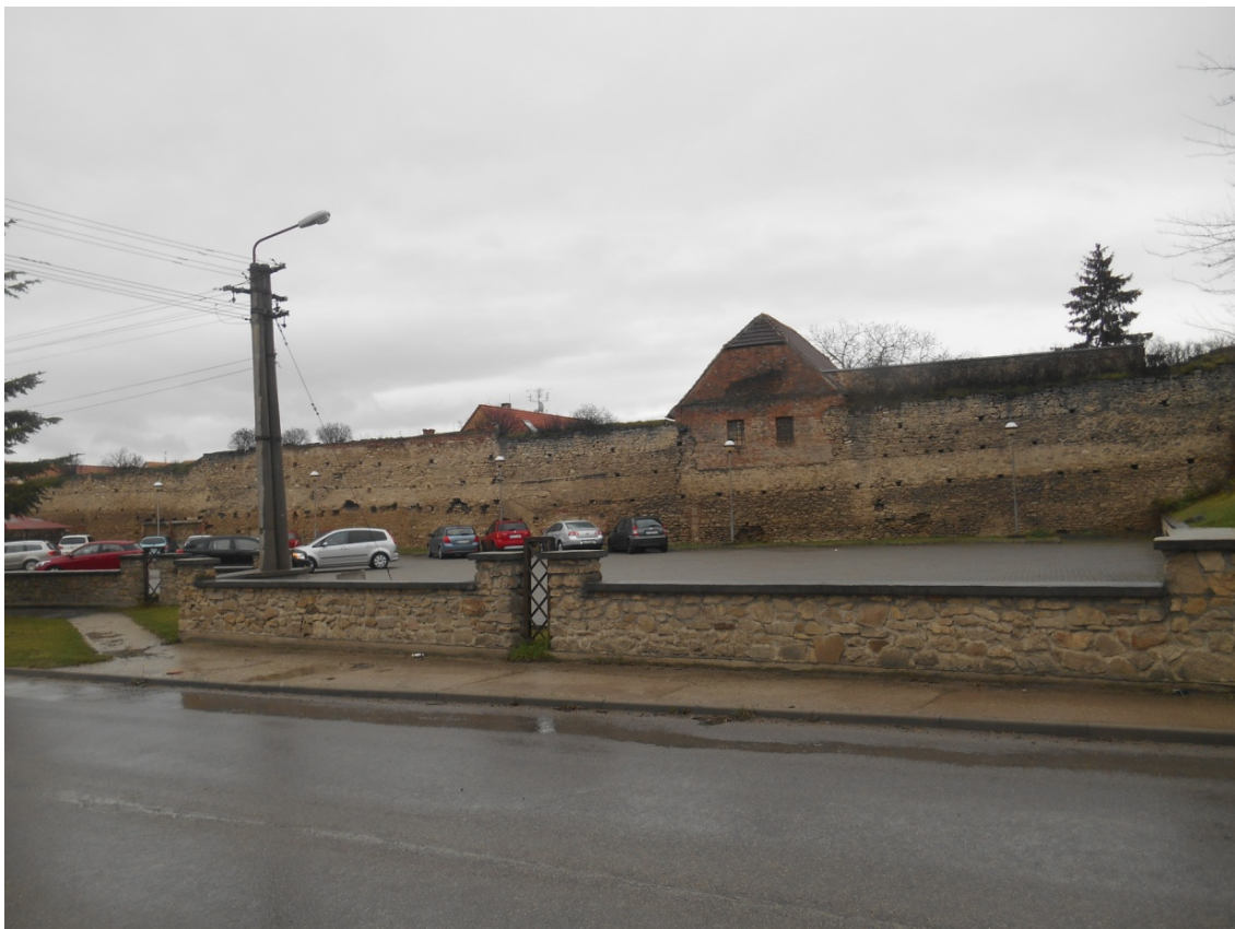
Obr.17: ulica Pod Kalváriou, Línia exteriérových chránených pohľadov, úsek I.