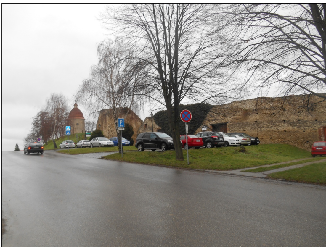
Obr.11 : ulica Pod Kalváriou, Línia exteriérových chránených pohľadov , úsek I.