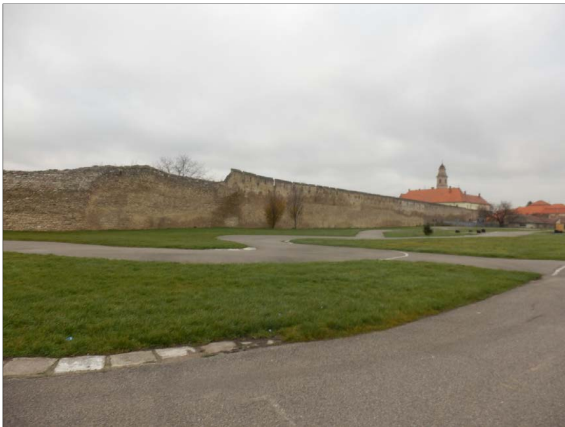
Obr.32 : Mýtna ulica, severovýchodné nárožie, Lína exteriérových chránených pohľadov, úsek III.