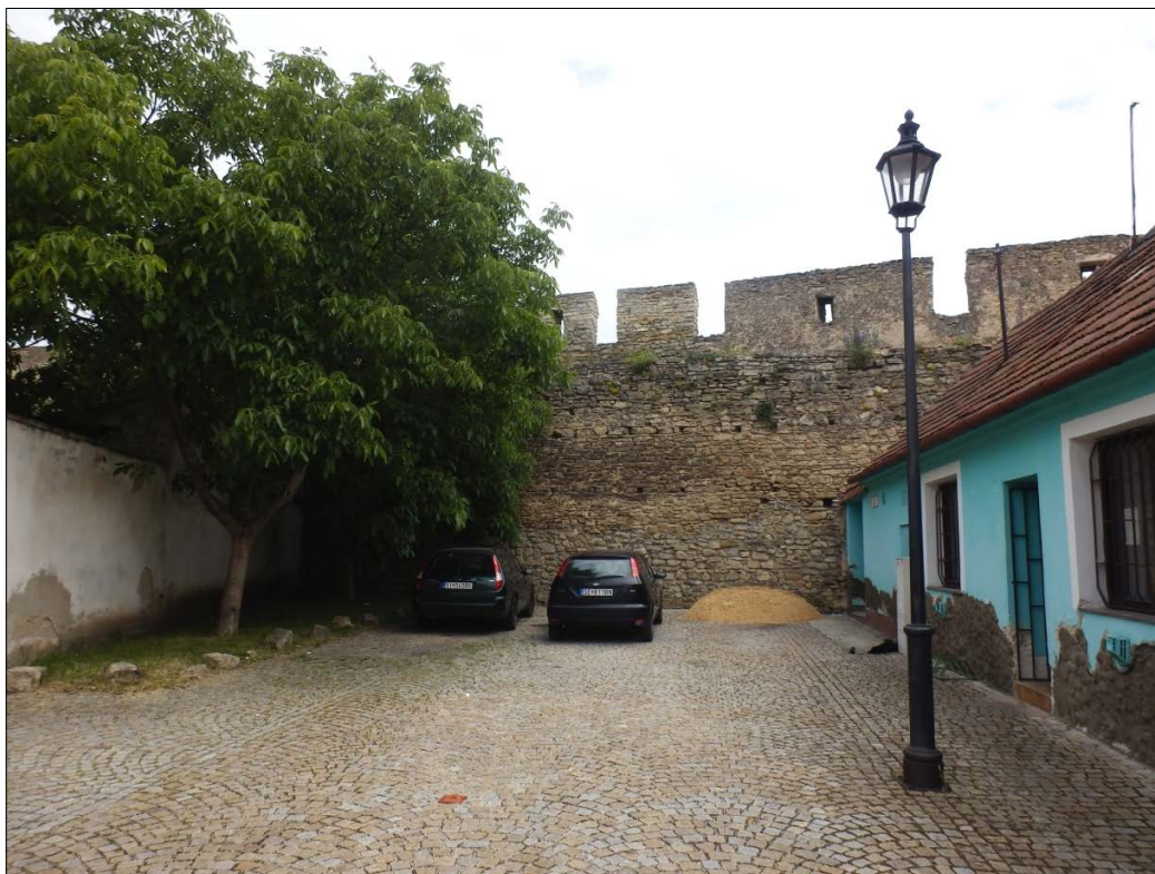
Obr.40 : Hradba opevnenia z priestoru Kollárovej ulice, Chránený pohľad z interiéru PZ, úsek III.

Úsek IV.: Je situovaný v južnej časti opevnenia pri juhovýchodnom nároží (zaniknutom). Úsek tvoria dve časti múru. Dlhší múr hradby sa nachádza paralelne s Boorovou ulicou (medzi Hollého a Hurbanovu ul.). Menší úsek múru tvorí torzo kolmé na Boorovu (pri Boorova 1).