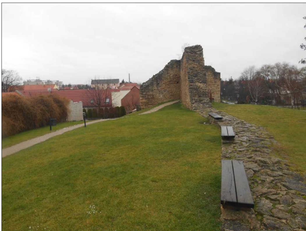
Obr.2 : Pri Rotunde s opevnením a severnou bránou, chránený pohľad z interiéru PZ, úsek I.