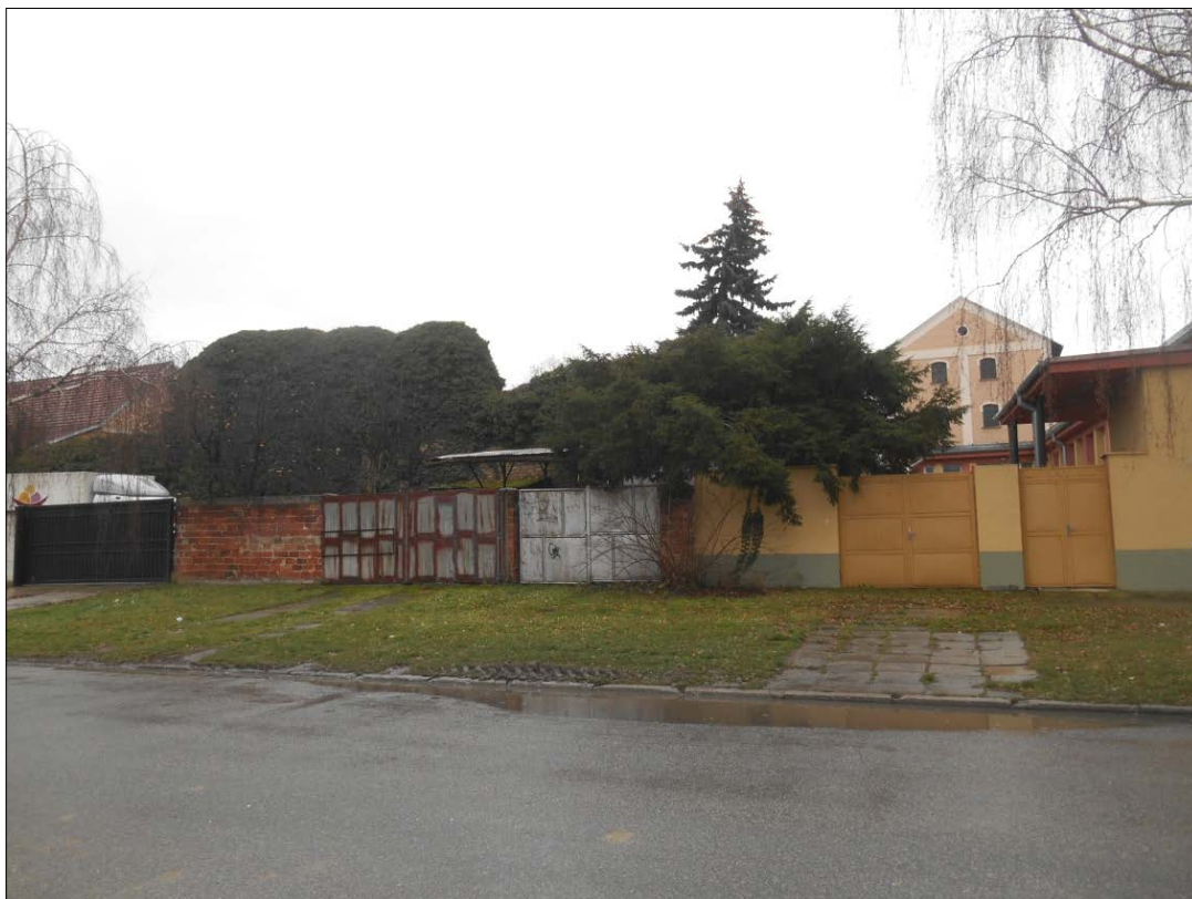
Obr.6 : ulica Pod Kalváriou, Lína exteriérových chránených pohľadov, úsek I.