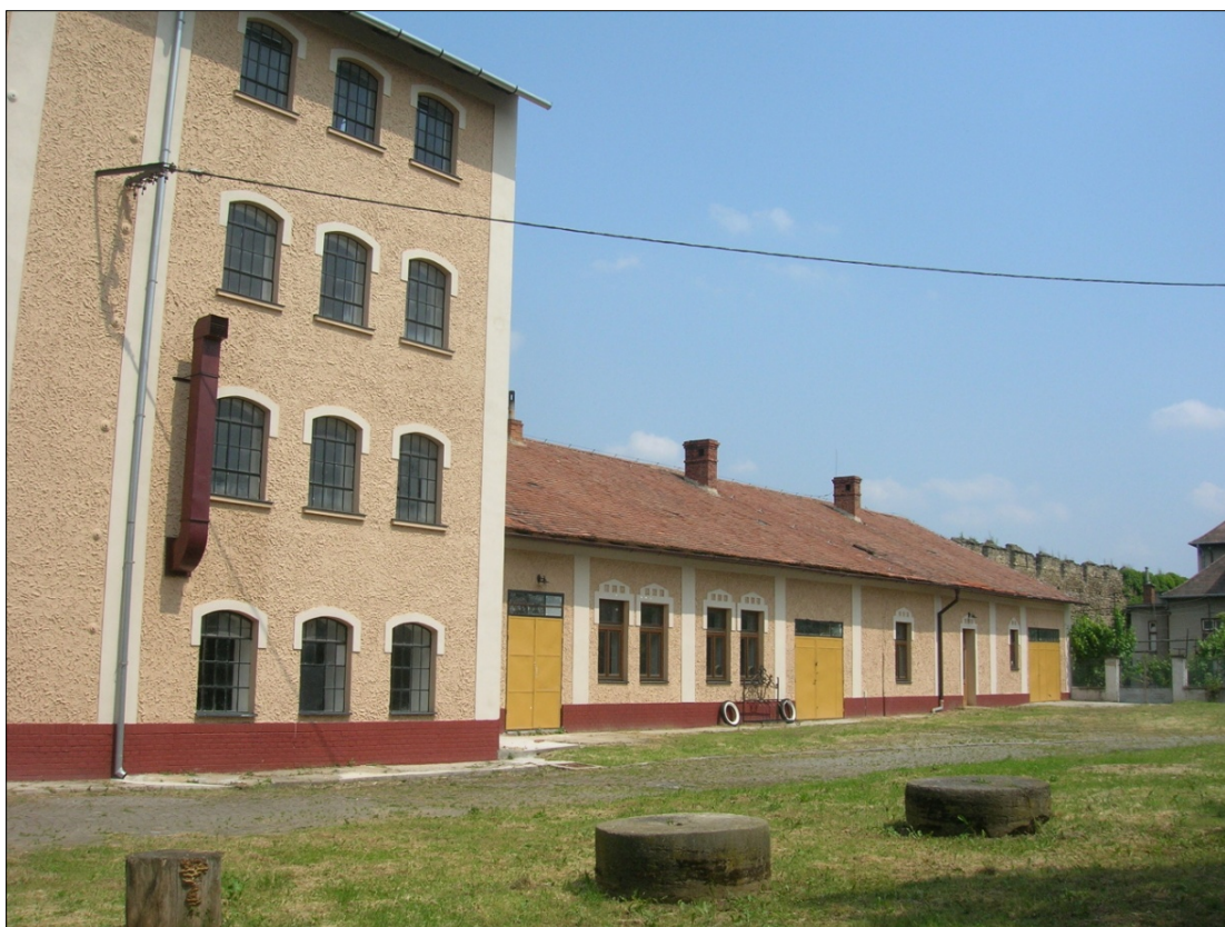
Obr.52: ulica Pplk. Pljušťa, chránený pohľad na hradbu s cimburím z exteriéru PZ, úsek VI.