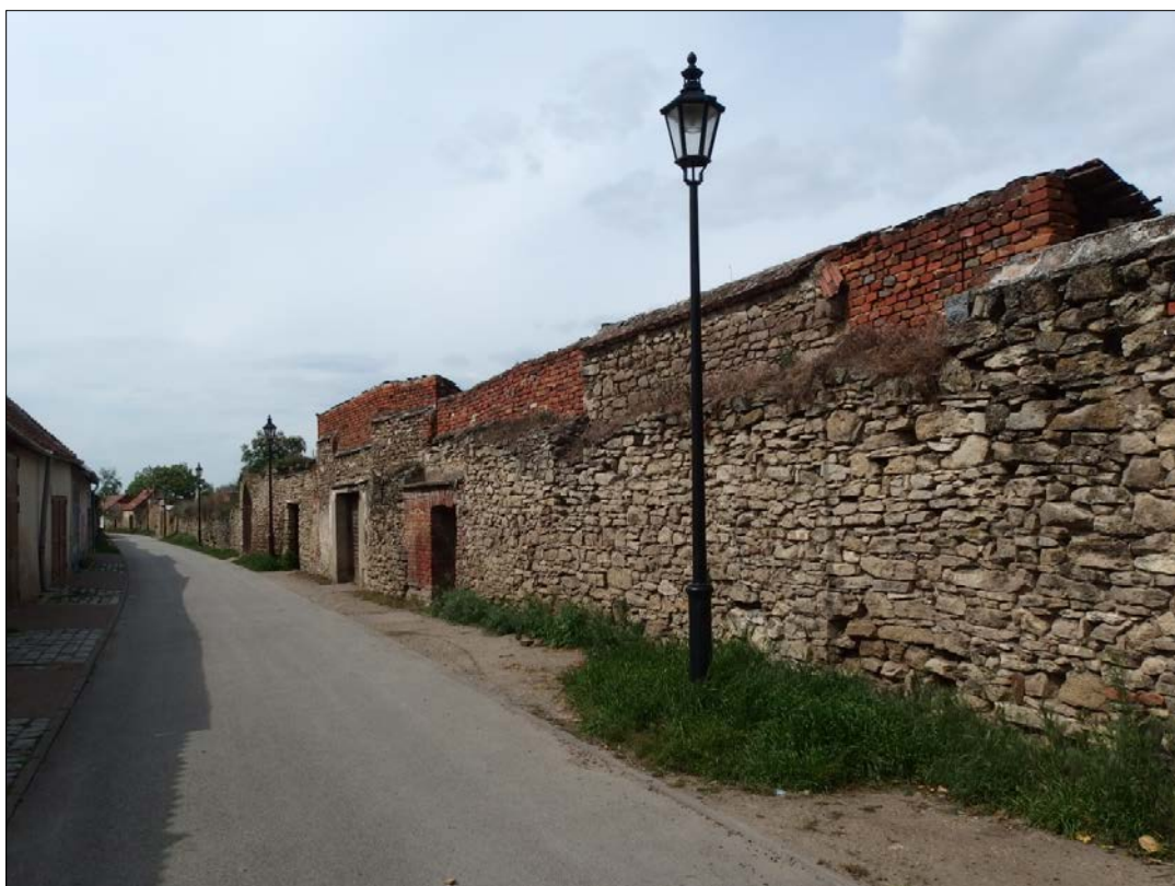
Obr.24 : ulica Za Mestskou zd'ou (od Kráľovskej), Chránený pohľad z interiéru PZ, úsek II.