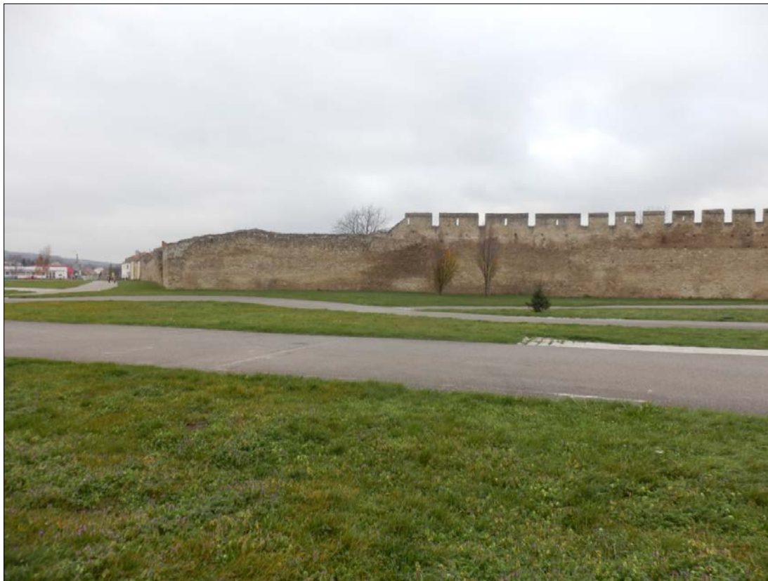
Obr.31 : Mýtnej ulica, pohľad na hradby so severovýchodným nárožím, Lína exteriérových chránených pohľadov, úsek III.