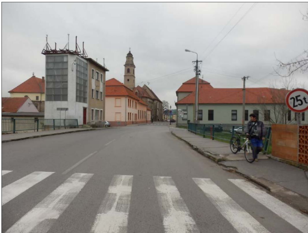
Obr.26 : Mýtna ulica, Línia exteriérových chránených pohľadov, úsek III.

Úsek III.: Úsek situovaný vo východnej časti obvodu opevnenia, od Kráľovskej ulice, pri františkánskom kláštore, po Potočnú ulicu.