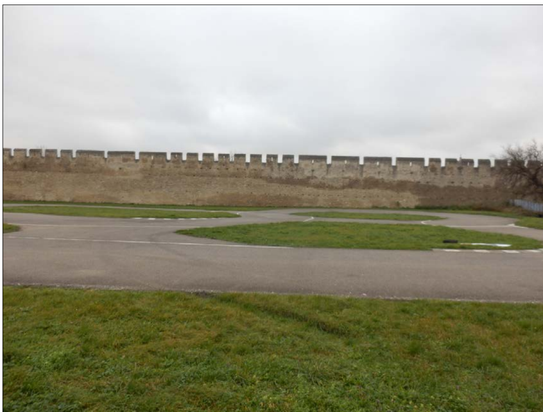
Obr.30 : Pohľad od Mýtnej ulice cez dopravné ihrisko, hradba pri františkánskej záhrade, Lína exteriérových chránených pohľadov, úsek III.