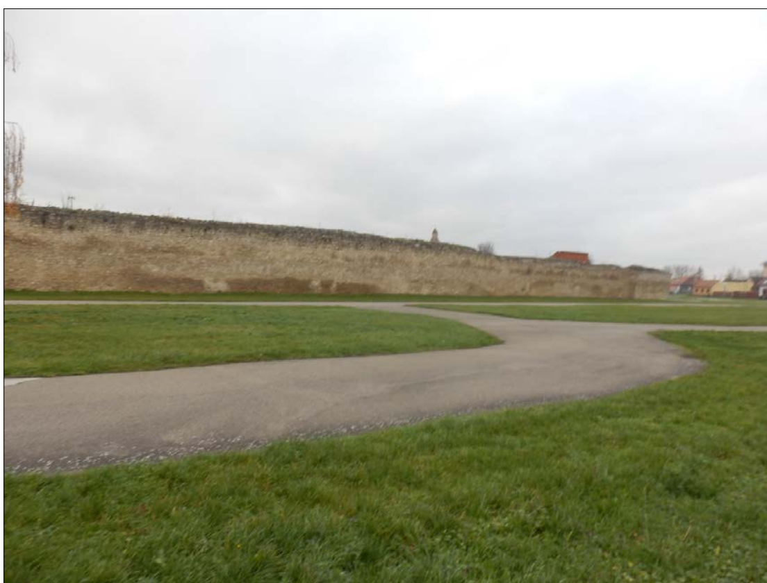
Obr.35: Mýtne ulica, Línia exteriérových chránených pohľadov, úsek III.