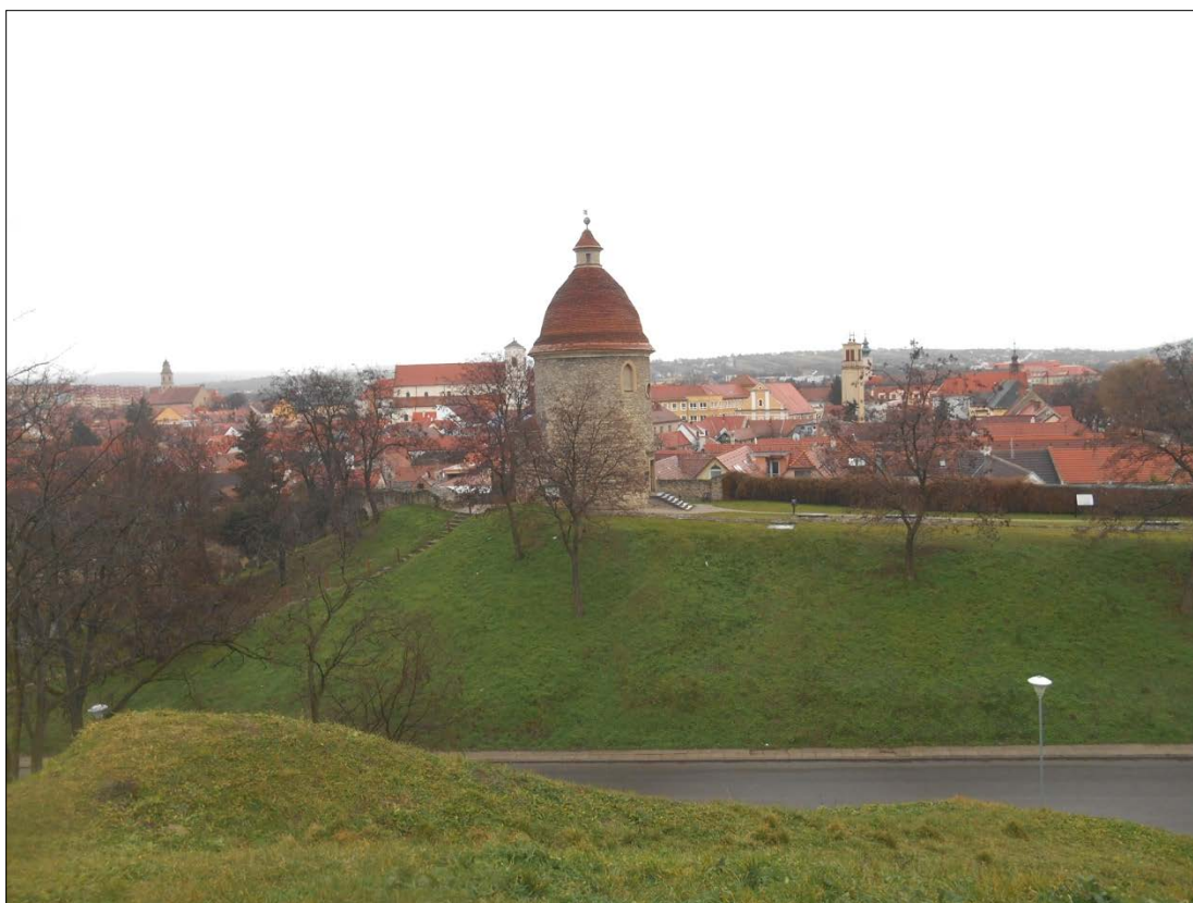
Obr.4 : Pohľad z Kalvárie na rotundu s mestským opevnením, Línia exteriérových chránených pohľadov, úsek I.