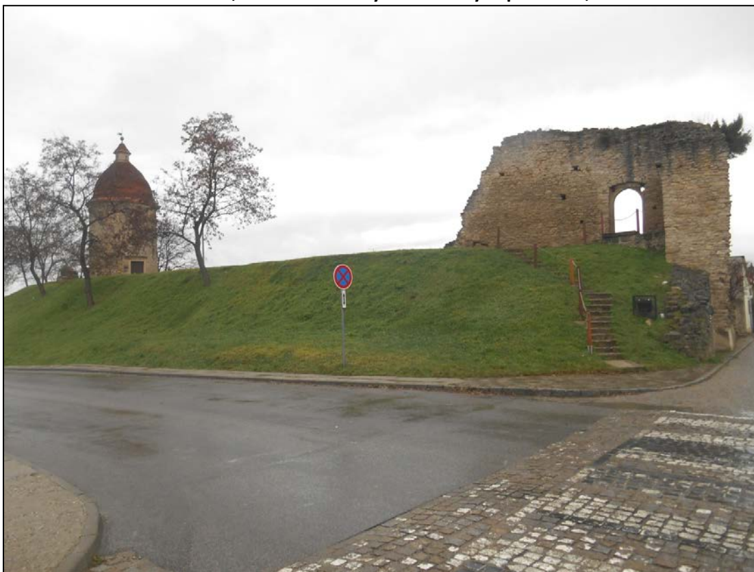
Obr.13: ulica Pod Kalváriou, Lína exteriérových chránených pohľadov, úsek I.