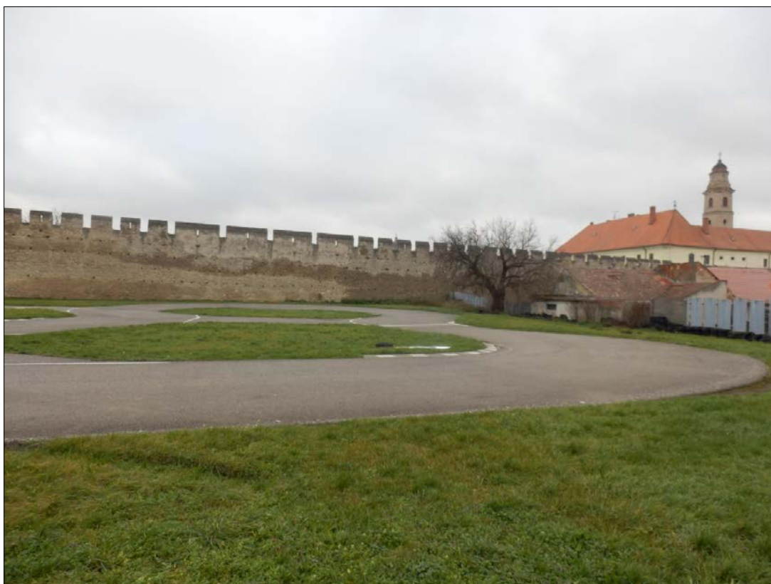
Obr.29 : Mýtna ulica, Línia exteriérových chránených pohľadov, úsek III.