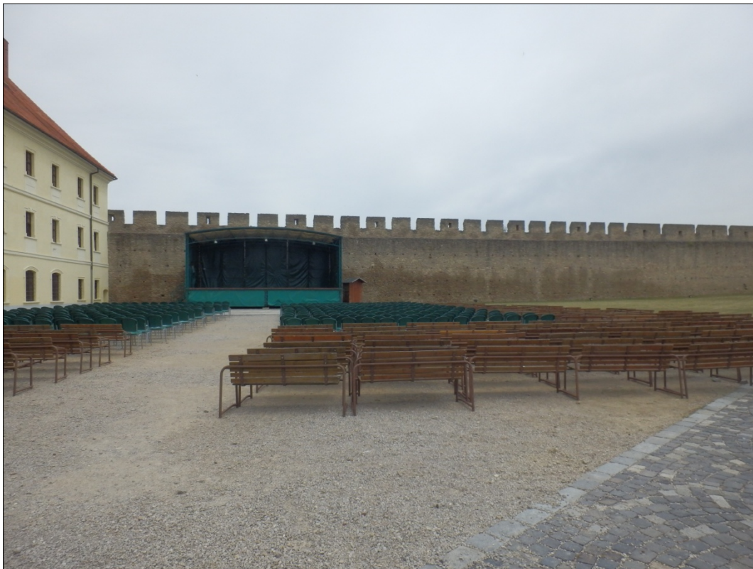
Obr.38: Hradba opevnenia zo strany Františkánskej záhrady a pri kláštore Františkánov na Kráľovskej ulici, Chránený pohľad z interiéru PZ, úsek III.