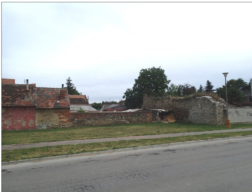
Obr.41 : Hurbanova /Boorova ul., Chránený pohľad z interiéru PZ, úsek IV. (dlhší úsek múru)

Úsek IV.: Je situovaný v južnej časti opevnenia pri juhovýchodnom nároží (zaniknutom). Úsek tvoria dve časti múru. Dlhší múr hradby sa nachádza paralelne s Boorovou ulicou (medzi Hollého a Hurbanovu ul.). Menší úsek múru tvorí torzo kolmé na Boorovu (pri Boorova 1).