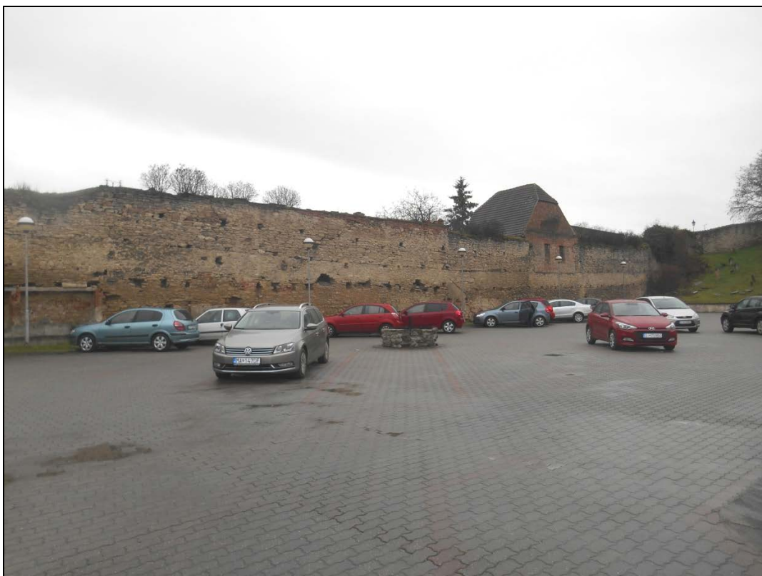
Obr.18: ulica Pod Kalváriou, Lína exteriérových chránených pohľadov, úsek I.

Úsek II.: Úsek je tvorený časťou medzi severným nárožím opevnenia a prerušením na mieste zaniknutej strážnickej brány – po Kráľovskú ulicu.