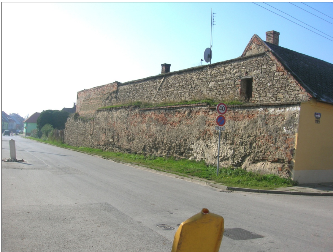
Obr.44 : Hollého ulica, pohľad na hradbu pri Boorovej 1, chránený exteriérový pohľad, úsek IV. (menší úsek múru)

Úsek V.: Úsek je tvorený torzom hradby situovanom na nezastavaných parcelách v areáli nemocnice. areál Fakultnej nemocnice v Skalici s poliklinikou