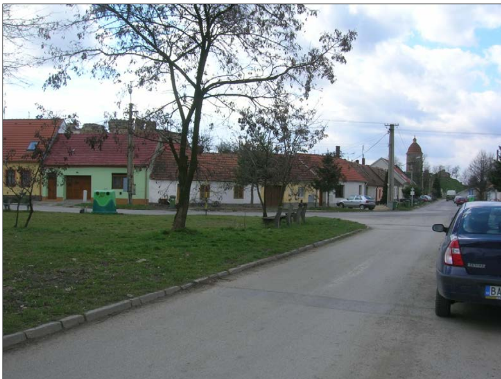
Obr.19: ul. Pod Kalváriou/Vally, severný úsek hradieb s cimburím, Chránený exteriérový pohľad, úsek II.

Úsek II.: Úsek je tvorený časťou medzi severným nárožím opevnenia a prerušením na mieste zaniknutej strážnickej brány – po Kráľovskú ulicu.