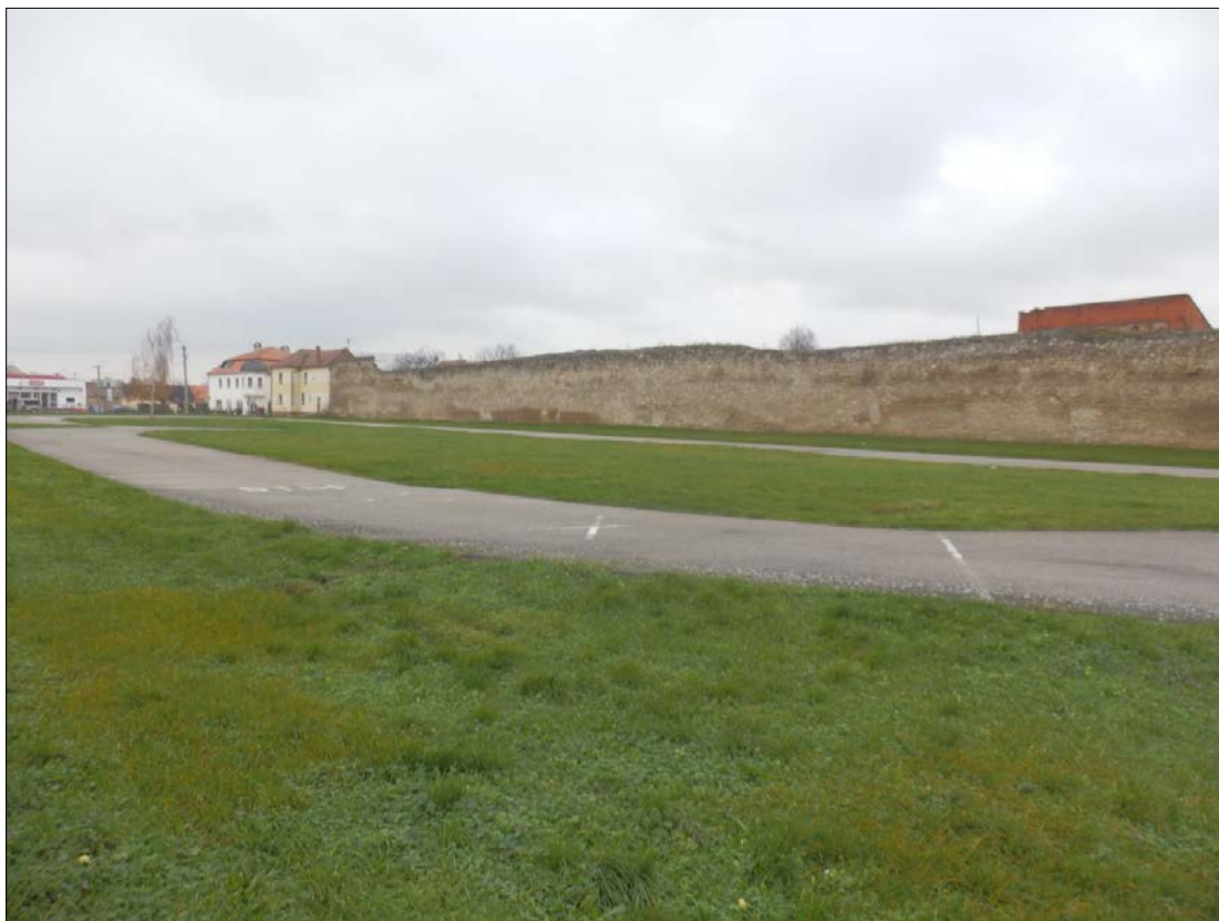
Obr.33 : Mýtna ulica, Lína exteriérových chránených pohľadov, úsek III.