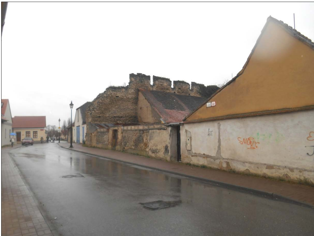
Obr.21: ulica Pod Kalváriou/Vally, priehľad do Blahovej ul., Chránený exteriérový pohľad, úsek II., (severný úsek opevnenia)