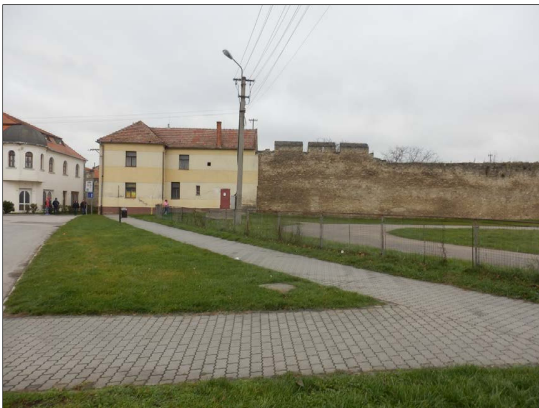
Obr.36: Mýtna ulica, hradba pri bývalom mlyne a vyústení Potočnej ulice na Predmestie, Línia exteriérových chránených pohľadov, úsek III.