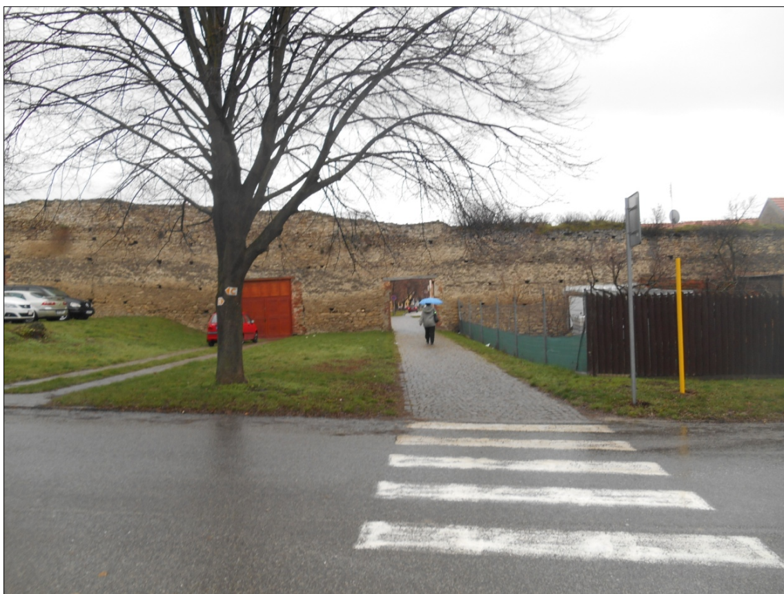
Obr.10 : ulica Pod Kalváriou, Línia exteriérových chránených pohľadov , úsek I.