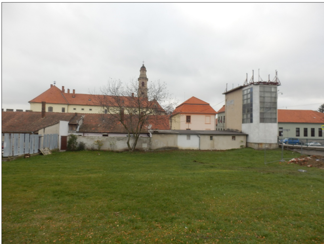
Obr.27 : Mýtna ulica, Línia exteriérových chránených pohľadov, úsek III.