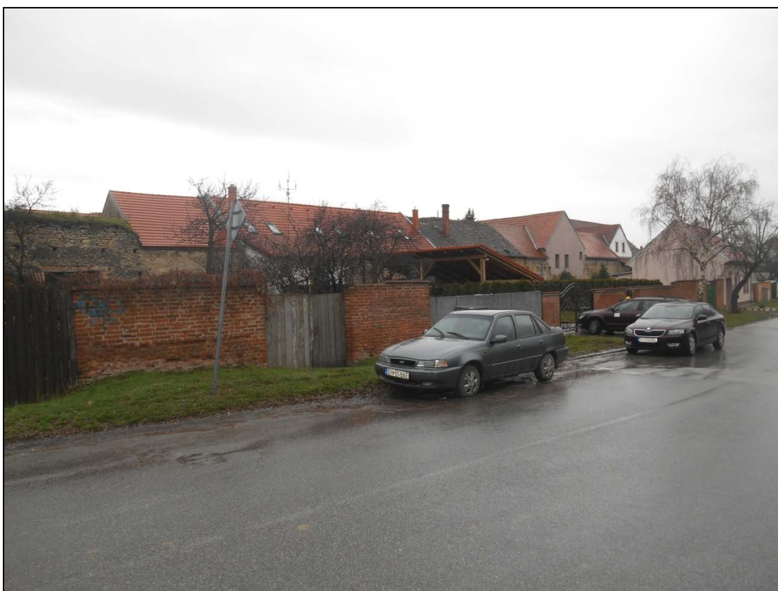
Obr.9 : ulica Pod Kalváriou, Línia exteriérových chránených pohľadov, úsek I.