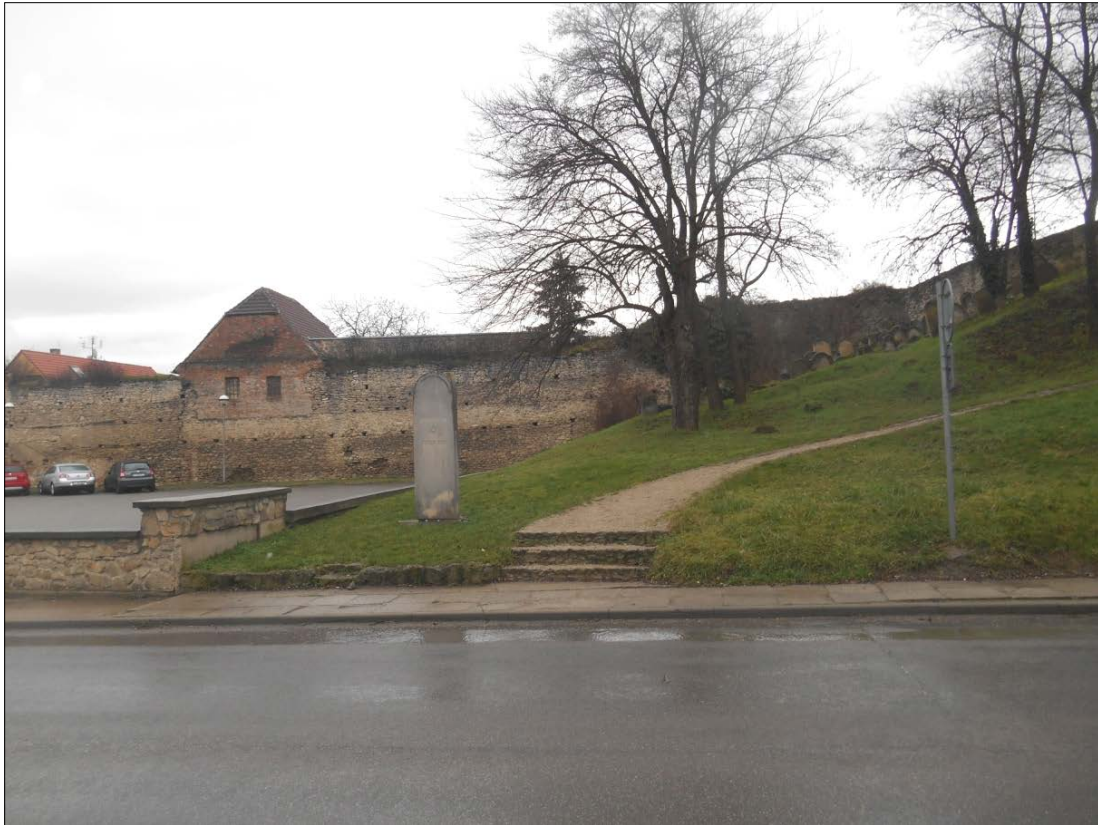
Obr.16: ulica Pod Kalváriou, Línia exteriérových chránených pohľadov, úsek I.