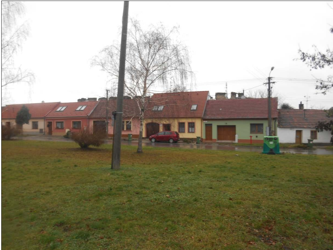
Obr.20 : ul. Pod Kalváriou/Vally, severný úsek hradieb s cimburím, Chránený exteriérový pohľad, úsek II.