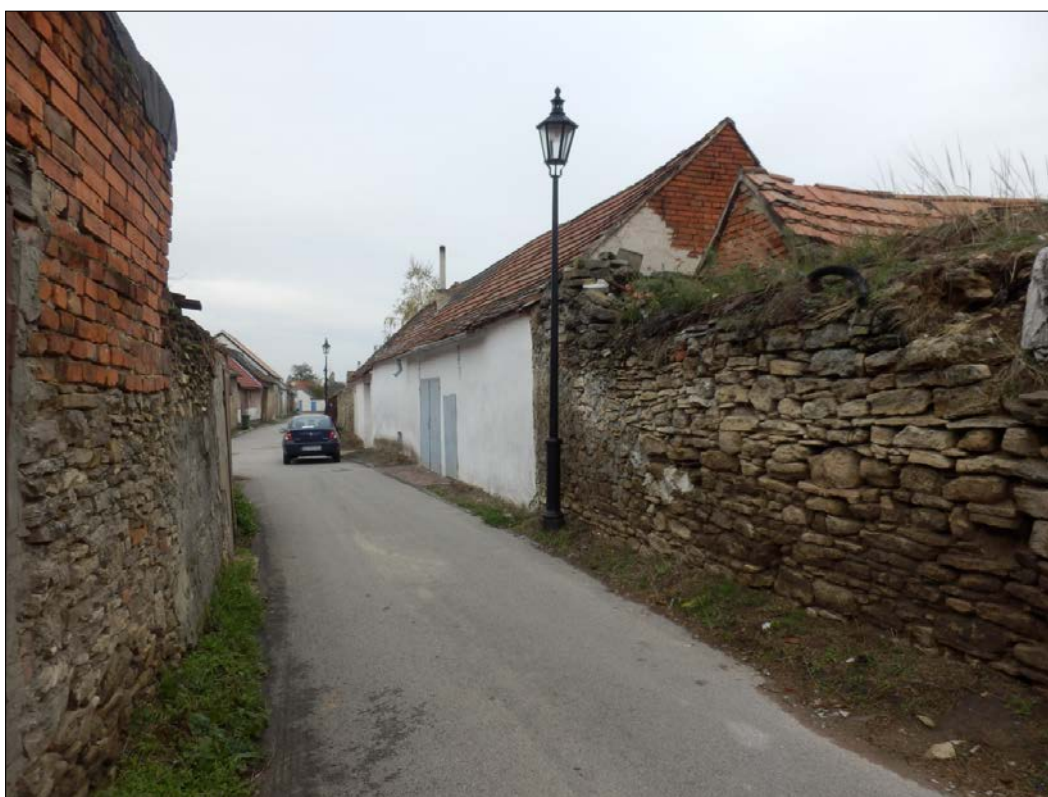
Obr.23 : Hradba na ulici Za mestskou zd'ou, pri Družstevnej ul. , Chránený pohľad z interiéru PZ, úsek II.