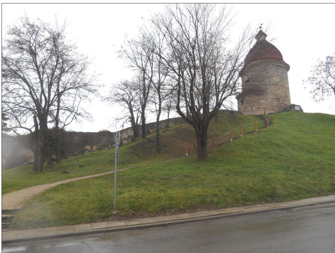
Obr.15: ulica Pod Kalváriou, Línia exteriérových chránených pohľadov, úsek I.