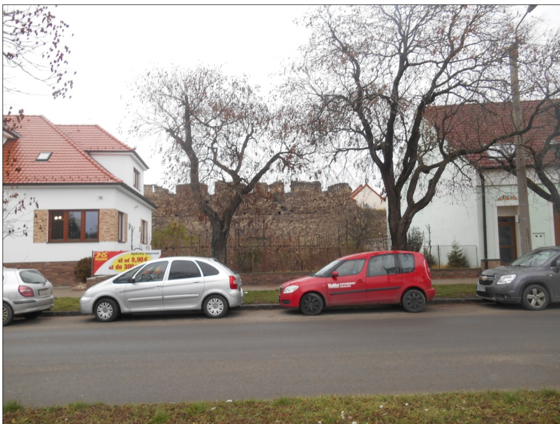
Obr.50 : ulica Pplk.Pljušťa, chránený pohľad na hradbu s cimburím z exteriéru PZ, úsek VI.