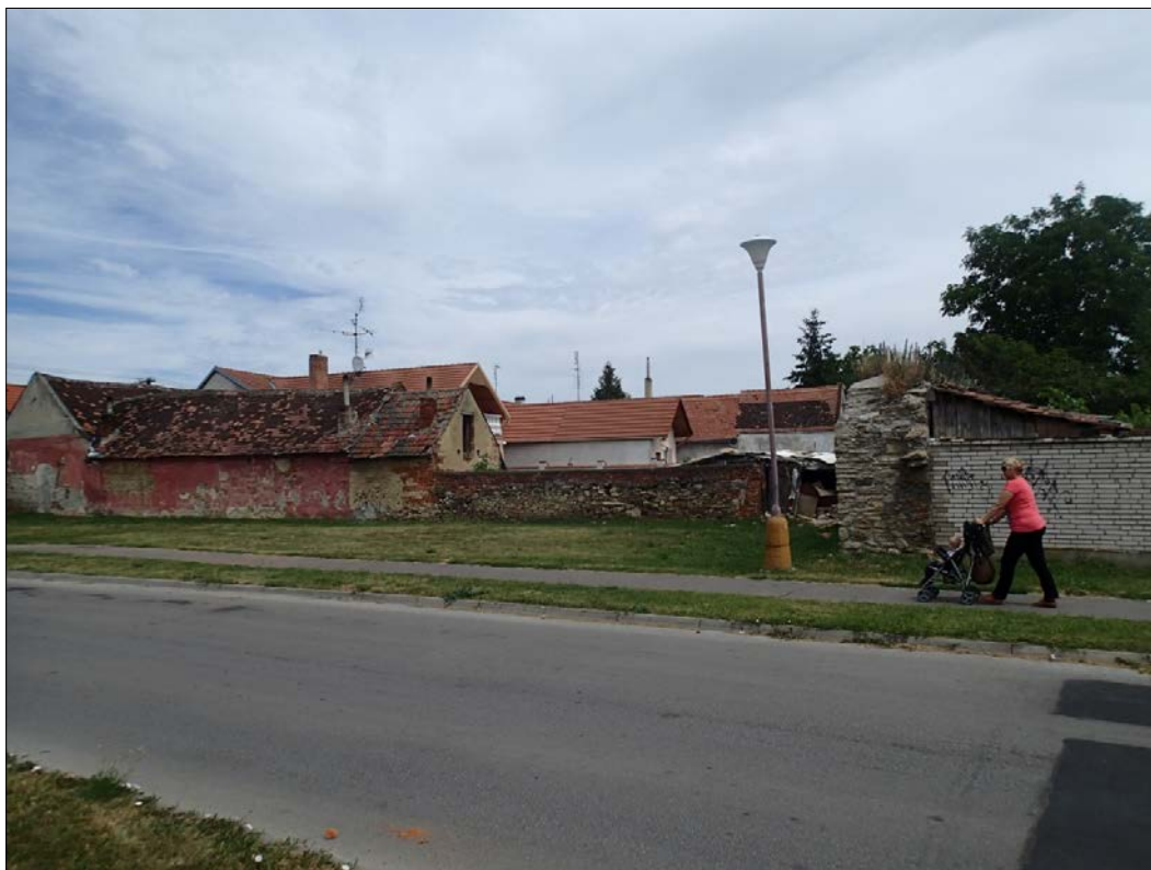
Obr. 42 : Hurbanova ulica, Chránený exteriérový pohľad, úsek IV., (dlhší múr)