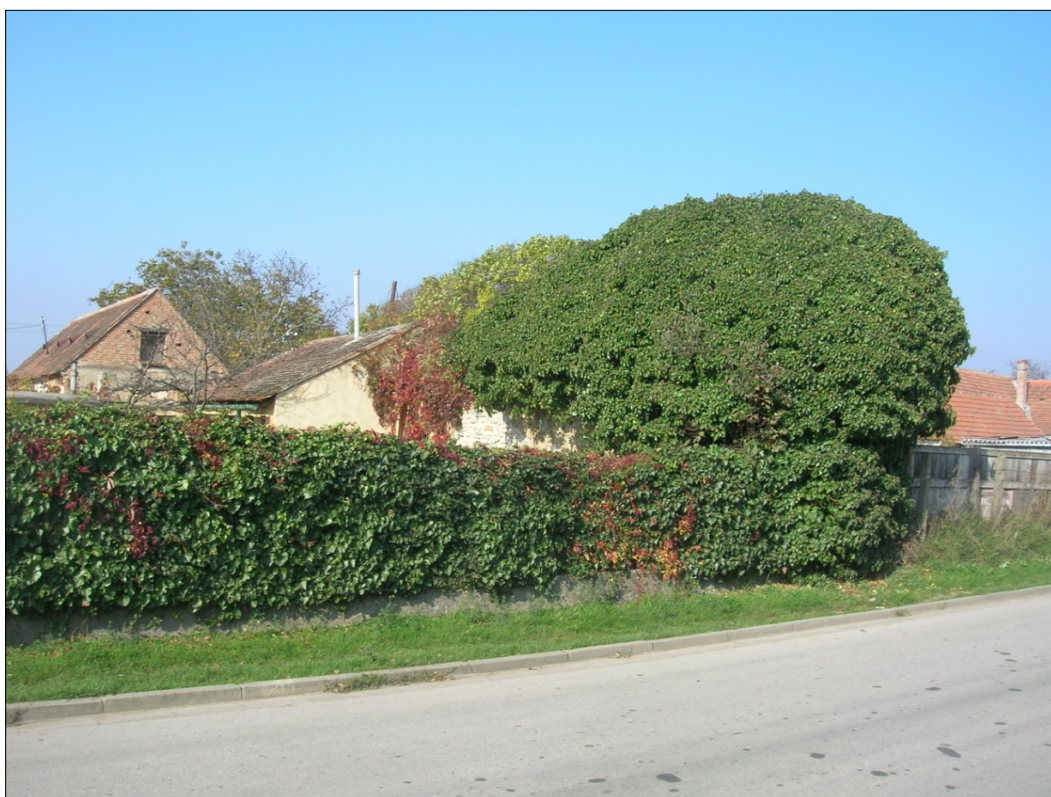
Obr.43 : Hollého ulica, pohľad na hradbu medzi Boorovou a Pod záhradkami, Chránený exteriérový pohľad, úsek IV., (dlhší múr)