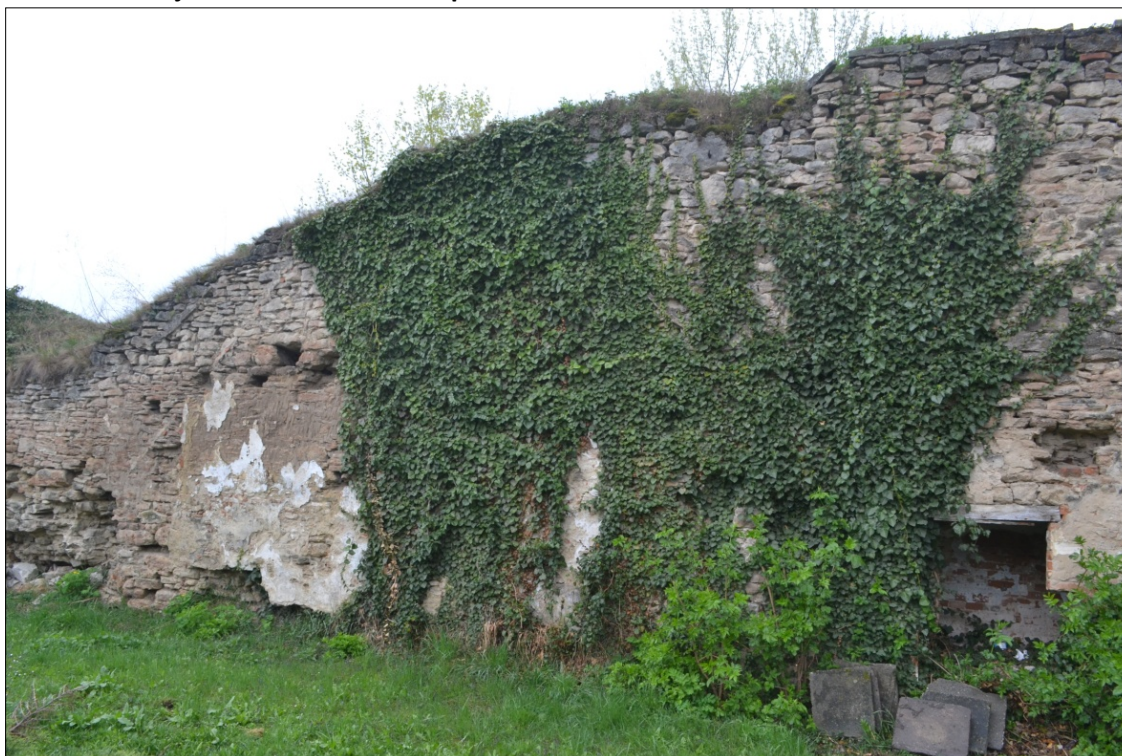
Obr.45 : Hradba v areáli nemocnice, chránený pohľad z interiéru PZ, úsek V.

Úsek V.: Úsek je tvorený torzom hradby situovanom na nezastavaných parcelách v areáli nemocnice. areál Fakultnej nemocnice v Skalici s poliklinikou