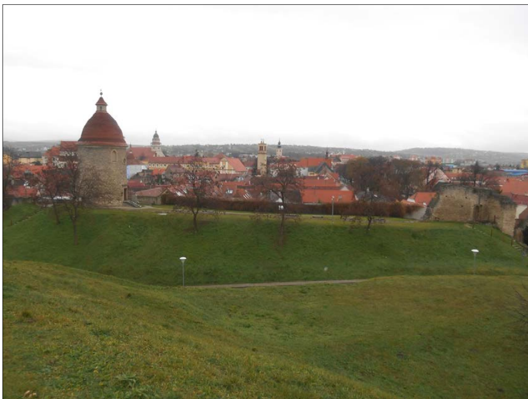
Obr.5 : Pohľad z Kalvárie na rotundu s opevnením a severnou bránou, Línia exteriérových chránených pohľadov, úsek I.