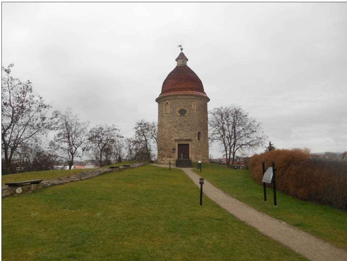
Obr.1 : Rotunda sv.Juraja s opevnením, chránený pohľad z interiéru PZ, úsek I.

Úsek I. : Úsek je tvorený severozápadným priebehom hradby rovnobežným s ulicou Pod Kalváriou.