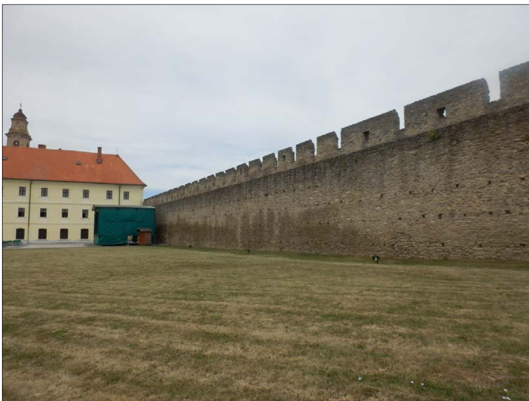
Obr.39: Hradba opevnenia zo strany Františkánskej záhrady a pri kláštore Františkánov na Kráľovskej ulici, Chránený pohľad z interiéru PZ, úsek III.