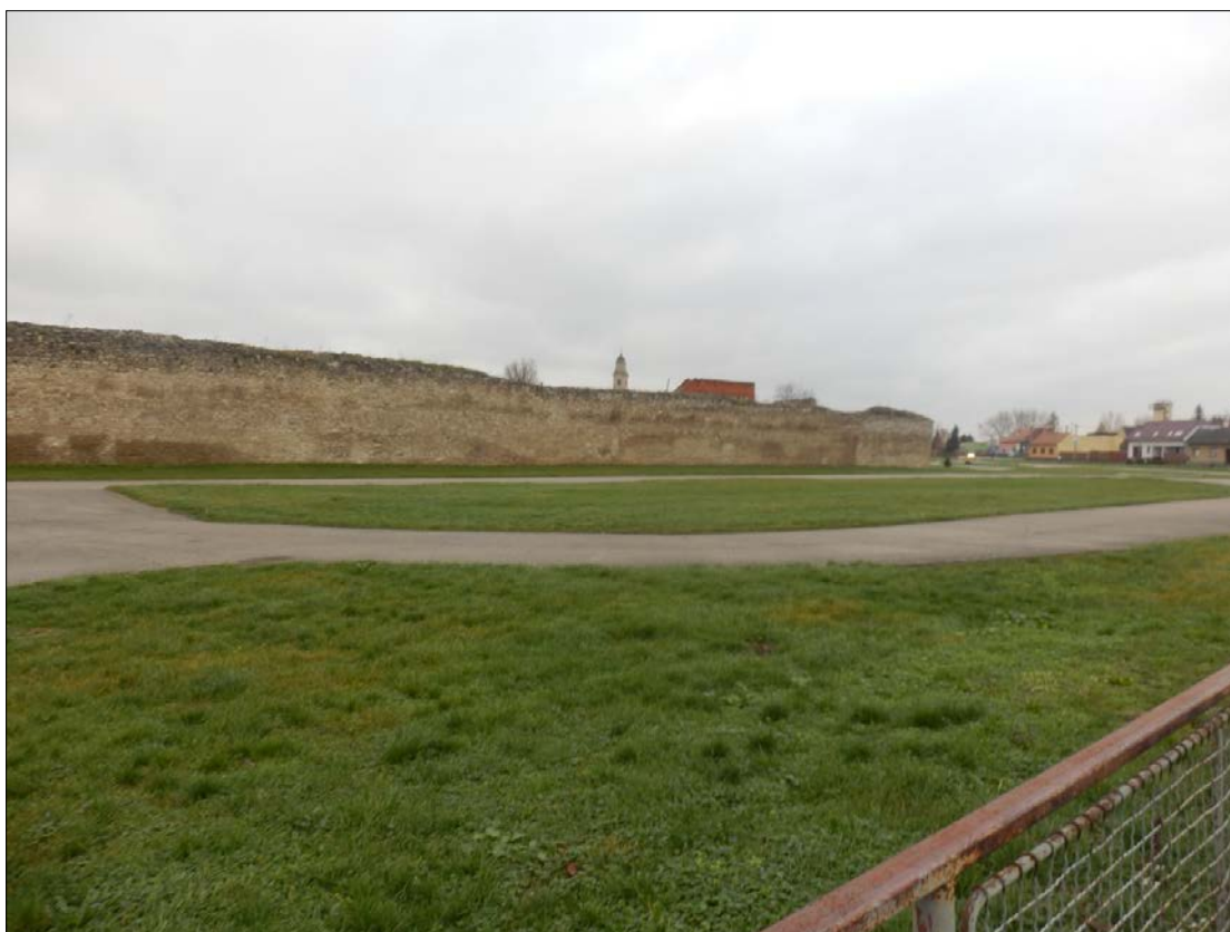
Obr.34: Mýtne ulica, Línia exteriérových chránených pohľadov, úsek III.