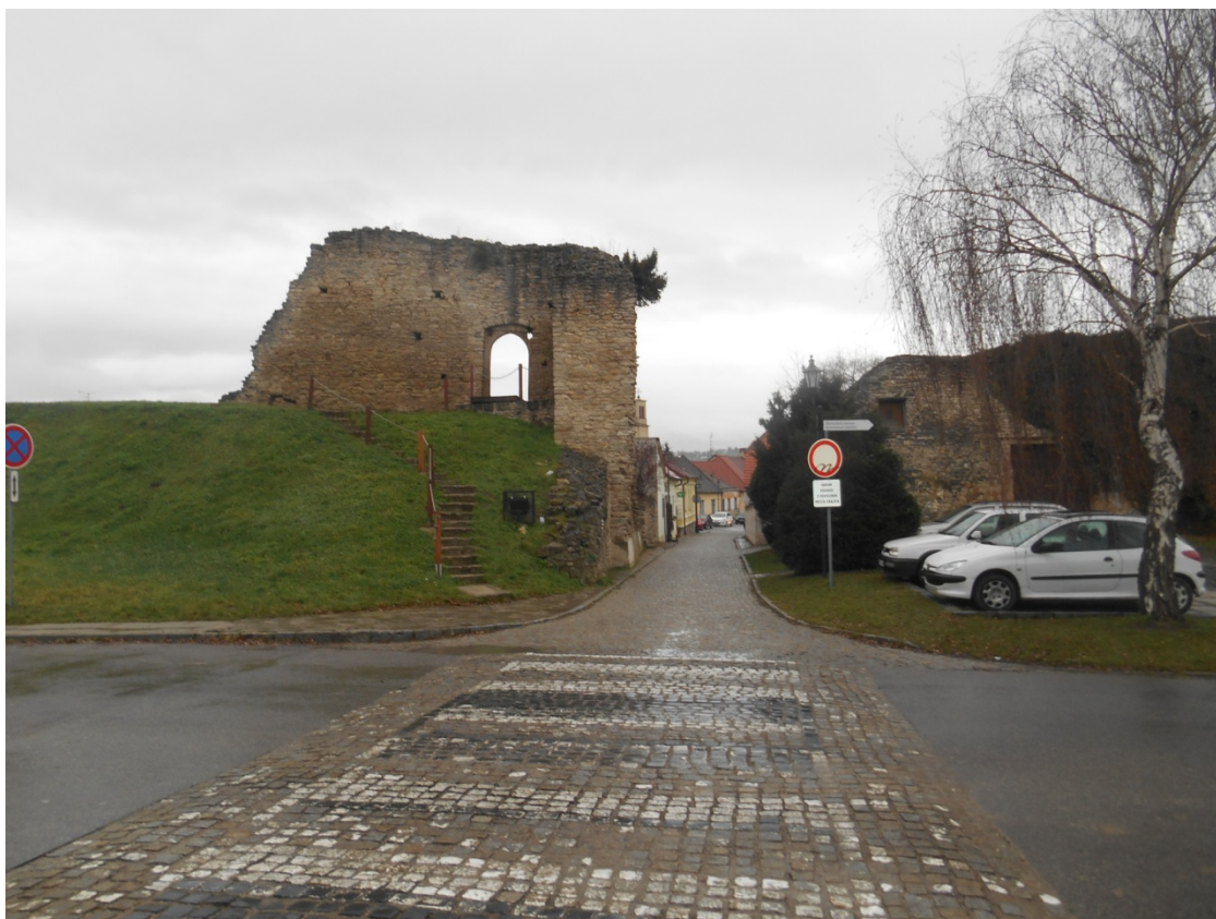
Obr.12 : ulica Pod Kalváriou, Lína exteriérových chránených pohľadov, úsek I.