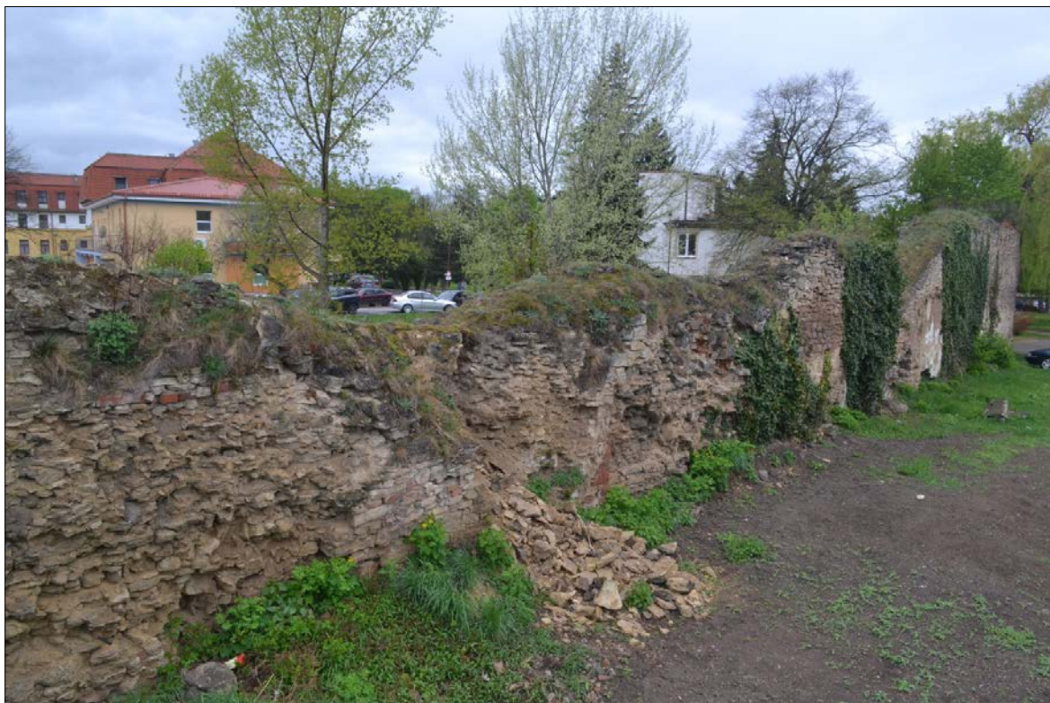
Obr.46 : hradba v areáli nemocnice, chránený pohľad z interiéru PZ, úsek V.