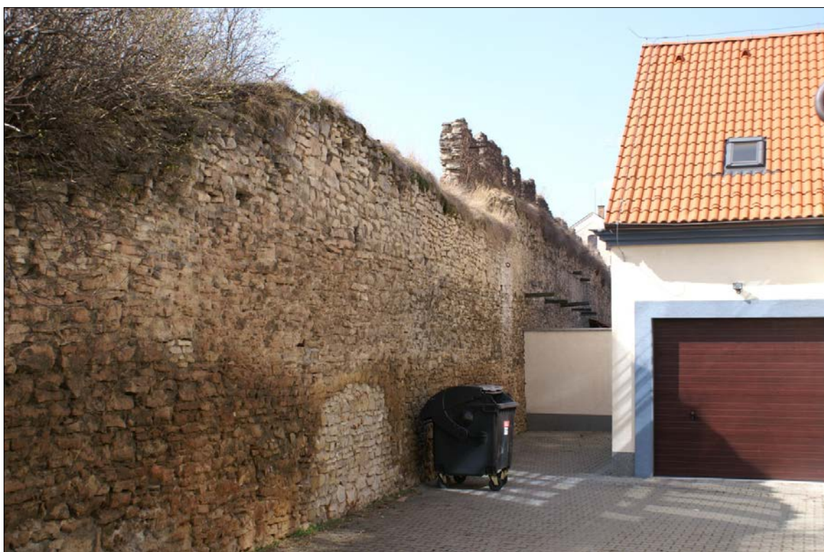
Obr.53 : Pivovarská ul., hradba pri mestskej tržnici, chránený pohľad z interiéru PZ, úsek VI.