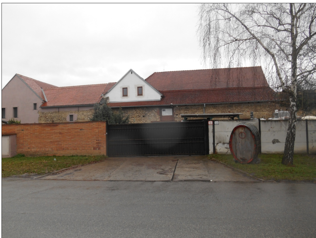
Obr.7: ulica Pod Kalváriou, Lína exteriérových chránených pohľadov , úsek I.