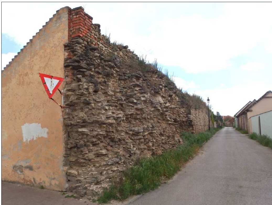
Obr.22 : Hradba na ulici Za mestskou zd'ou, pohľad od Blahovej, Chránený pohľad z interiéru PZ, úsek II.