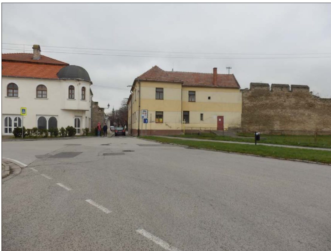
Obr.37: Mýtna ulica, vyústenie Potočnej ulice na Predmestie, Línia exteriérových chránených pohľadov, úsek III.