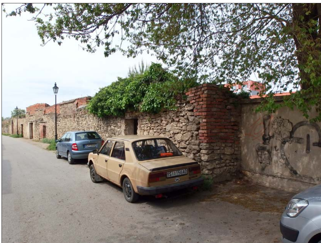
Obr.25 : ulica Za Mestskou zd'ou (od Kráľovskej), Chránený pohľad z interiéru PZ, úsek II.