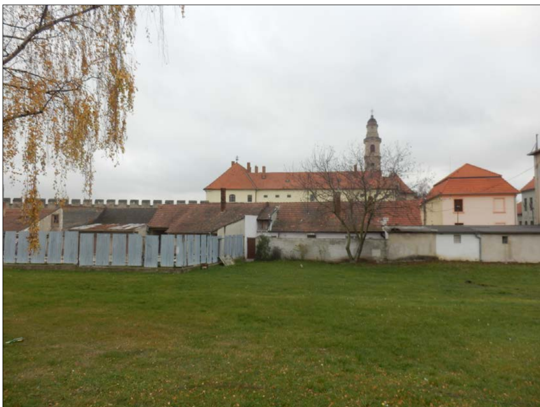
Obr.28 : Mýtna ulica, Línia exteriérových chránených pohľadov, úsek III.