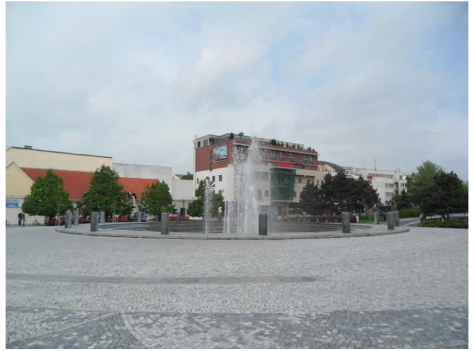
7. Fontána, Svätoplukovo námestie.