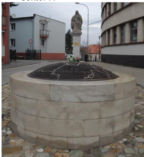
1. Studňa s mrežou na Vřšku, Mariánska ulica.