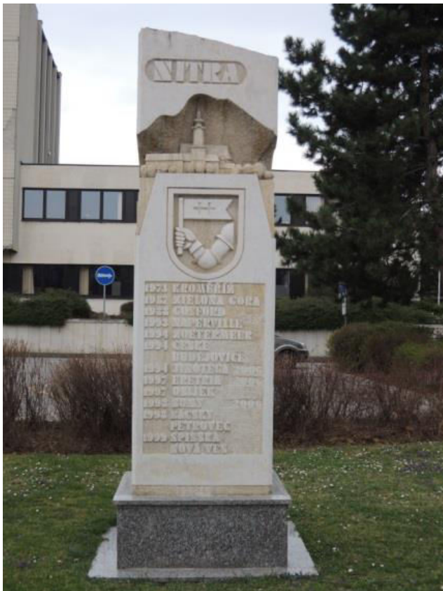
11. Stĺp partnerských miest, Štefánikova trieda