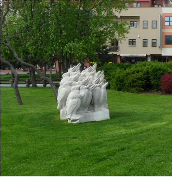
6. Sochárska kompozícia PROTEST /prežijú rok 200?/ - „Snem vtákov“, Svätoplukovo námestie.