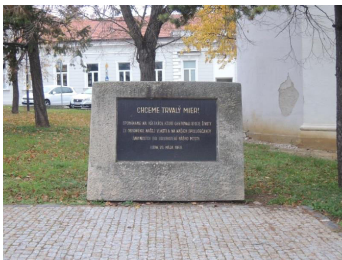
5. Pamätník k oslobodeniu mesta Nitra na Vřšku.