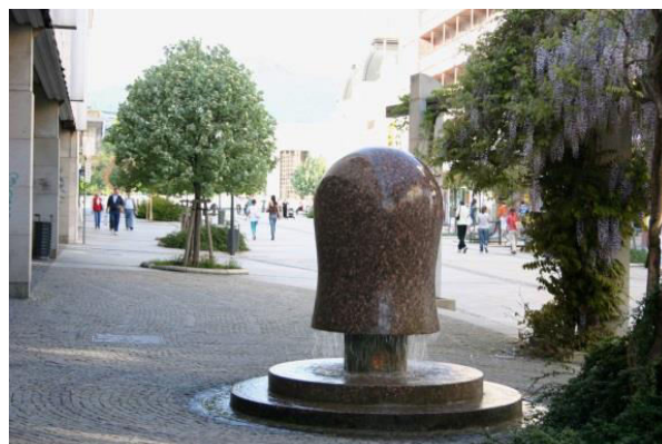
4. Drobná architektúra pešej zóny s námietmi z obdobia Veľkej Moravy (fontána)