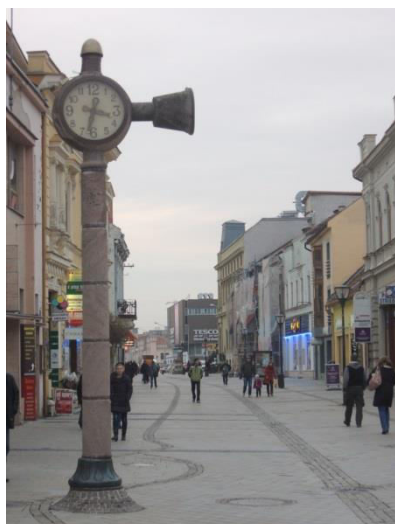
3. Drobná architektúra pešej zóny s námietmi z obdobia Veľkej Moravy (hodiny).