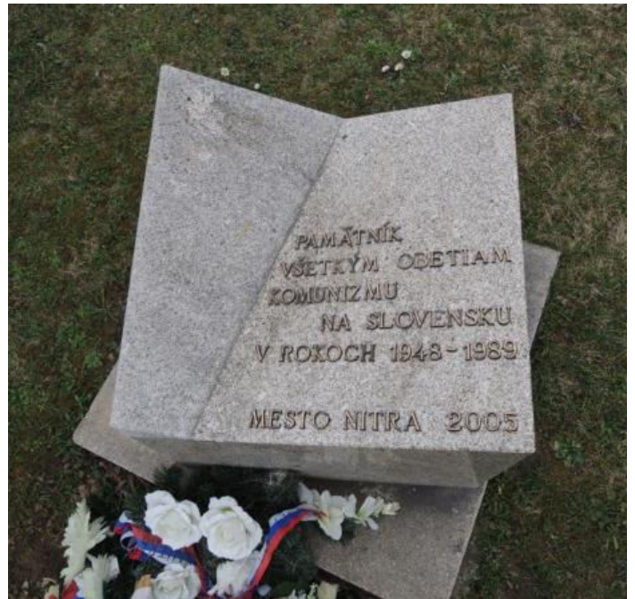
12. Pamätník obetiam komunizmu, Štefánikova trieda