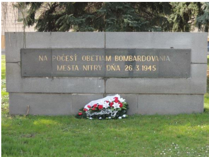
13. Pamätník obetiam bombardovania, Štúrova