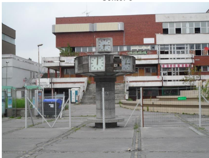
9., 10. Hodiny na stĺpe, Štefánikova trieda pri bývalej budove kina Orbis, vpravo fontána