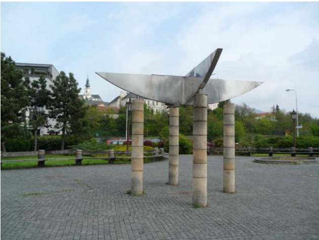
8. Objekt štvorstĺpia ako súčasť parkovej úpravy pred divadlom Andreja Bagara, Svätoplukovo námestie