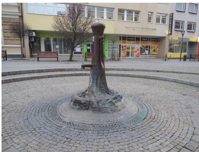
2. Drobná architektúra pešej zóny s námietmi z obdobia Veľkej Moravy (studňa).