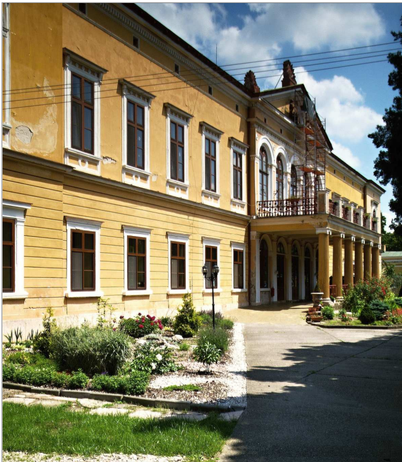
3. Kaštieľ, hlavné priečelie. Stav: 8. 6. 2010.