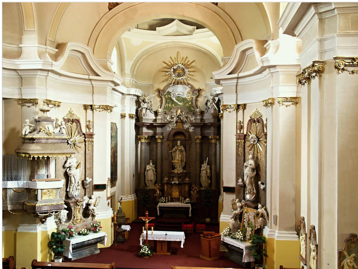
2. Kostol sv. Klimenta, interiér. Stav: 8. 6. 2010.