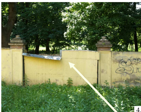
4. Záhradný portál na východnej strane parku, ktorým sa vstupuje do kostolného parku 5 Pešia komunikácia – na kompozičnej osi medzi kostolom a kaštieľom v tesnej blízkosti východnej brány areálu parku kaštieľa.