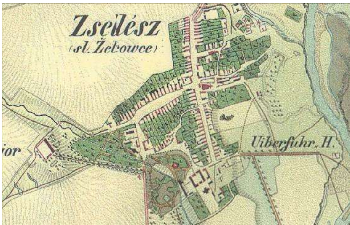
Zobrazenie obce Želiezovce na mape II. vojenského mapovania, 1842