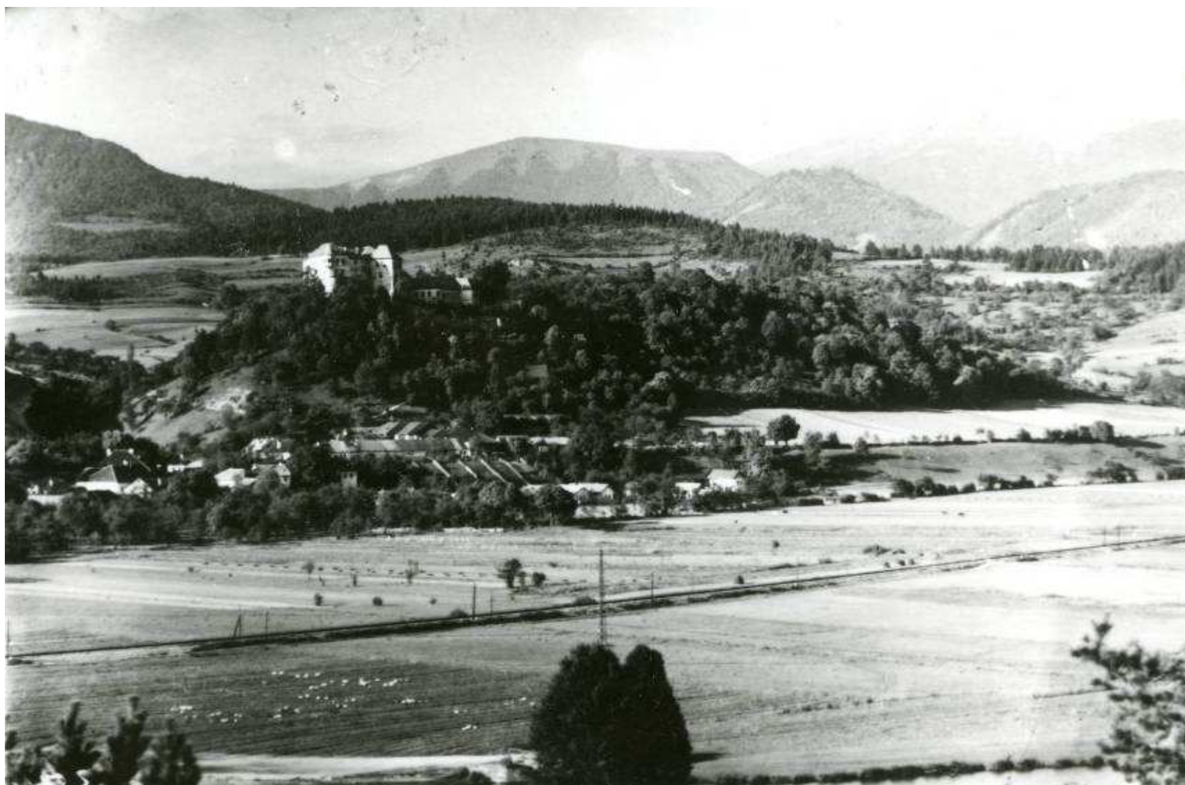
II. Panoráma Ľupčianskeho hradu v krajinnom prostredí Bystrického podolia. Snímka z obdobia po roku 1920