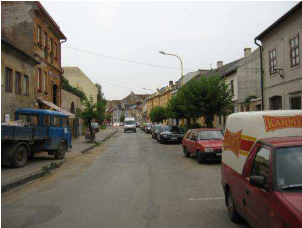
Pohl'ad č. 13