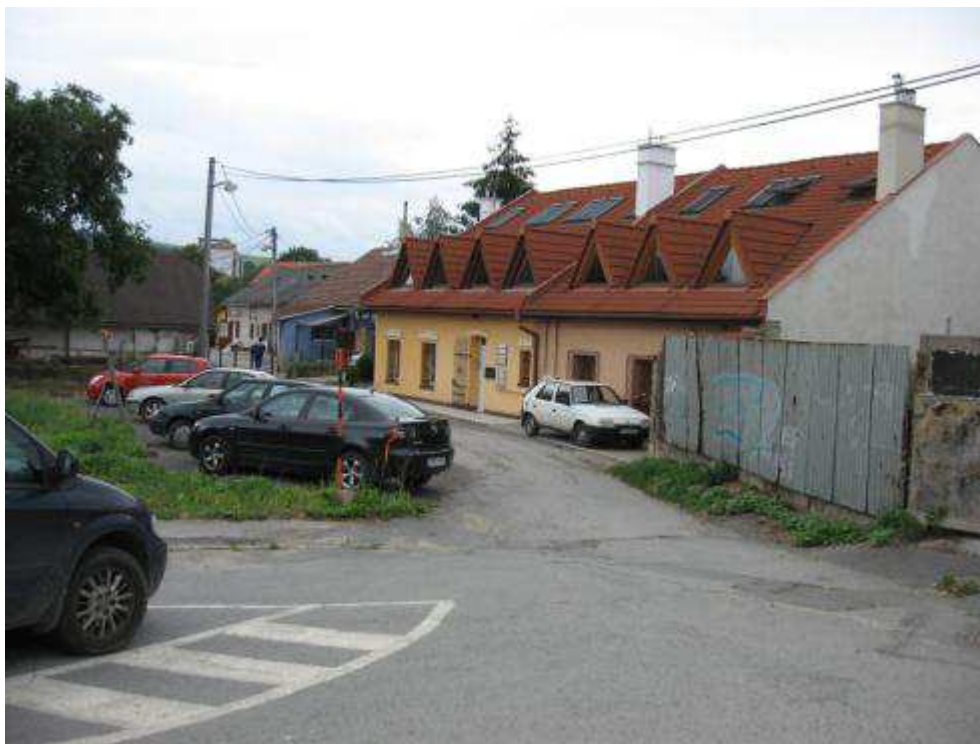
Pohľad č. 23