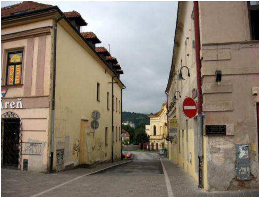
Pohľad č. 11