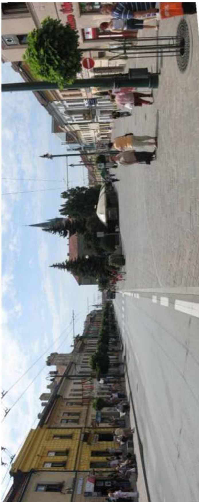
Pohľad č. 3