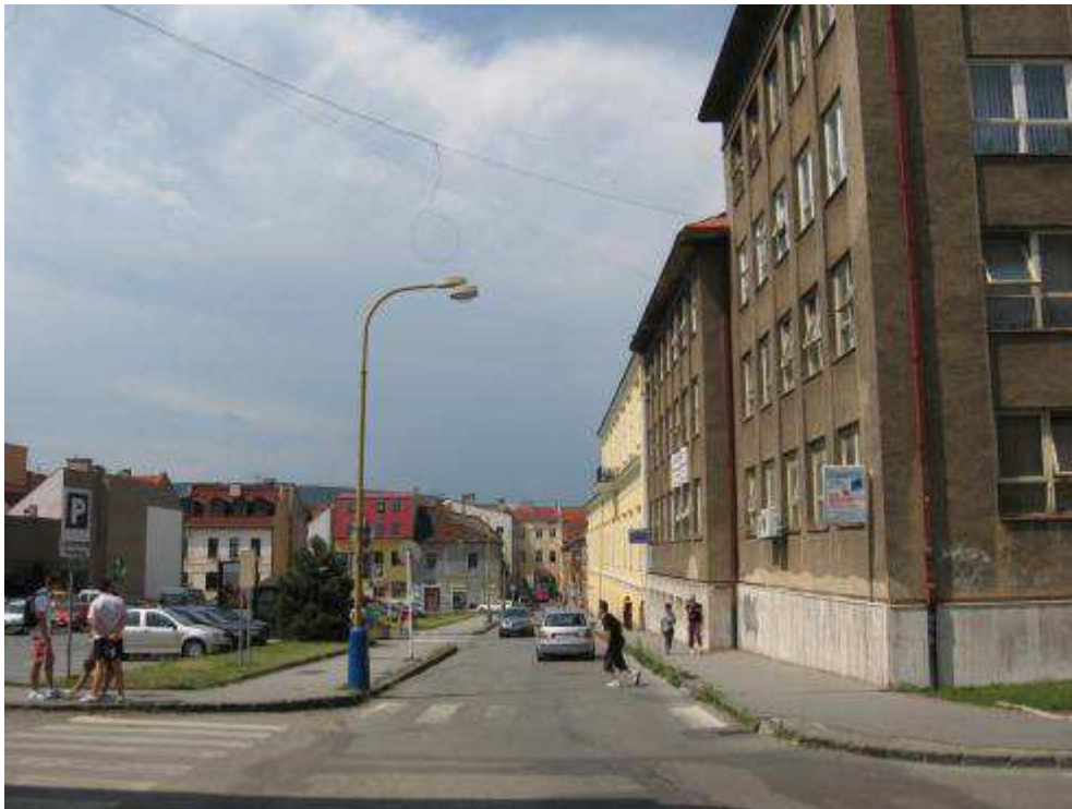
Pohľad č. 30