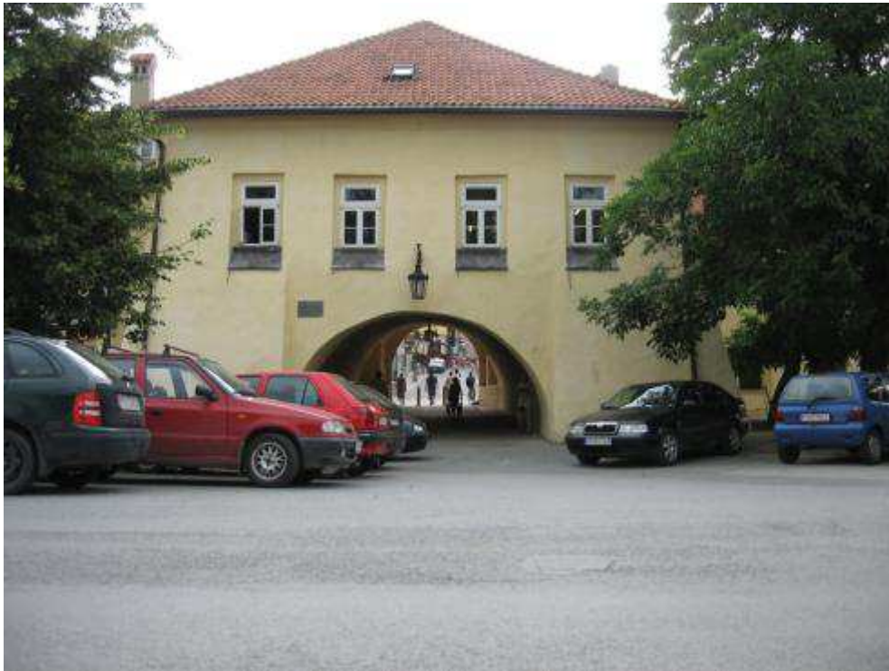
Pohľad č. 21