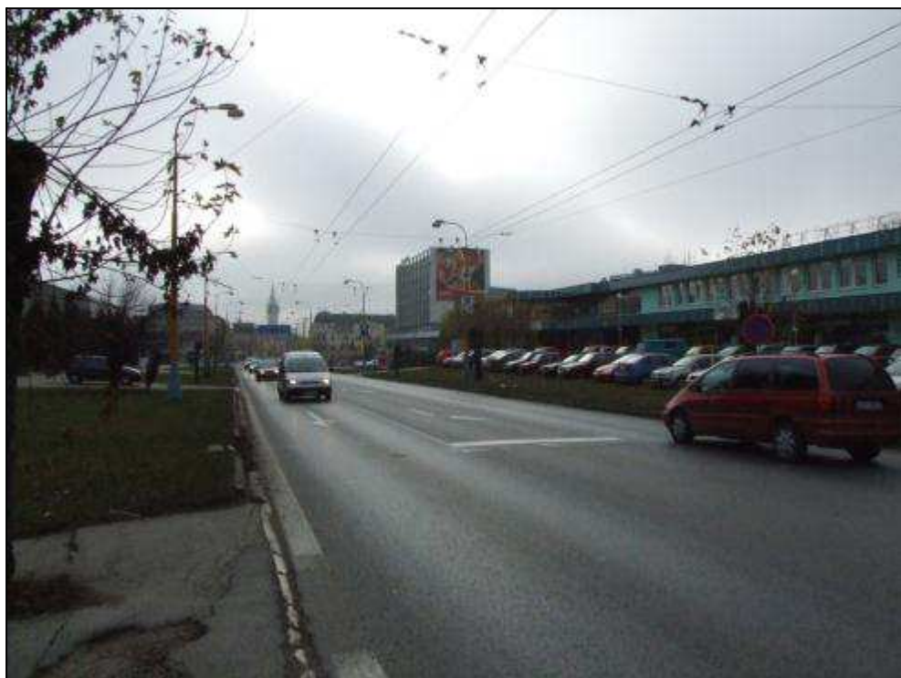
E - pohľad na mesto zo Sabinovskej ulice