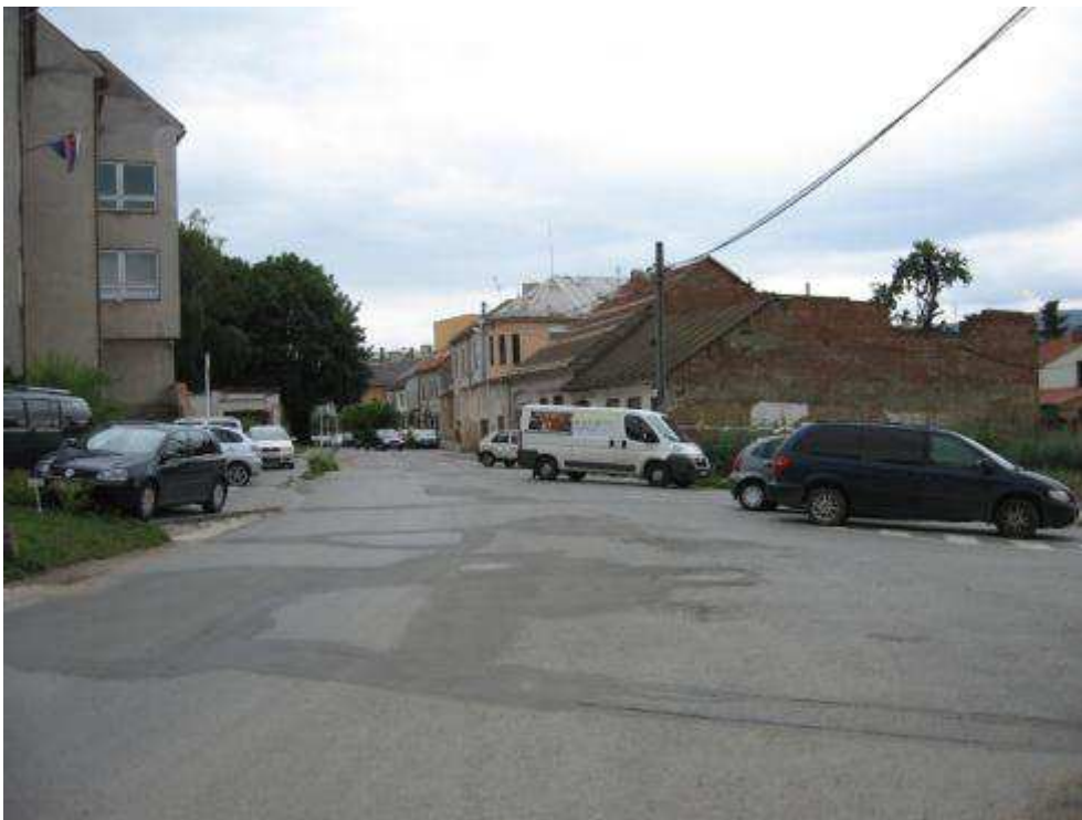
Pohľad č. 12