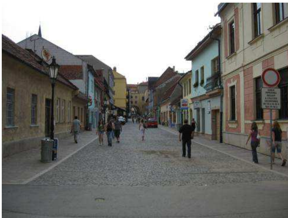
Pohľad č. 20