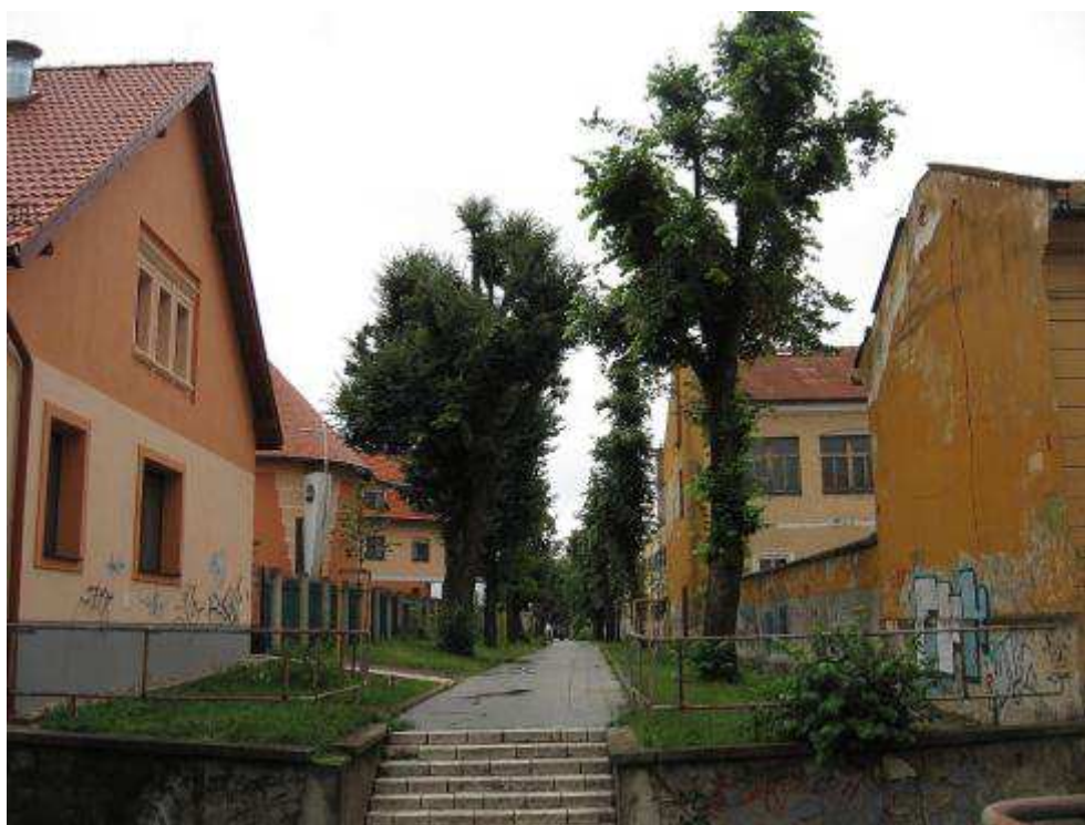
Pohľad č. 33