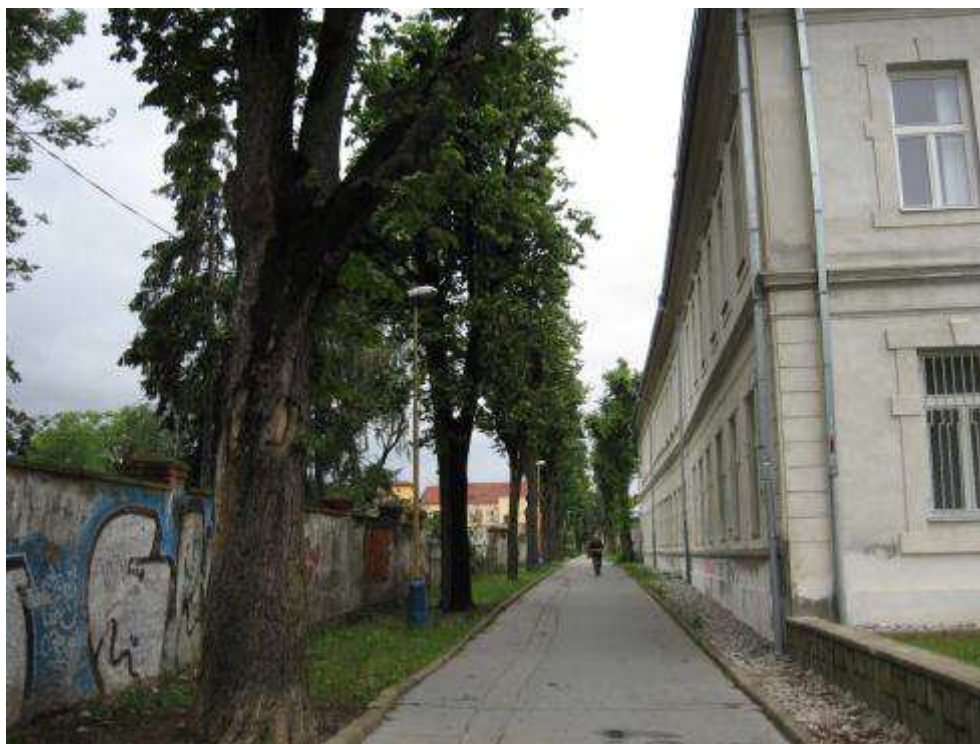
Pohľad č. 34