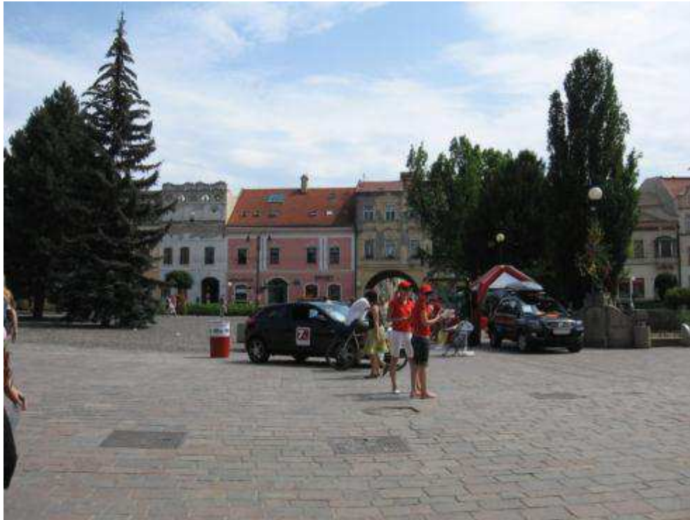
Pohľad č. 4