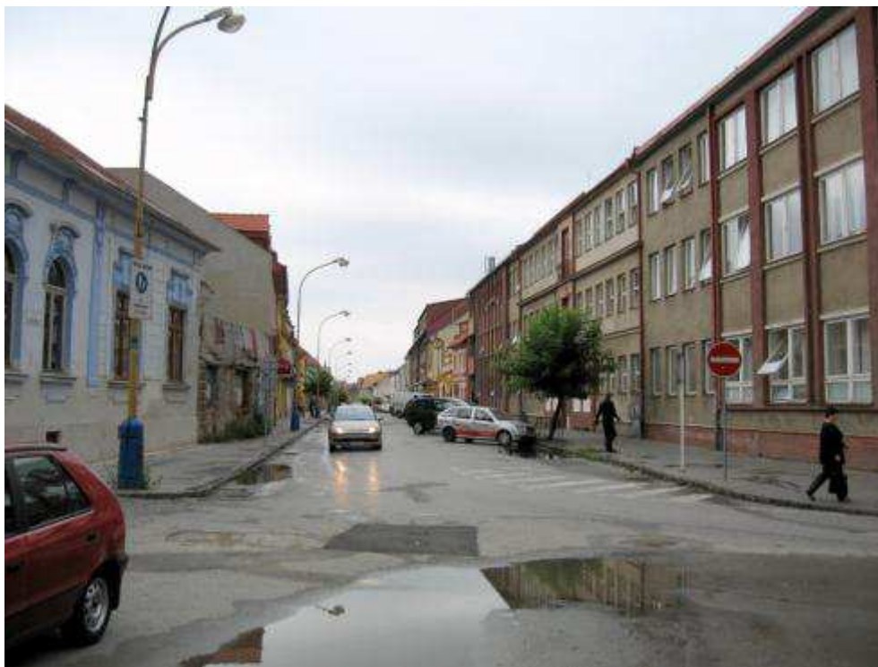
Pohl'ad č. 37