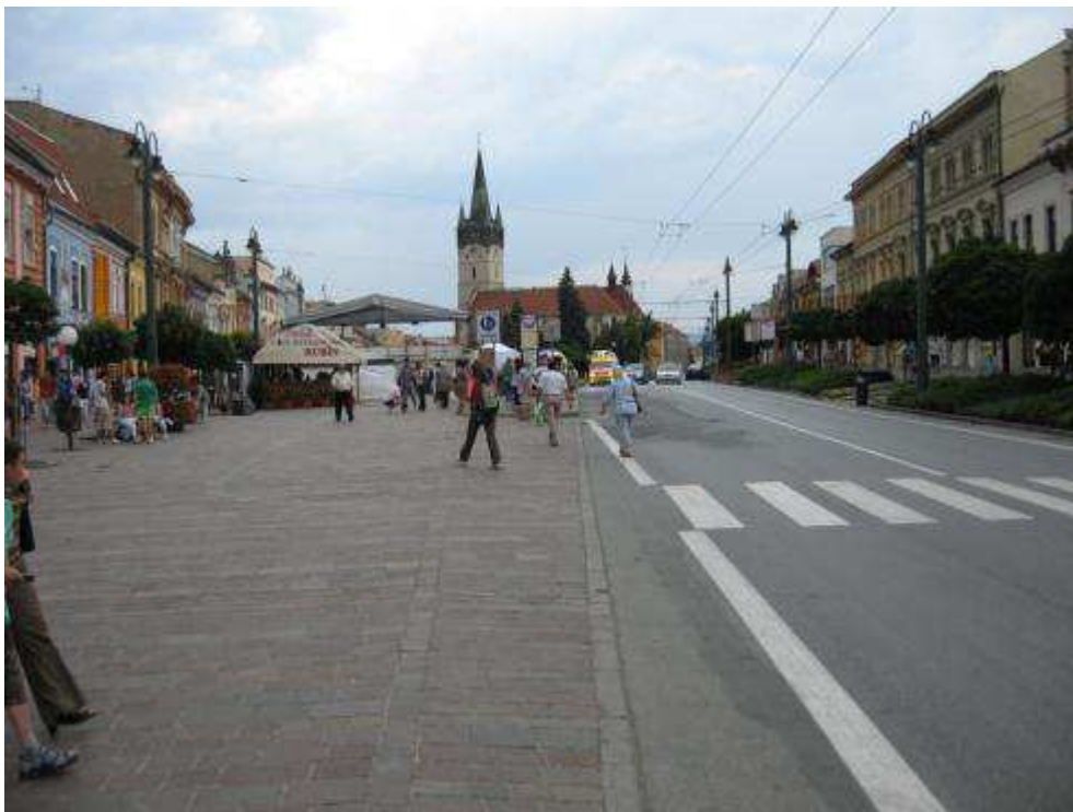
Pohľad č. 6