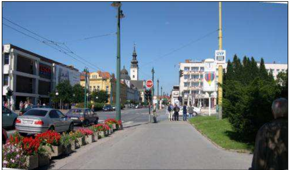
C - pohľad na vstup do mesta z Masarykovej ulice