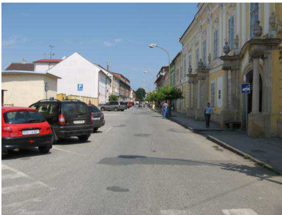
Pohľad č. 24