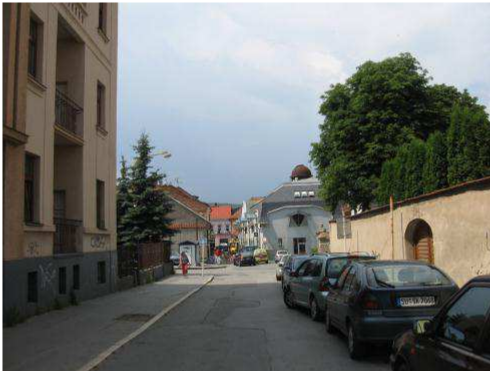
Pohľad č. 28