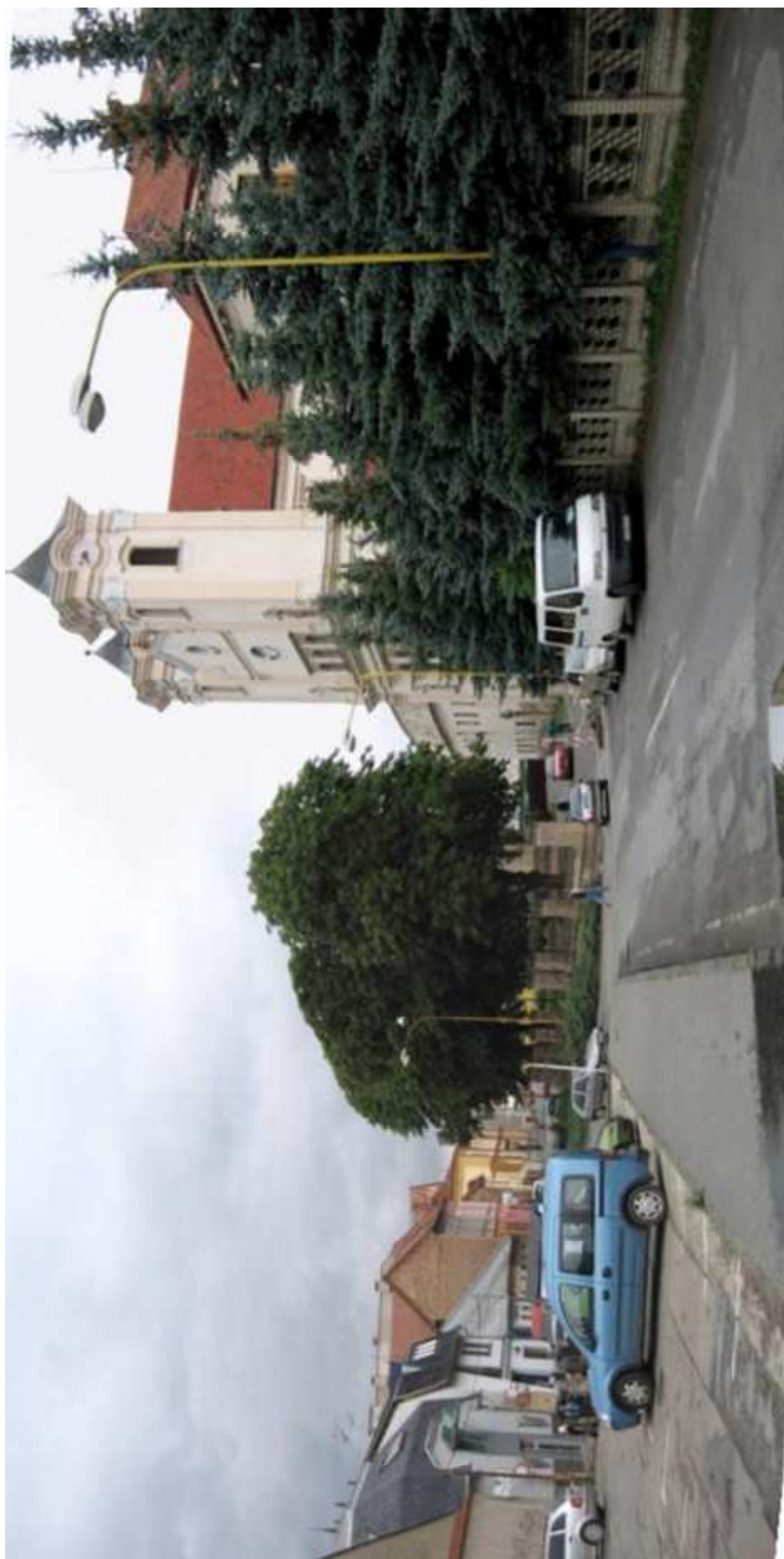
Pohľad č. 27