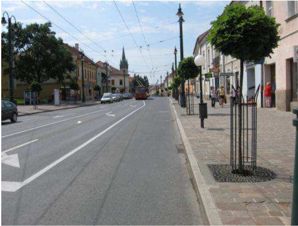
Pohľad č. 1