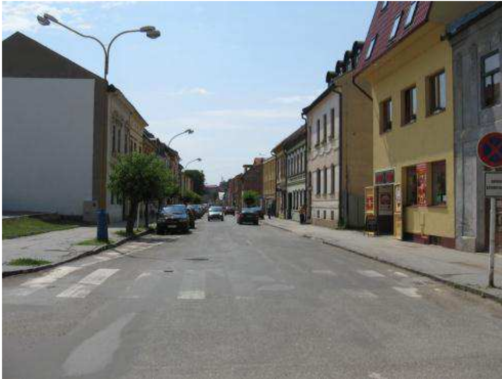
Pohľad č. 25