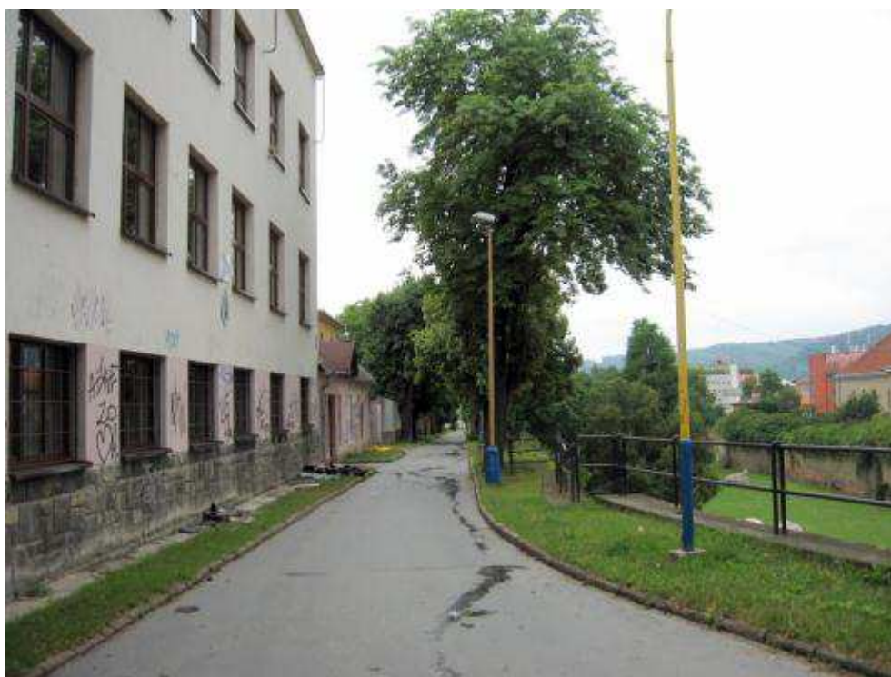
Pohľad č. 35