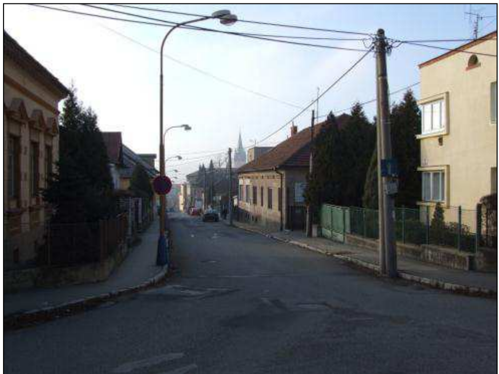
D - pohľad na mesto od vodárenskej veže