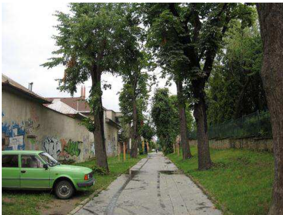
Pohľad č. 32