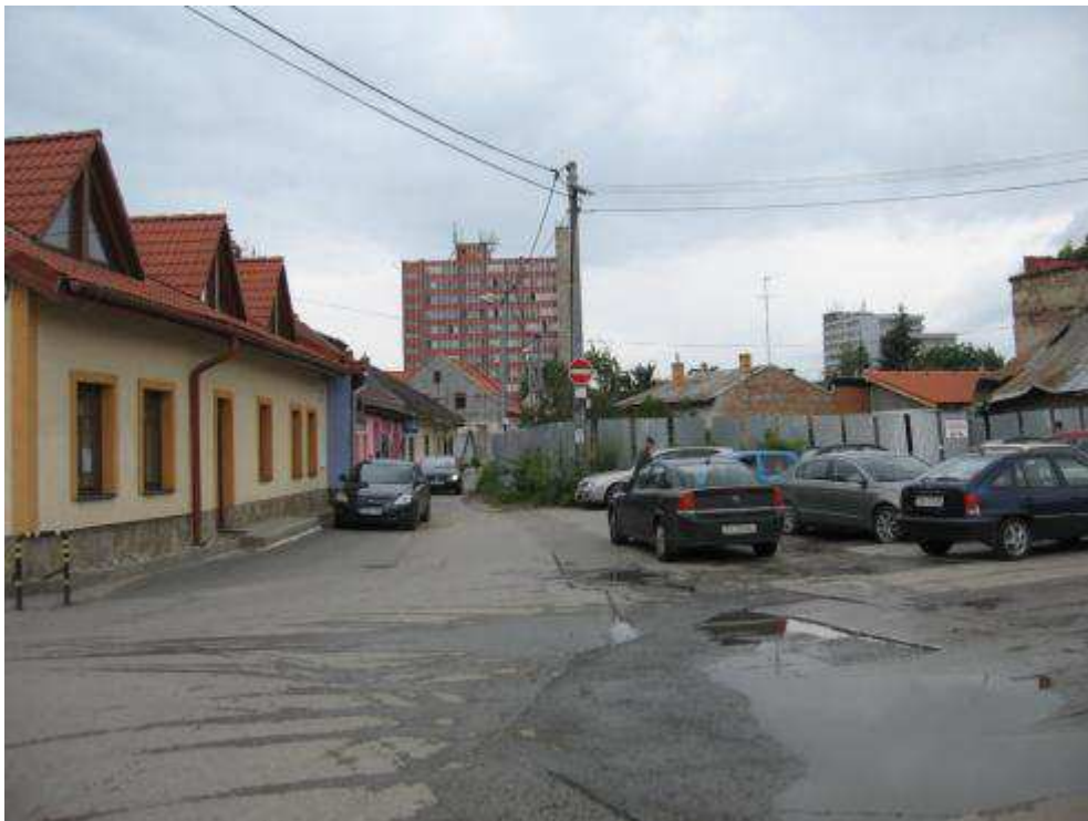
Pohľad č. 22