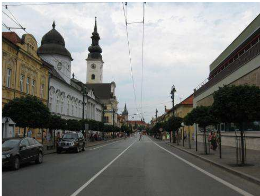
Pohľad č. 7