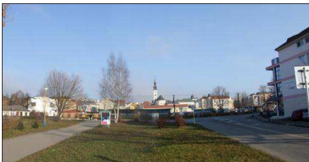
B - pohľad na mesto z Kúpeľnej ulice