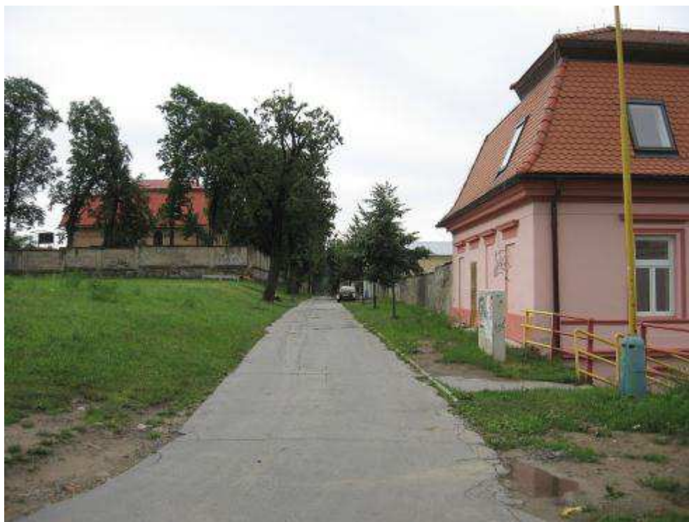
Pohľad č. 31