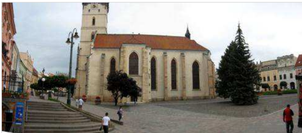
Pohľad č. 5