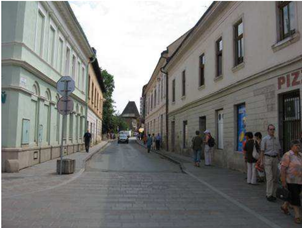
Pohľad č. 17