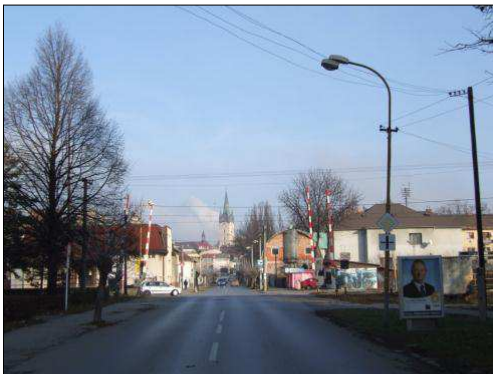
A - pohľad na mesto z Požiarnickej ulice