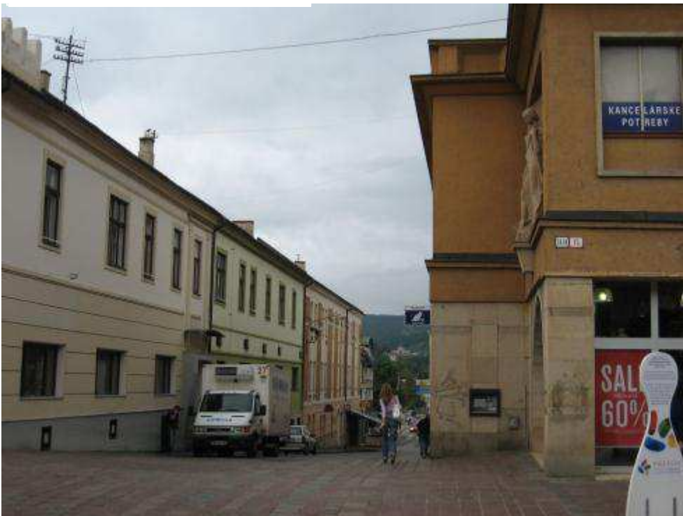
Pohľad č. 16