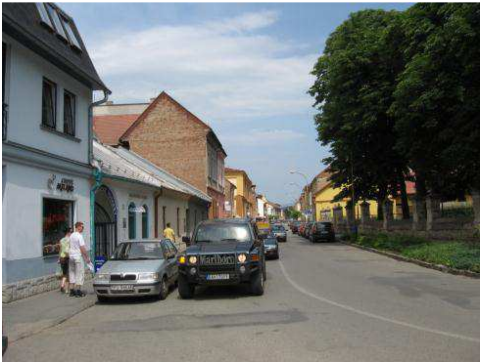
Pohľad č. 26