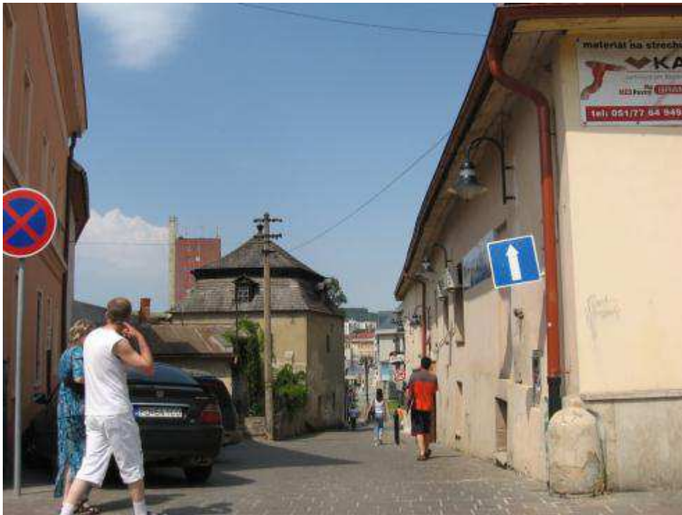
Pohľad č. 2