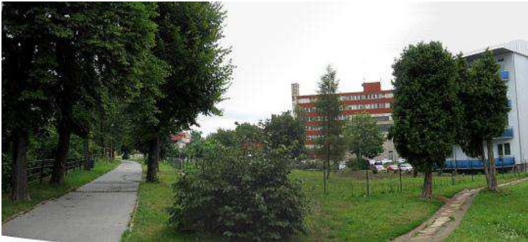
Pohl'ad č. 36