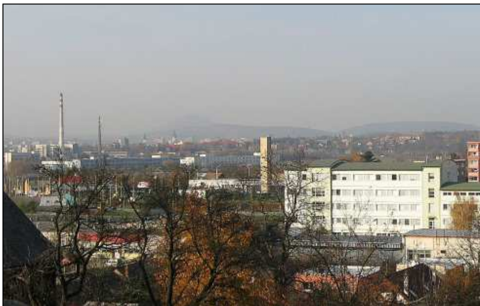
4 - Pohľad na mesto zo Solivaru od Rímskokatolíckeho kostola sv. Štefana