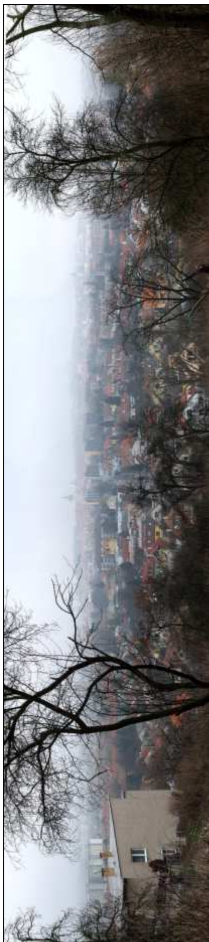
1 - Pohľad na mesto z Čerešňovej ulice