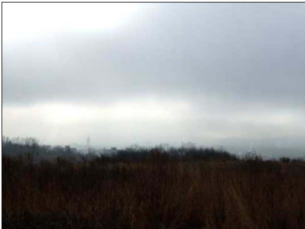
5 - Pohľad na mesto z kopca zvaného Šibeň