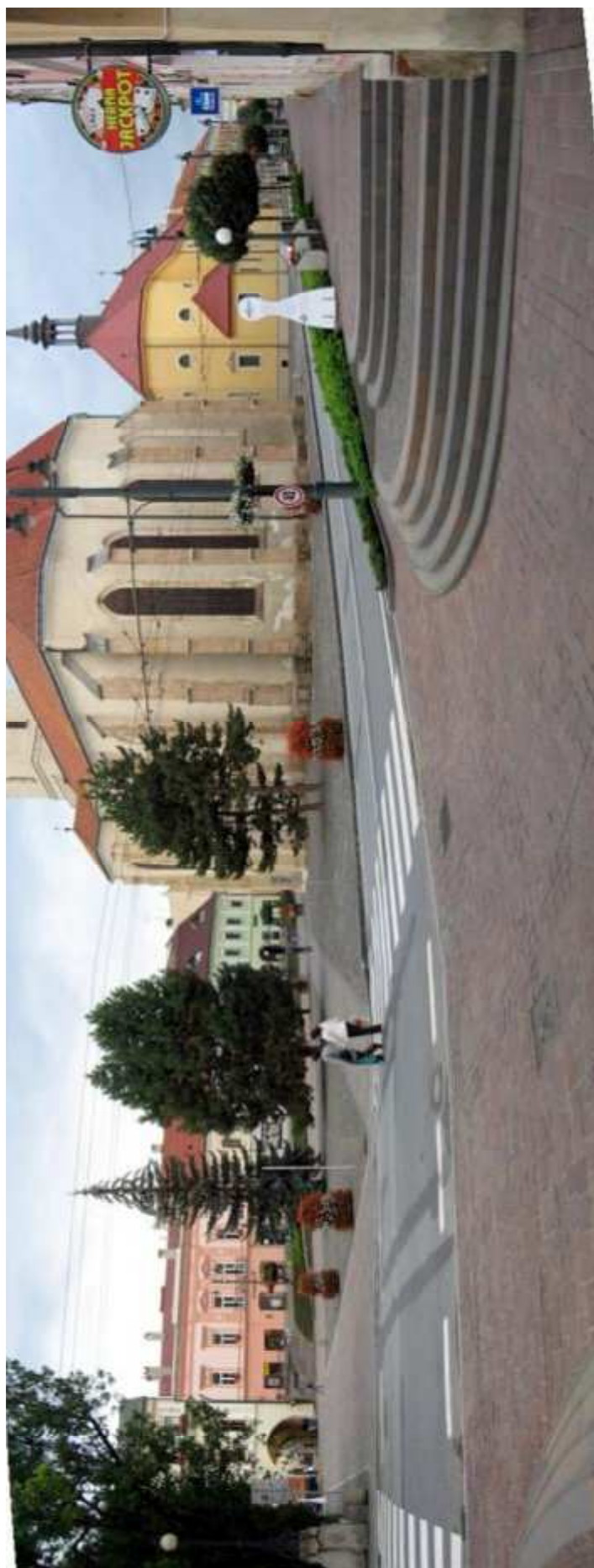
Pohľad č. 10