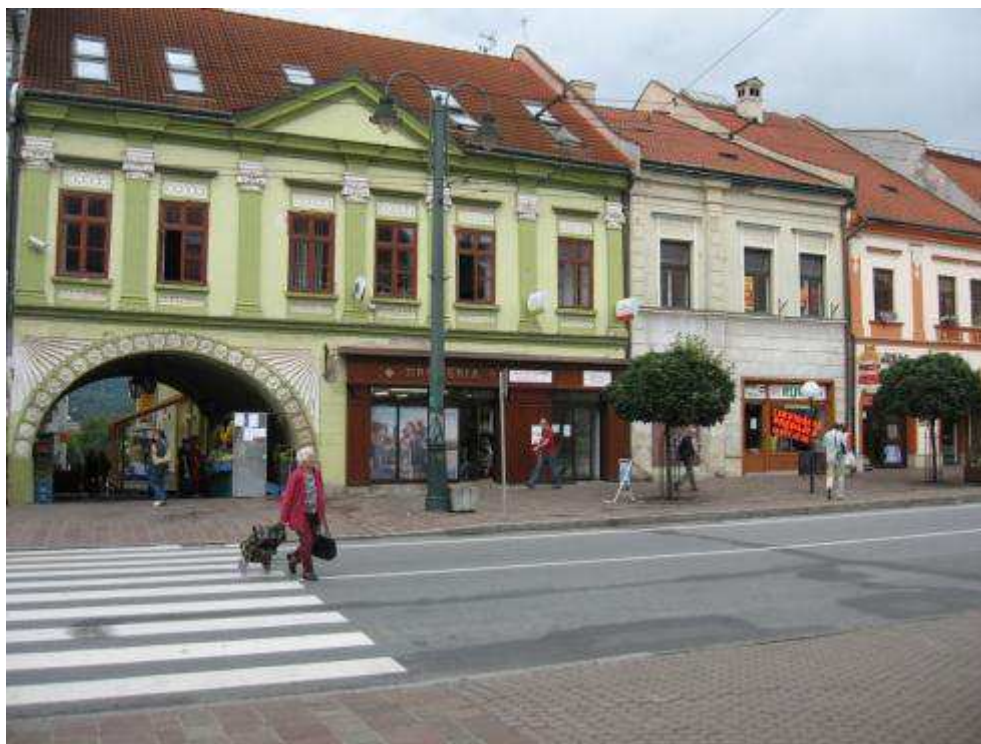
Pohľad č. 8