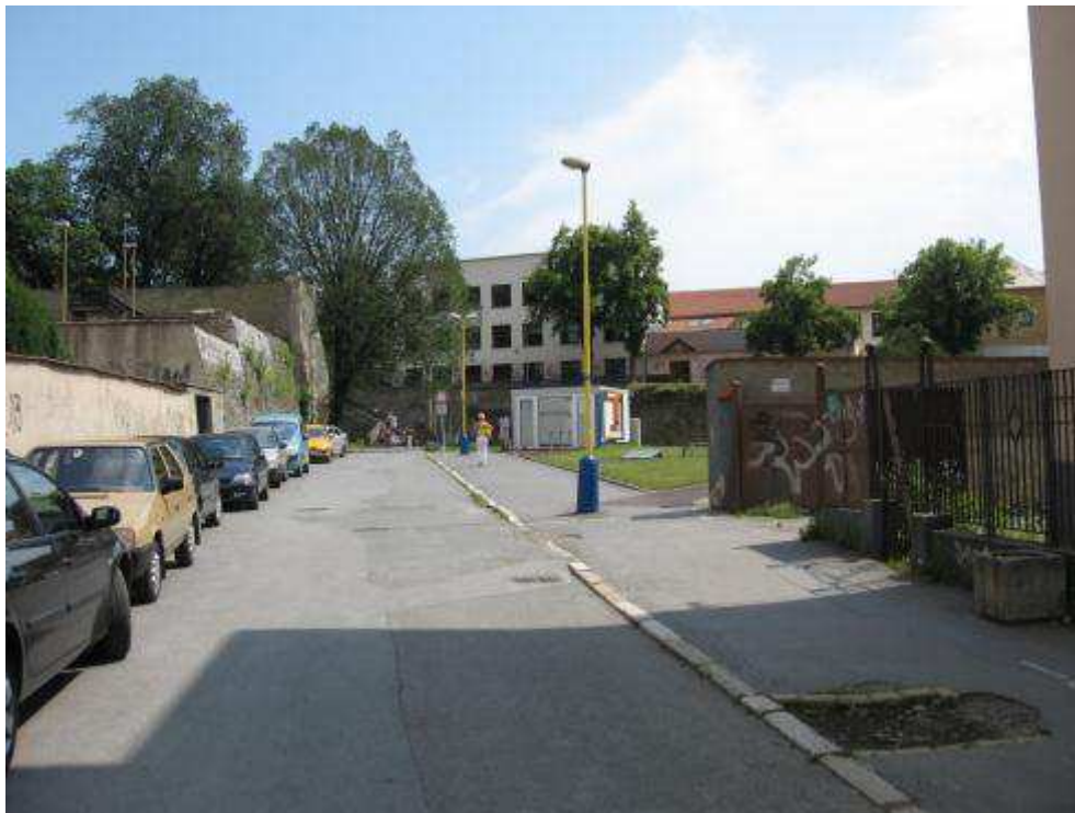
Pohľad č. 29