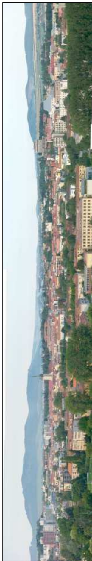
2 - Pohľad na mesto z Kalvárie