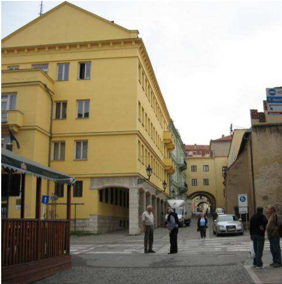
Pohľad č. 15