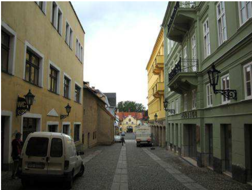
Pohl'ad č. 14