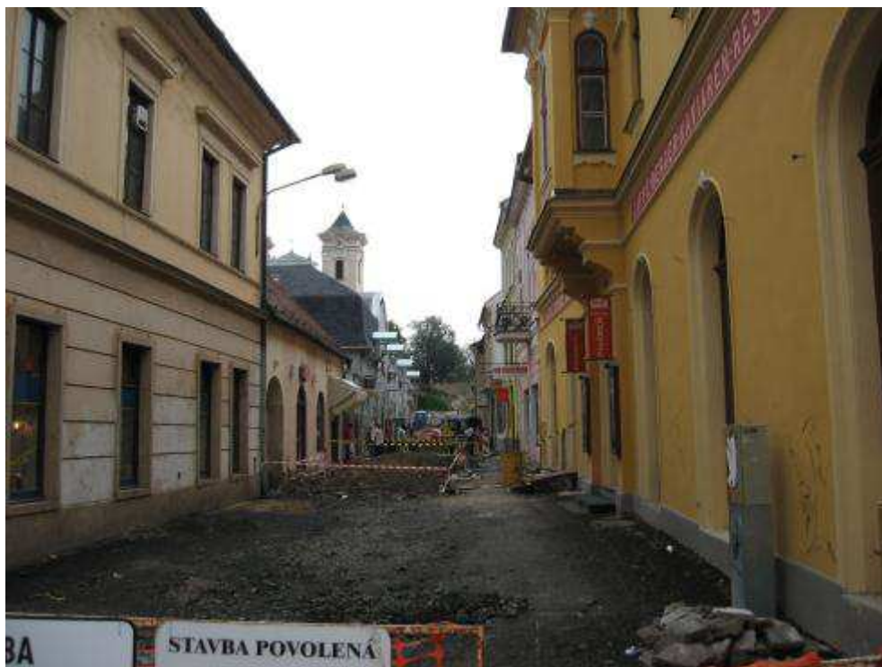
Pohľad č. 19