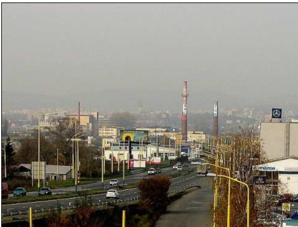
3 - Pohľad na mesto od spoločnosti PO CAR – prjazd z diaľnice KE-PO