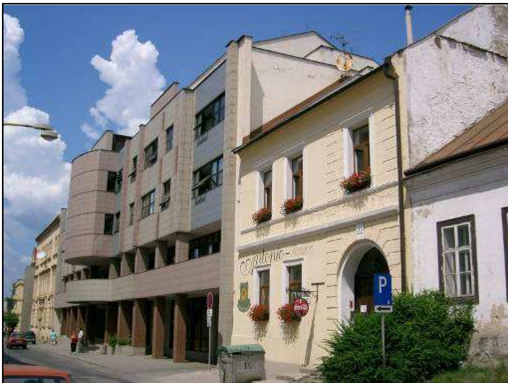
185 - Jarková ulica – dom č. 22 a objekt Mestského úradu Prešov, súčasný stav