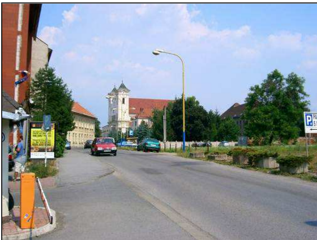
172 – Severná časť ulice Hurbanistov – súčasný stav