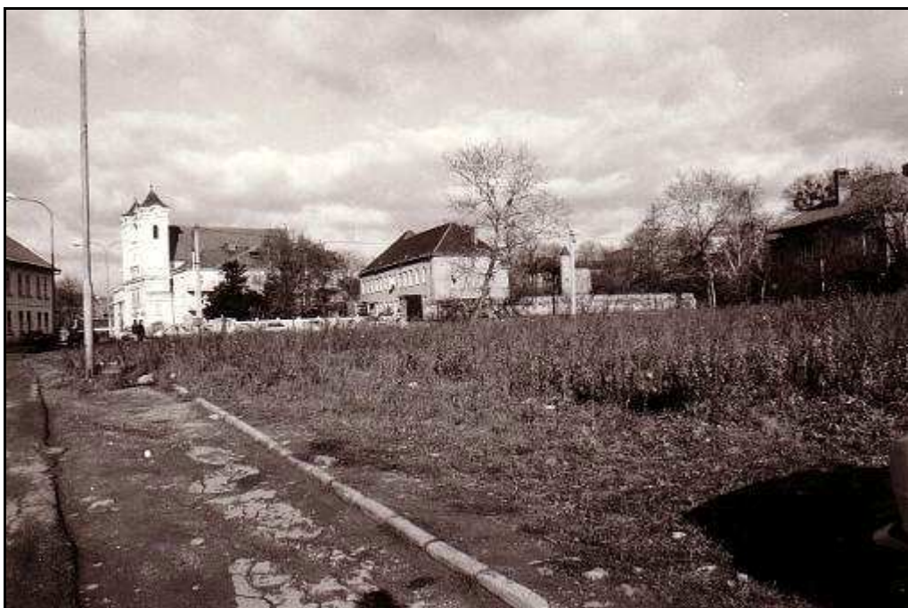
171 – Revitalizačná plocha R 15 medzi ulicou Hurbanistov a hradobnou priekopou, stav z roku 1994