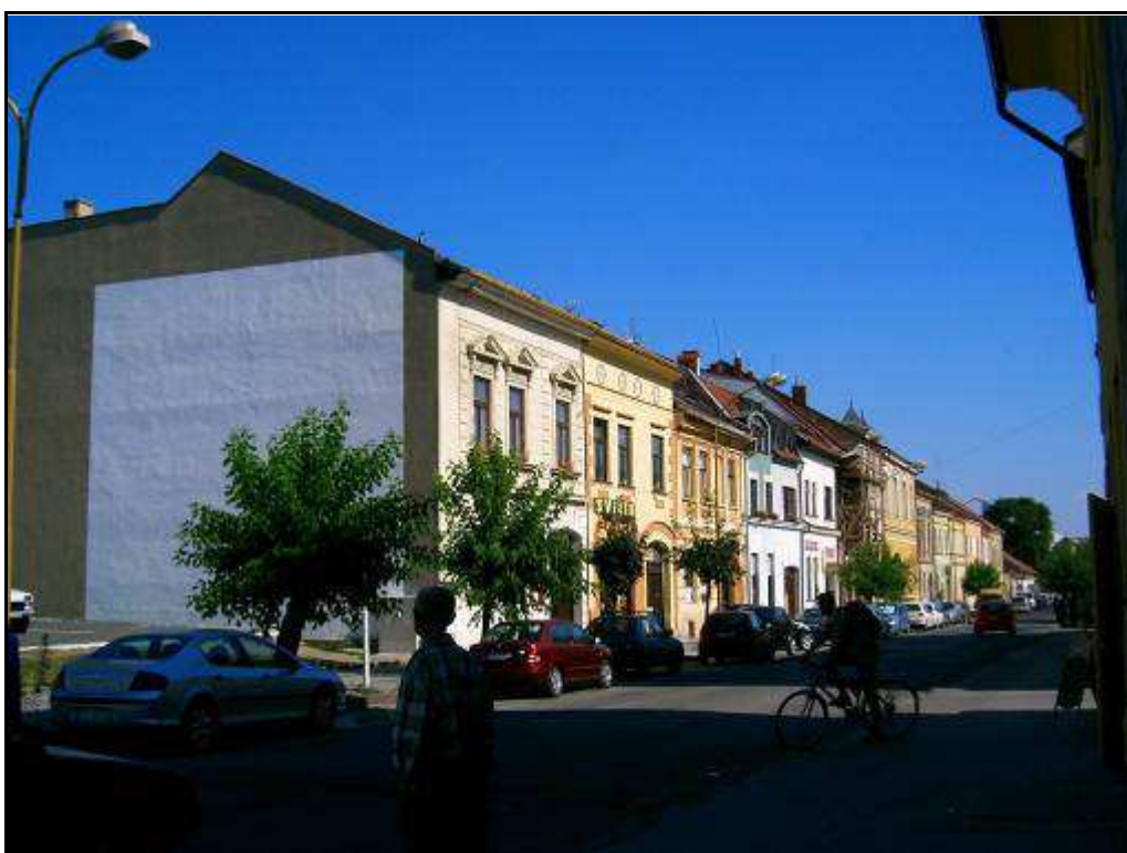
160 - Slovenská ulica – blok domov č. 34. – 2. – súčasný stav