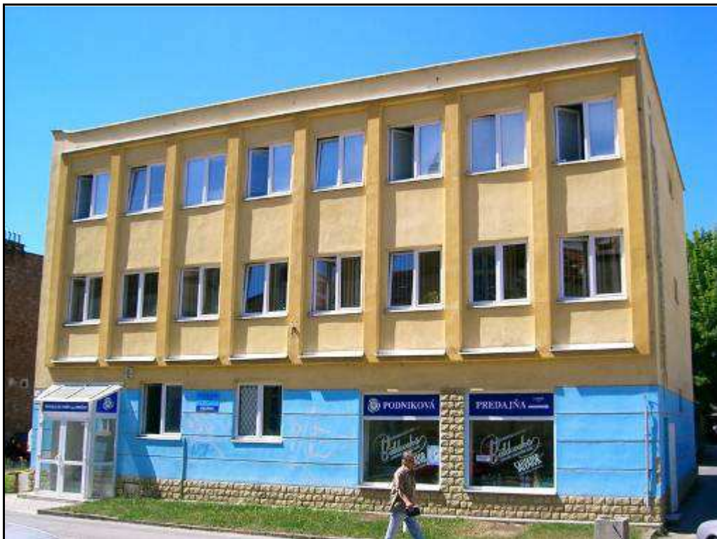
193 - Slovenská ulica č. 9 „Minerálne vody“ - rušivý objekt – súčasný stav