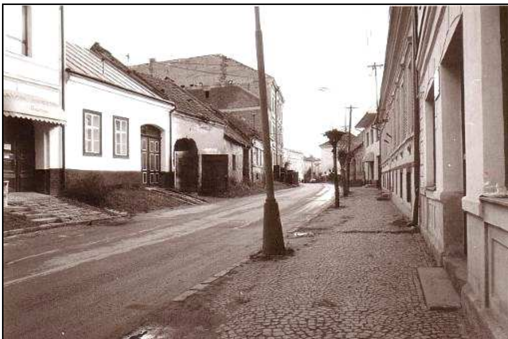
183 - Južná časť Jarkovej ulice – stav z roku 1994