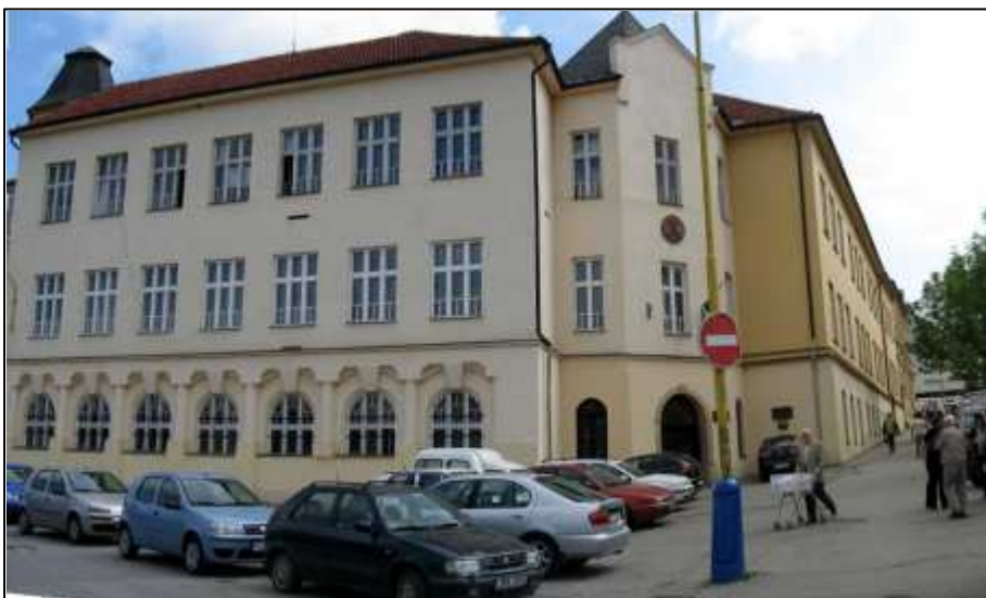
152 - Nárožie Jarkovej ul. a ul.Biskupa Gojdiča - Gr. kat. bohoslovecká fakulta, súčasný stav