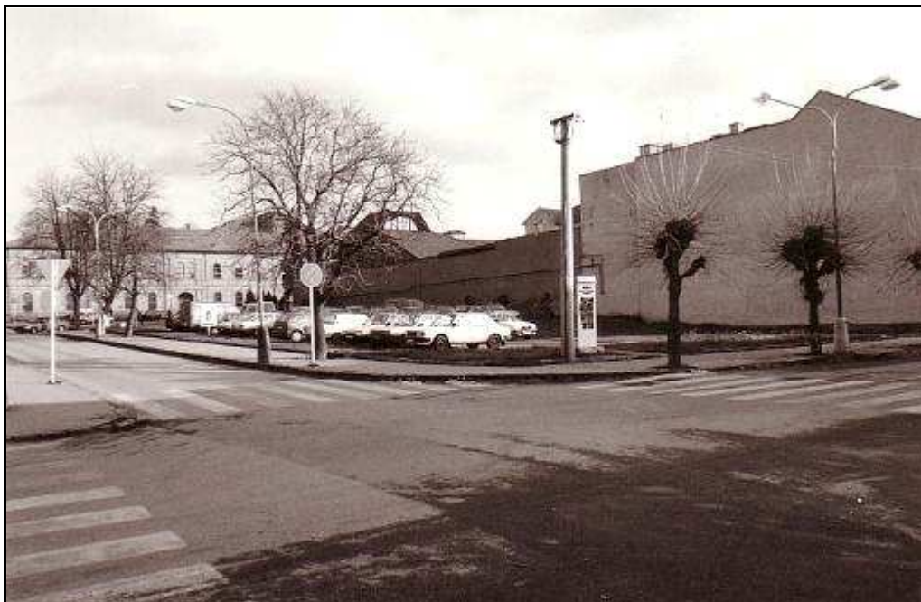
163 – Križovatka Slovenskej a Metodovej ulice – Revitalizačná plocha R 13, stav z roku 1994