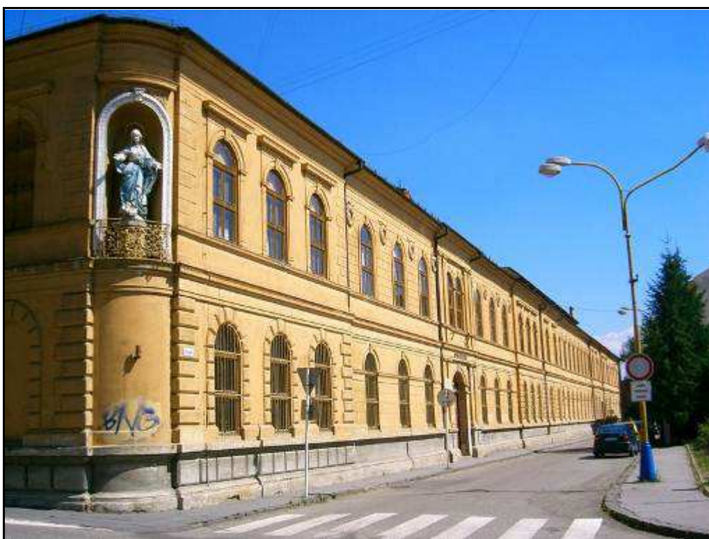
154 - Ústav anglických panien Sancta Maria na Konštantínovej ulici – súčasný stav