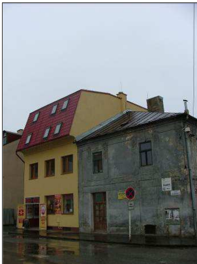
196 - Slovenská ulica č. 19 – rušivý objekt, súčasný stav