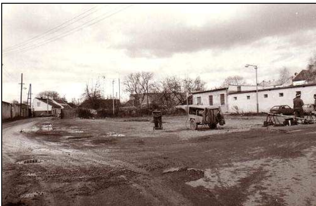
190 - Plocha vymedzená Baštovou ulicou a Šarišskou ulicou – Revitalizačná plocha R 6, stav z roku 1994