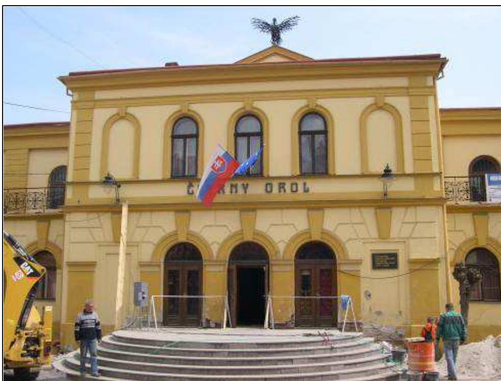
169 – Čierny orol, pohľad od Hlavnej ul., súčasný stav