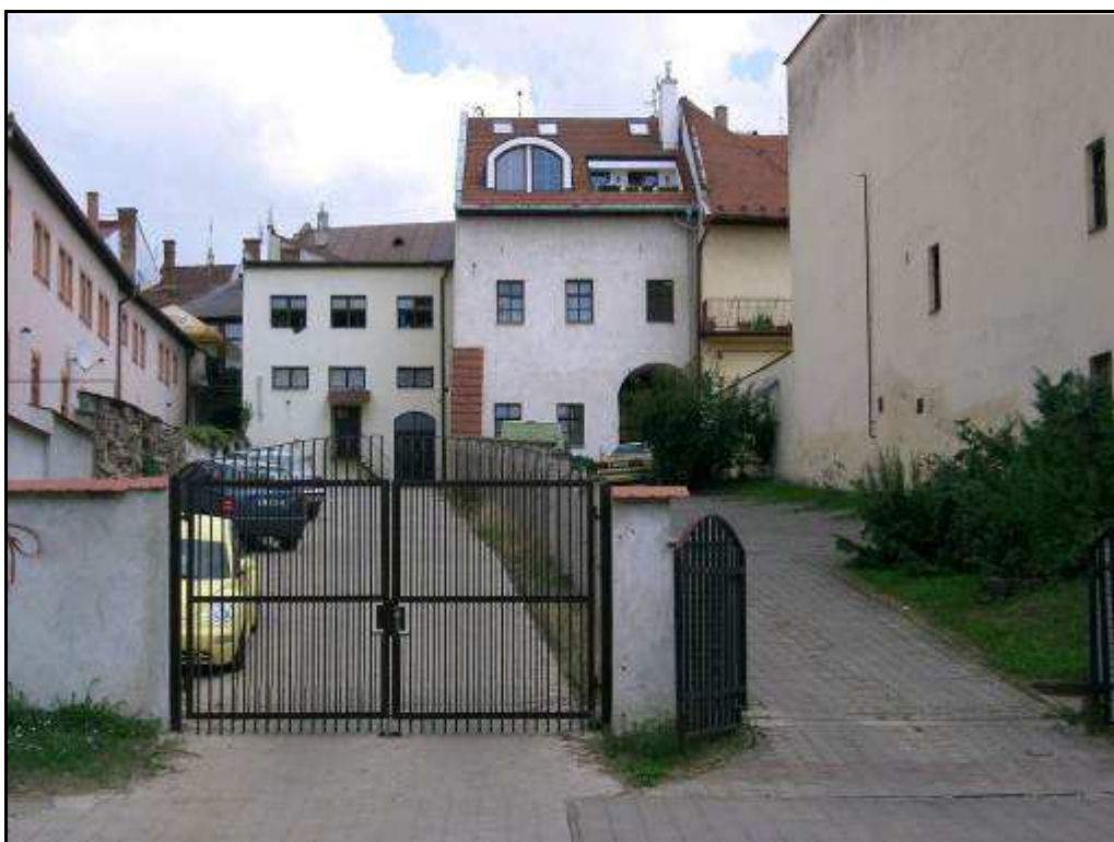
178 - Jarková ulica – dvorová časť domu č. 85 a 87 na Hlavnej ulici - súčasný stav