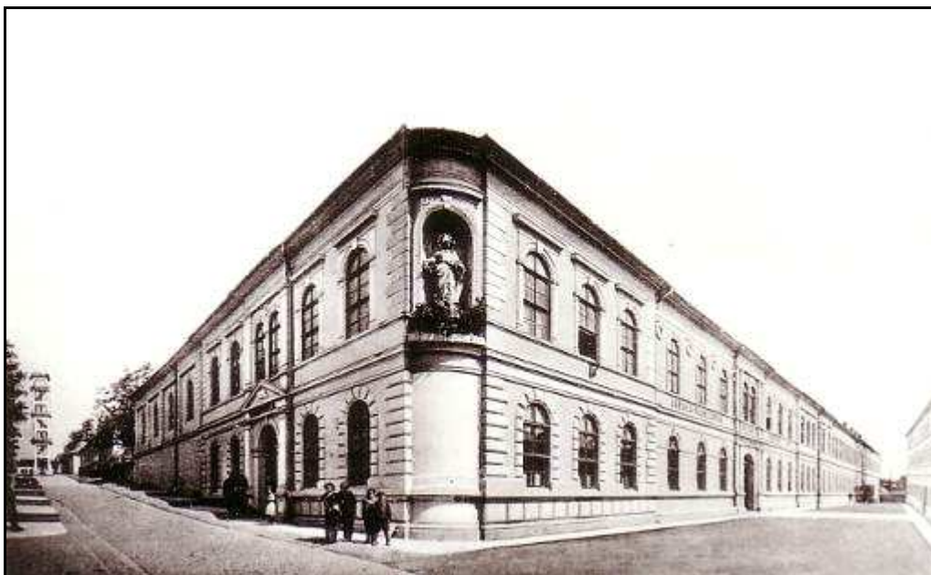
153 - Ústav anglických panien Sancta Maria na Konštantínovej ulici, stav pred 2. sv. vojnou