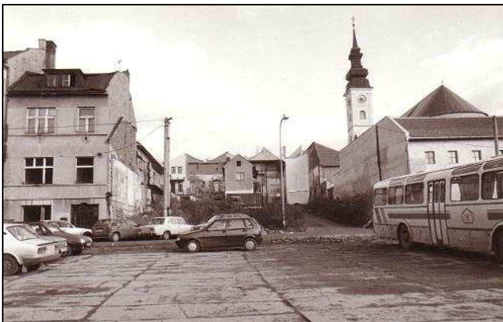
179 - Jarková ulica – fasády dvorových častí domov č. 5, 7 a 9 z Hlavnej ulice, stav z roku 1994