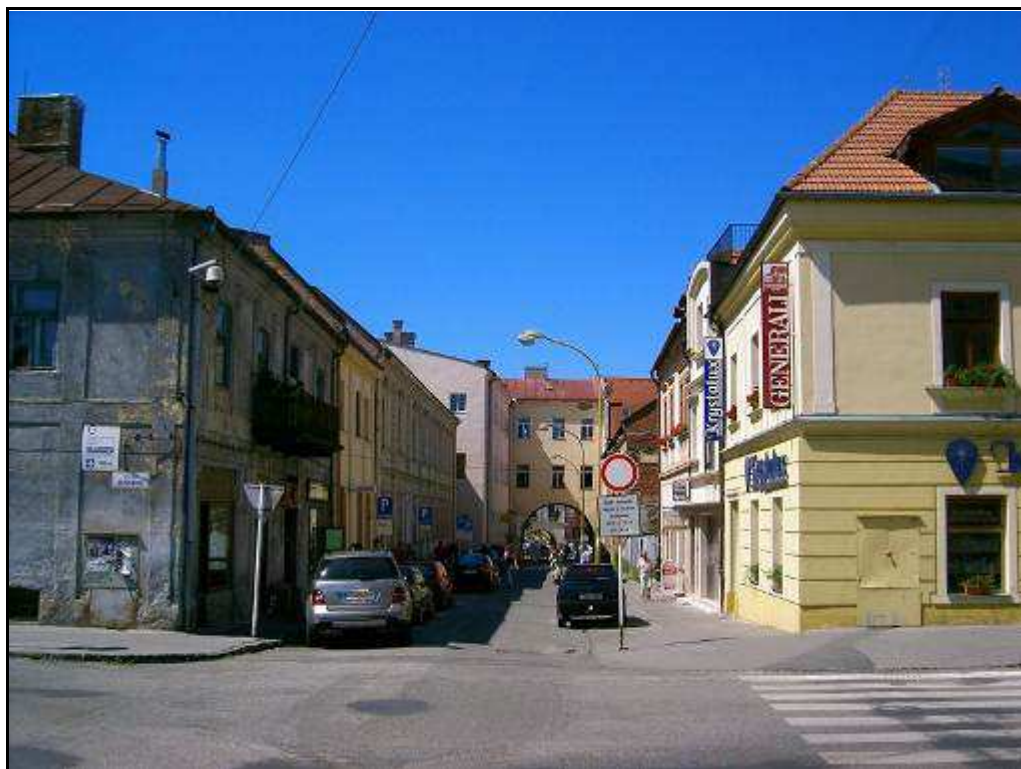
170 - Pohľad do Metodovej ulice zo Slovenskej ulice – súčasný stav