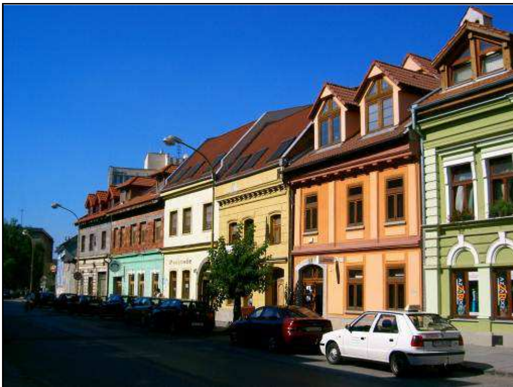
159 - Slovenská ulica – severný blok domov východnej strany– súčasný stav