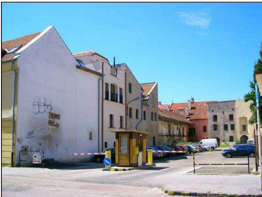
167 - Slovenská ulica – dvorová časť domov na Metodovej ul. č. 12, 10, 8 a 2 a domov č. 82 – 84 na Hlavnej ulici – súčasný stav