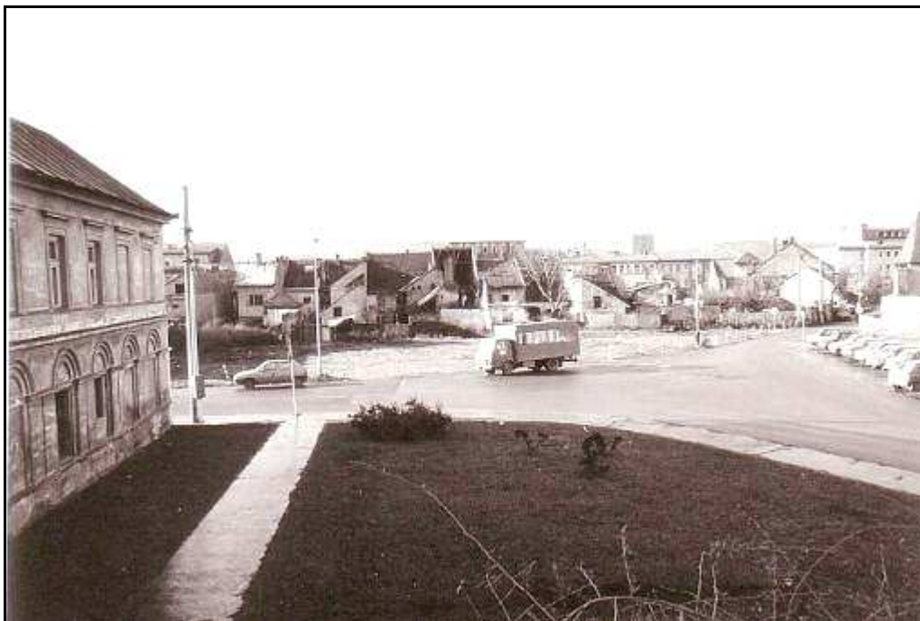
155 - Nárožie Kováčskej a Konštantínovej ulice – stav z roku 1994