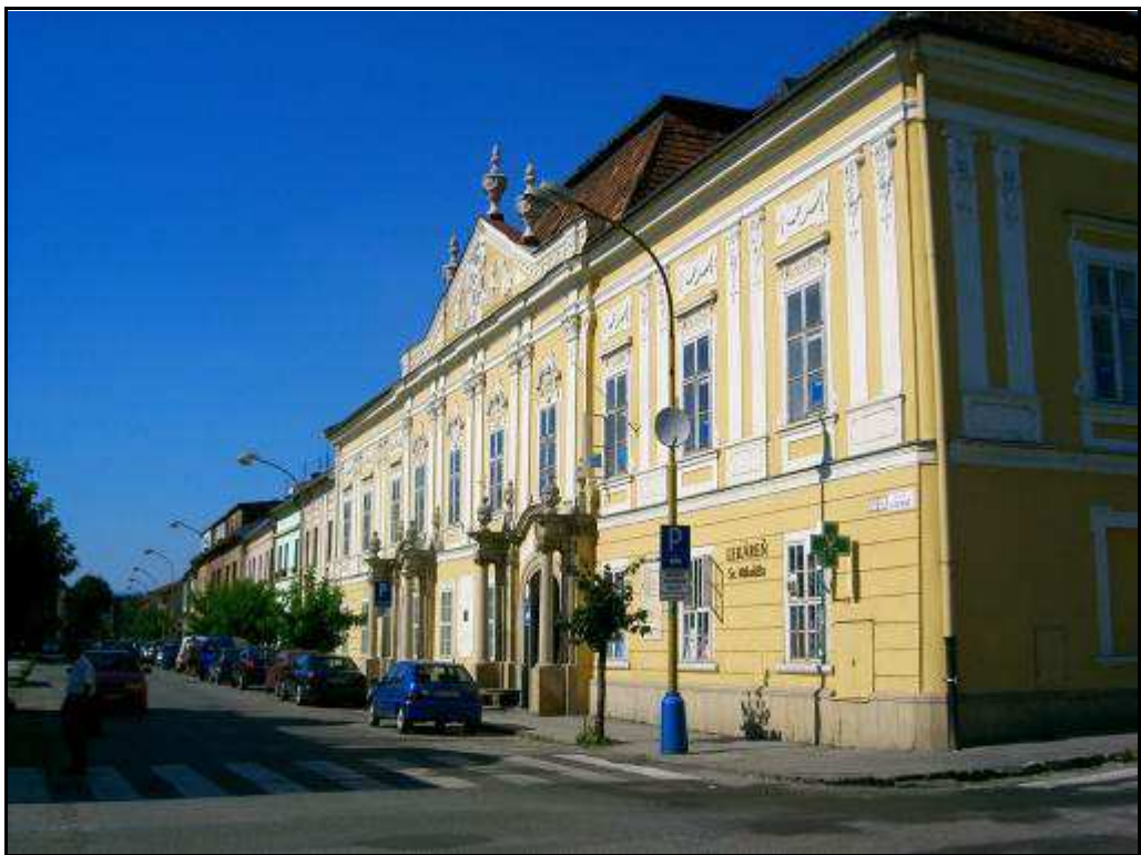
158 - Župný dom na Slovenskej ulici – súčasný stav