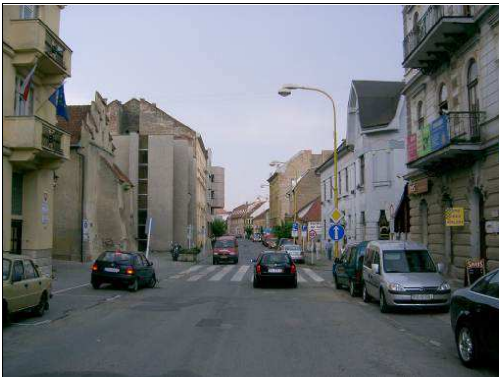
187 - Južná časť Jarkovej ulice – súčasný stav