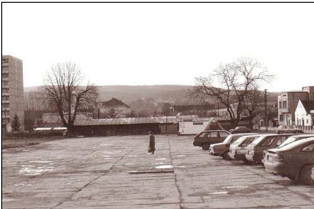
189 - Plocha ohraničená ulicami Jarkovou, Okružnou a Weberovou – Revitalizačné plochy R 3 a R 21, stav z roku 1994