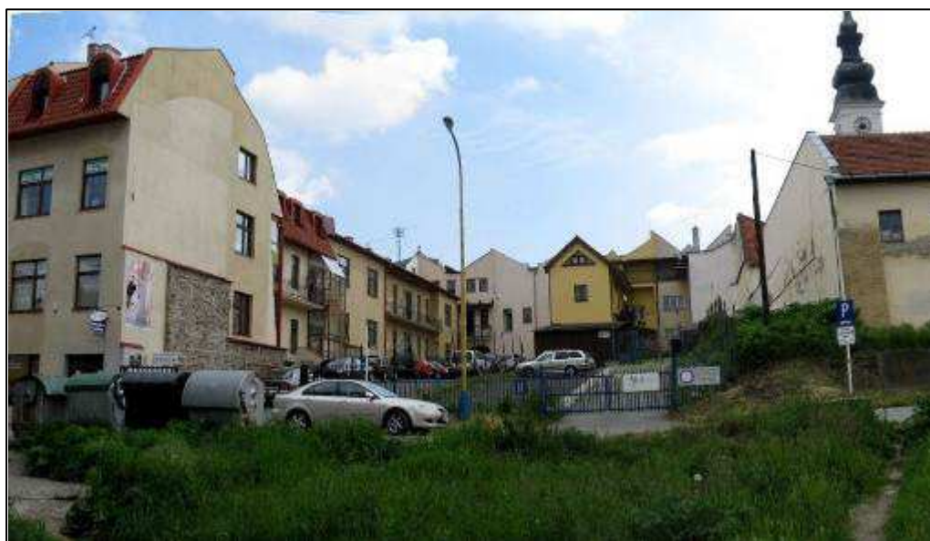
180 - Jarková ulica – fasády dvorových častí domov č. 5, 7 a 9 z Hlavnej ulice, súčasný stav