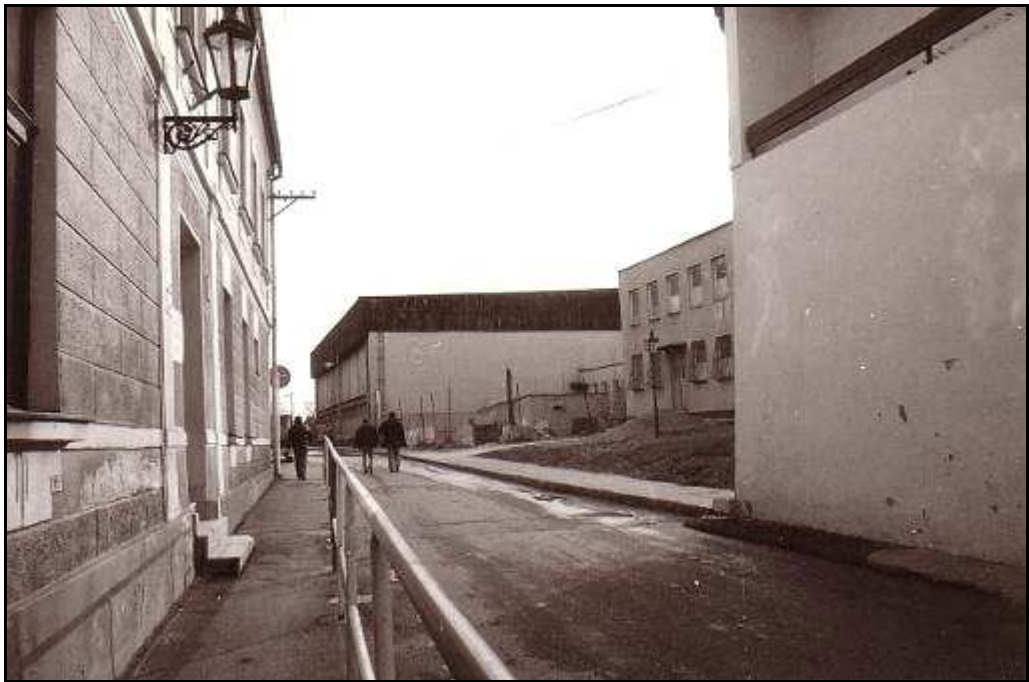
191 - Nevhodné novostavby – športová hala a kotolňa v priestore hradobnej priekopy medzi Baštovou a Okružnou ulicou – r. 1994