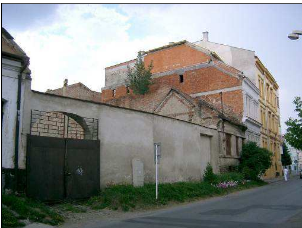
184 - Južná časť Jarkovej ulice – súčasný stav