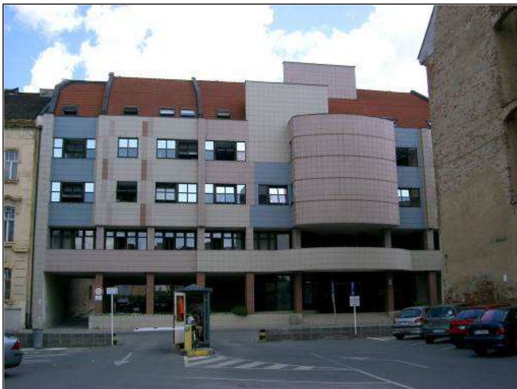
195 - Jarková ulica č. 24 – rušivý objekt Mestského úradu, súčasný stav