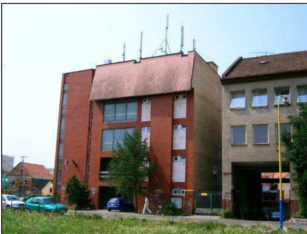
174 - Ulica Hurbanistov č. 3 – súčasný stav