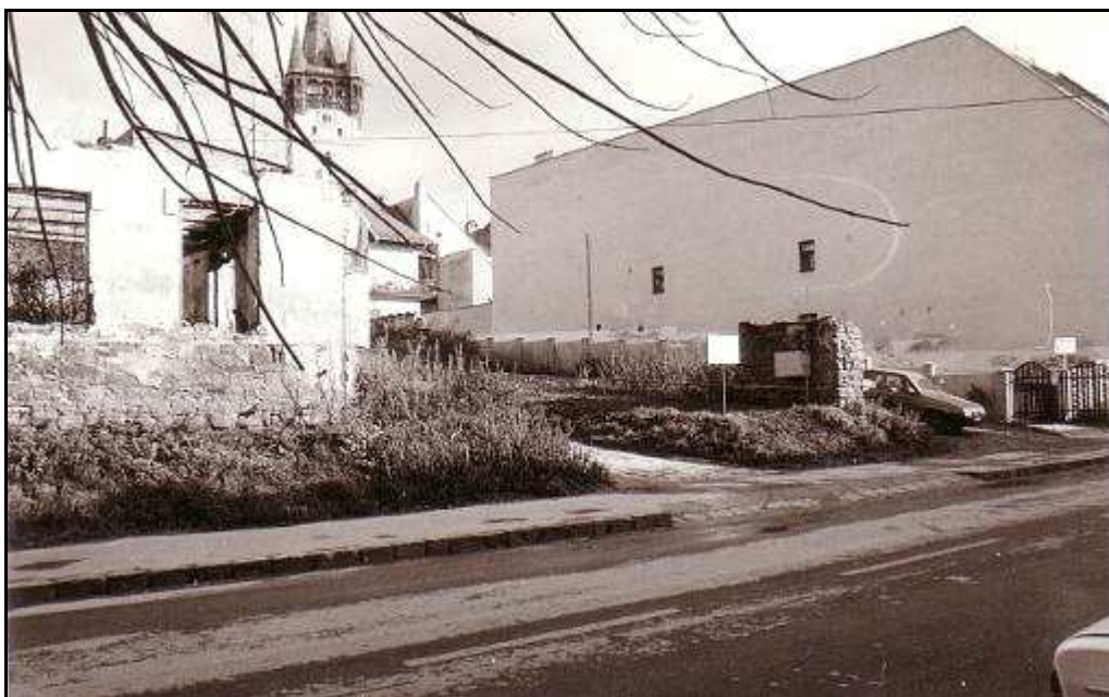
177 - Jarková ulica, dvor domov č. 85 a 87 na Hlavnej ulici - stav z roku 1994