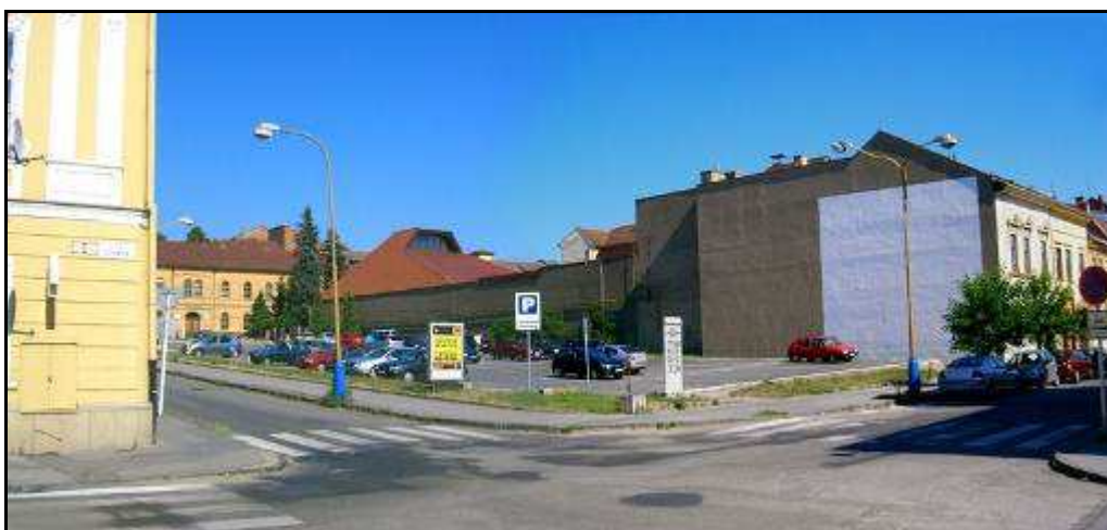
164 - Križovatka Slovenskej a Metodovej ulice – Revitalizačná plocha R 13, súčasný stav