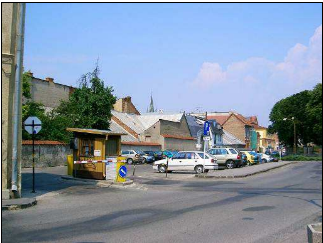
176 - Ulica Hurbanistov – Revitalizačná plocha R 1, súčasný stav