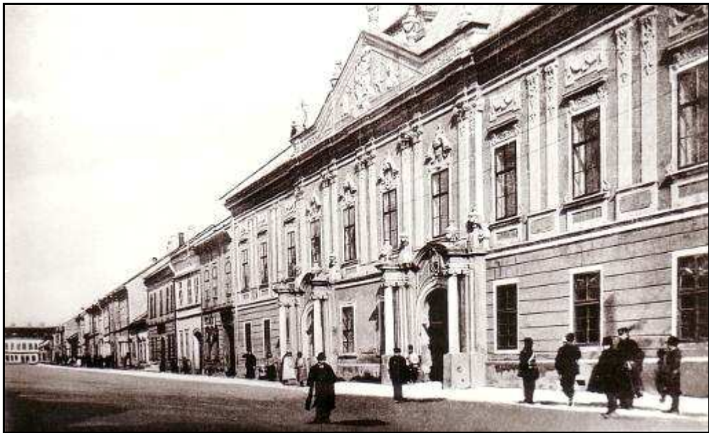
157 - Župný dom na Slovenskej ulici – 30-te roky 20. storočia