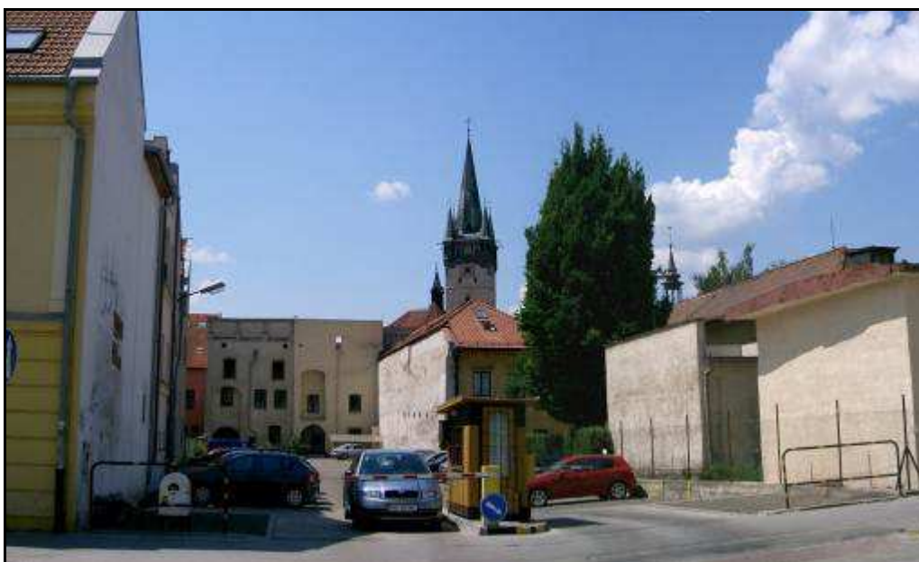
168 - Slovenská ulica – dvory domov č. 82 – 84 na Hlavnej ulici - súčasný stav