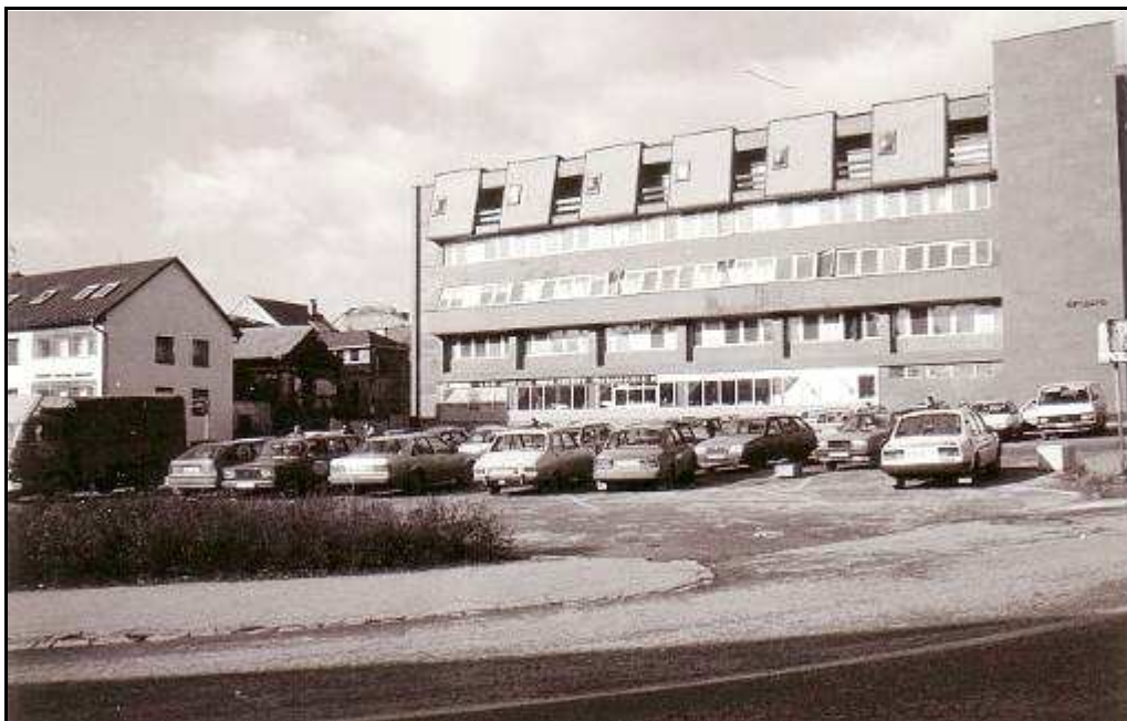
173 - Ulica Hurbanistov č. 3 - stav z roku 1994