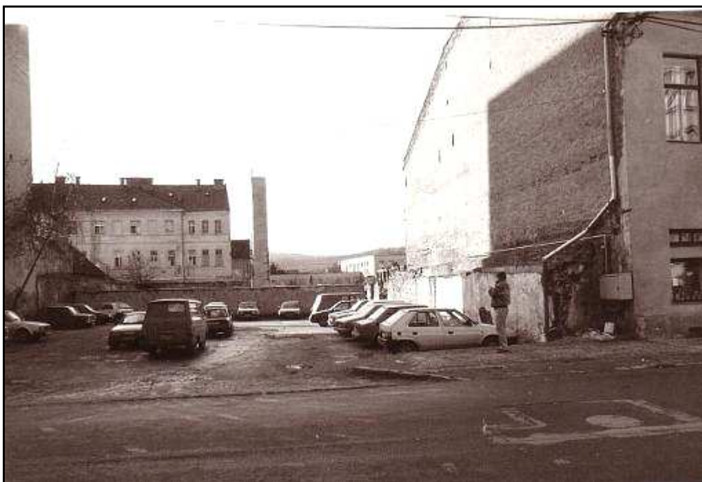
181 - Jarková ulica – plocha parkoviska oproti mestskému úradu, stav z roku 1994