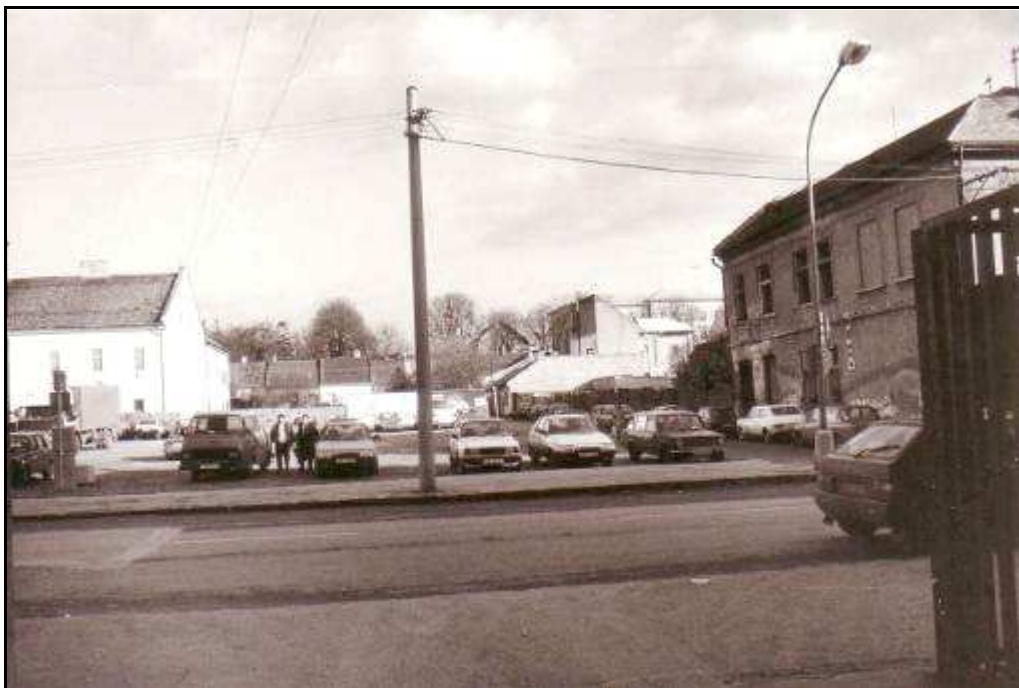
161 – Nárožie Slovenskej a Špitálskej ulice – Revitalizačná plocha R12, stav z roku 1994