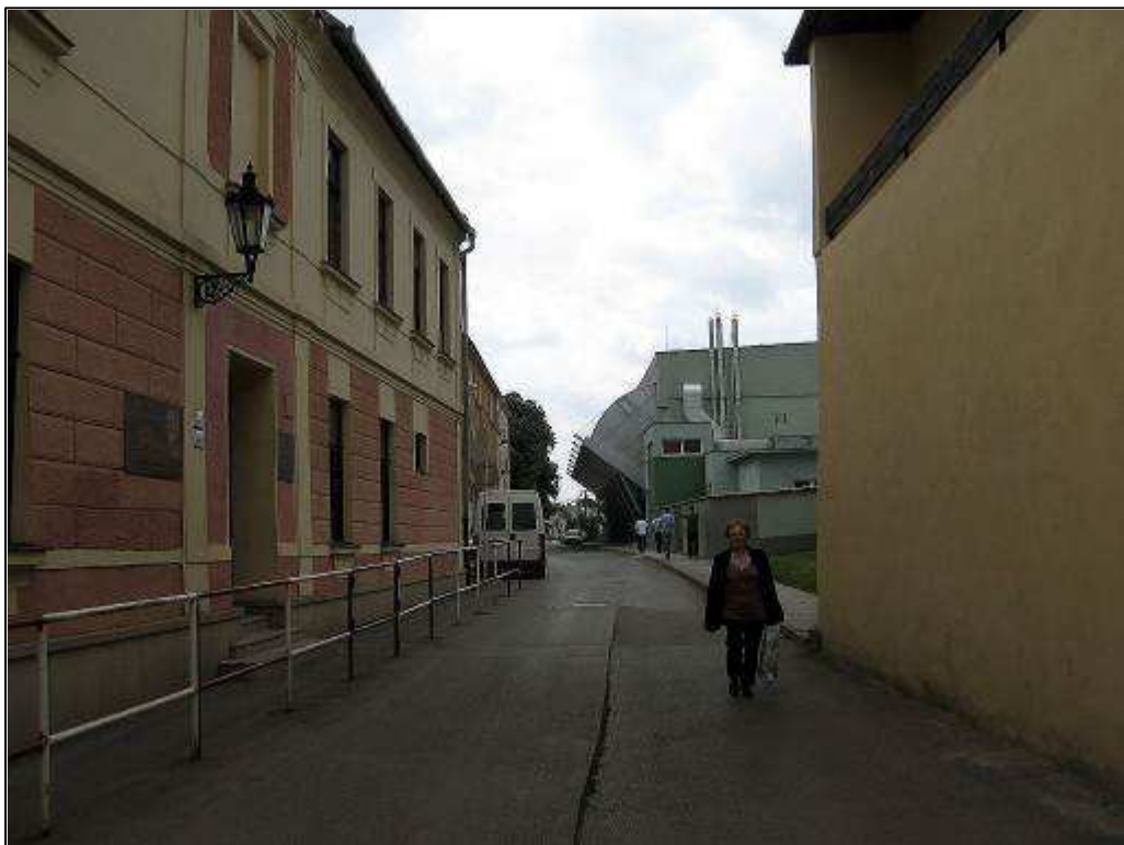
192 - Nevhodné novostavby - športová hala a kotolňa v priestore hradobnej priekopy medzi Baštovou a Okružnou ulicou – súčasný stav