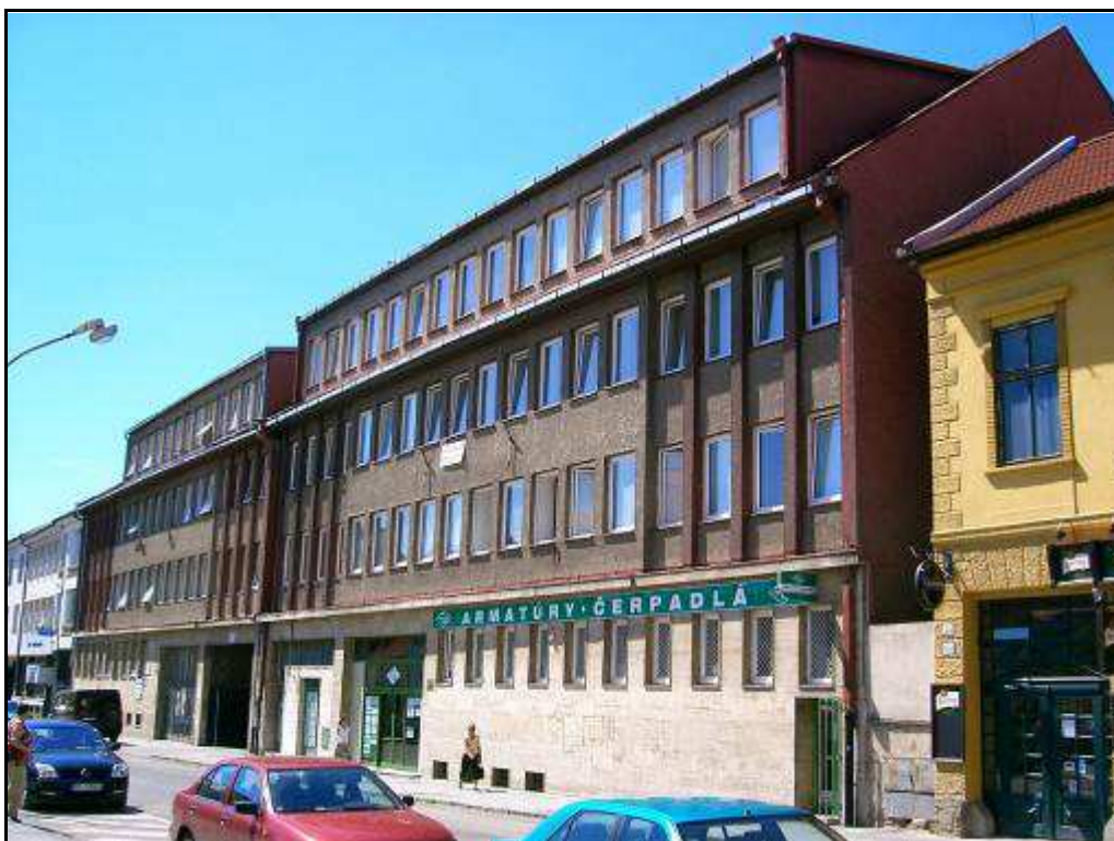
194 - Slovenská ulica č. 67 a 69 - rušivé objekty – súčasný stav