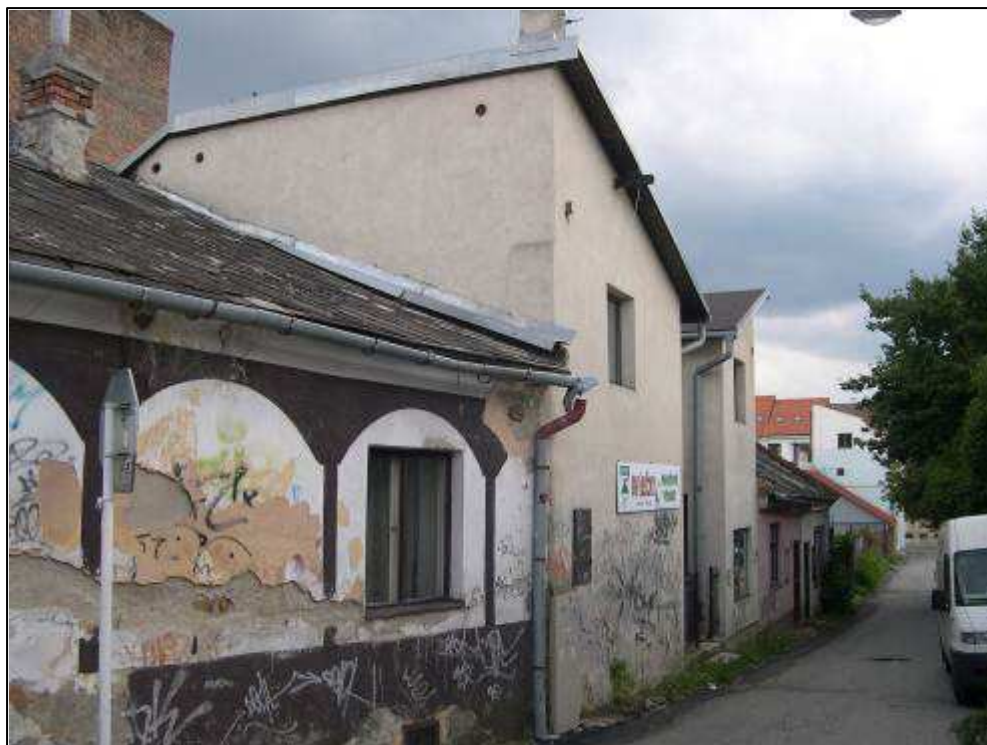
165 – Špitálska ulica, pohľad na západ, súčasný stav