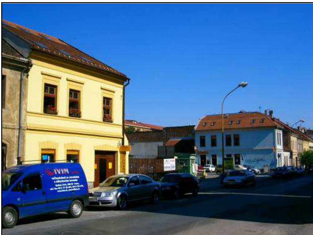
162 - Nárožie Slovenskej a Špitálskej ulice – Revitalizačná plocha R12, súčasný stav