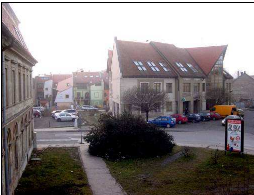
156 - Nárožie Kováčskej a Konštantínovej ulice s Mestským účelovým objektom – súčasný stav