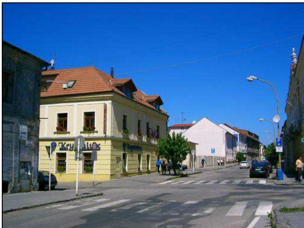
166 - Kríženie Slovenskej a Metodovej ulice – súčasný stav