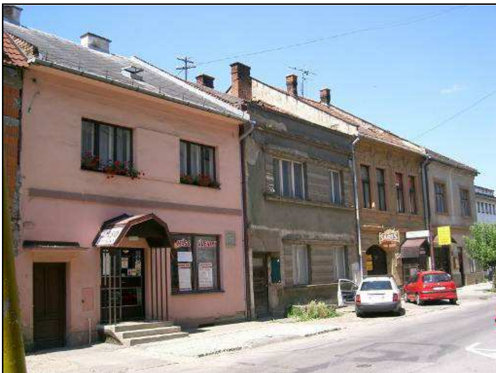
186 - Jarková ulica – západný blok domov č. 21 – 27, súčasný stav