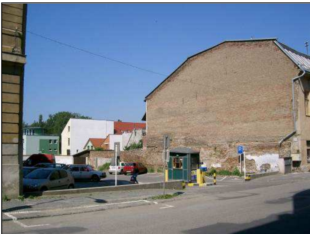
182 - Jarková ulica – plocha parkoviska – Revitalizačná plocha R 5, súčasný stav