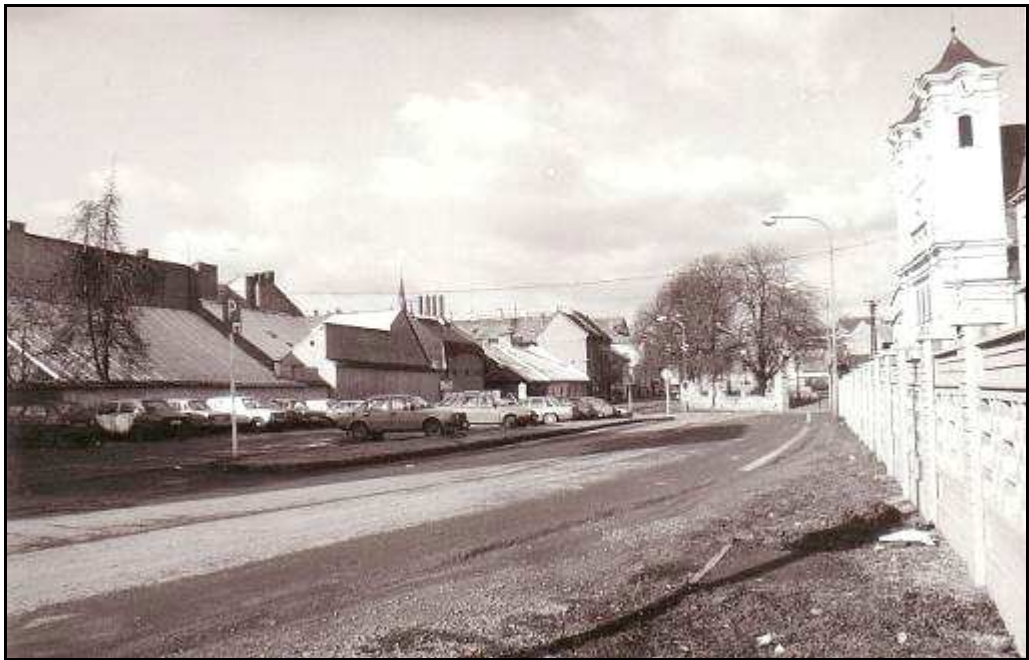
175 - Ulica Hurbanistov – Revitalizačná plocha R 1, stav z roku 1994