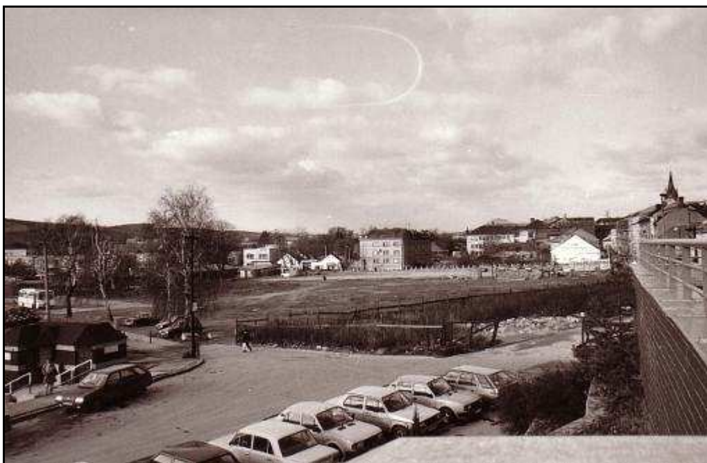
188 - Plocha ohraničená ulicami Jarkovou, ul. Biskupa Gojdiča a Weberovou ul. – Revitalizačné plochy R 20 a R 3, stav z roku 1994