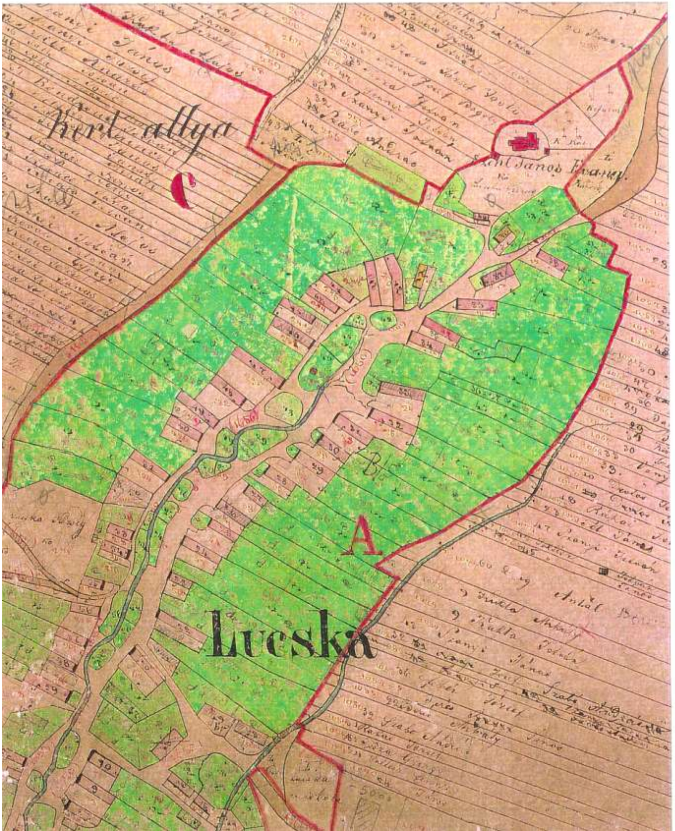
Sídlo na katastrálnej mape z roku 1868 so zaznamenaním majetkových pomerov.