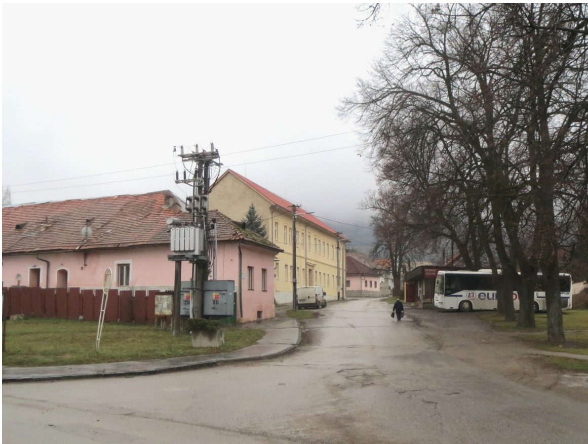
4. Priehľad do Jelšavskej ulice na budovu školy a pokračujúcu drobnú obytnú zástavbu