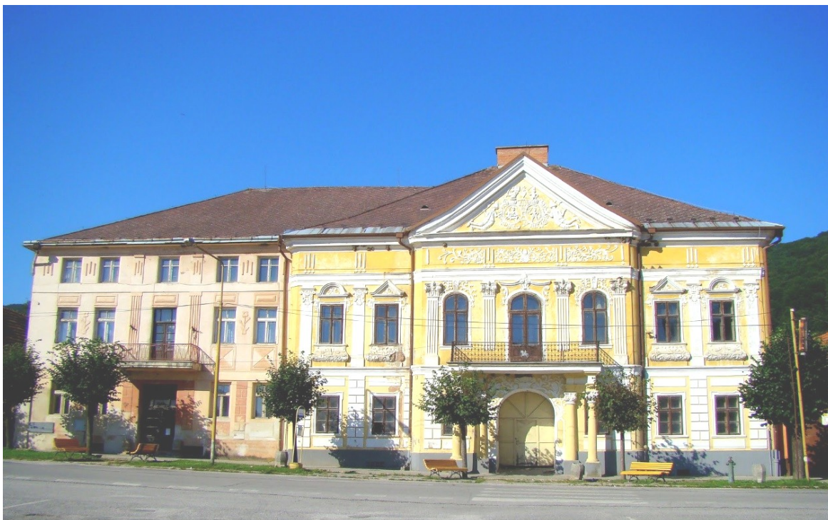
3. Pohľad na ústrednú časť západnej fronty námestia