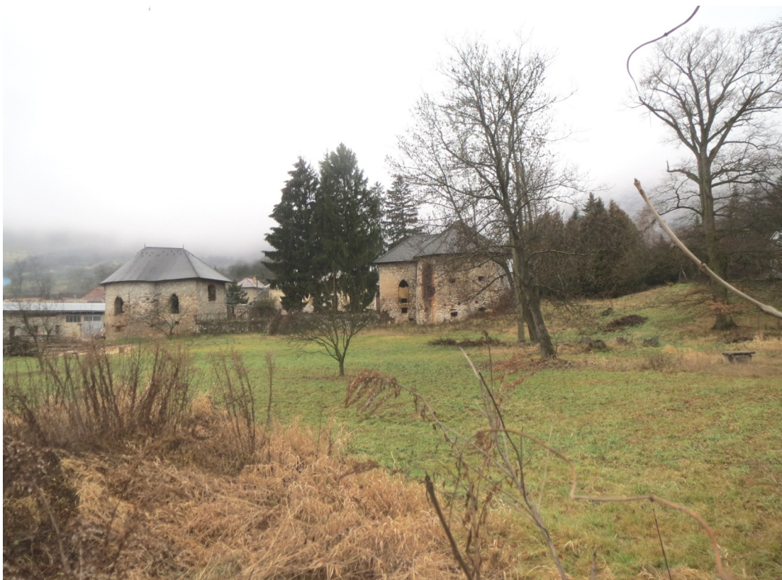
9. Priehľad na vodný hrad z Mlynskej ulice