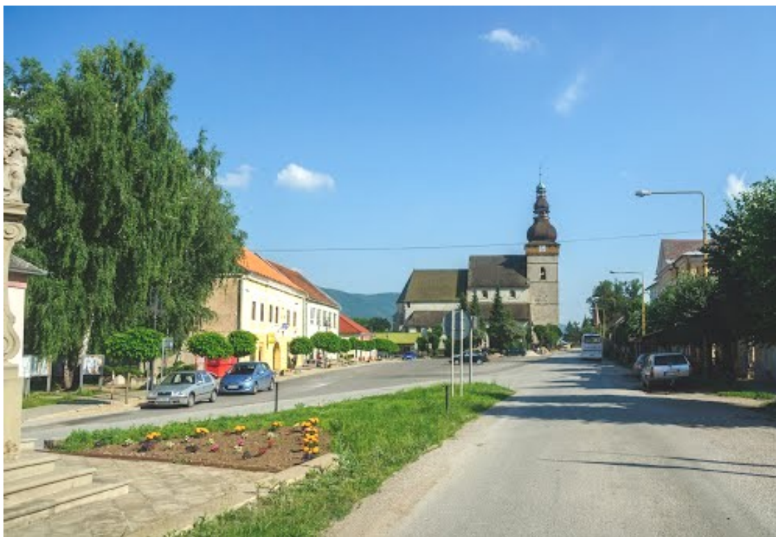
1. Pohľad severo-južný na ev. a. v. kostol