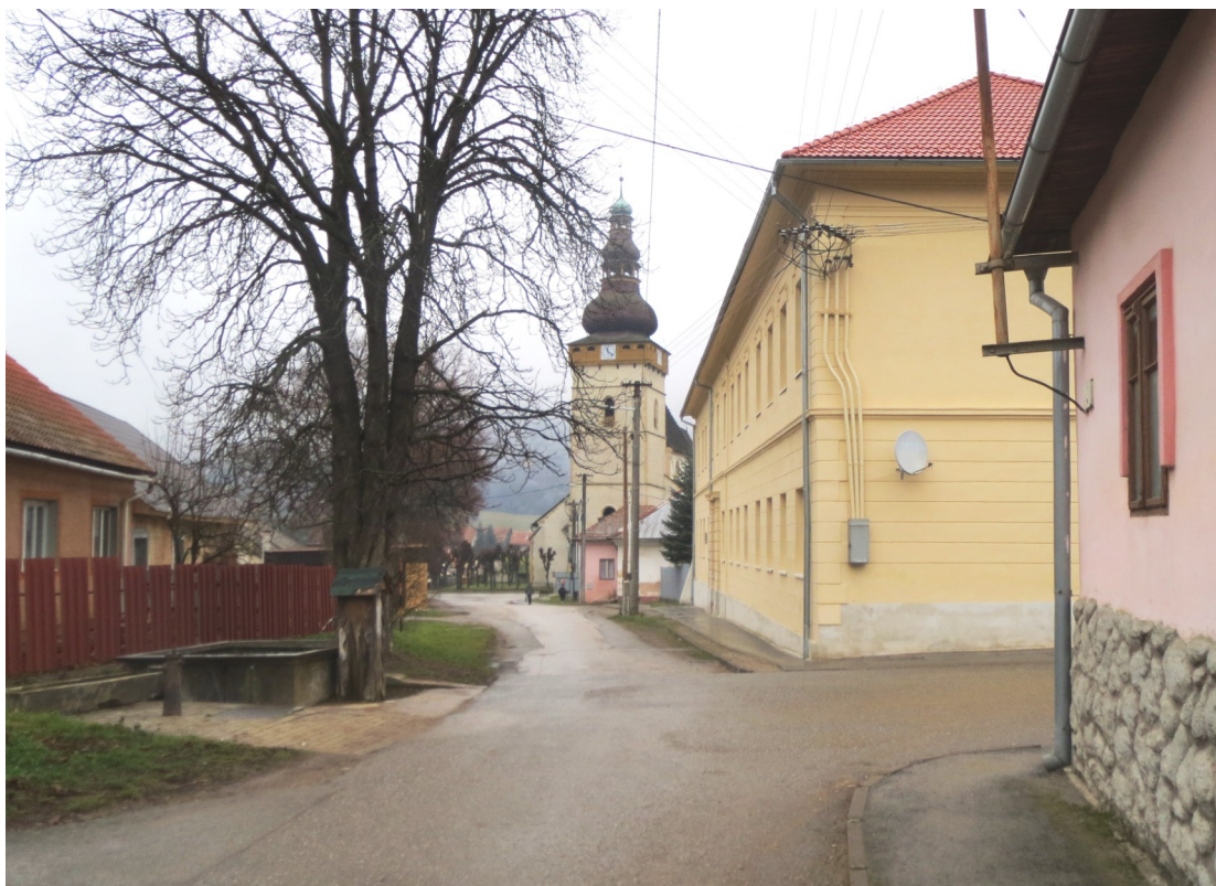
5. Pohľad z Jelšavskej ulice na vežu ev. a. v. kostola