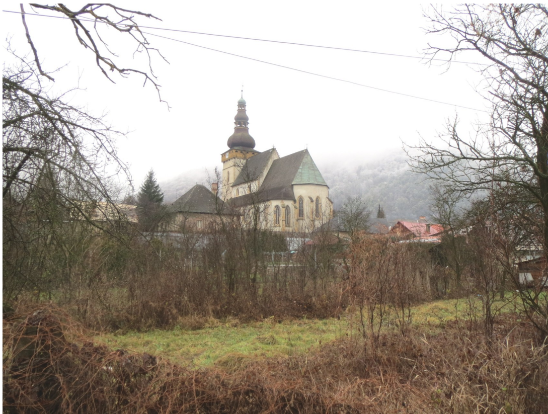
7. Pohľad na hmotu ev. a. v. kostola z Mlynskej ulice