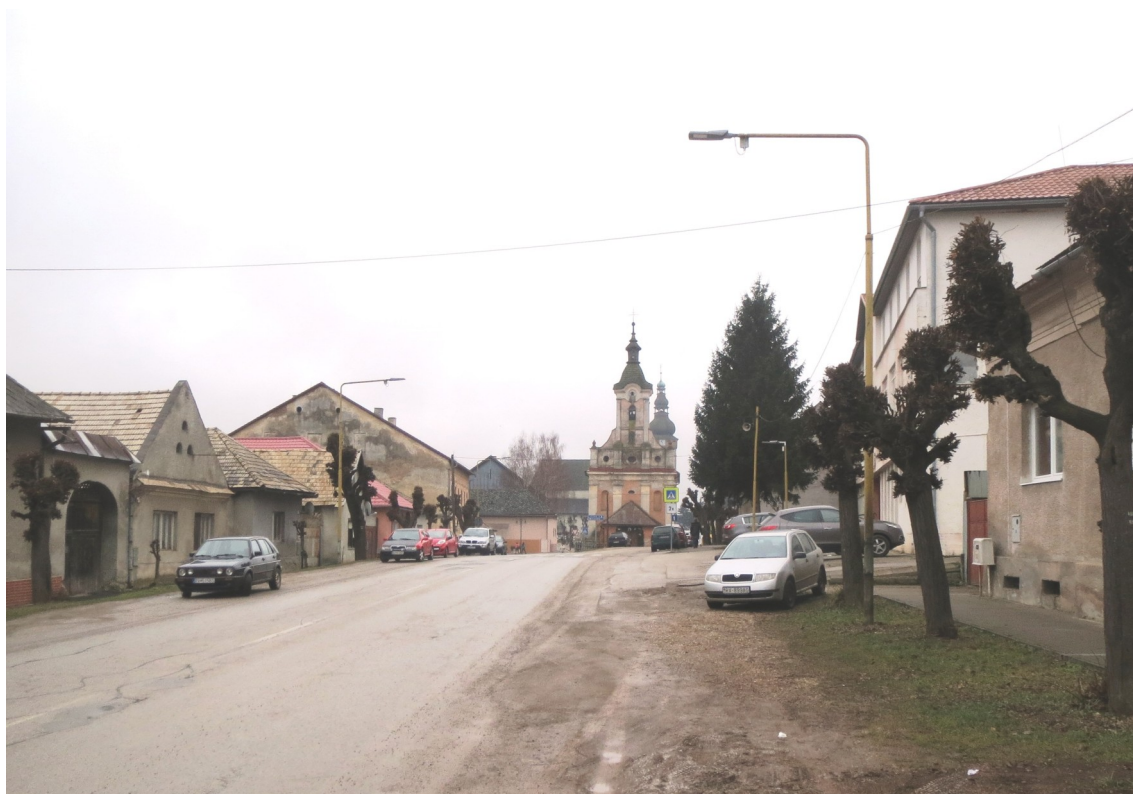
11. Priehľad v osi Ochotinskej ulice