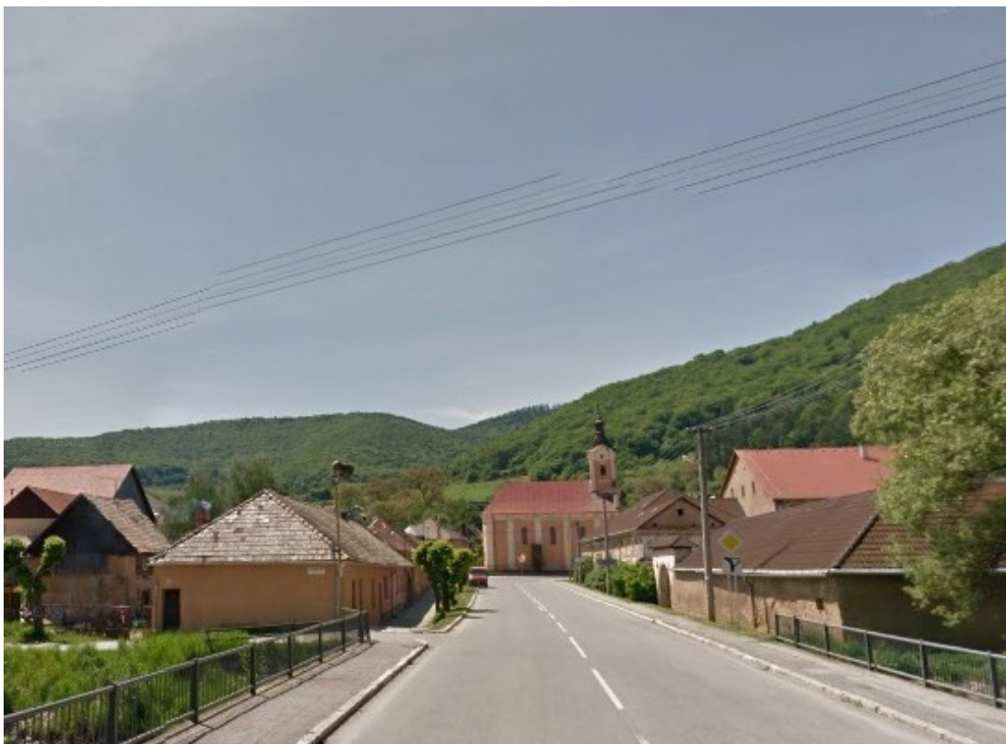
10. Priehľad č. 10 z Rožňavskej ulice na rím. kat. kostol