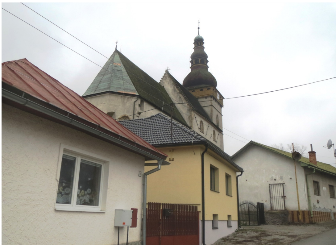
8. Pohľad na hmotu ev. a. v. kostola z Malej ulice