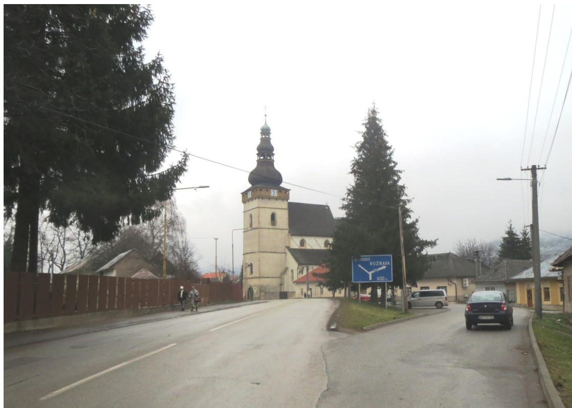
6. Pohľad na hmotu ev. a. v. kostola z Teplickej ulice