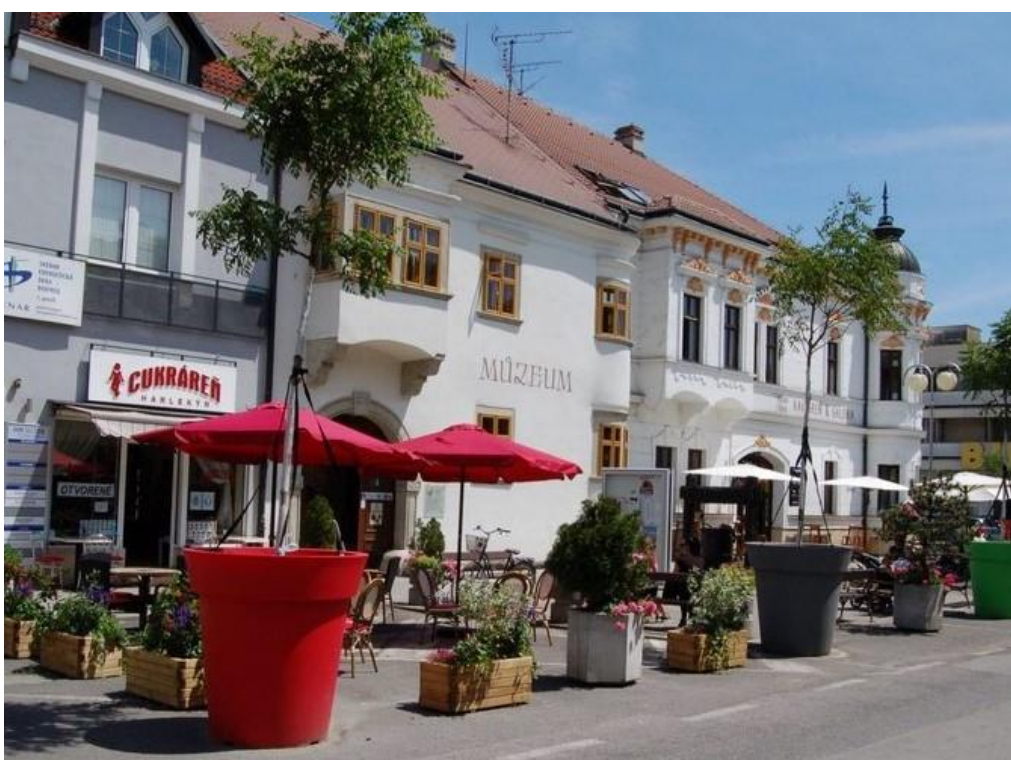
18. Pohľad na dvojicu meštianskych domov na južnom konci Ulice M. R. Štefánika.