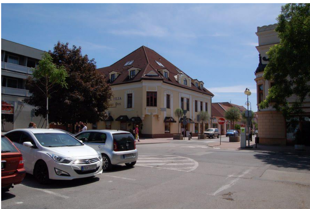
14. Pohľad z Radničného námestia smerom do Kollárovej ulice.