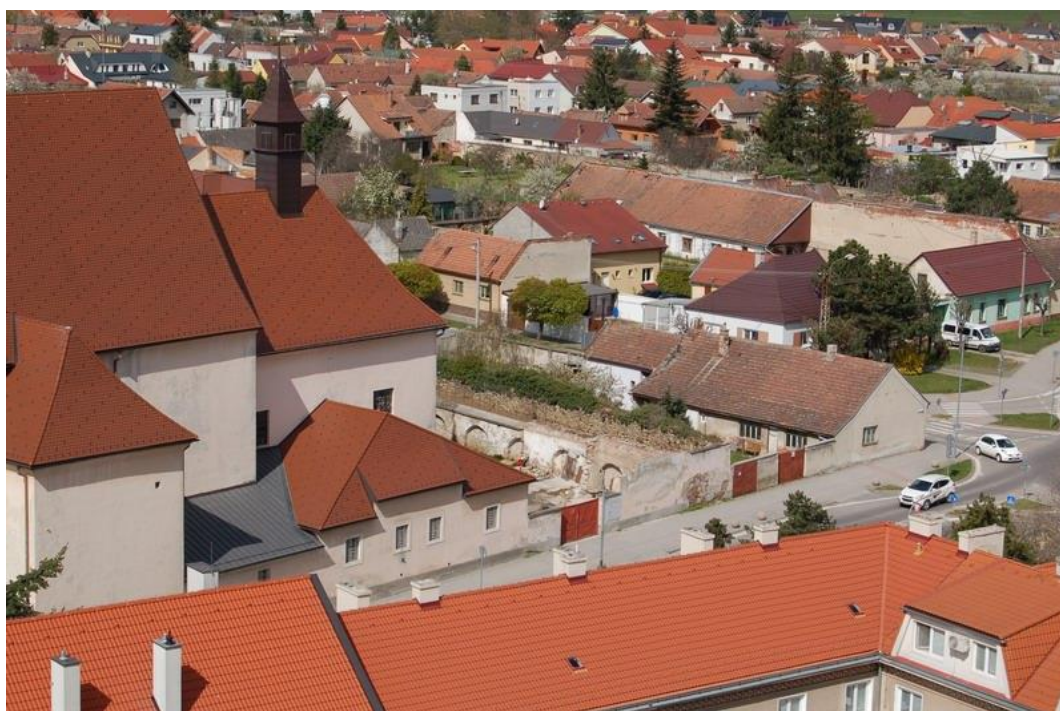
30. Pohľad na fragment severného úseku mestského opevnenia za kapucínskym kostolom. 23. 4. 2021