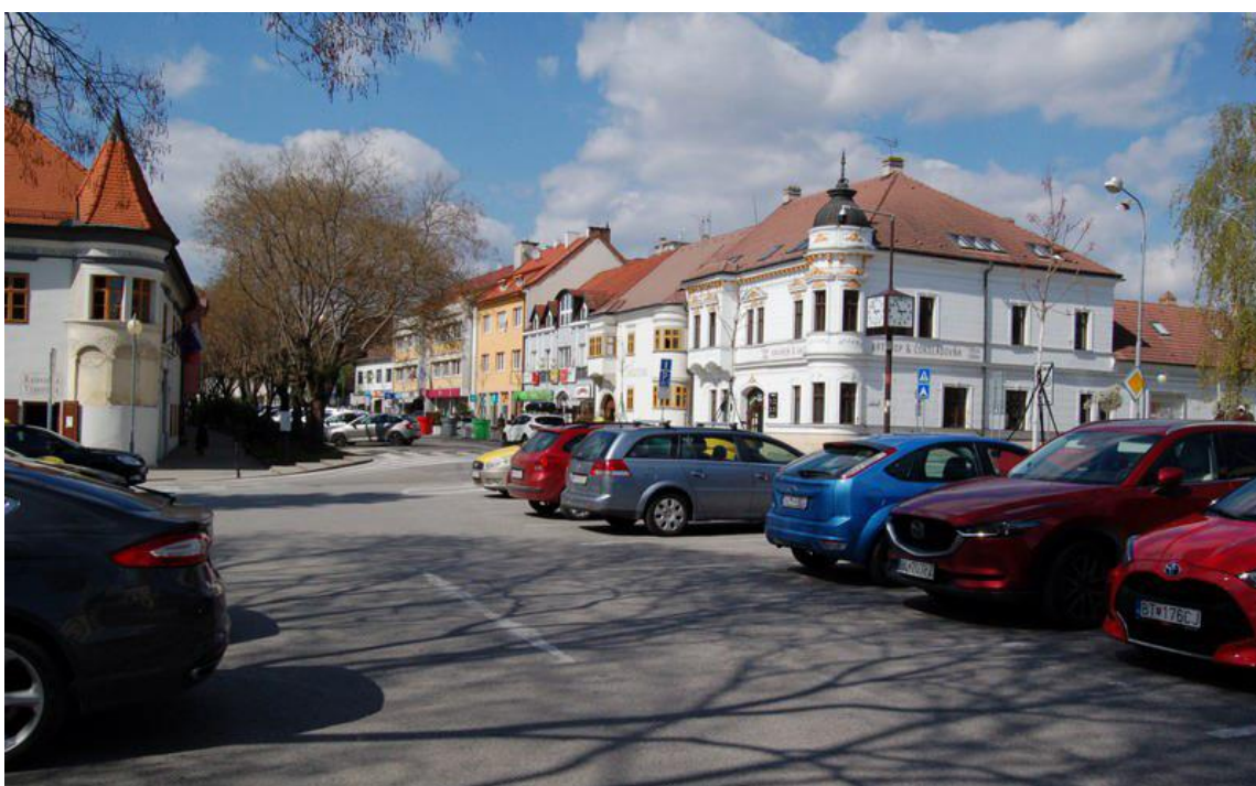
16. Ulica M. R. Štefánika z juhu.