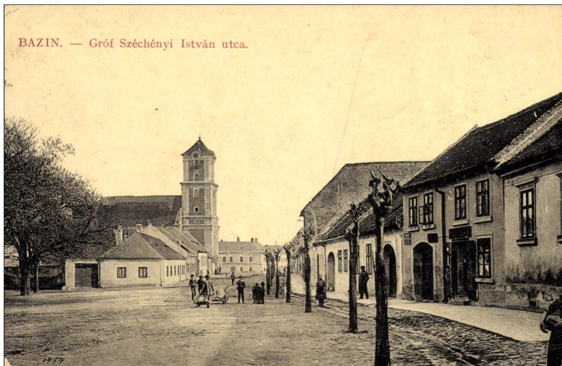
23. Severná časť Holubyho ulice, zač. 20. storočia.