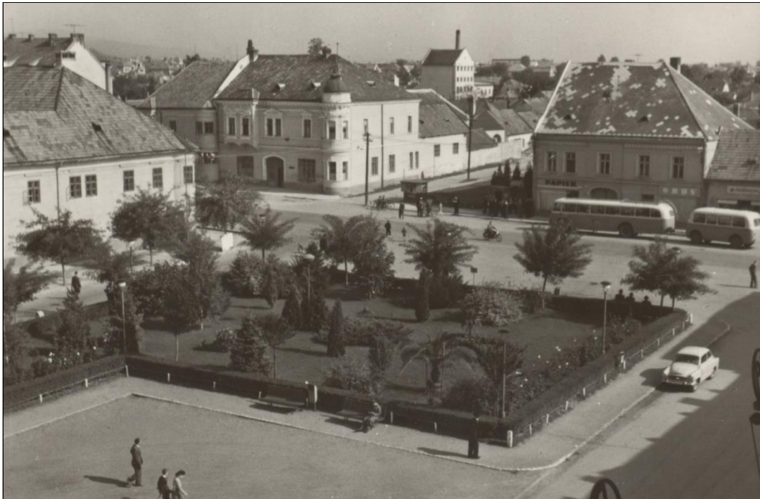
11. Parková úprava Radničného námestia, 1960, pohľad z budovu Mestského úradu.