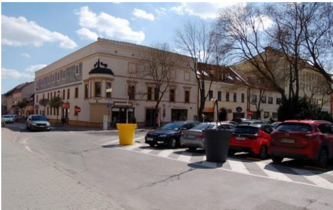
10. Južná strana Radničného námestia.