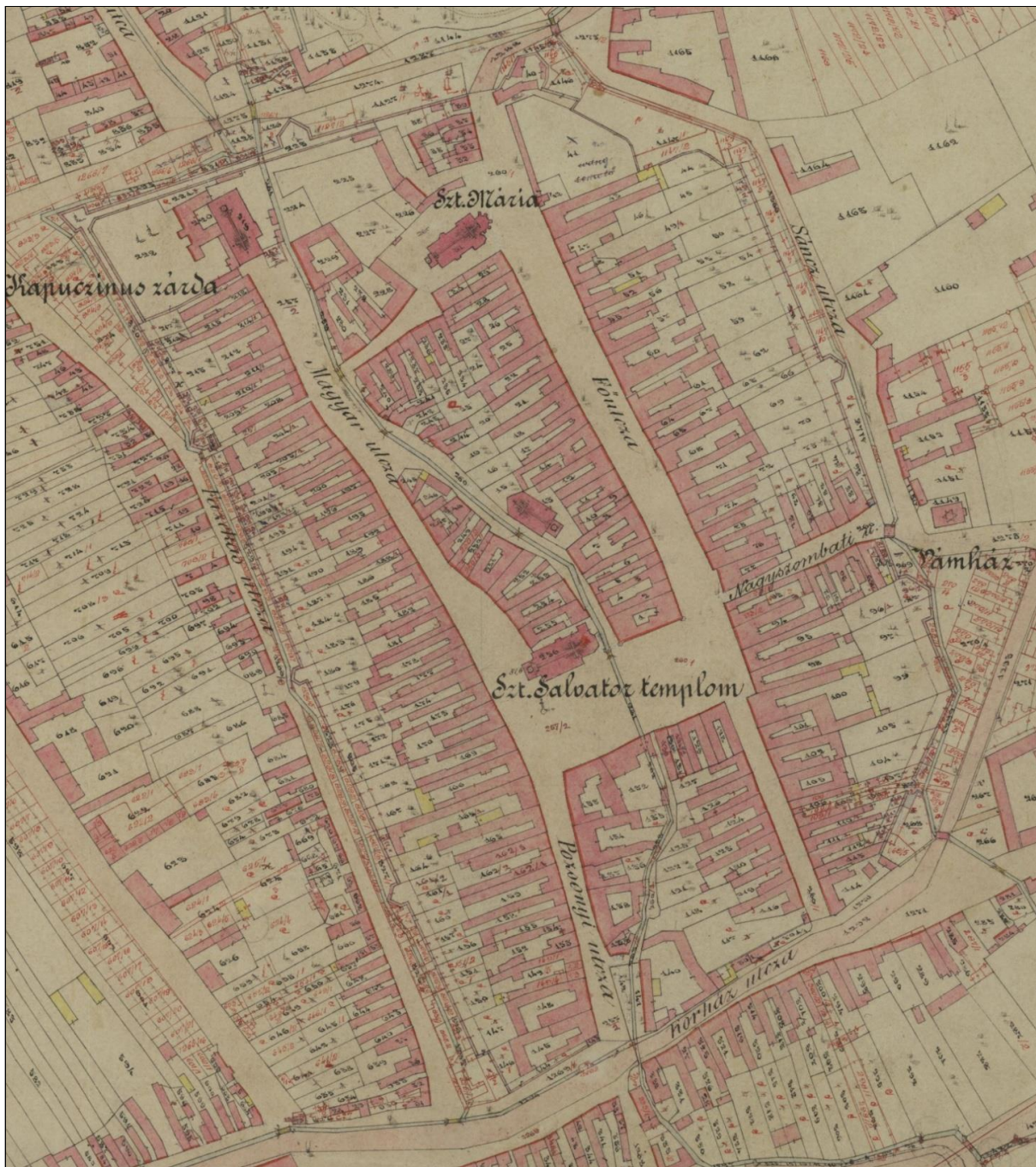
2. Výrez z katastrálnej mapy Pezinka z roku 1895.