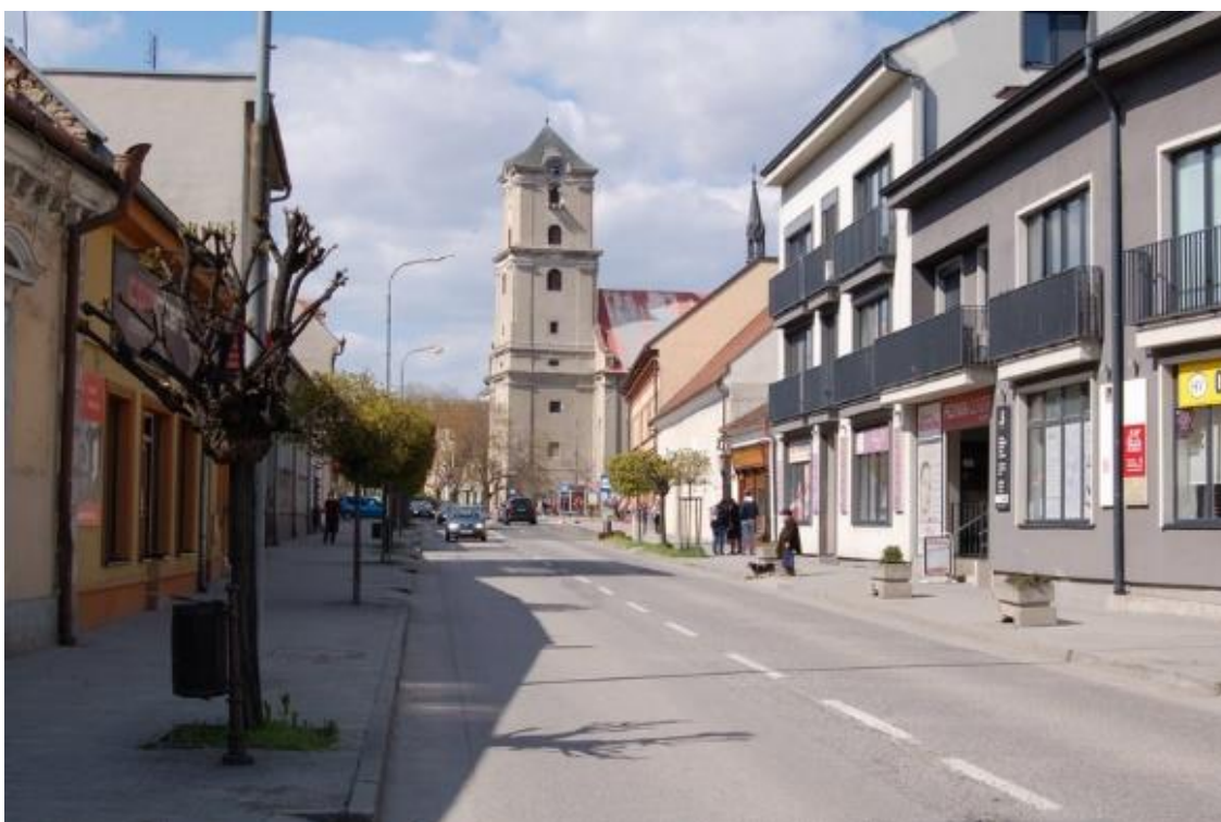
26. Južná časť Holubyho ulice.