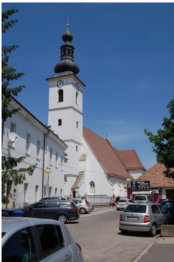
22. Pohľad do Potočnej ulice s budovou fary a farského kostola. Foto: 15. 6. 2021