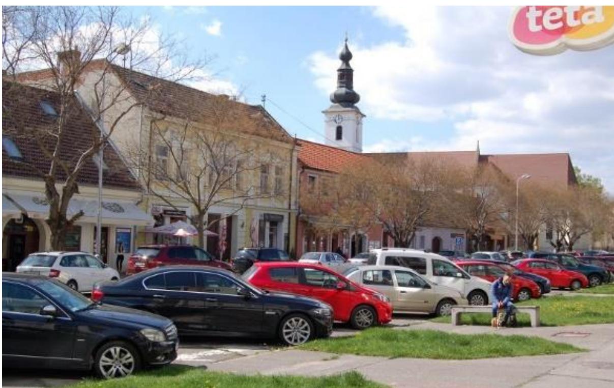
20. Západná strana Ulice M. R. Štefánika.