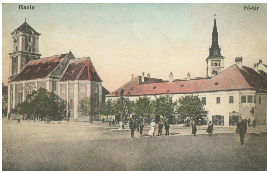
7. Severná strana Radničného námestia, 1917.