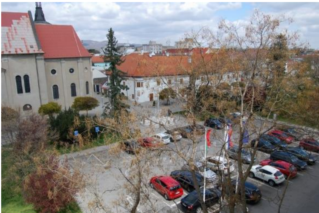
12. Parková úprava Radničného námestia, pohľad z budovu Mestského úradu.