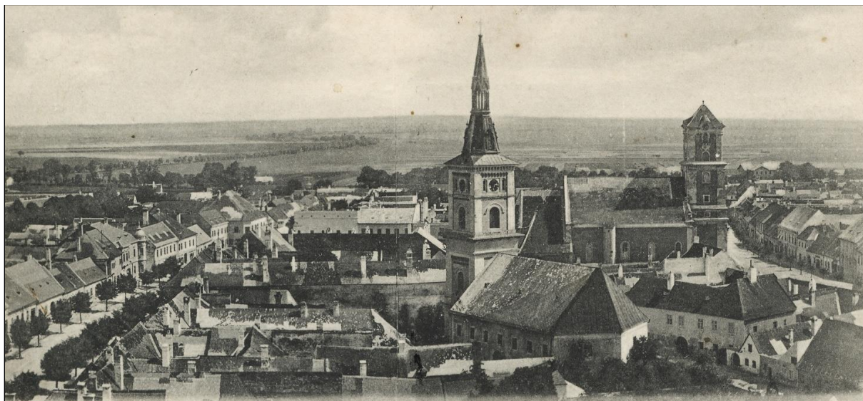
1. Pohľad z veže farského Kostola Nanebovzatia Panny Márie smerom na juh, 1908.