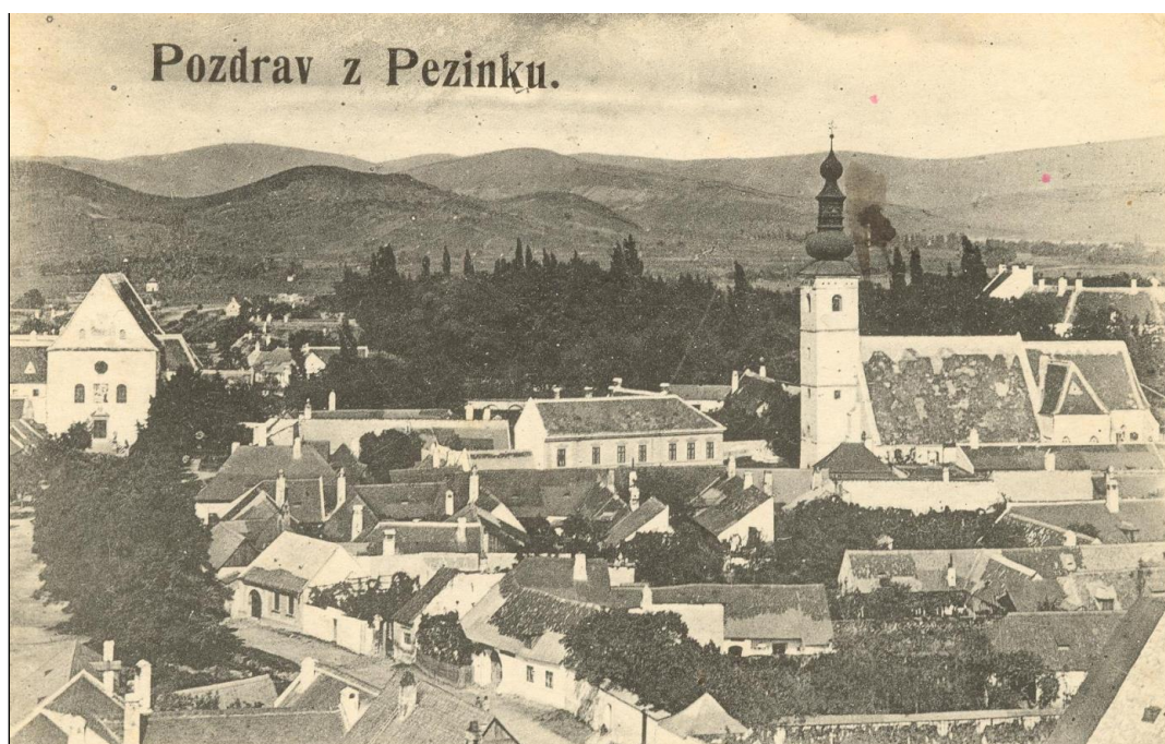
5. Pohľad z veže Kostola Premenenia Pána, tzv dolného, smerom na sever, po 1920.