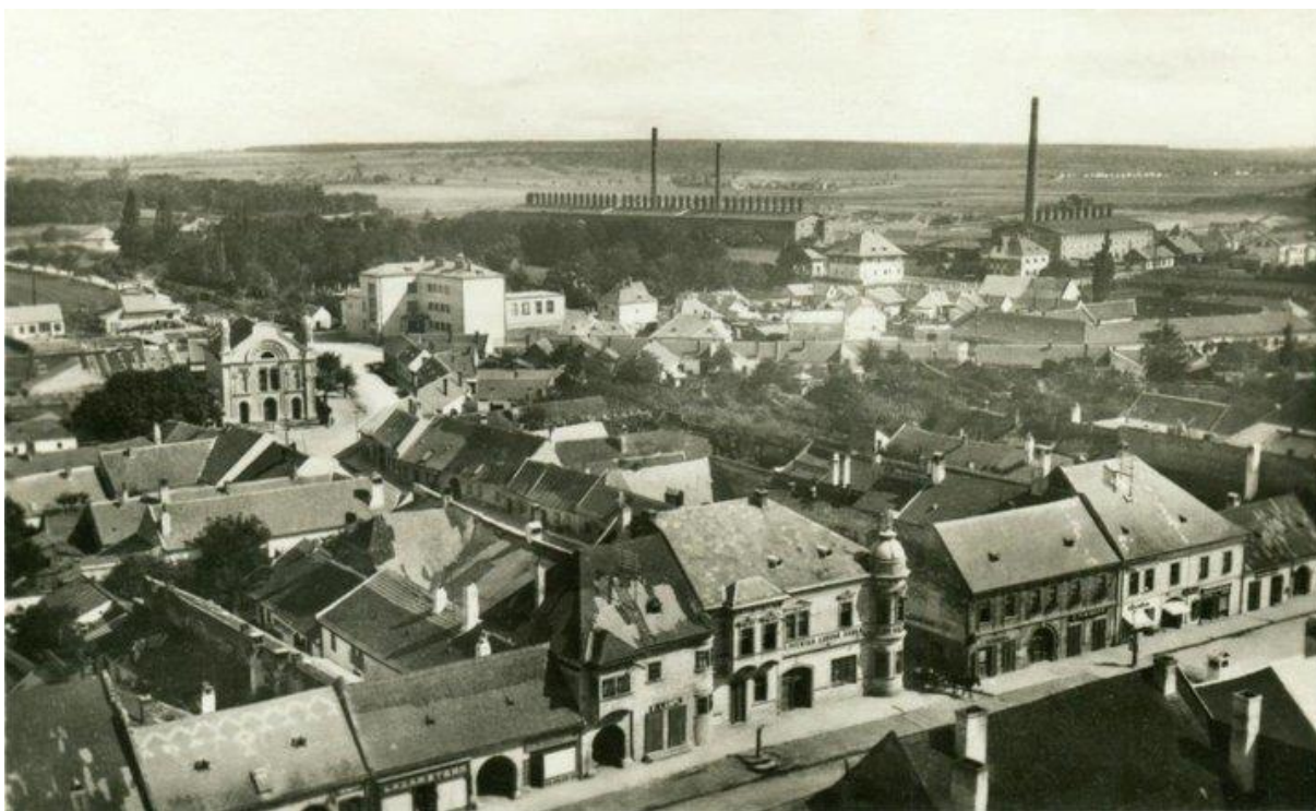
3. Pohľad z veže evanjelického kostola smerom na juhovýchod, po 1930.