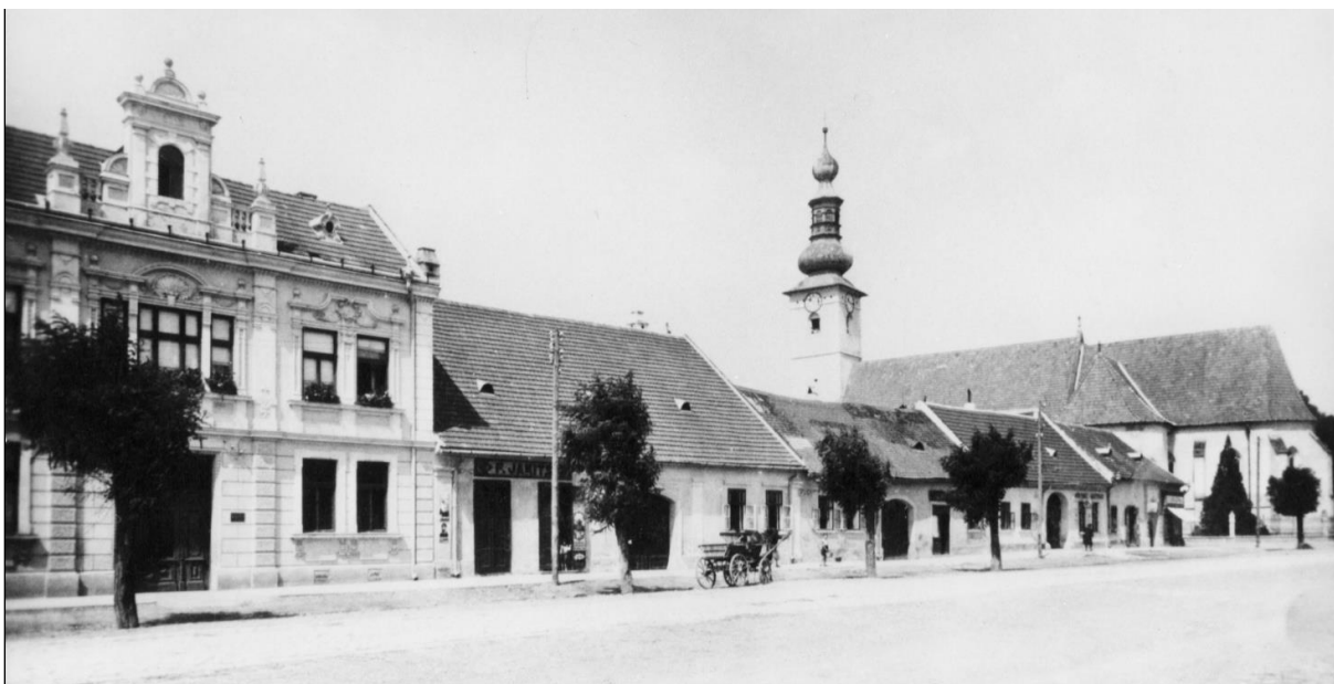
19. Západná strana Ulice M. R. Štefánika, 1. pol. 20. stor.