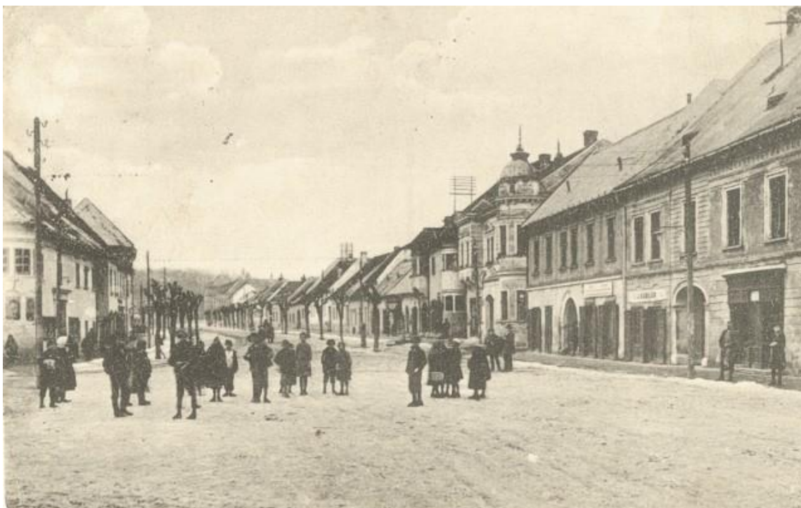
15. Ulica M. R. Štefánika z juhu, 1. pol. 20. storočia.