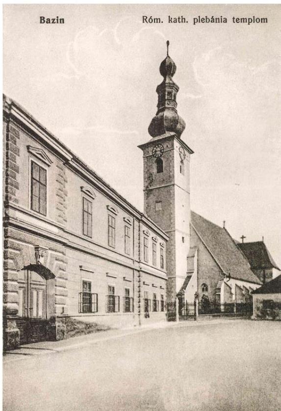
21. Pohľad do Potočnej ulice s budovou fary a farského kostola.