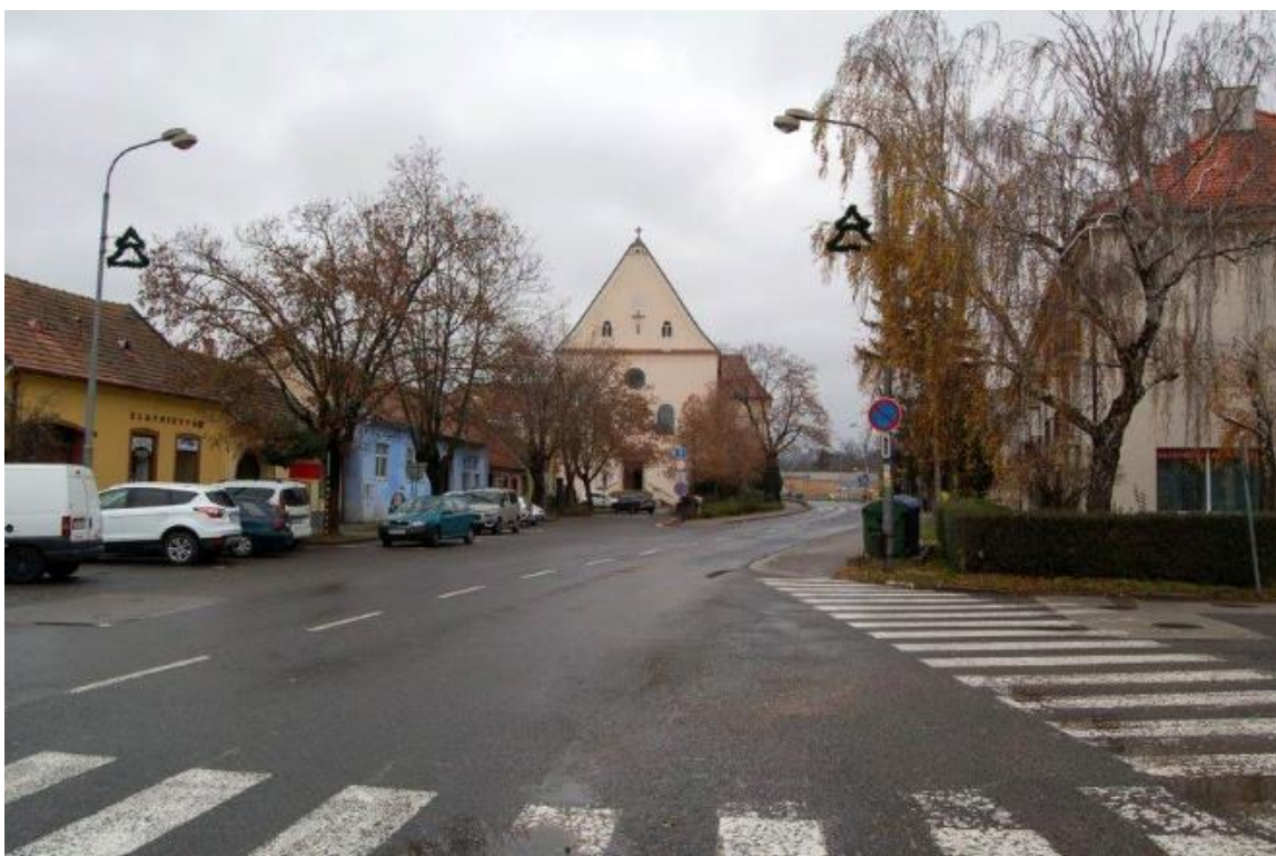
28. Severná časť Holubyho ulice s kapucínskym kostolom v pozadí.