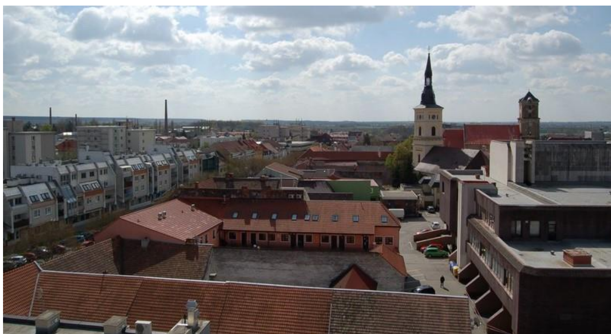
2. Pohľad z veže farského Kostola Nanebovzatia Panny Márie smerom na juh.