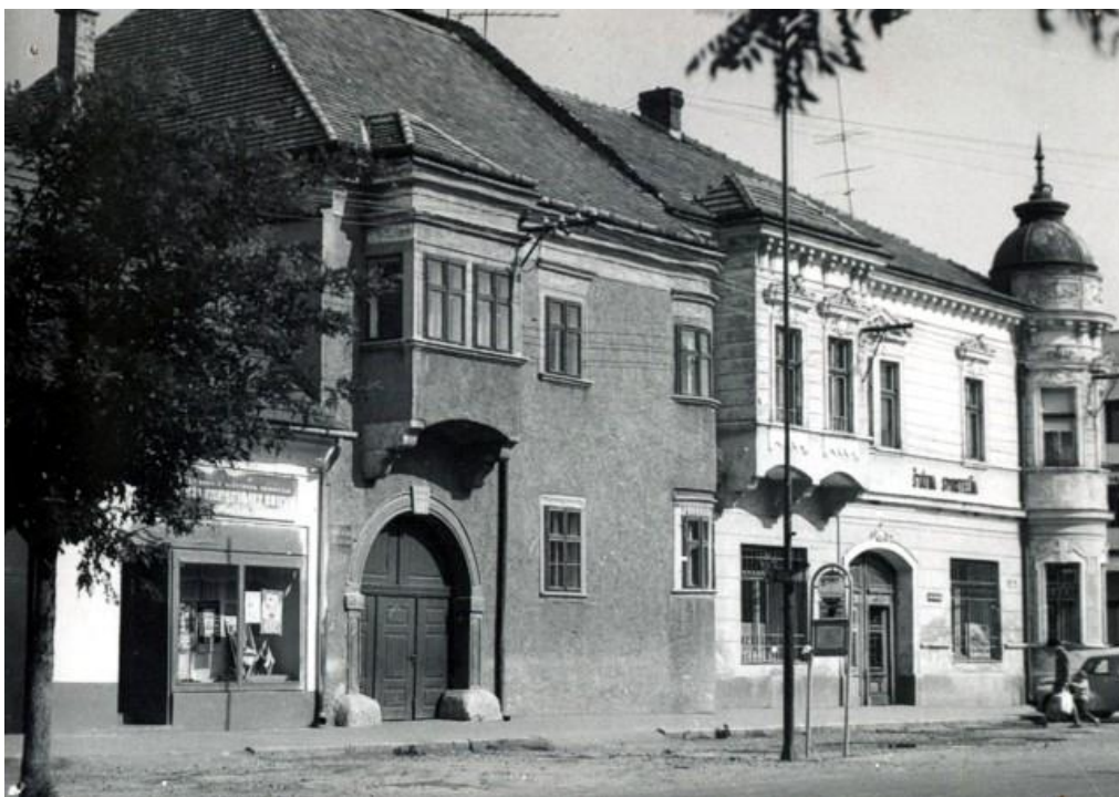
17. Pohľad na dvojicu meštianskych domov na južnom konci Ulice M. R. Štefánika.