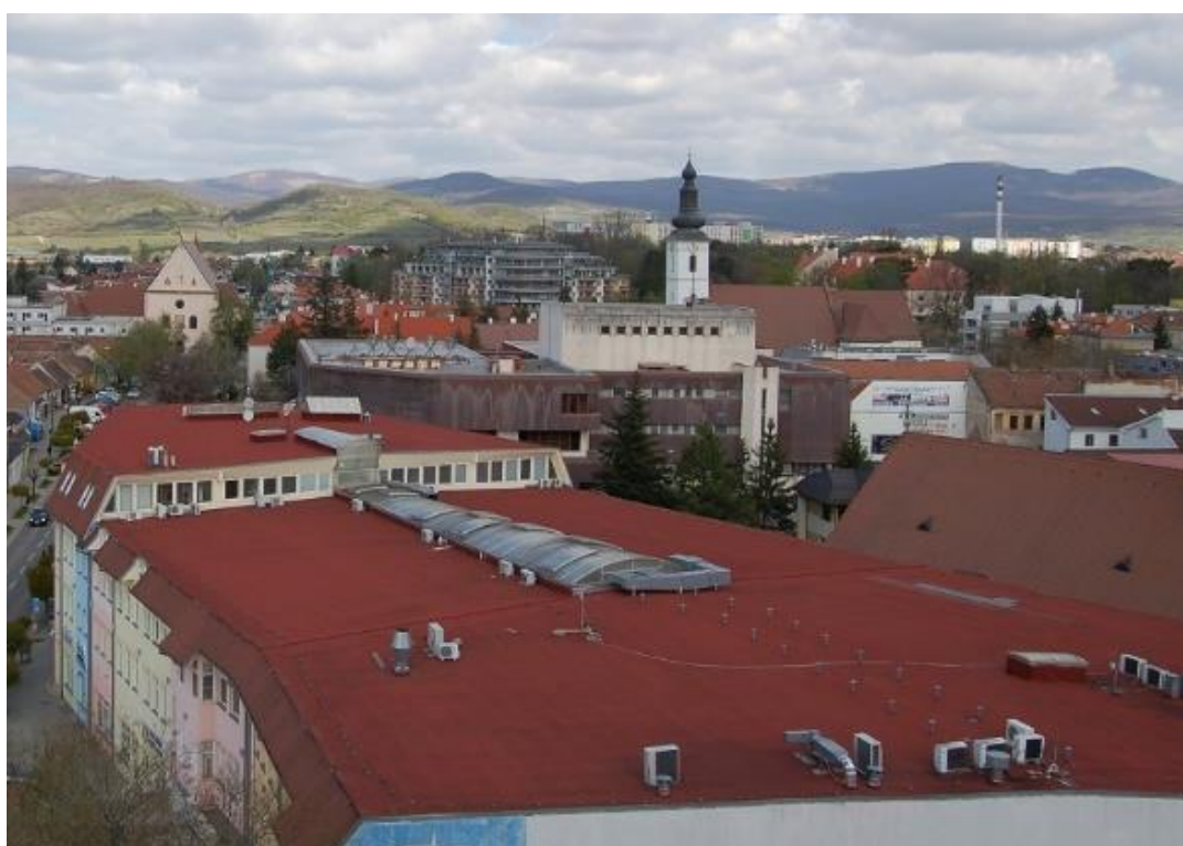
6. Pohľad z veže Kostola Premenenia Pána, tzv dolného, smerom na sever.