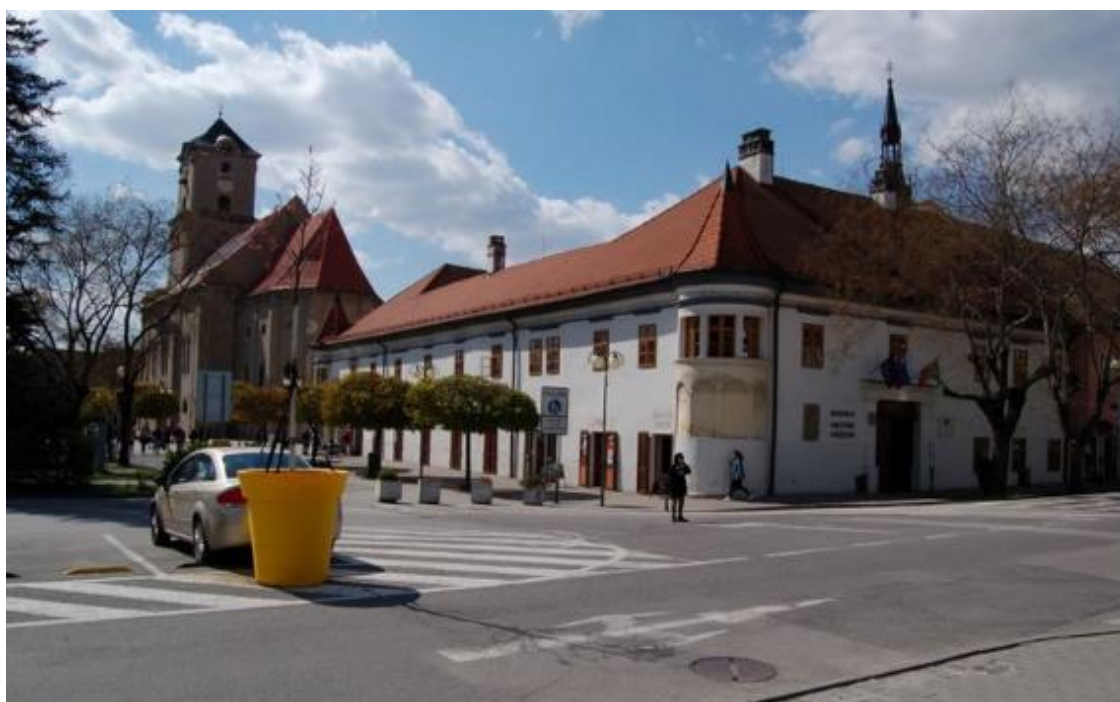
8. Severná strana Radničného námestia.