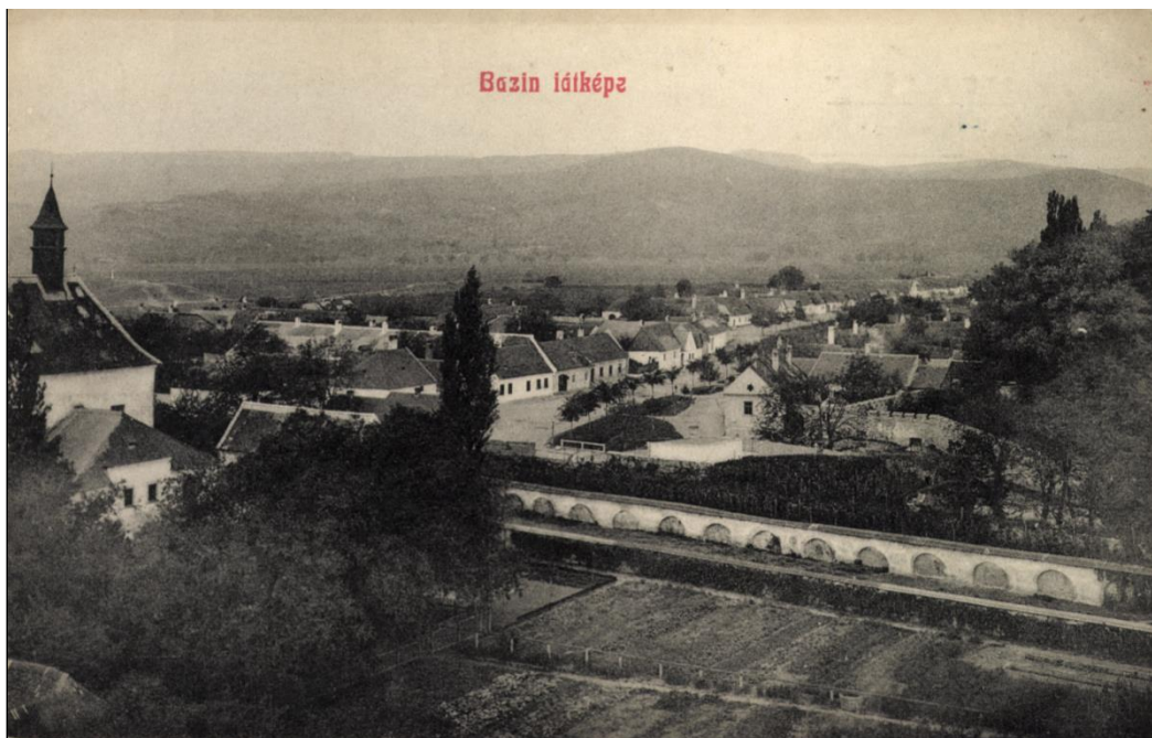
29. Úžitková záhrada kláštora kapucínov so severným úsekom mestského opevnenia s bastiónom s priehľadom do Kupeckého ulice, pred 1918.