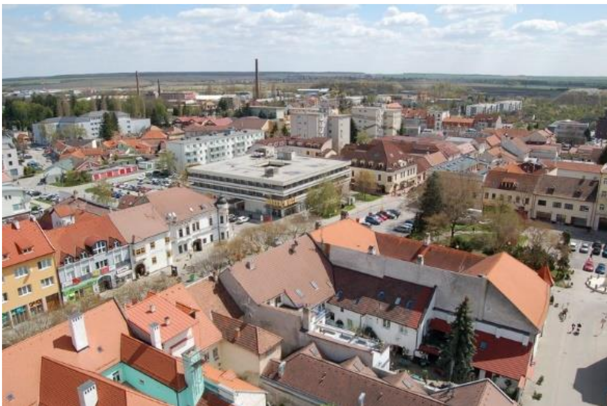
4. Pohľad z veže evanjelického kostola smerom na juhovýchod.