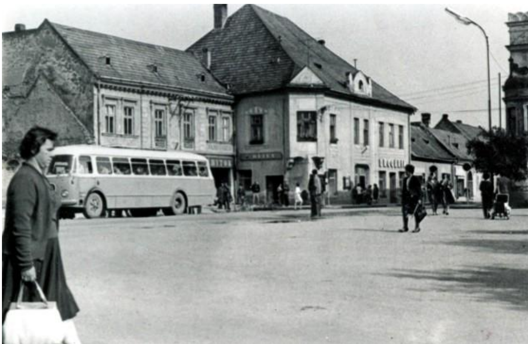
13. Pohľad z Radničného námestia smerom do Kollárovej ulice.