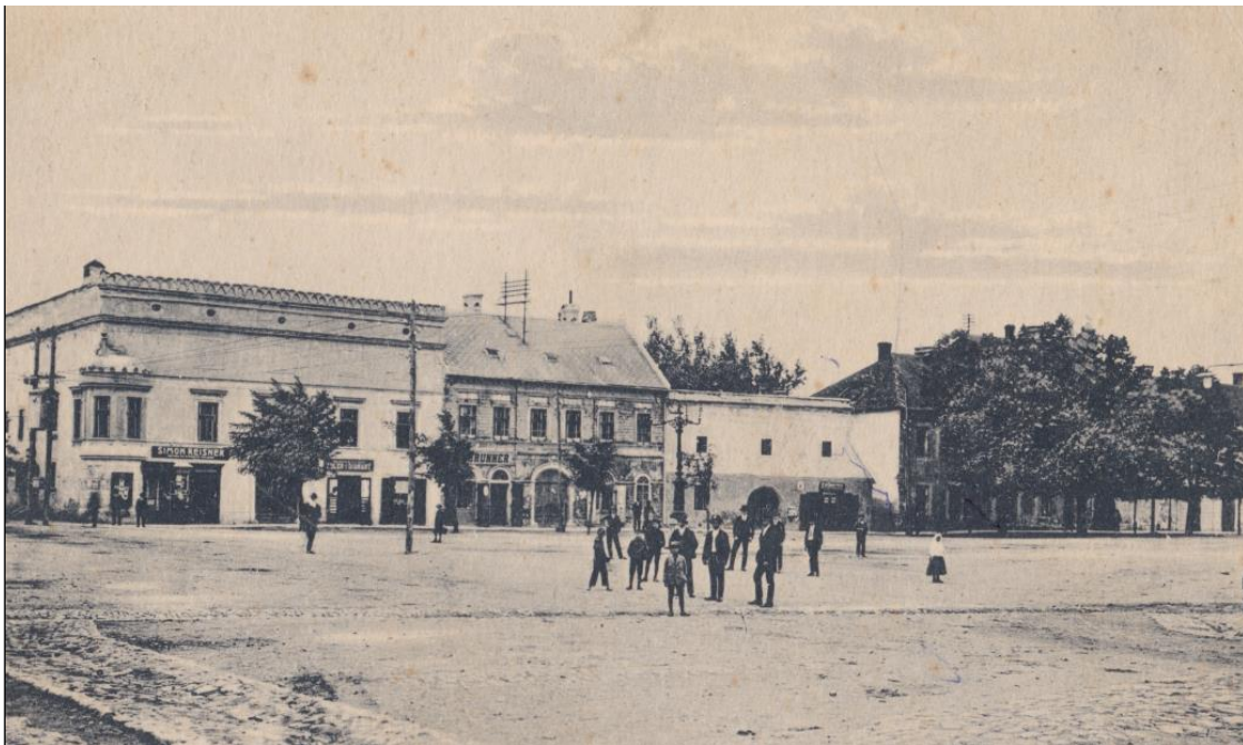
9. Južná strana Radničného námestia, 1923.