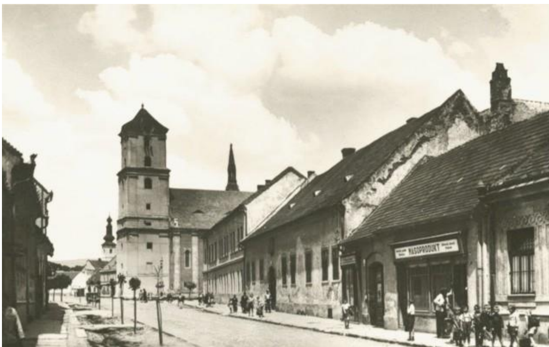
25. Južná časť Holubyho ulice, 1. pol. 20. stor.