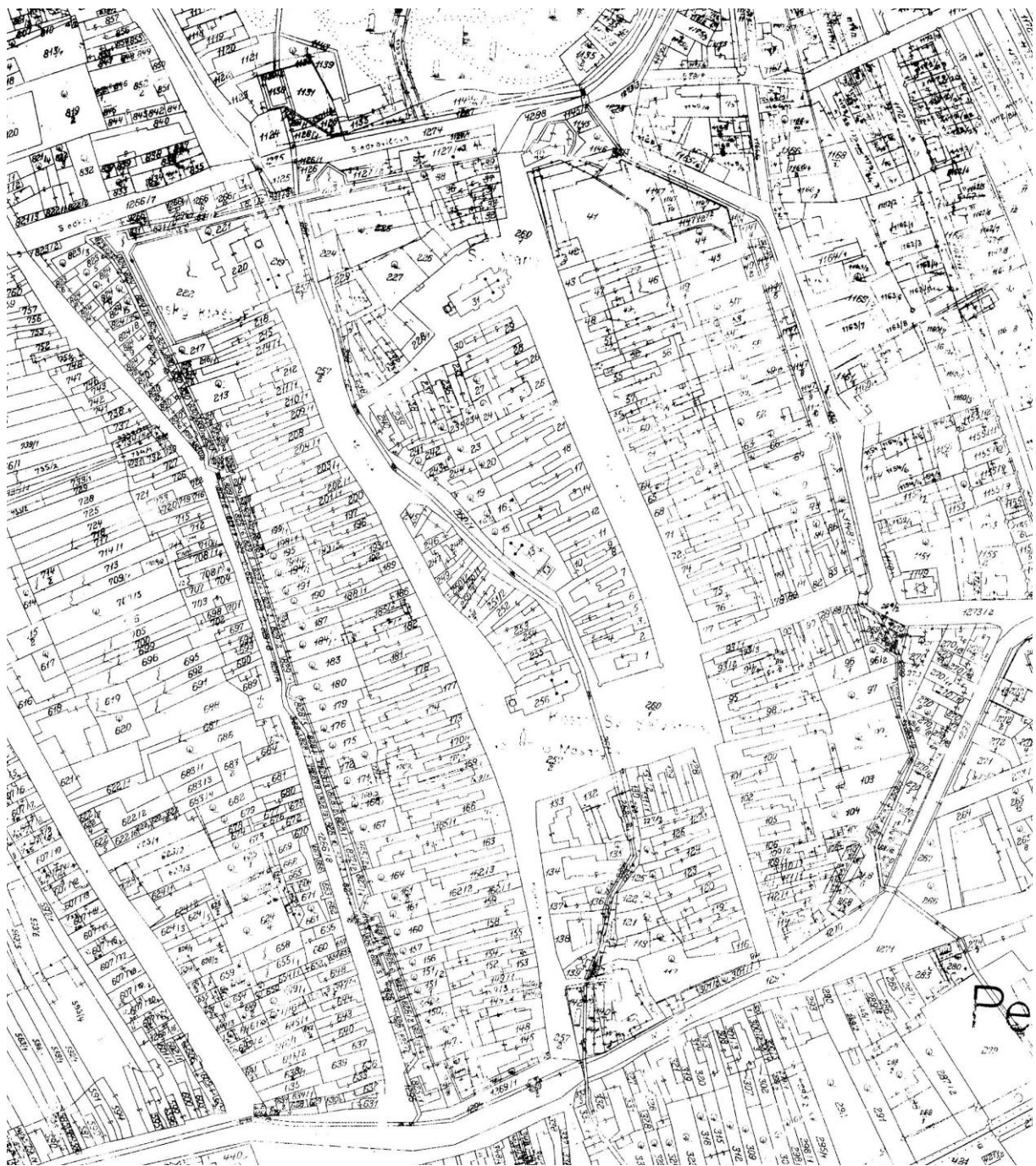
3. Výrez z katastrálnej mapy Pezinka z roku 1933