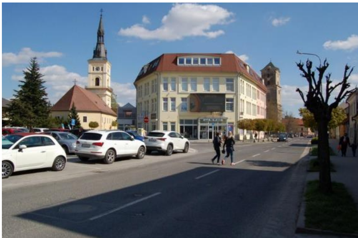
24. Severná časť Holubyho ulice.