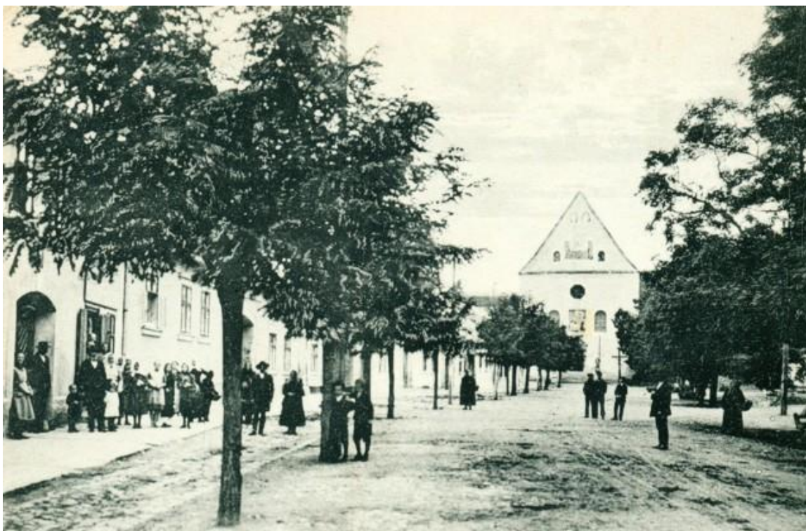
27. Severná časť Holubyho ulice s kapucínskym kostolom v pozadí, 1. polovica 20. storočia.