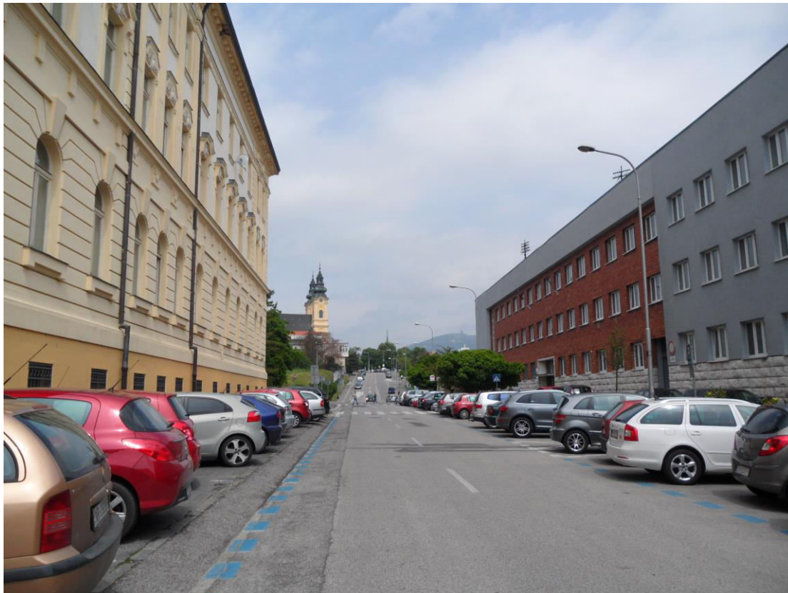
K. 9 Ulica Damborského s priehľadom na Kostol sv.Ladislava, naľavo budova Krajského a okresného súdu, napravo budova bývalých finančných úradov (J. Merganc)