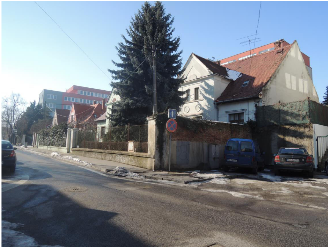
K. 5 Pohľad na súbor rodinných domov v rondokubistickom štýle so zachovanými autentickými detailmi