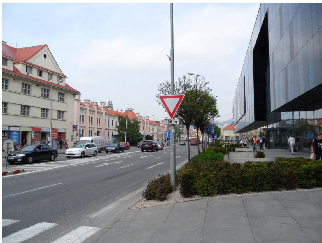
K. 15 Štefánikova trieda, naľavo pôvodná historická zástavba