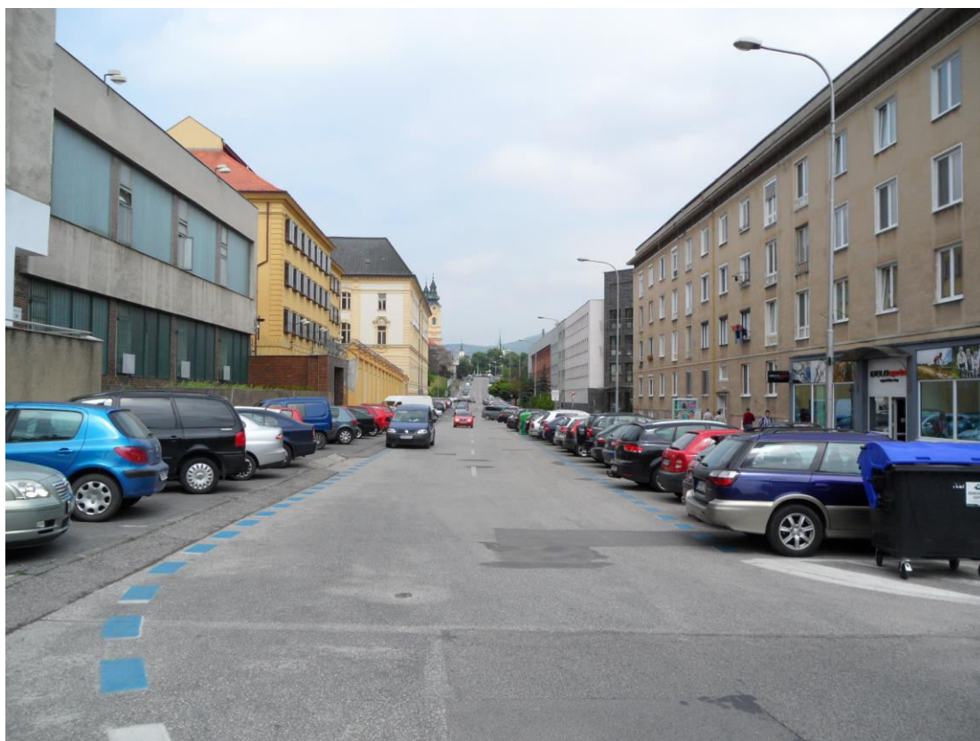
K. 7 Ulica Damborského, naľavo areál Krajského a okresného súdu s väznicou