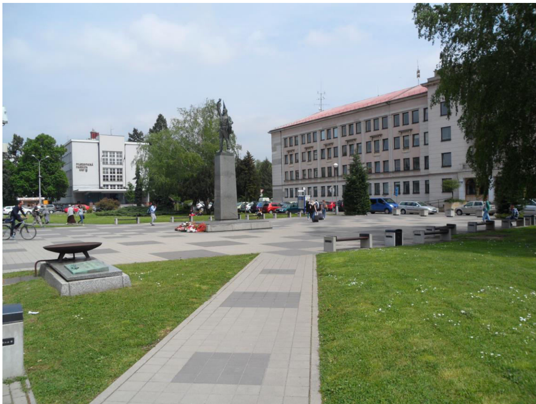
K. 18 Štefánikova trieda, predpolie dnešného Okresného úradu v Nitre (bývalý internát Pedagogického inštitútu v Nitre)