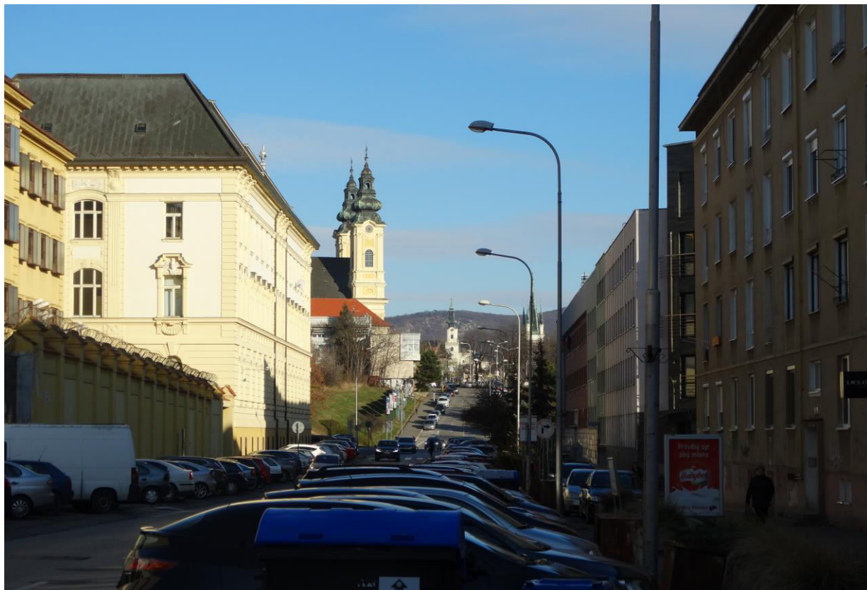
K. 6 Pohľad z ulice Damborského na Nitriansky hrad a piaristický kostol – chránený interiérový pohľad č.23