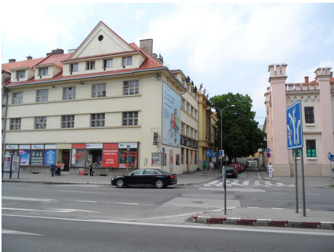
K. 14 Pohľad do ulice 7. pešieho pluku zo Štefánikovej triedy