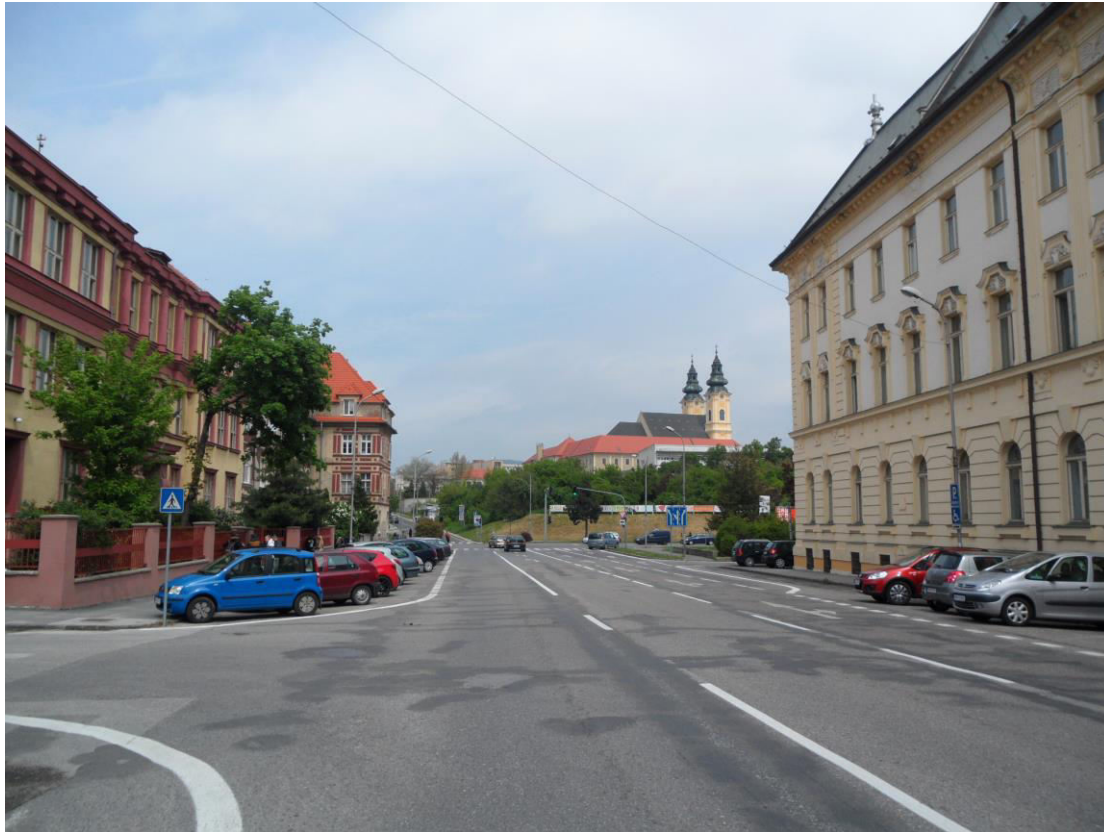
K. 3 Ulica Cintorínska, naľavo rondokubistický obytný súbor a napravo bývalý Justičný palác (dnes Krajský a okresný súd) s priehľadom na dvojvežie Kostola sv. Ladislava