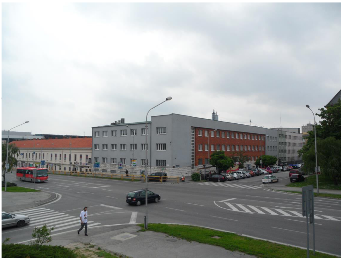
K. 10 Križovatka ulíc Štúrova a Damborského a náročná funkcionalistická budova bývalých finančných úradov (J. Merganc, 1931)