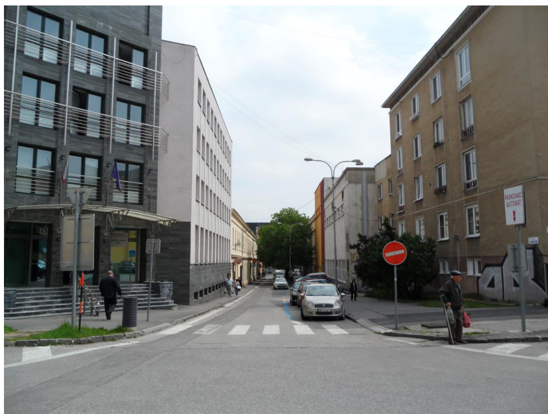
K. 8 Pohľad do ulice 7. pešieho pluku z ulice Damborského