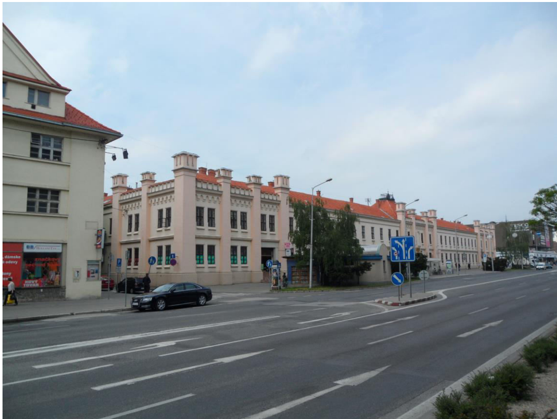
K. 13 Štefánikova trieda a budova bývalej Kasárne (dnes Mestská tržnica)