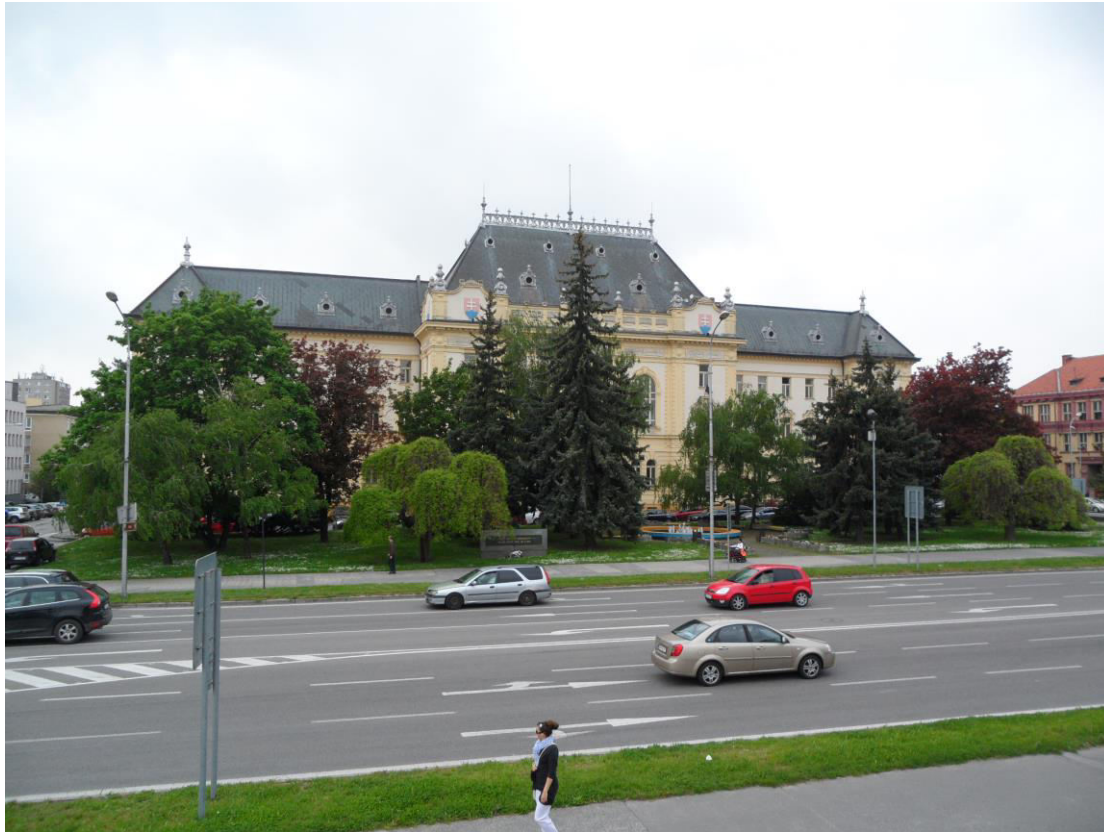
K. 1 Pohľad na budovu Krajského a okresného súdu (bývalý Justičný palác) s predpolím s parkovou úpravou