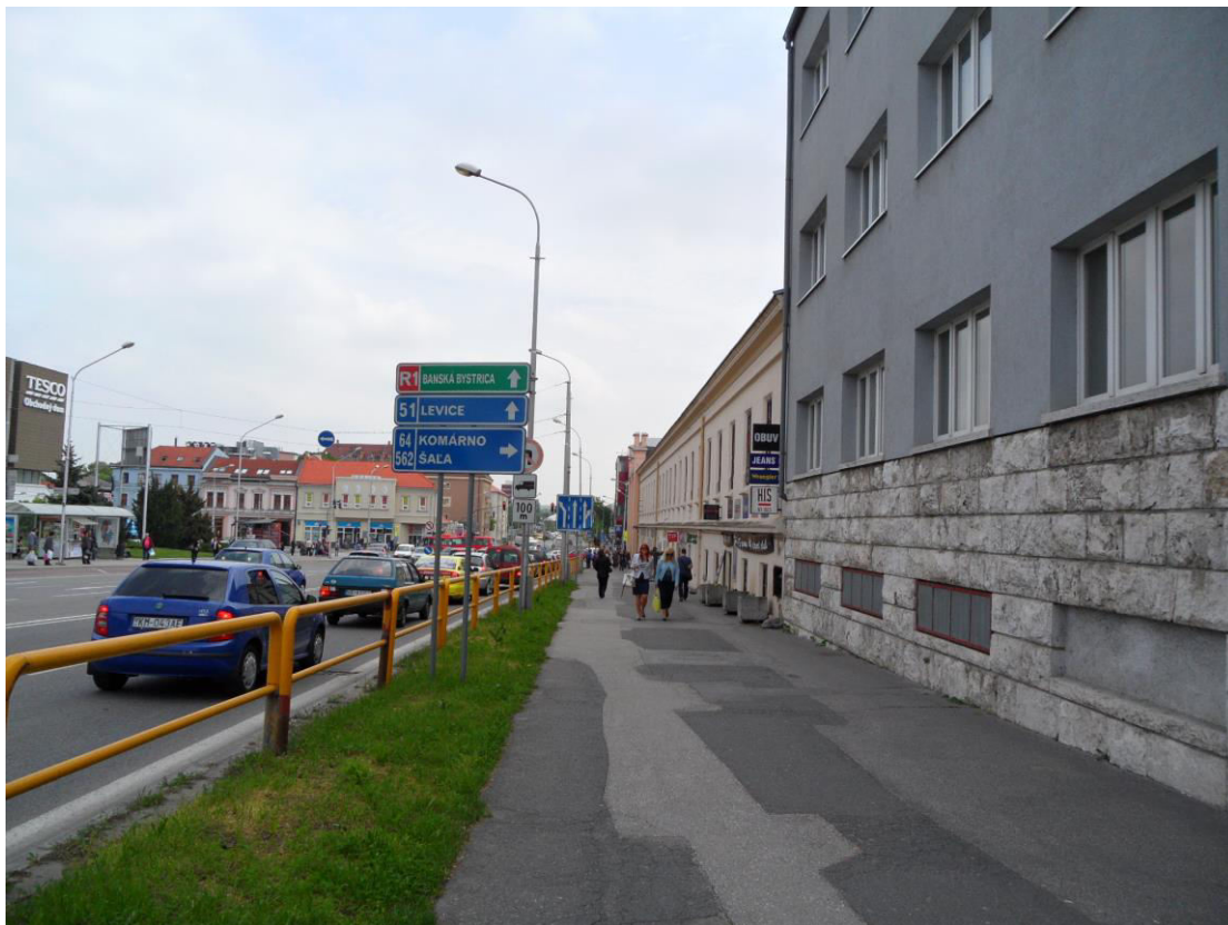
K. 12 Frekventovaná ulica Štúrova, napravo budova bývalých finančných úradov a bývalá Kasáreň (dnes Mestská tržnica)