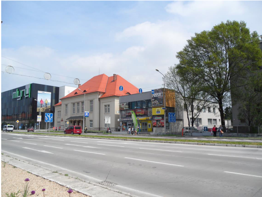
K. 17 Štefánikova trieda, historická budova bývalého Živnostenského domu (M. Harminc, 1928) v kontakte s novodobou zástavbou zo začiatku 21. storočia