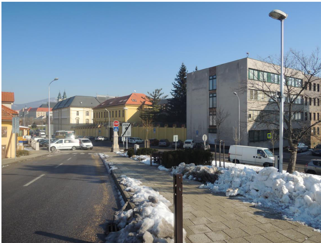
K. 4 Pohľad na areál Krajského a okresného súdu s väznicou na ulici Cintorínska