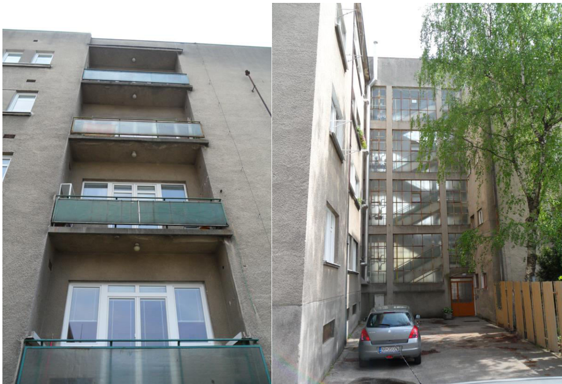
K. 20 Ulica Hodžova, funkcionalistický bytový dom, detail riešenia lodžii a celopresklený spojovací krčok so schodiskom