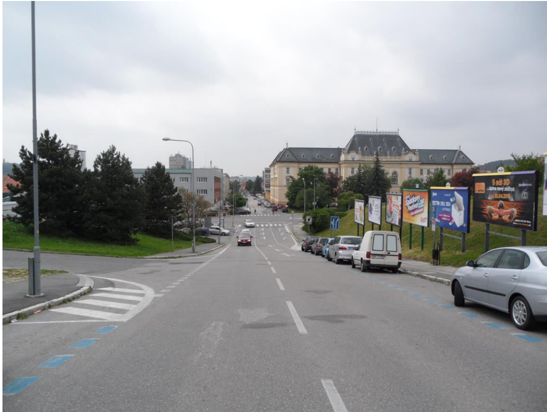
K. 11 Pohľad z ulice Piaristická v jednej osi s napojením na ulicu Damborského