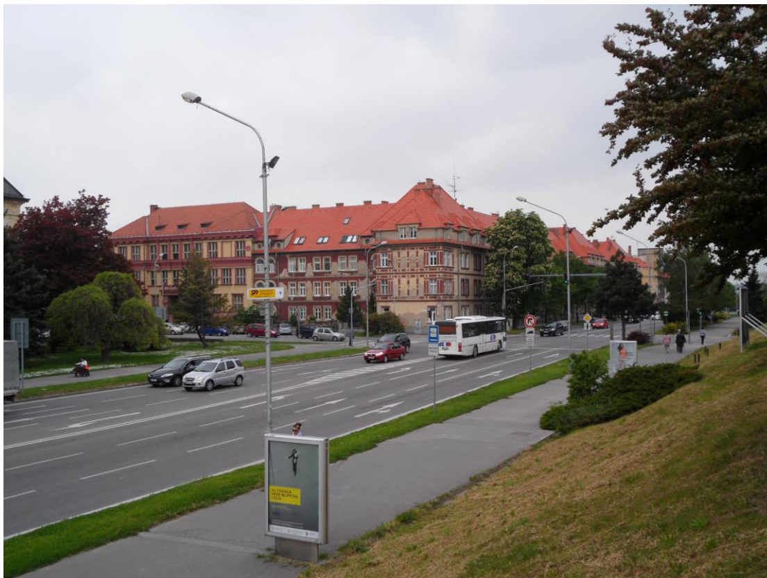
K. 2 Pohľad na obytný súbor v avantgardnom architektonickom štýle – rondokubizmus (F. Krupka, 1922)