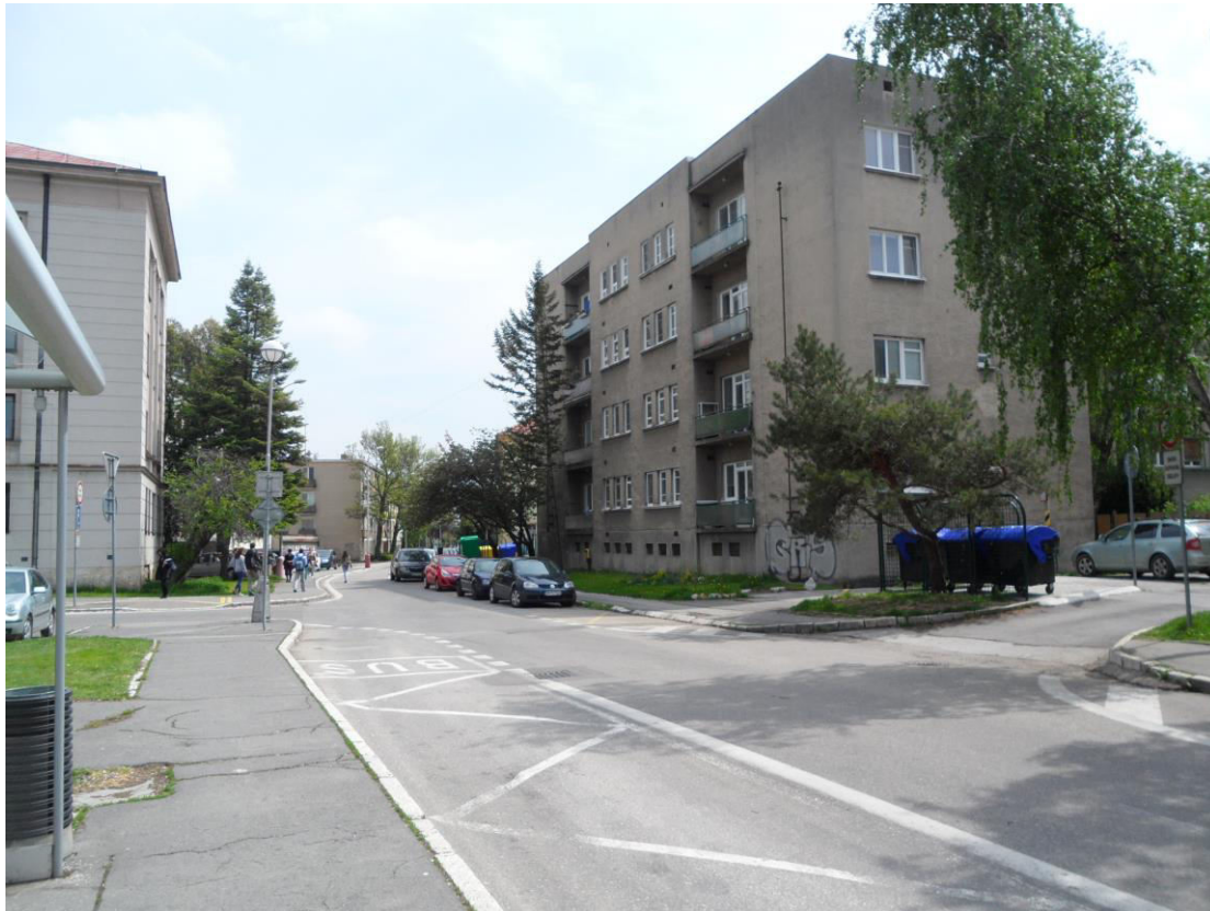
K. 19 Ulica Hodžova, napravo funkcionalistický bytový dom (40. roky 20. storočia)