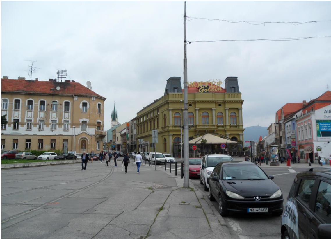
J. 1 Pohľad na križovatku ulíc Farská a Štefánikova, naľavo chýbajúca historická zástavba, asanovaná v 70. rokoch 20. storočia - chránený interiérový pohľad č. 15