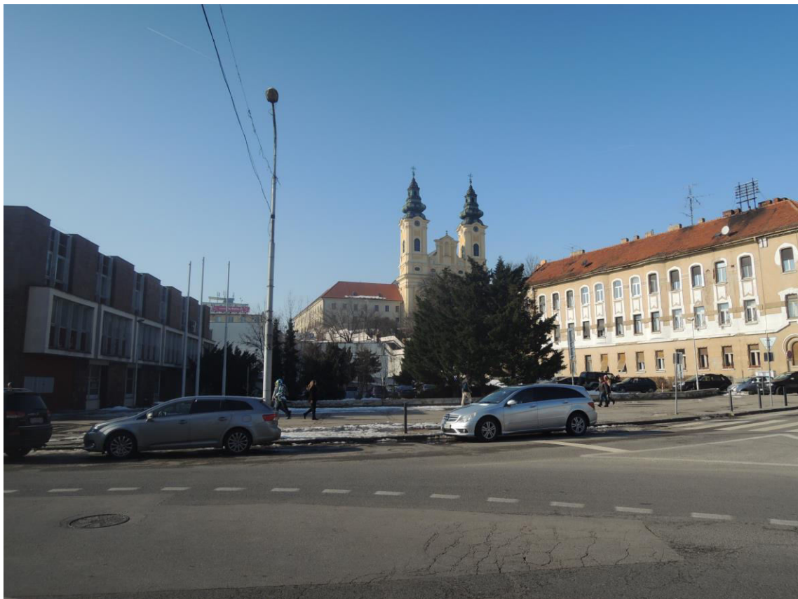
J. 2 Parková úprava nezastavanej plochy vzniknutej po plošnej asanácii v 70. rokoch 20. storočia, priehľad na Kostol sv. Ladislava - v chránenom interiérovom pohľade č. 14