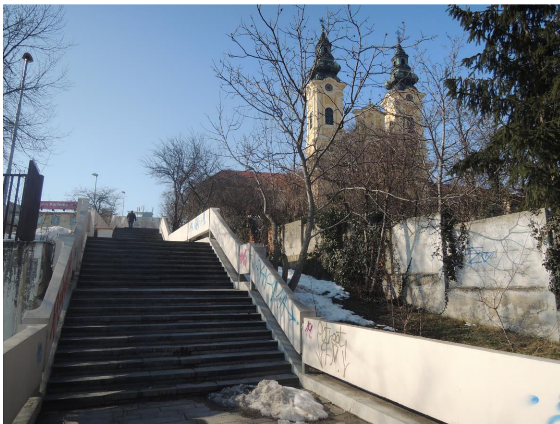
J. 11 Terénne schodisko prepájajúce ulice Farská a Piaristická (na mieste pôvodného historického)