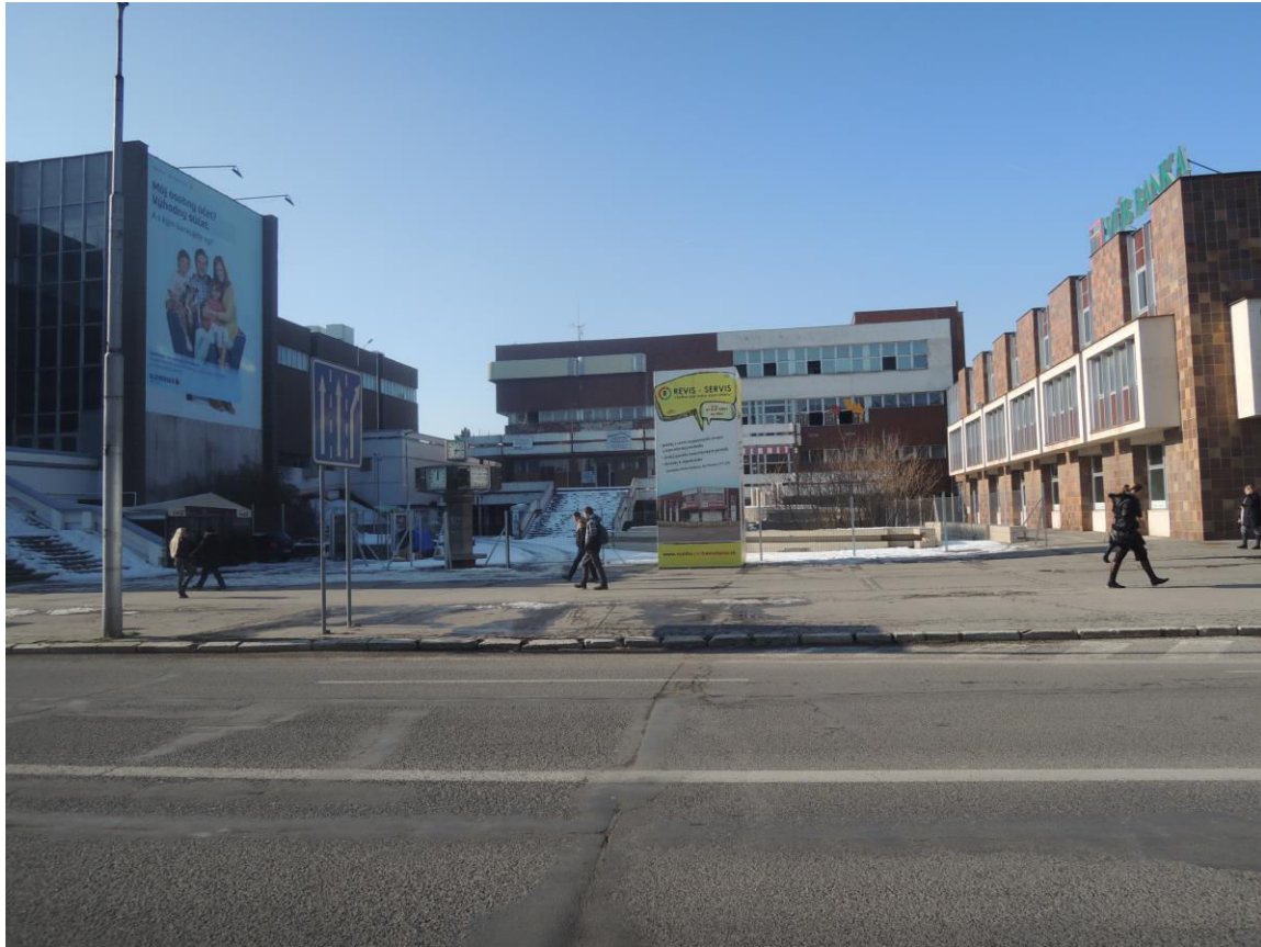
J. 5 Štefánikova trieda, bývalé kino Orbis predpolím na mieste asanovanej radovej historickej zástavby