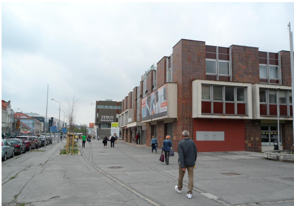
J. 4 Štefánikova trieda, napravo zástavba zo 70-tych rokov 20. storočia na mieste asanovanej historickej zástavby mestského bloku