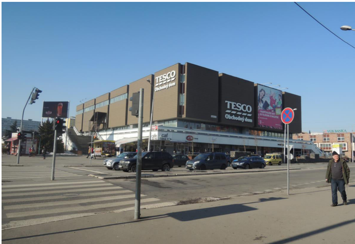
J. 6 Pohľad na obchodný dom Tesco (bývalý Prior)