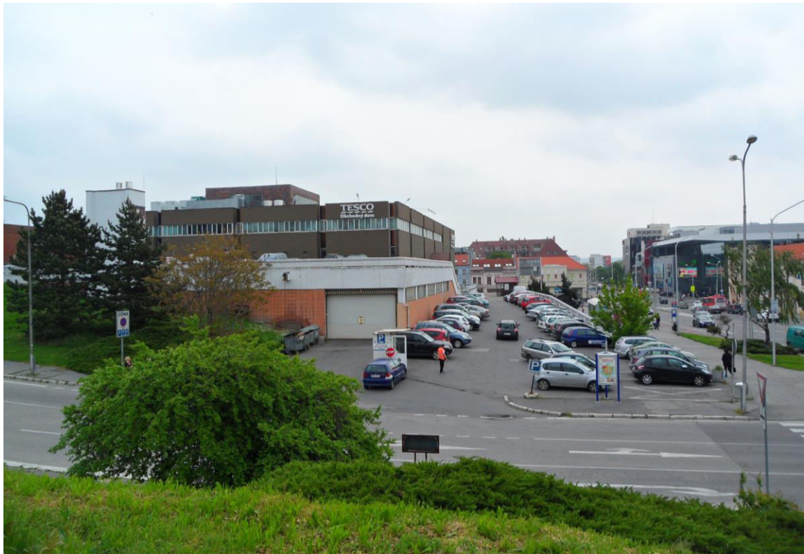
J. 7 Pohľad na obchodný dom Tesco (bývalý Prior) s terasovitým parkoviskom