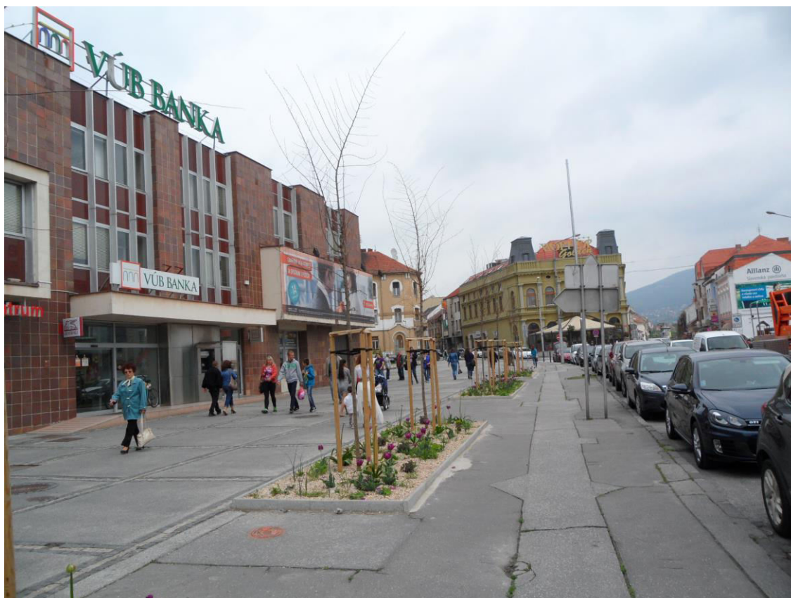
J. 3 Štefánikova trieda, naľavo budova dnešnej banky na mieste asanovanej historickej zástavby mestského bloku