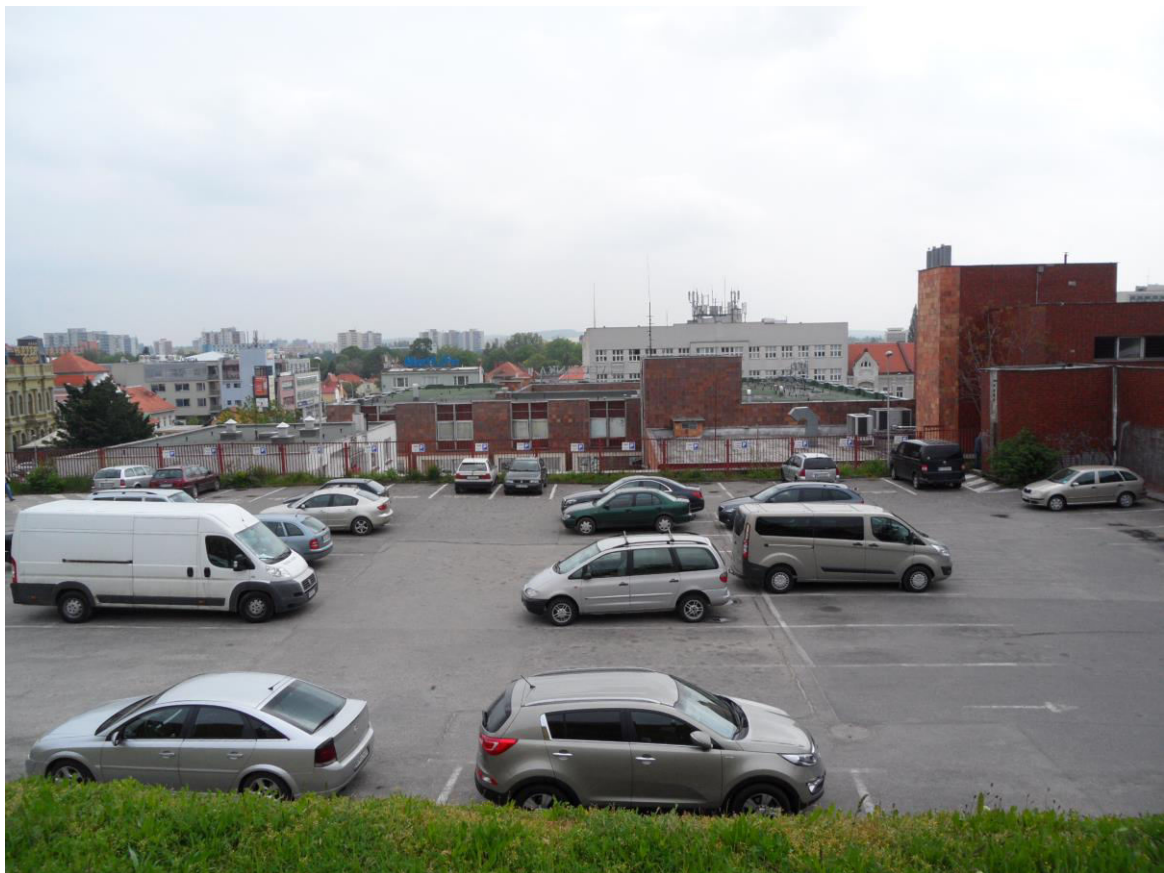
J. 8 Pohľad na terasovité parkovisko za obchodným domom Tesco a kinom Orbis