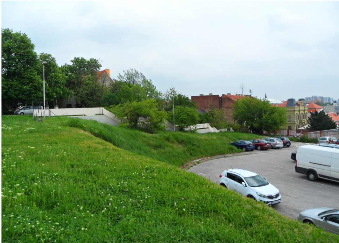
J. 9 Časť terénne neupravenej zelenej plochy, ktorá ostala po asanácii bloku historickej zástavby v severnej časti sektoru J