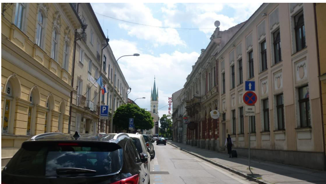
A. 4. Pohľad do ulice Farská od Župného námestia, v pozadí dominujúca veža Kostola Navštívenia Panny Márie - v chránenom interiérovom pohľade č. 6