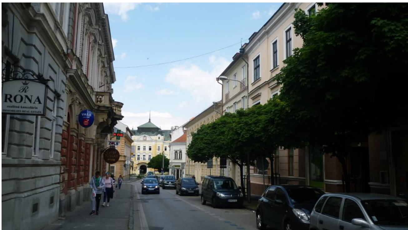
A. 1. Pohľad z juhu na zástavbu severného konca ulice Farská, v pozadí župný dom