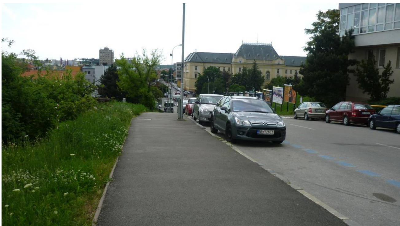
A. 22 Pohľad z ulice Piaristická na budovu Okresného súdu