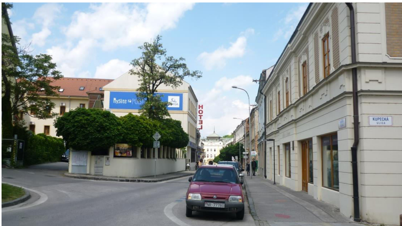
A. 3. Pohľad do ulice Farská z rázcestia s ulicou Kupecká, smerom na sever - v chránenom interiérovom pohľade č. 5