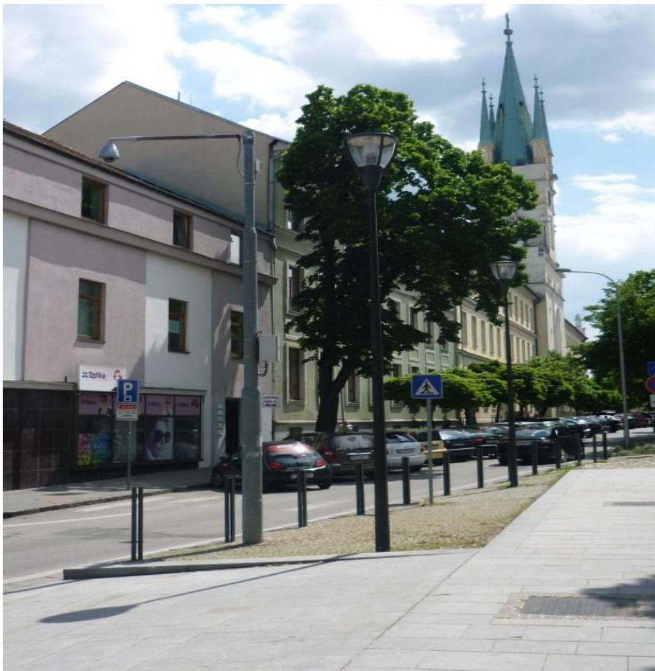
A. 6. Pohľad do ulice Farská z priestoru pred Kostolom sv. Michala Na Vršku, smerom na juh, kompozícia zástavby, zelene a úpravy spevnenej plochy