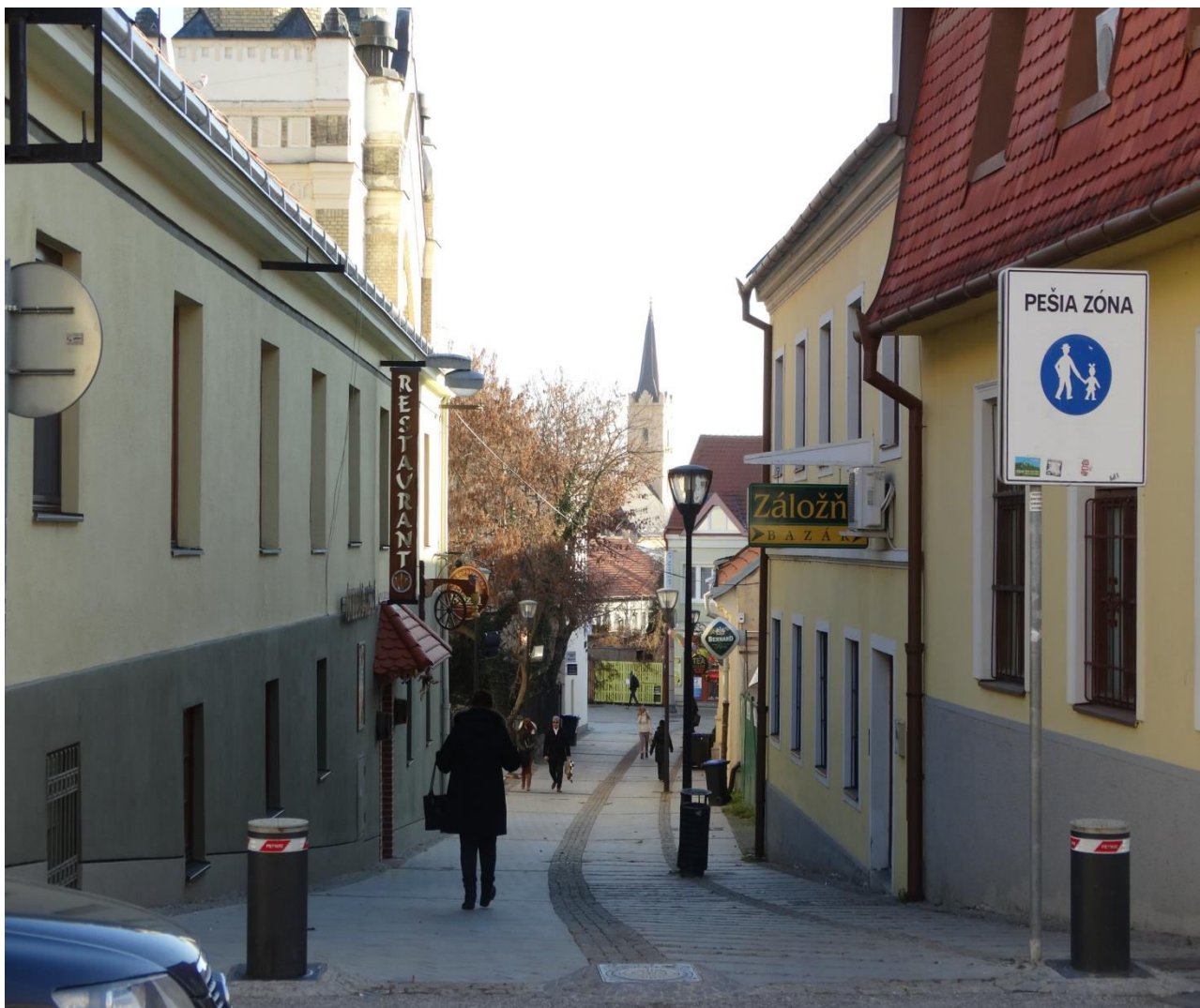
A. 19. Pohľad z ulice Farská cez ulicu Pri synagóge na vežu kalvínskeho kostola - chránený interiérový pohľad č. 16