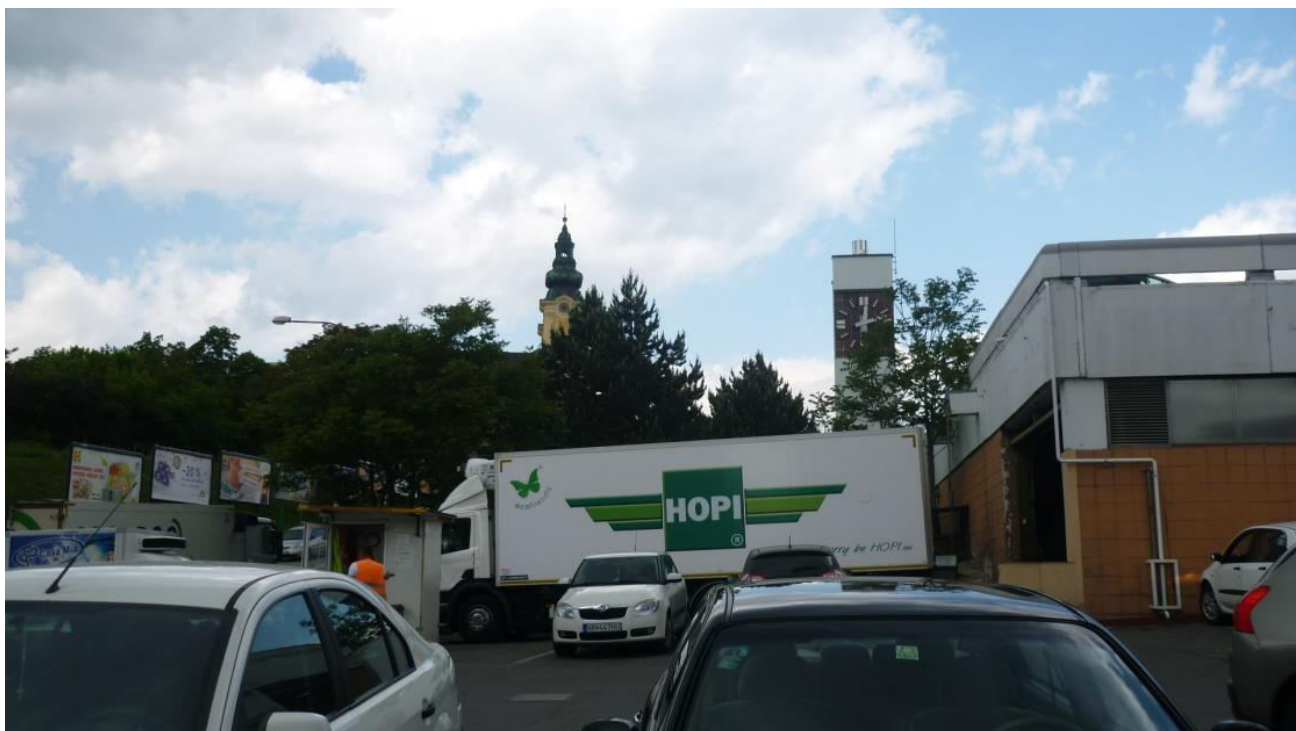
A. 25. Pohľad na komplex Piaristov od ulice Štúrova, v polohe vstupu na parkovisko Tesca