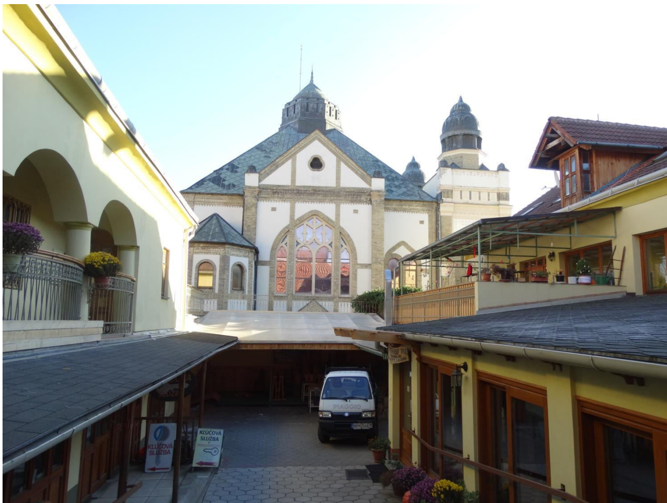
A. 30. Pohľad z prejazdu dvora domu na ulici Pri synagóge 6 na synagógu - chránený interiérový pohľad č.12