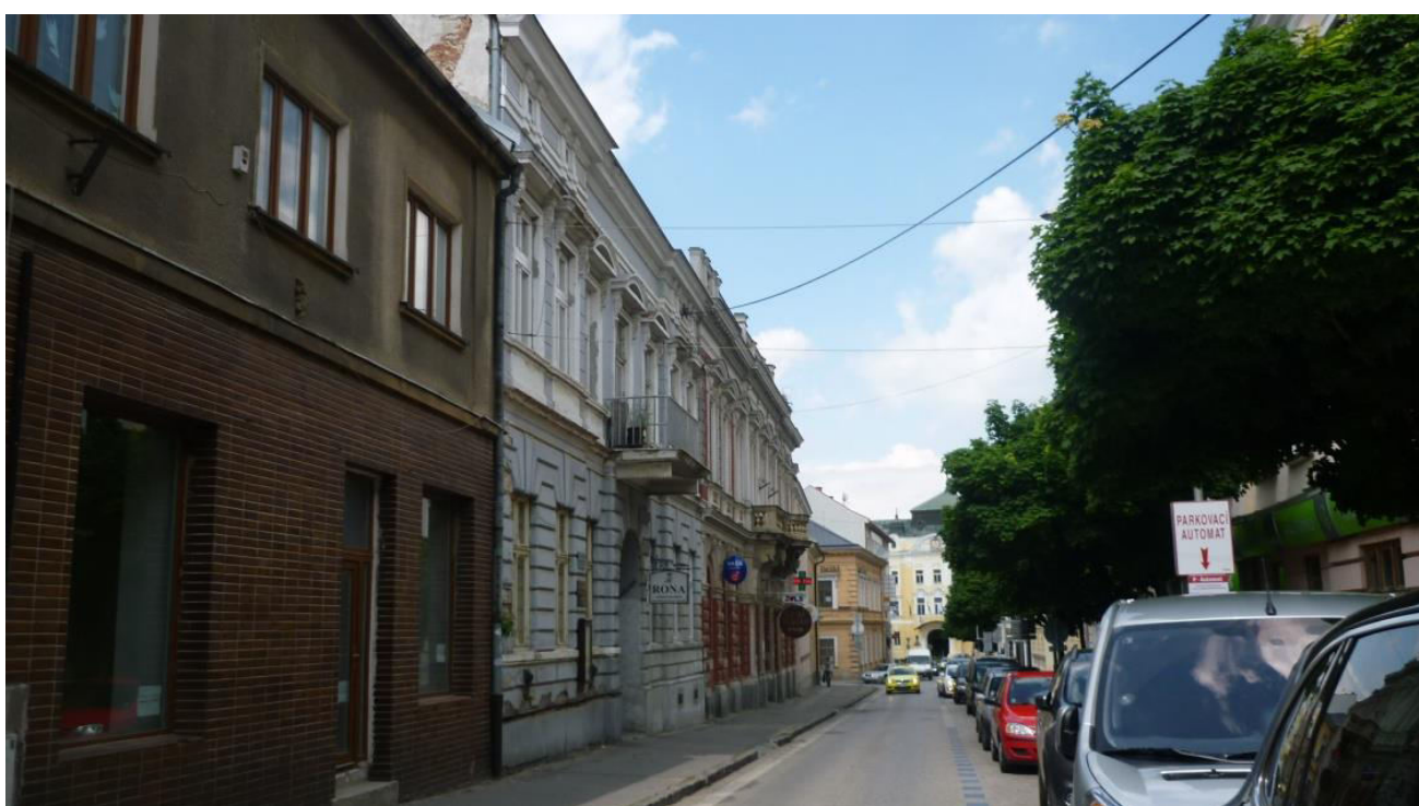
A. 2. Pohľad z juhu na západnú stranu zástavby severného konca ulice Farská – v chránenom interiérovom pohľade č. 5