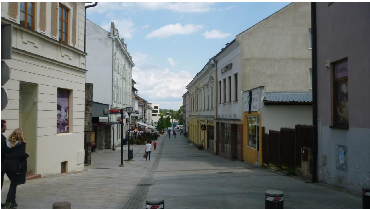
A. 15. Pohľad do ulice Kupecká od rázcestia s ulicou Farská - v chránenom interiérovom pohľade č. 10