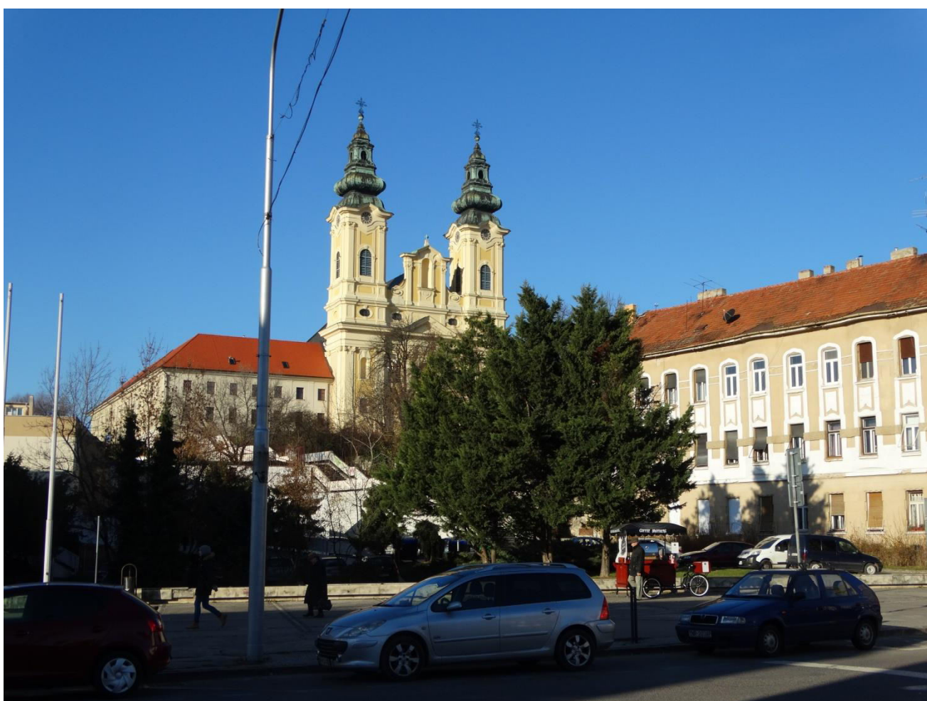
A. 18. Pohľad od rohu ulice Palárikova a Štefánikovej triedy na komplex kostola a kláštora piaristov, poloha chráneného interiérového pohľadu č.14