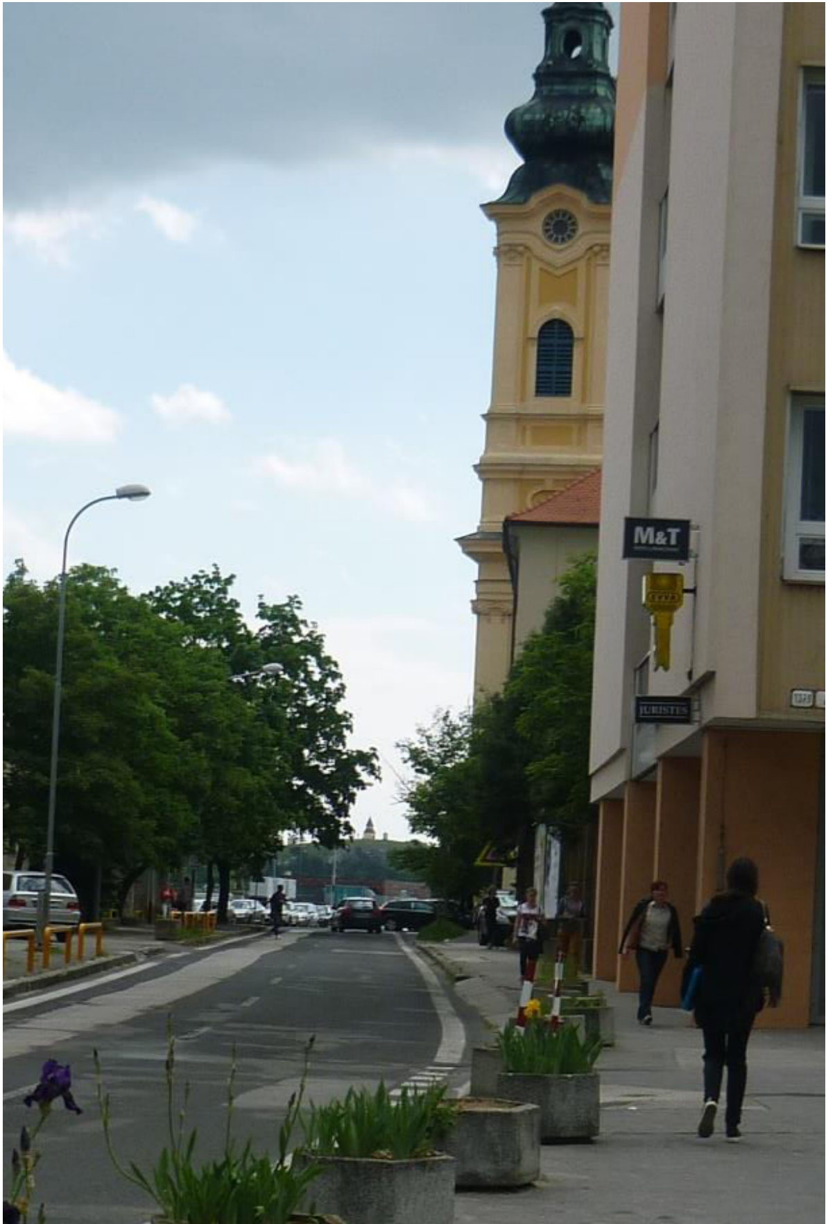
A. 20. Pohľad z ulice Piaristická na Kalváriu