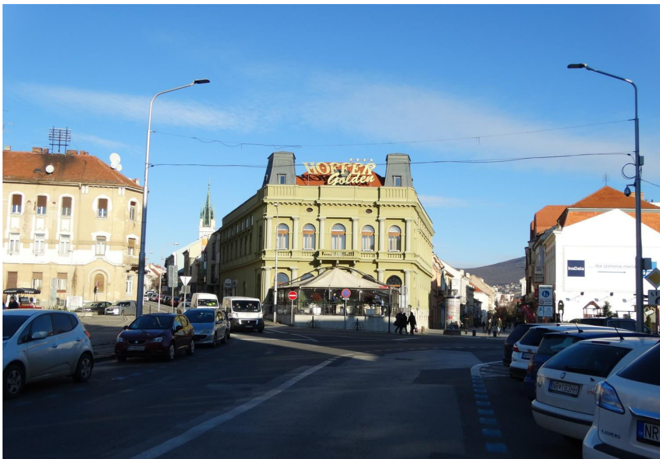
A. 7. Pohľad na bývalý hotel Tatra, s priehľadom do ulice Farská a Štefánikova trieda - chránený interiérový pohľad č. 15