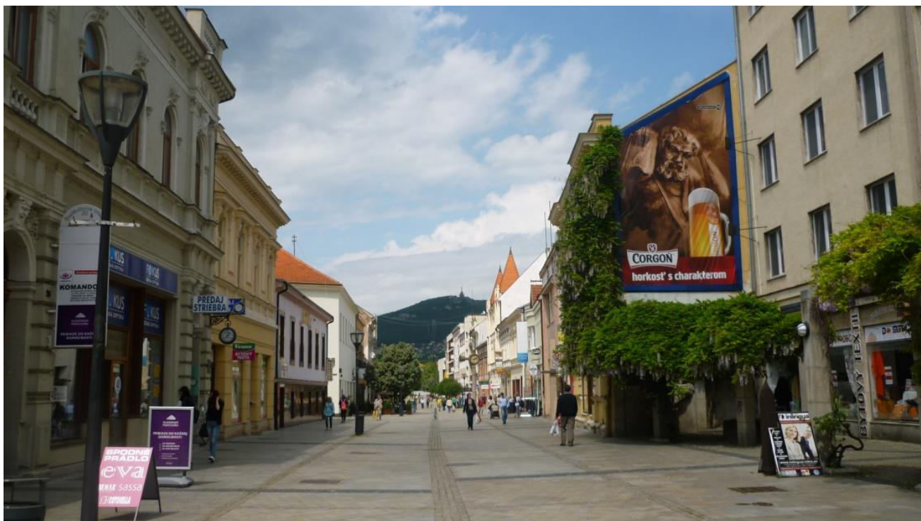
A. 9. Pohľad do Štefánikovej triedy z juhu, v polohe pri bytovom dome č. 27