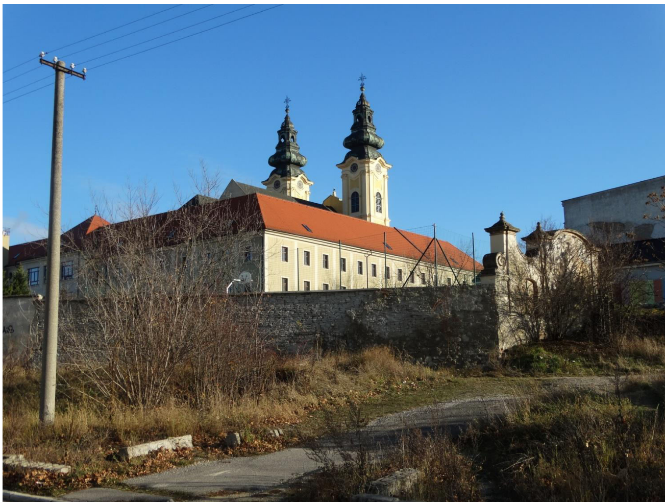
A. 23. Pohľad od ulice Palánok a Štúrova na komplex kláštora piaristov s Kostolom sv. Ladislava - chránený interiérový pohľad č. 18