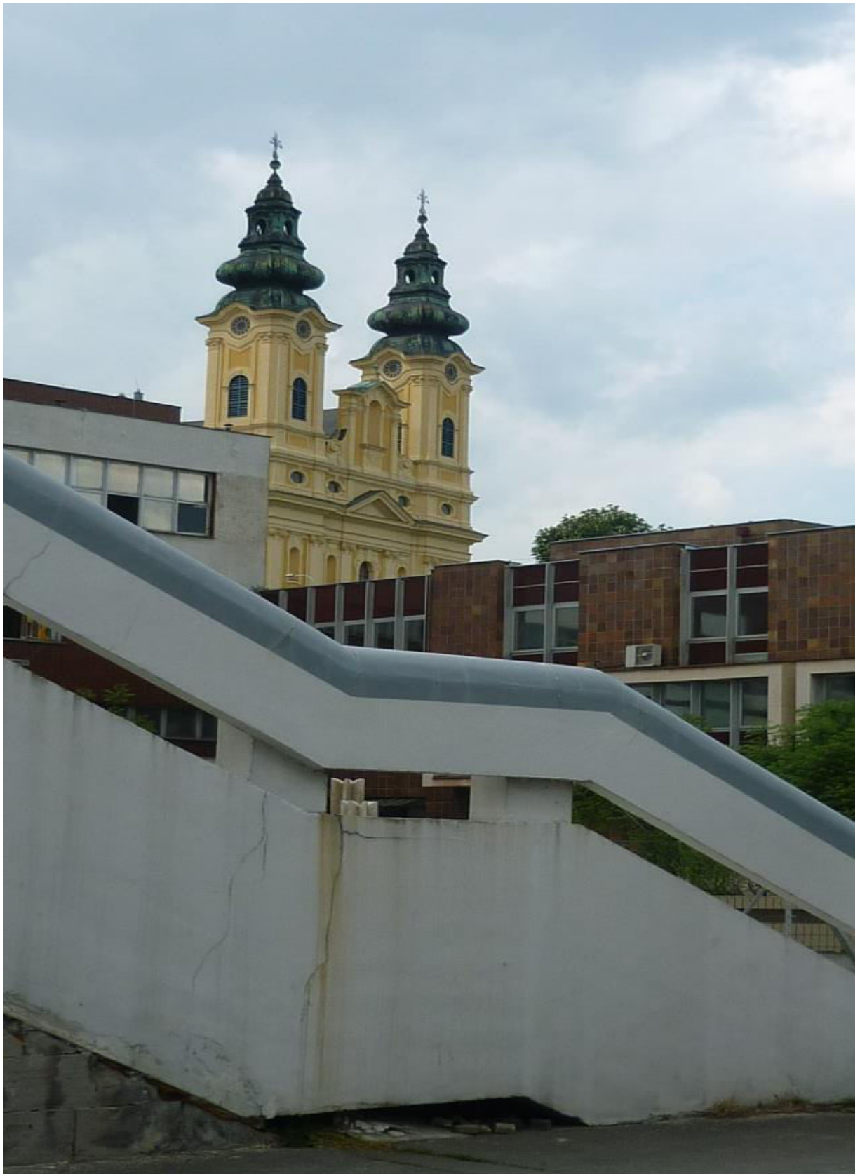
A. 27. Pohľad od Štefánikovej triedy cez priehľad medzi objektom Tesco a VÚB