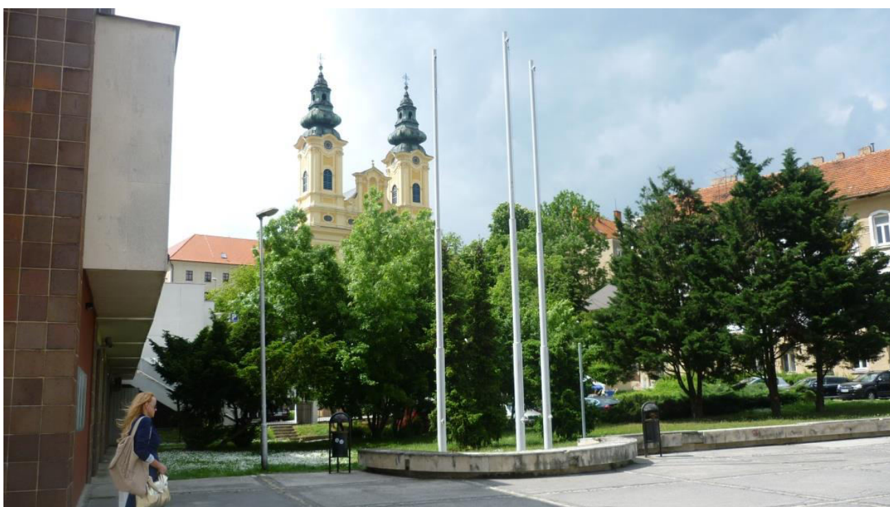
A. 26. Pohľad na komplex Piaristov od Štefánikovej triedy cez priestranstvo pri VÚB