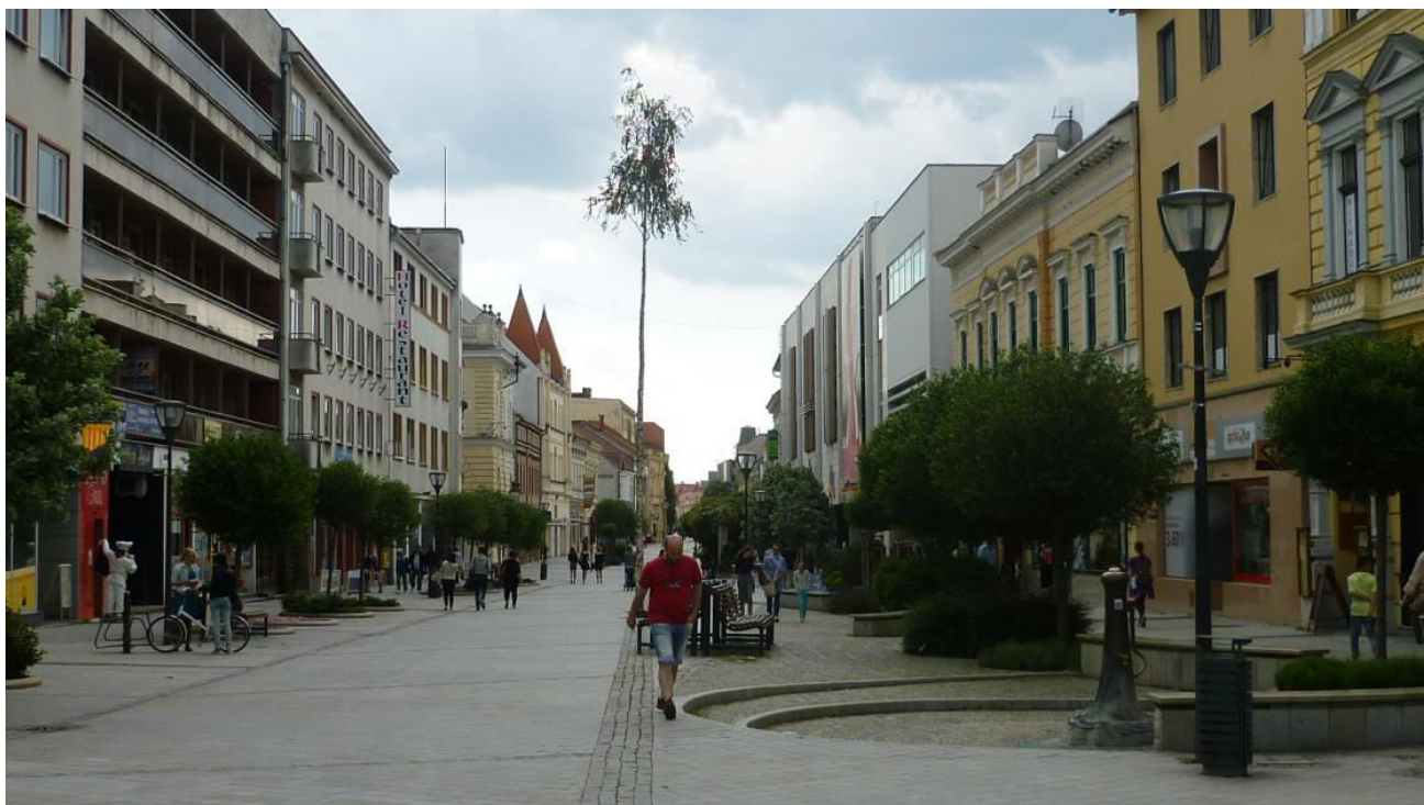
A. 13. Pohľad do Štefánikovej triedy zo severného konca smerom na južnú zástavbu