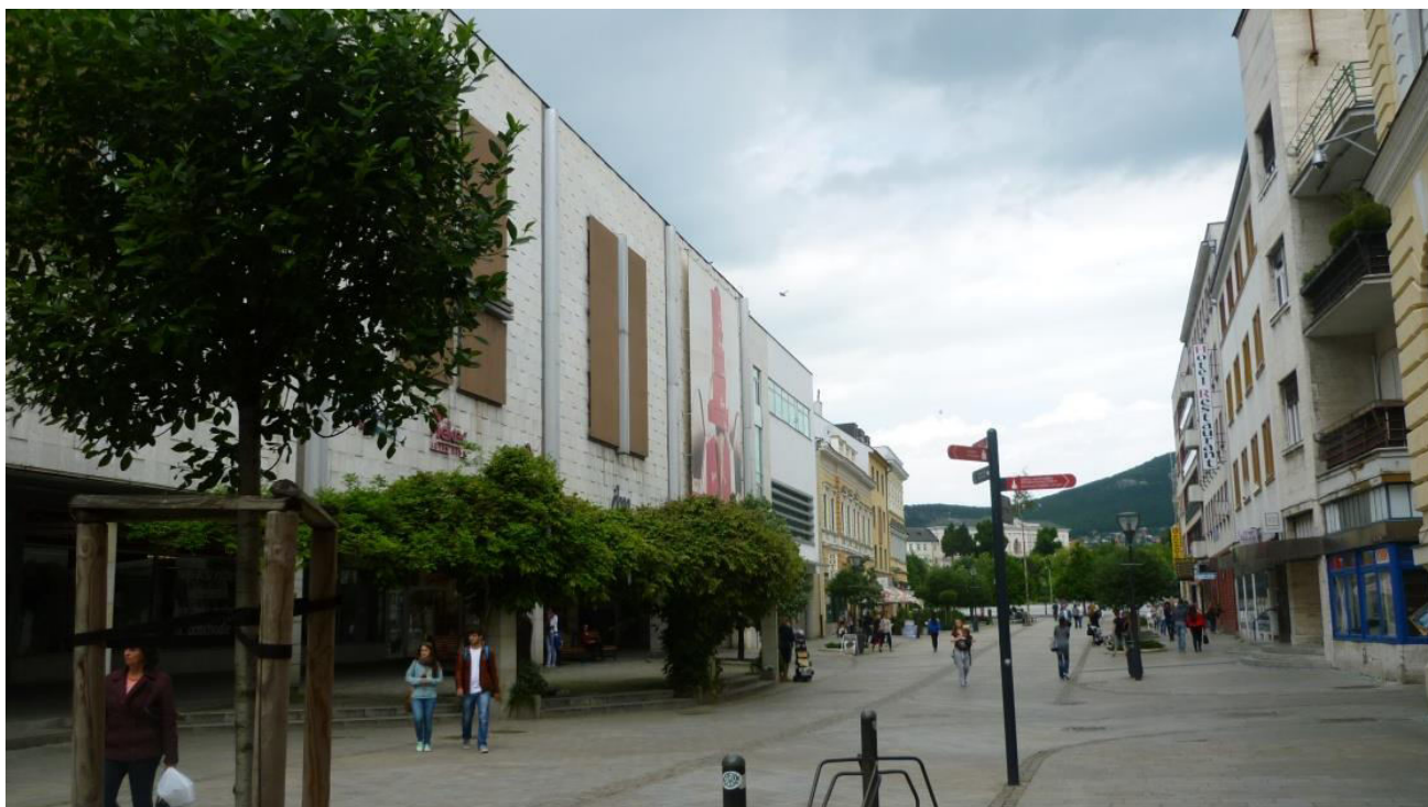
A. 11. Pohľad na severnú časť Štefánikovej triedy s novodobou zástavbou, v polohe pri bývalom Dome módy