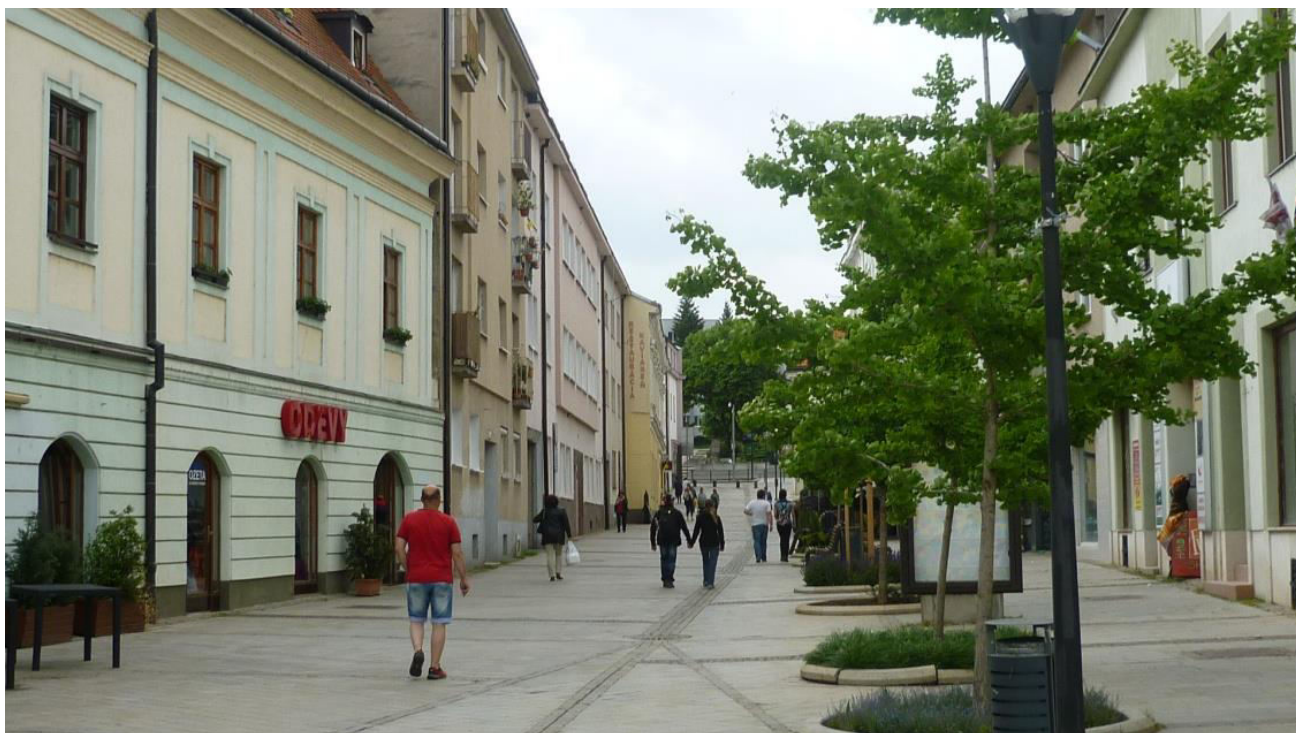
17. Pohľad na južnú zástavbu ulice Kupecká od Svätoplukovho námestia - v chránenom interiérovom pohľade č. 9