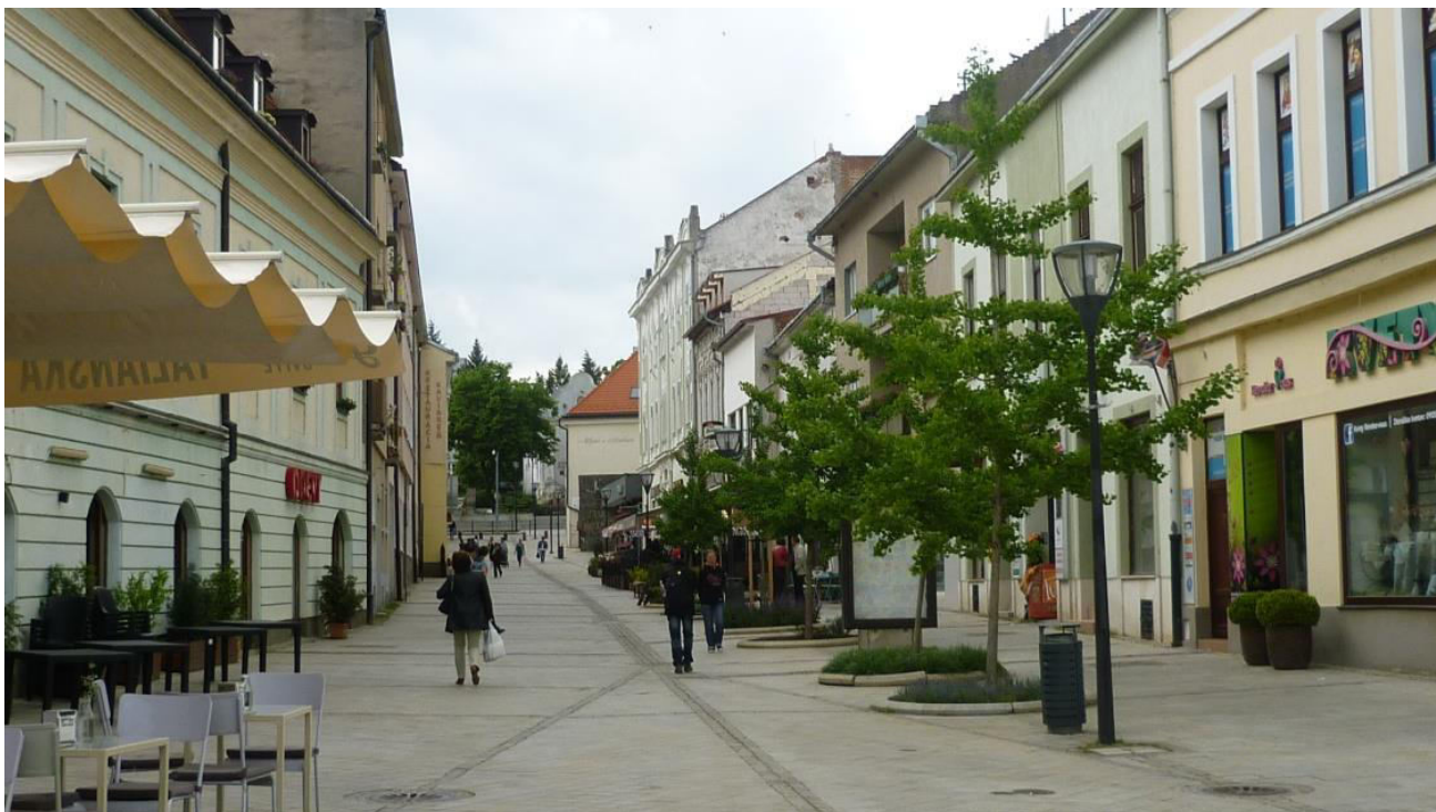
A. 16. Pohľad na severnú zástavbu ulice Kupecká od Svätoplukovho námestia - v chránenom interiérovom pohľade č. 9