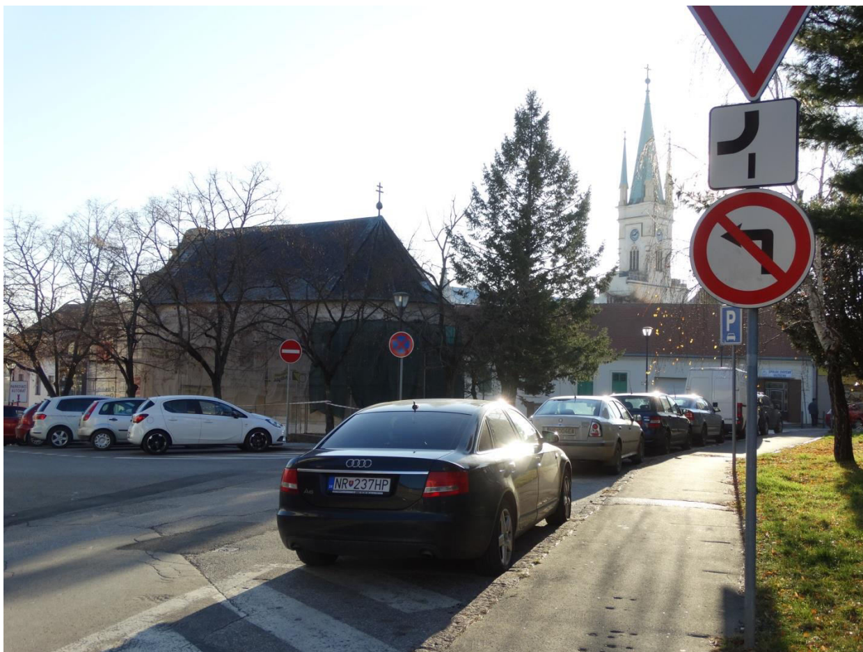
A. 28. Pohľad z vyústenia ulice Jozefa Vuruma do ulice na Vršku na Kaplnku sv. Michala a vežu Kostola Navštívenia Panny Márie - v chránenom interiérovom pohľade č. 7