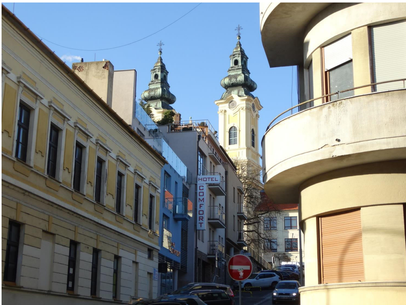
A. 14. Pohľad na zástavbu ulice Školská pod Kostolom sv. Ladislava - chránený interiérový pohľad č. 13