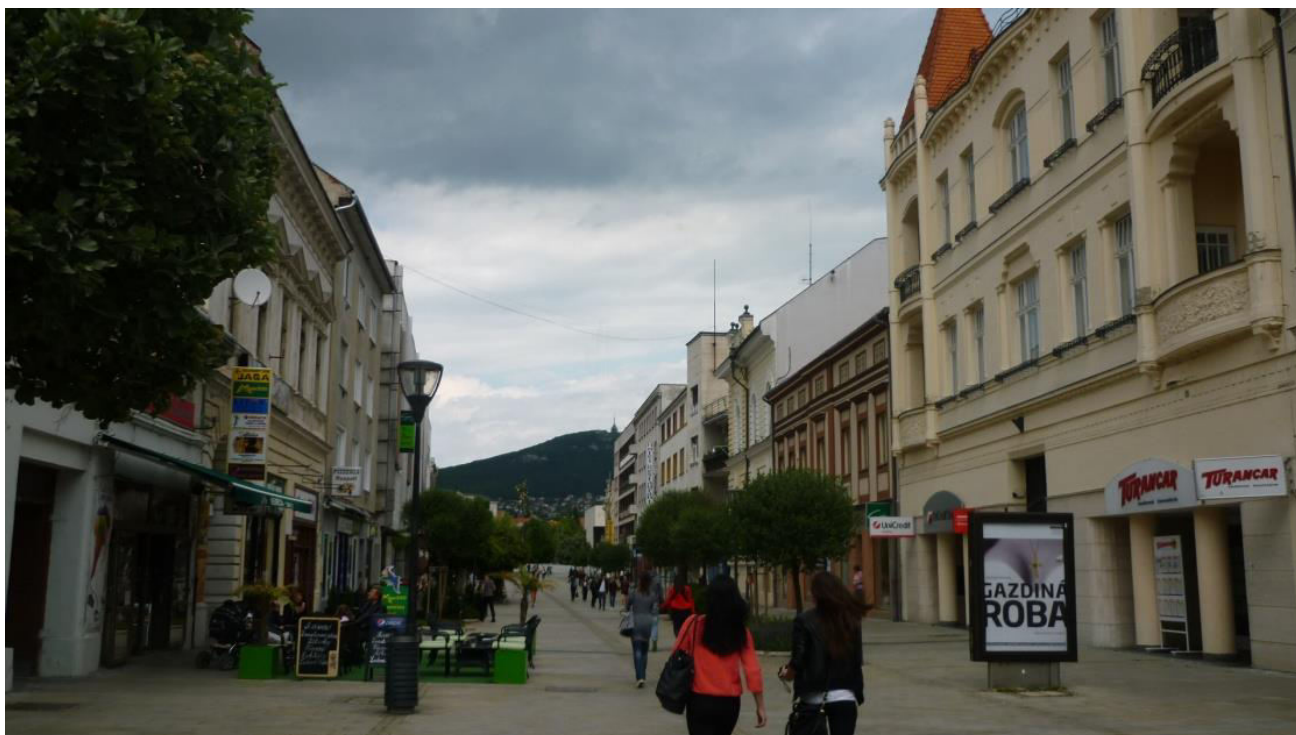
A.12. Pohľad do Štefánikovej triedy z juhu, v pozadí vrch Zobor