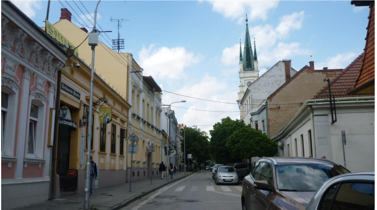
A. 5. Pohľad do ulice Farská z rázcestia s ulicou Pri synagóge, smerom na sever