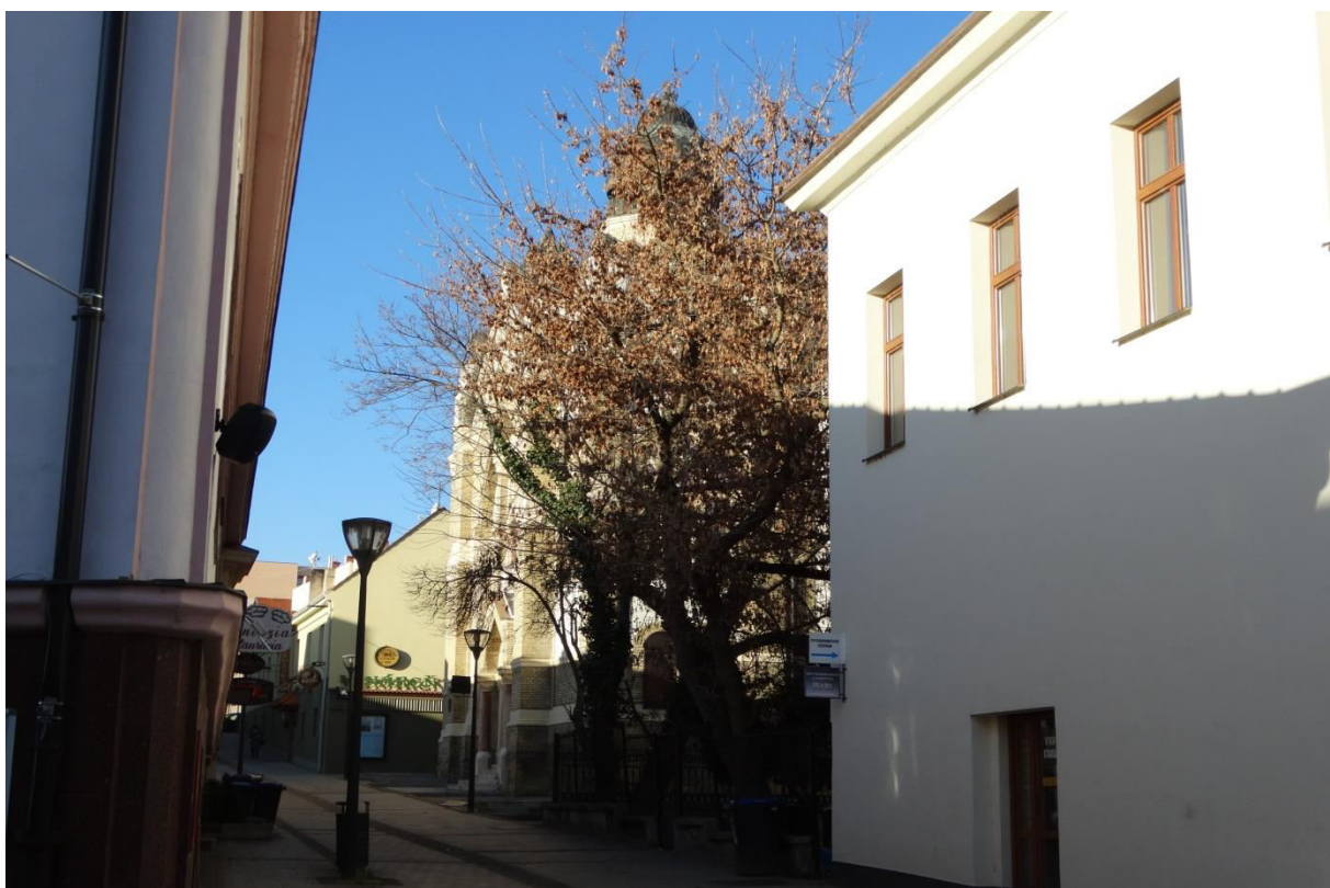
29. Pohľad z rázcestia Štefánikovej triedy a ulice Pri synagóge na synagógu - v chránenom interiérovom pohľade č. 11