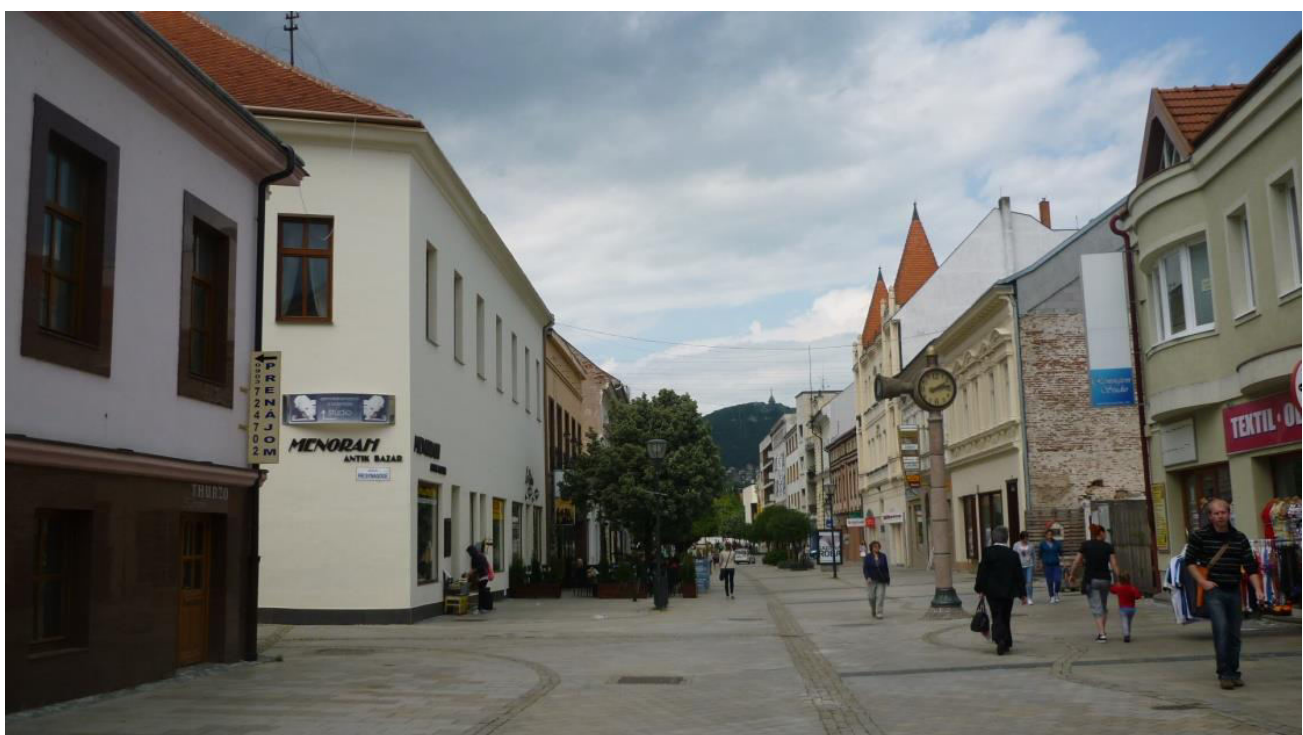
A. 10. Pohľad do Štefánikovej triedy z juhu, v polohe rázcestia s ulicou Pri synagóge