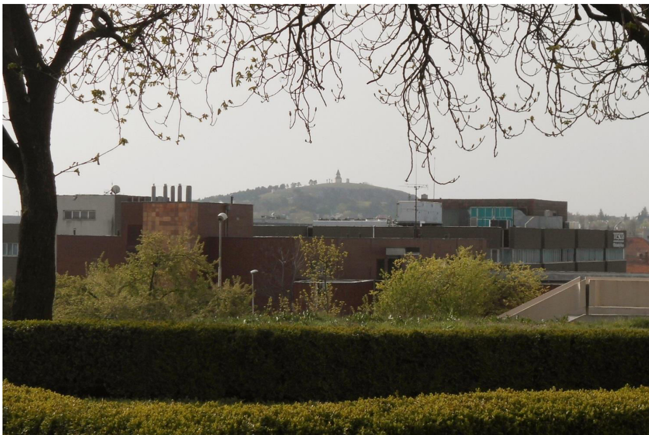
21. Pohľad z polohy Cyrilometodského námestia na kalváriu - chránený interiérový pohľad č.17