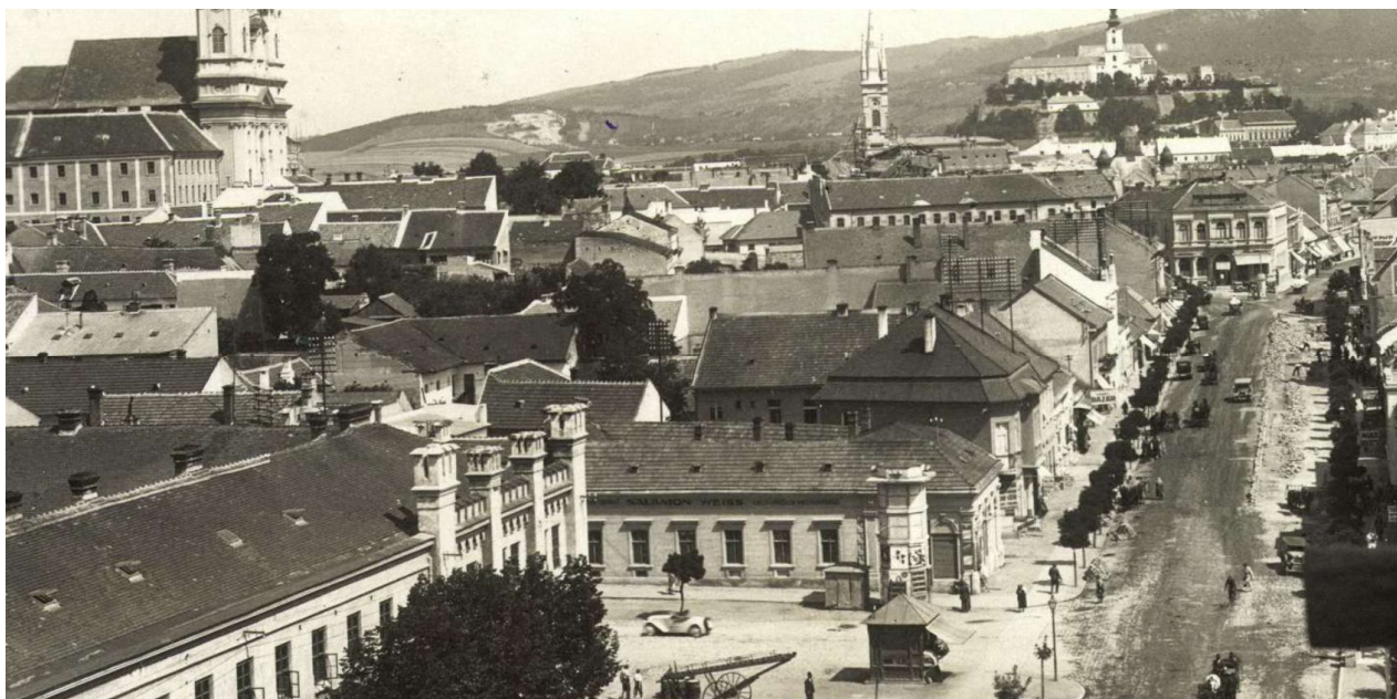
110. Štruktúra asanovanej zástavby a strešnej krajiny bloku „J“, vľavo dolu objekt Kasáreň, rok 1936 (sektor J)