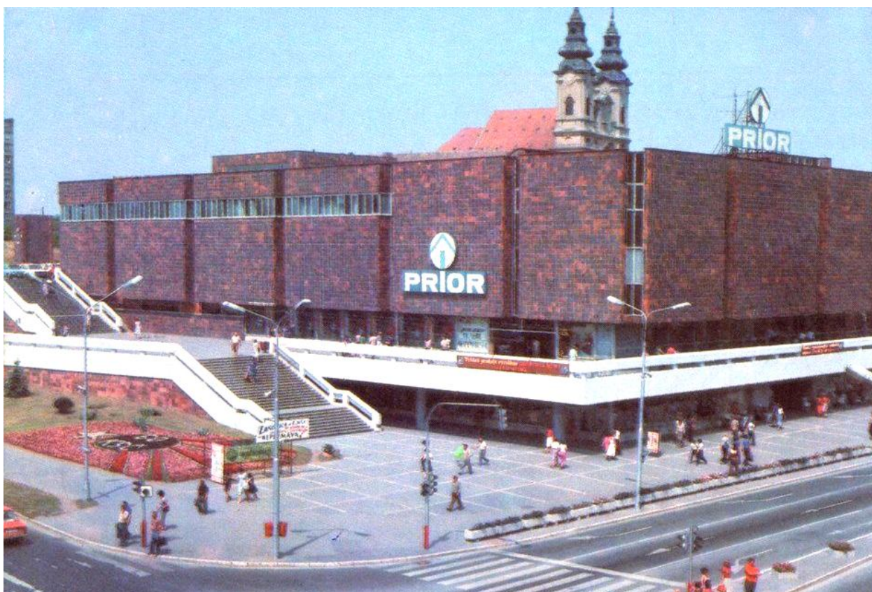
119. Pohľad na OD Prior (dnešné OD Tesco), križovatka ulíc Štefánikova trída a Štúrova, 70. roky 20. storočia (sektor J)