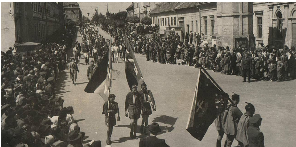
116. Pohľad na priečelia asanovanej zástavby na pravej strane, dnešná ulica Štúrova, 30. - 40. roky 20. storočia (sektor J)