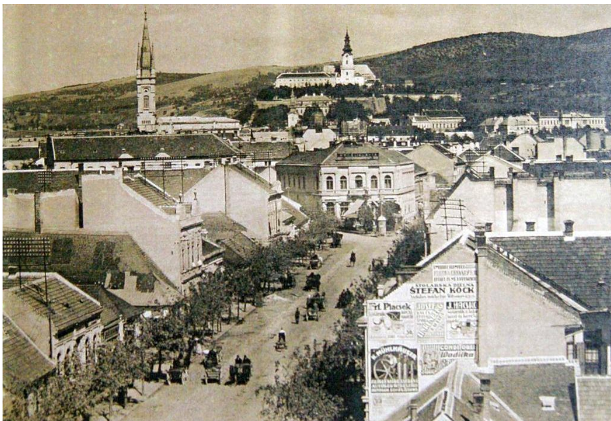
114. Pohľad na hmotovo-priestorovú skladbu asanovanej časti zástavby bloku „J“, ulica dotvorená líniou zeleňou, 20. – 30. roky 20. storočia (sektor J)