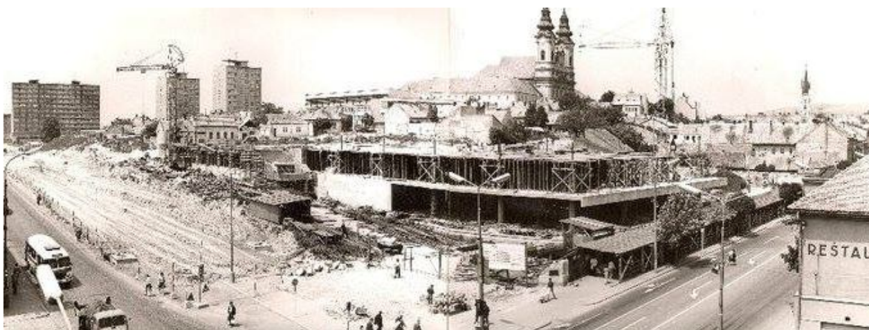
117. Stavba OD Prior (dnešné OD Tesco), križovatka ulíc Štefánikova trieda a Štúrova, rok 1971. (sektor J)