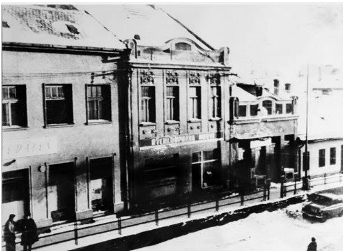
108. Pohľad na asanovanú časť zástavby dnešnej ulice Štúrova, dnes obchodný dom Tesco, 50. roky 20. storočia (sektor J)