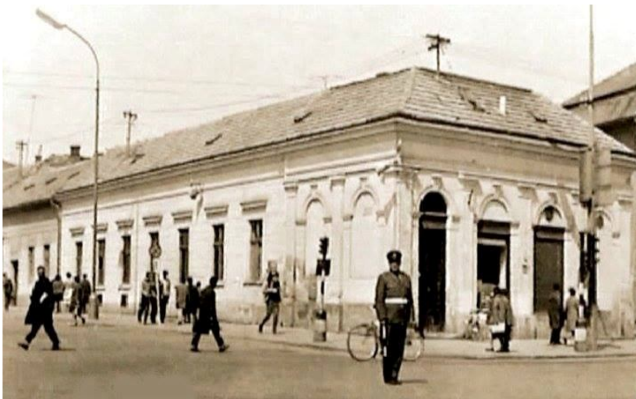
111. Pohľad na asanovanú časť zástavby, jednopodlažný nárožný objekt dnešných ulíc Štefánikova trieda a Štúrova (dnešné OD Tesco), rok 1966 (sektor J)