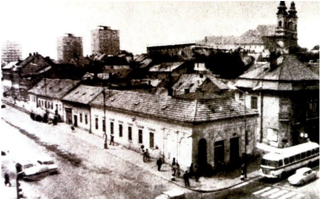
112. Pohľad na asanovanú časť zástavby, nárožný objekt dnešných ulíc Štefánikova trieda a Štúrova (dnešné OD Tesco), 60. roky 20. storočia (sektor J)