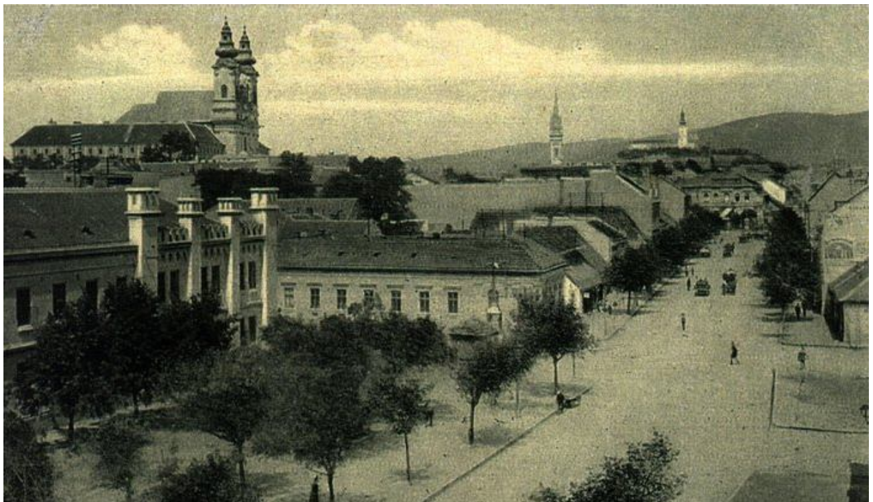
113. Pohľad na hmotovo-priestorovú skladbu asanovanej časti zástavby jedno až dvojpodlažných domov bloku J, vľavo budova Kasáreň s predpolím, začiatok 20. storočia (sektor J)