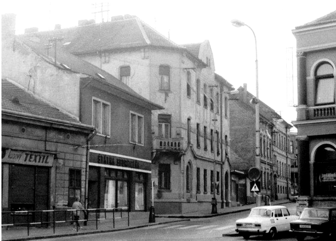
121. Pohľad na časť asanovanej zástavby na ľavej strane a začiatok dnešnej ulice Farská, rok 1977 (sektor J)