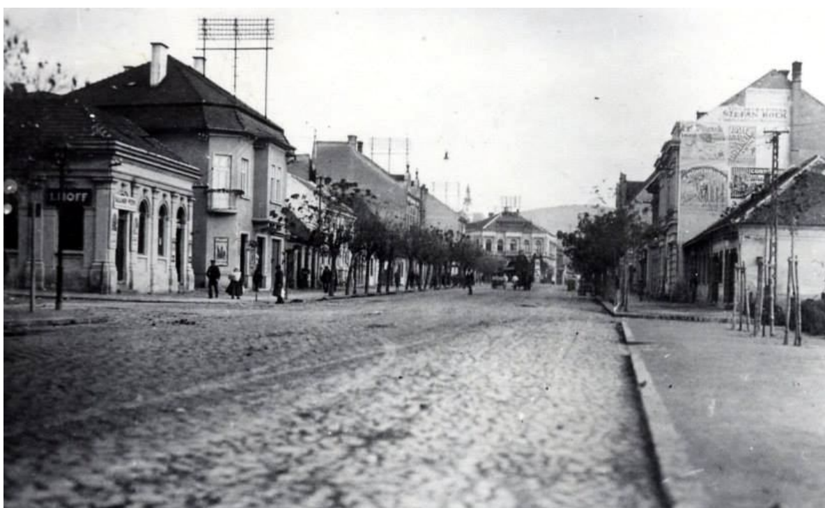
109. Pohľad na asanovanú časť zástavby ľavej strany dnešnej ulice Štefánikova trieda (dnešné OD Tesco), z križovatky Štúrova – Štefánikova trieda, rok 1921 (sektor J)