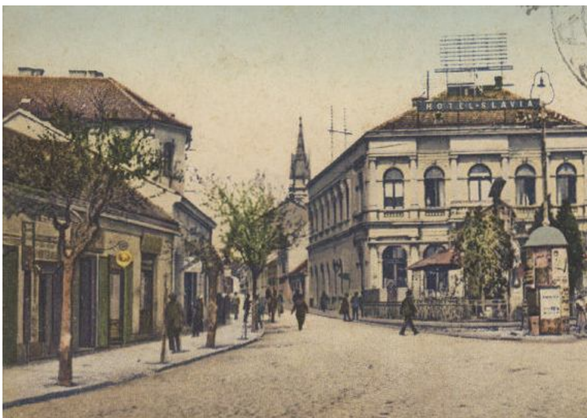
115. Pohľad na časť asanovanej zástavby na ľavej strane a začiatok dnešnej ulice Farská, vpravo bývalý hotel Tatra, začiatok 20. storočia (sektor J)