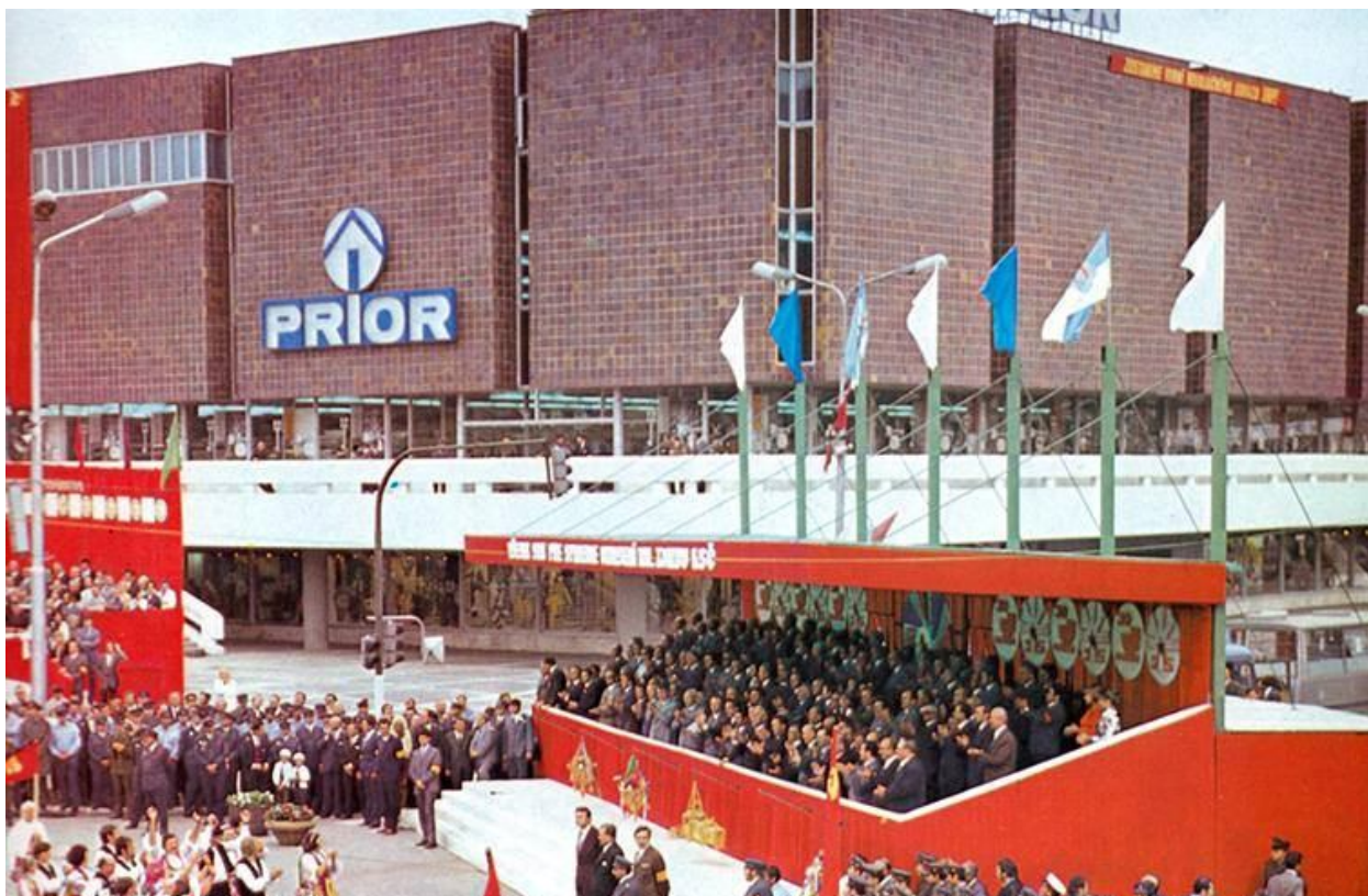
118. Pohľad na OD Prior (dnešné OD Tesco) po ukončení výstavby, križovatka ulíc Štefánikova trída a Štúrova, rok 1974 (sektor J)