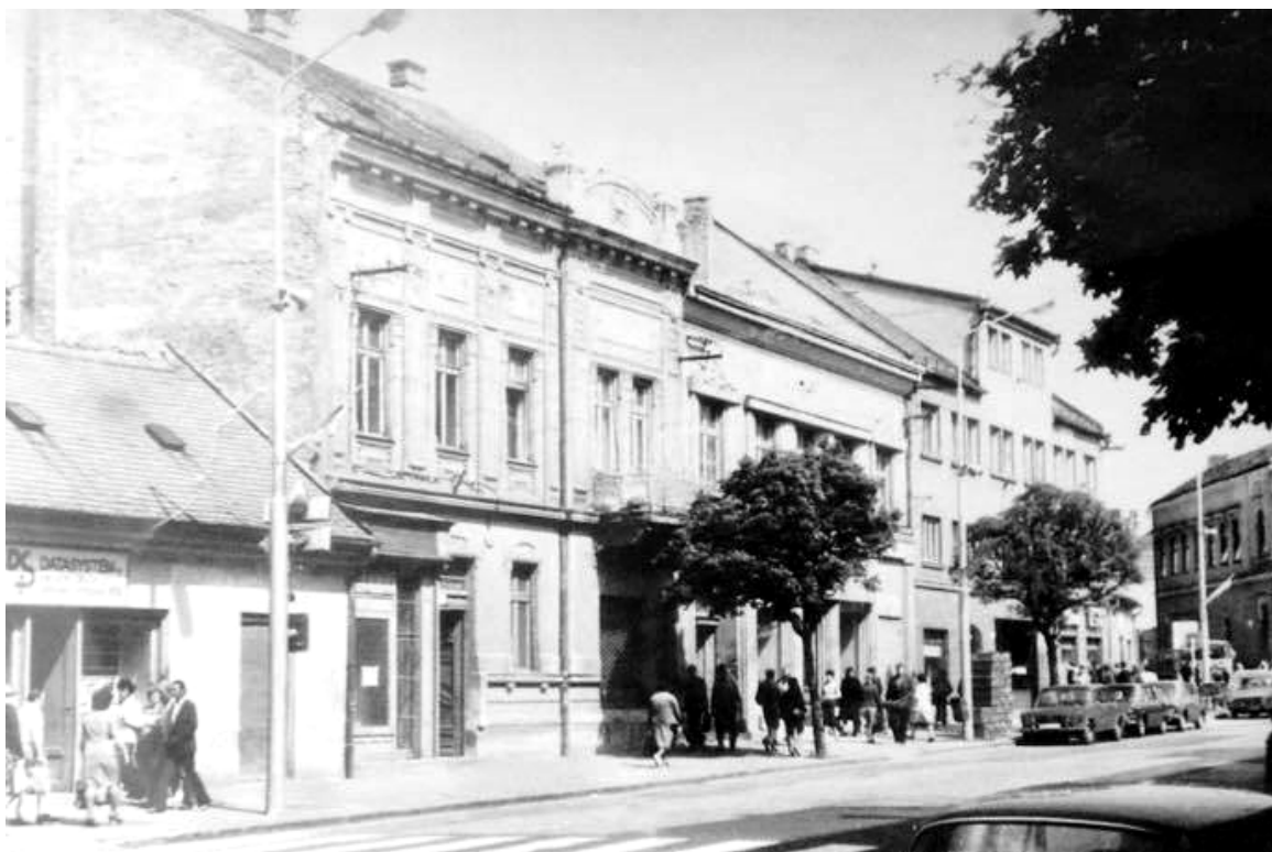
122. Pohľad na uličné fasády zaniknutej zástavby bloku „J“ (na mieste budovy dnešnej VÚB banky), vytvárajúc uličnú čiaru, začiatok 70. rokov 20. storočia (sektor J)