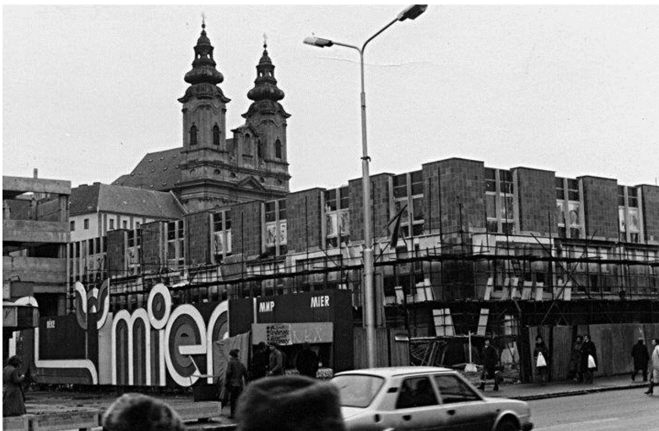
123. Výstavba budovy kina Orbis (naľavo) a budovy dnešnej VÚB banky, v pozadí piaristický kostol a kláštor, začiatok 80. rokov 20. storočia (sektor J)