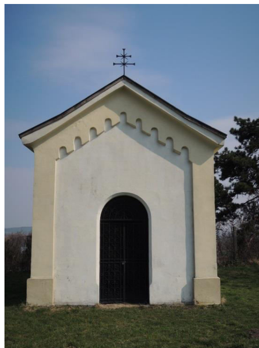
detail kaplnka sv. Trojice