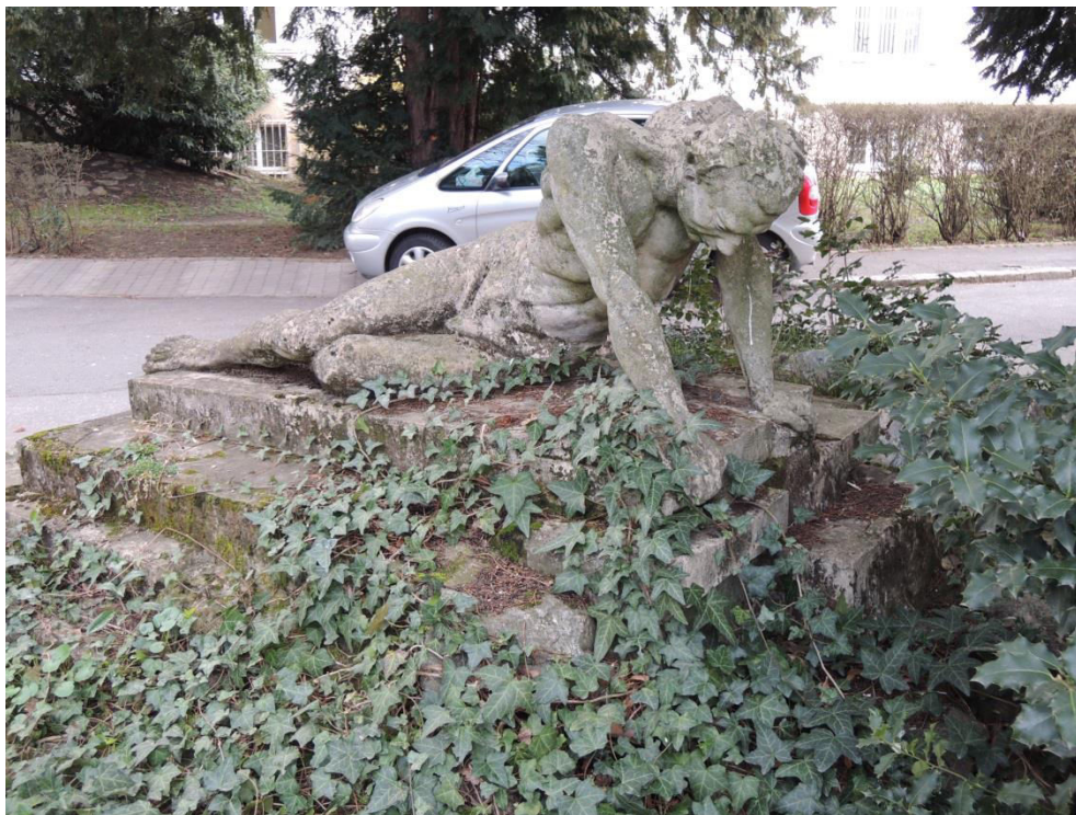
fontána so sochou muža