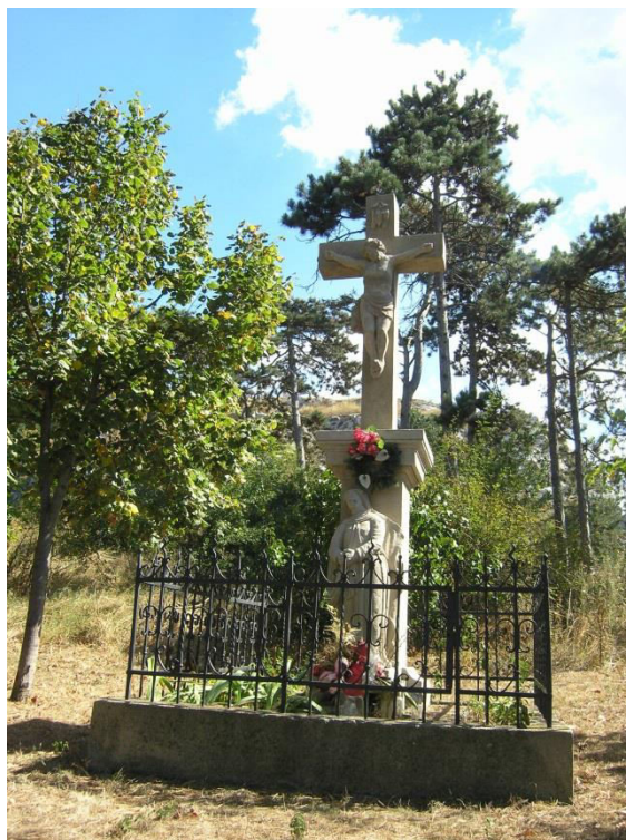
križ s Ukrižovaným