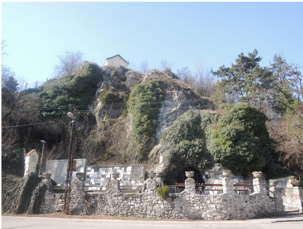
pohľad na Lurdskú jaskyňu

SPRACOVAL: Mgr. Tatiana Danieličová, KPÚ Nitra, 03/2015