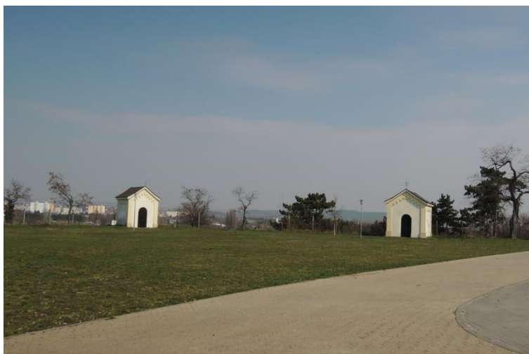
pohľad na identické kaplnky sv. Anny a sv. Trojice