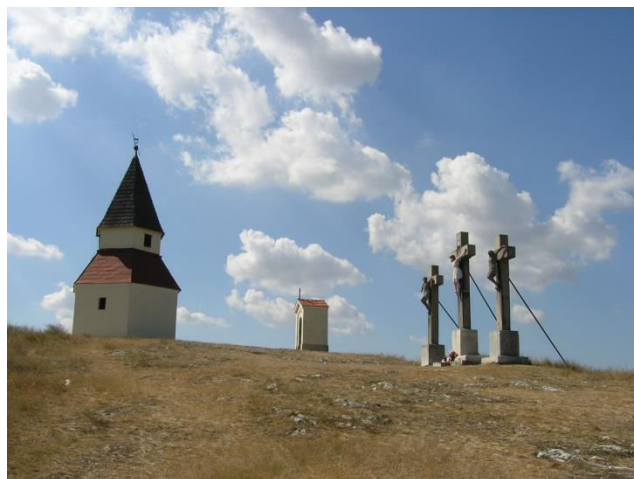
pohľad na vrchol Kalvárie, Ukrižovanie a 13. a 14. zastavenie

SPRACOVAL: Mgr. Tatiana Danieličová, KPÚ Nitra, 03/2015