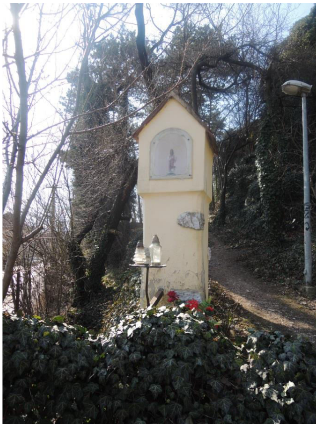
Božia muka prícestná pilierová