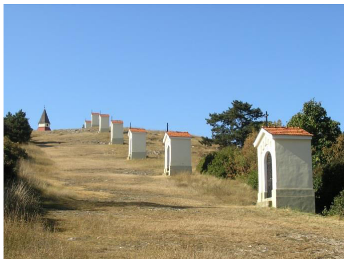
pohľad na zastavenia krížovej cesty