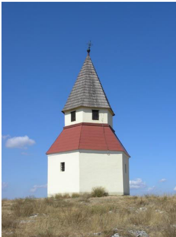
Kalvária, Kaplnka Božieho hrobu – 14. zastavenie krížovej cesty

SPRACOVAL: Mgr. Tatiana Danieličová, KPÚ Nitra, 03/2015