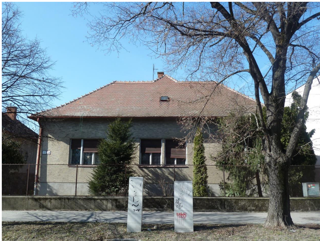
pohľad na uličnú fasádu