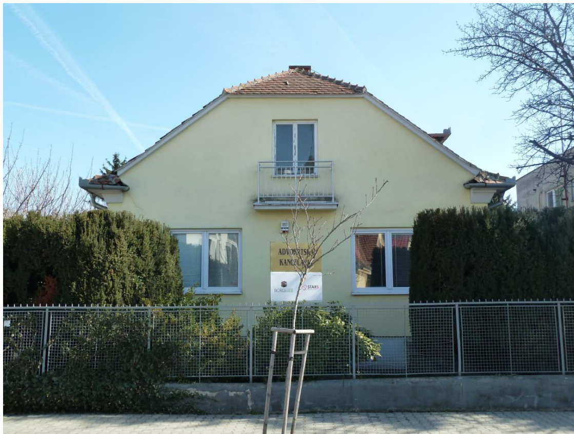
pohľad na uličnú fasádu