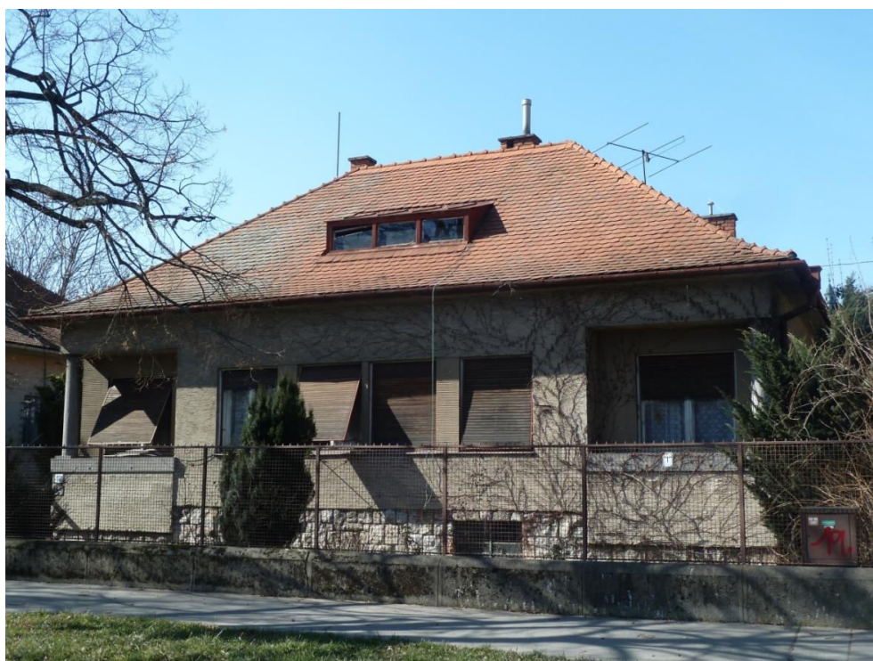
pohľad na uličnú fasádu