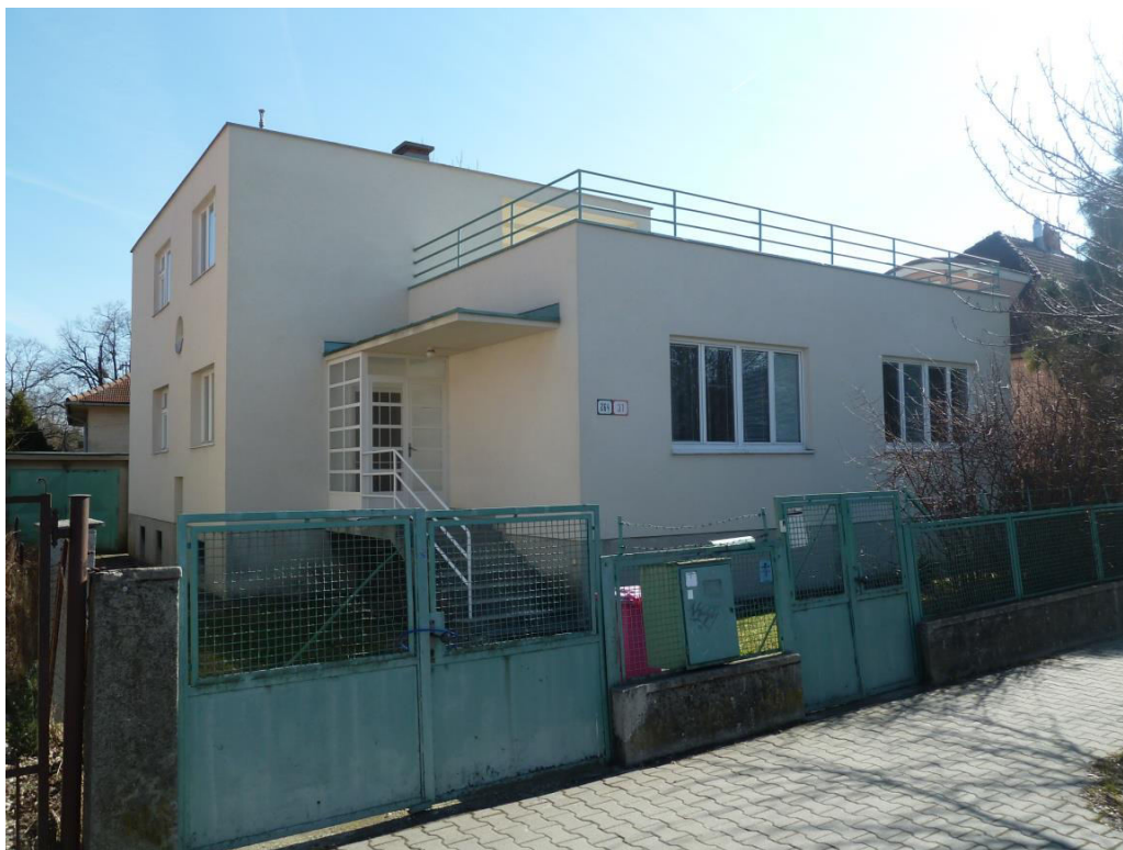
pohľad na uličnú fasádu

SPRACOVAL: Mgr. Imrich Tóth, KPÚ Nitra, 03/2015