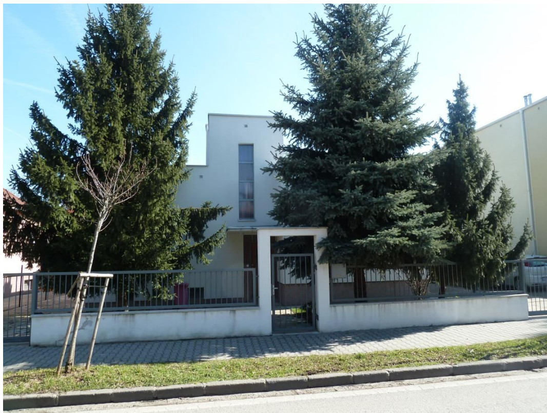
pohľad na uličnú fasádu