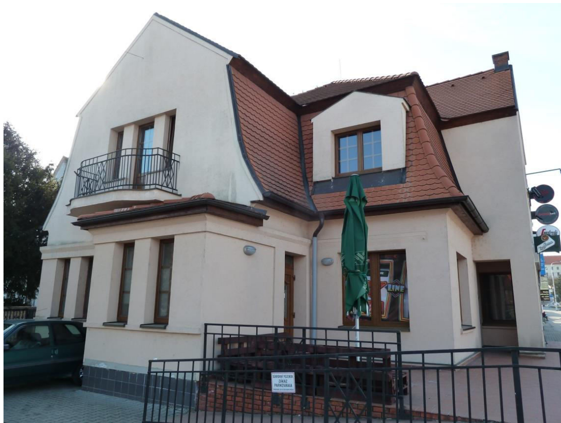
pohľad na uličnú fasádu