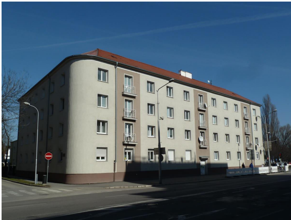
pohľad na uličnú fasádu