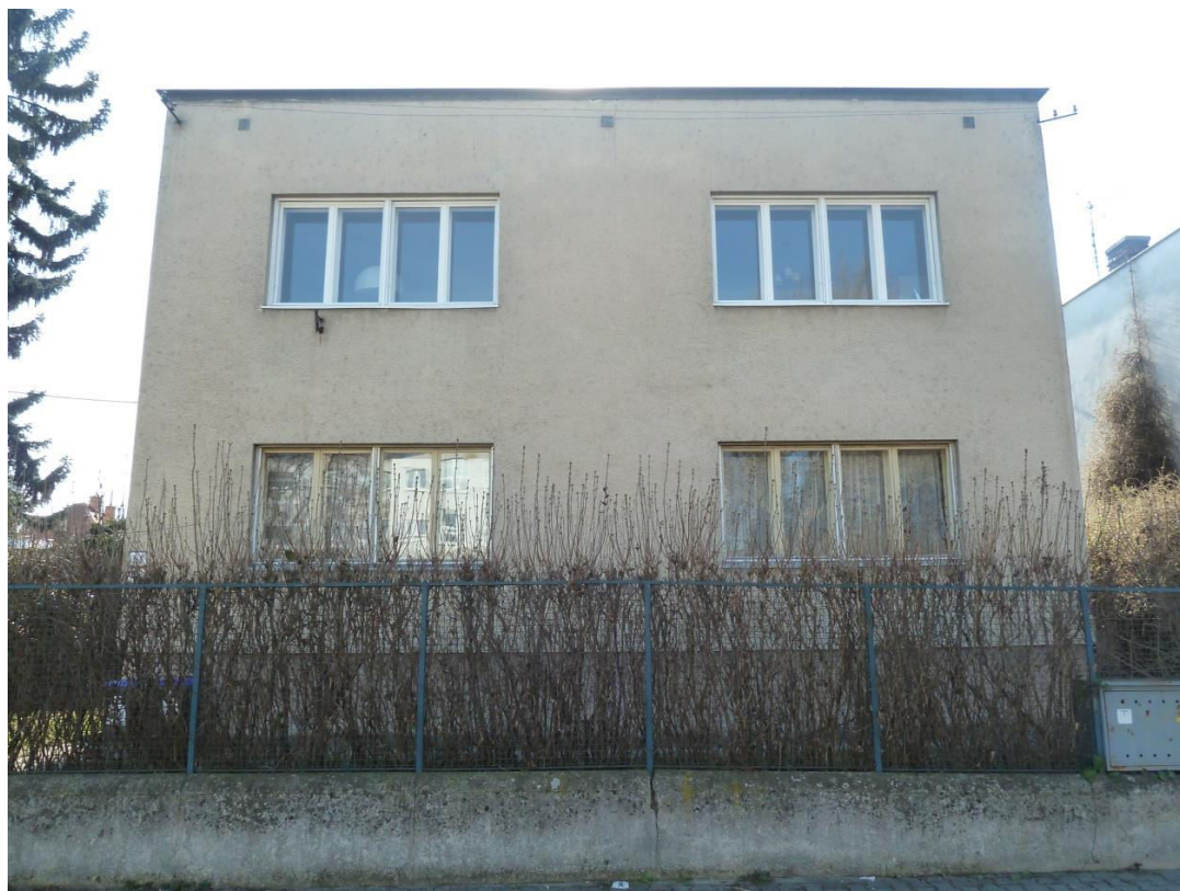
pohľad na uličnú fasádu