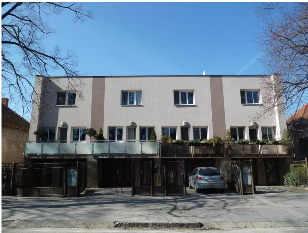
pohľad na uličnú fasádu