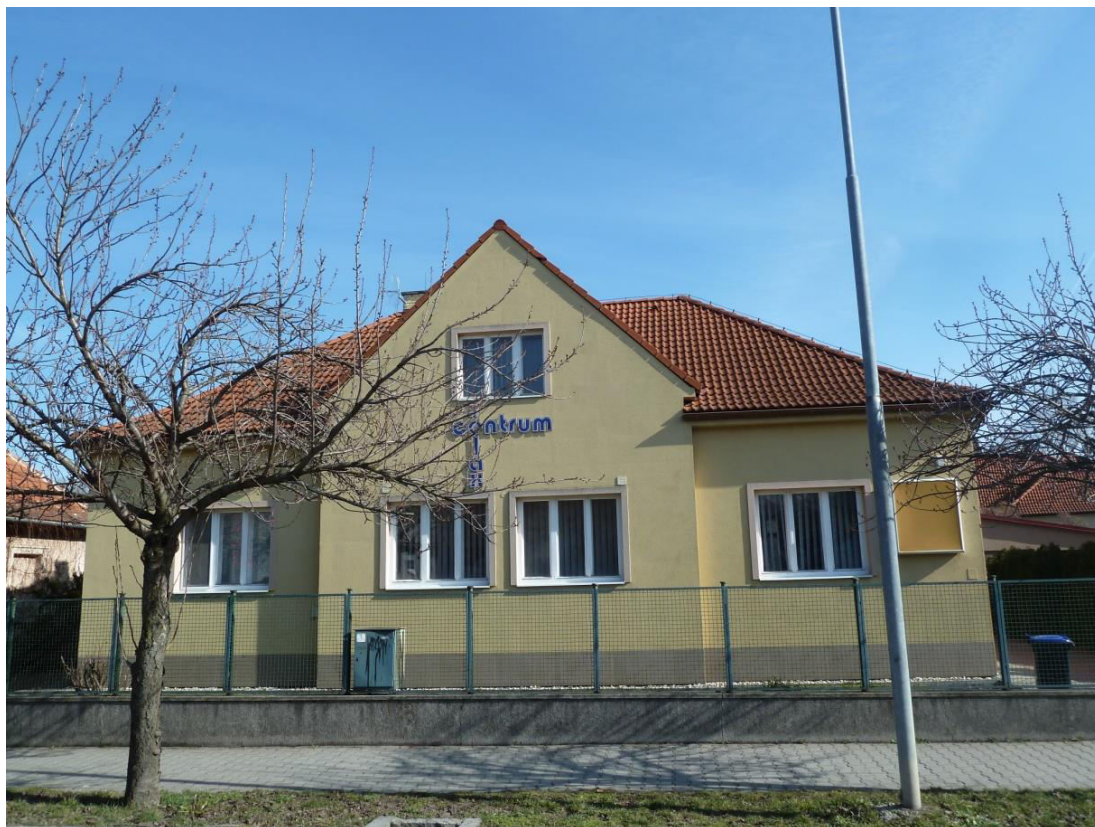
pohľad na uličnú fasádu