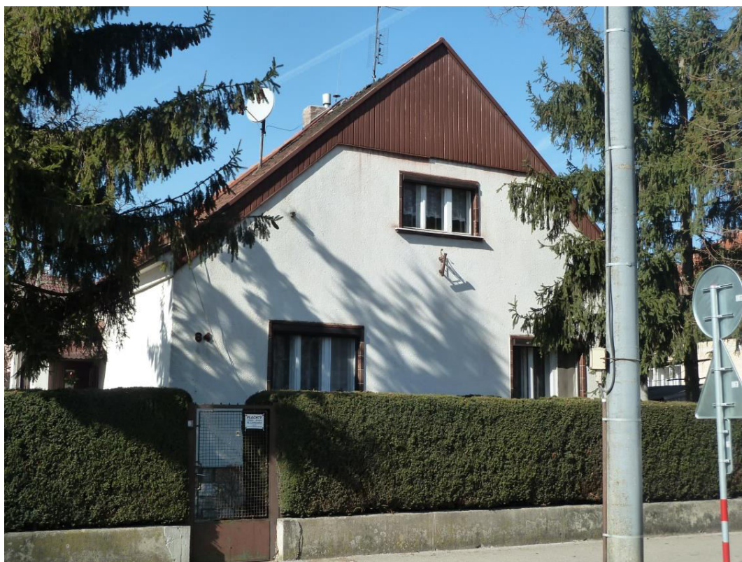
pohľad na uličnú fasádu