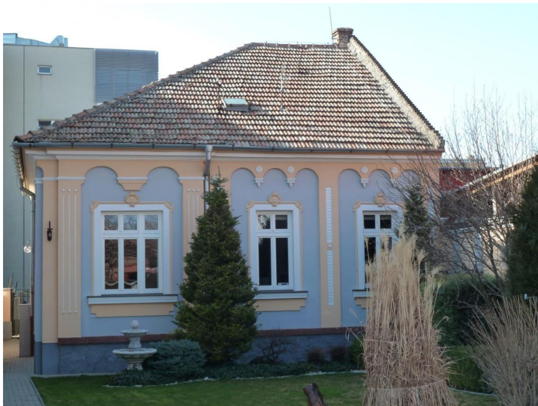
pohľad na uličnú fasádu