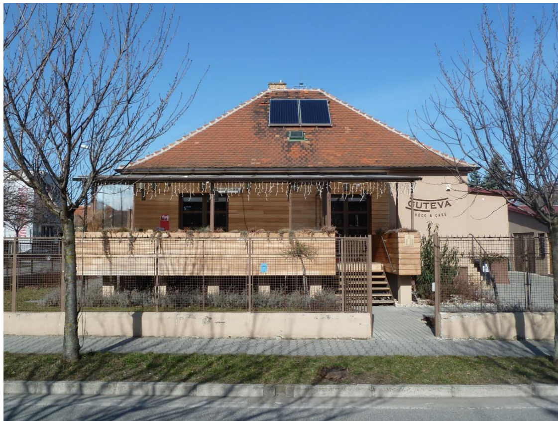
pohľad na uličnú fasádu