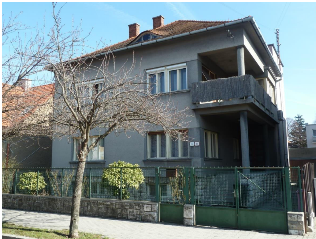
pohľad na uličnú fasádu