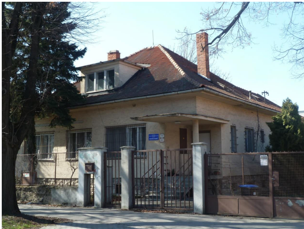
pohľad na uličnú fasádu