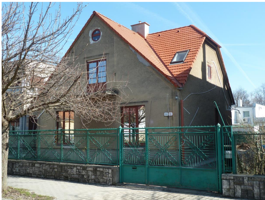
pohľad na uličnú fasádu