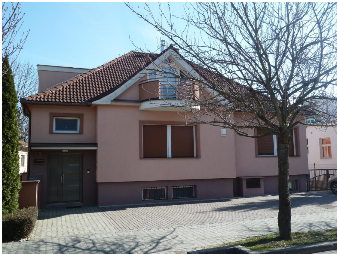
pohľad na uličnú fasádu