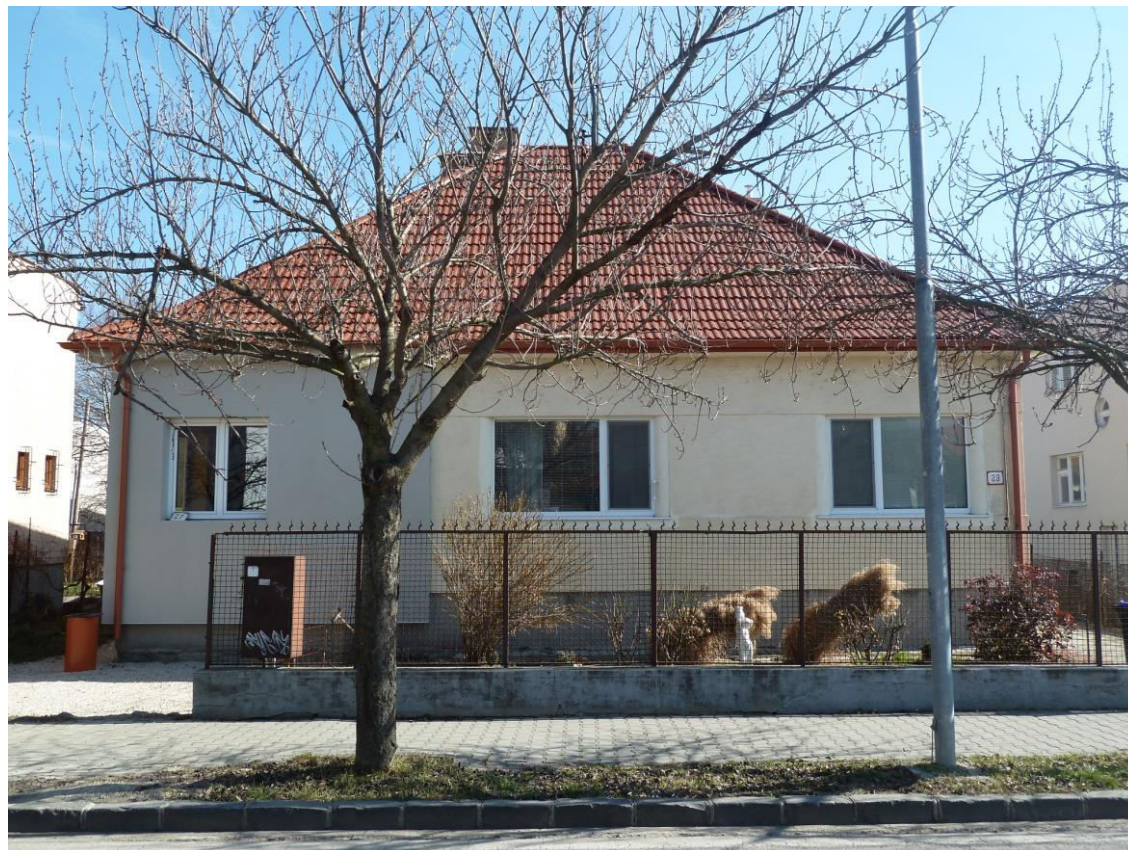
pohľad na uličnú fasádu