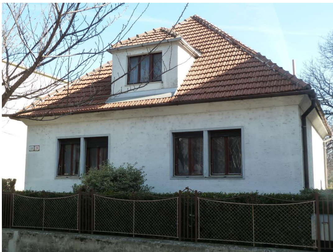
pohľad na uličnú fasádu