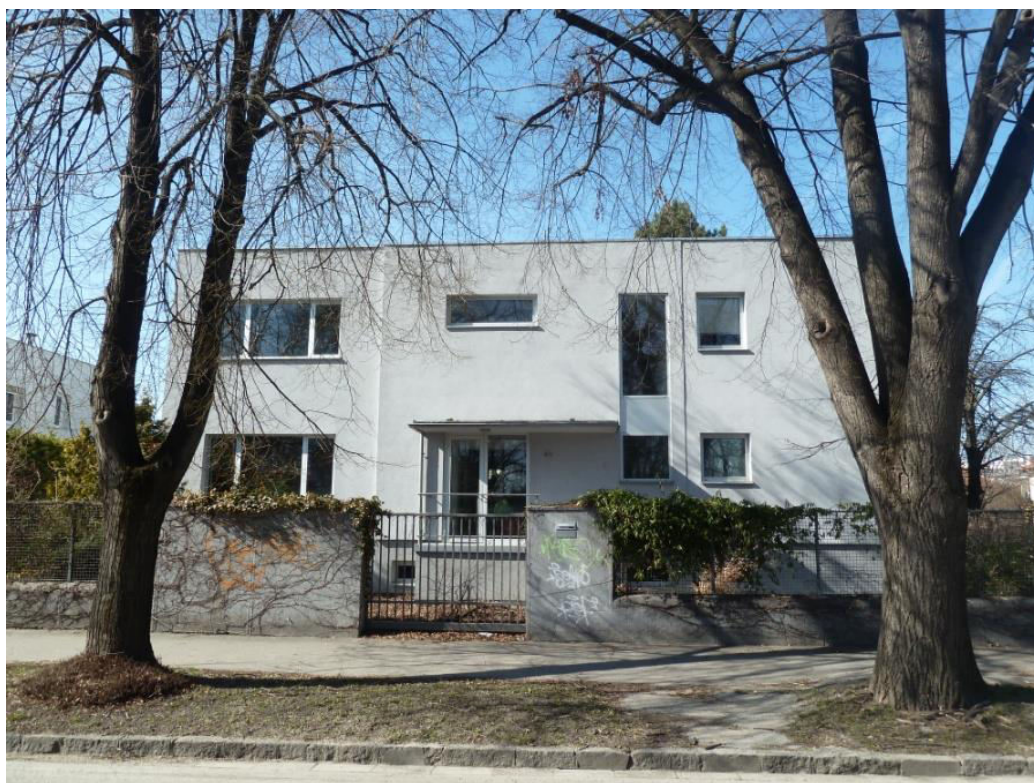
pohľad na uličnú fasádu

SPRACOVAL: Mgr. Imrich Tóth, KPÚ Nitra, 03/2015