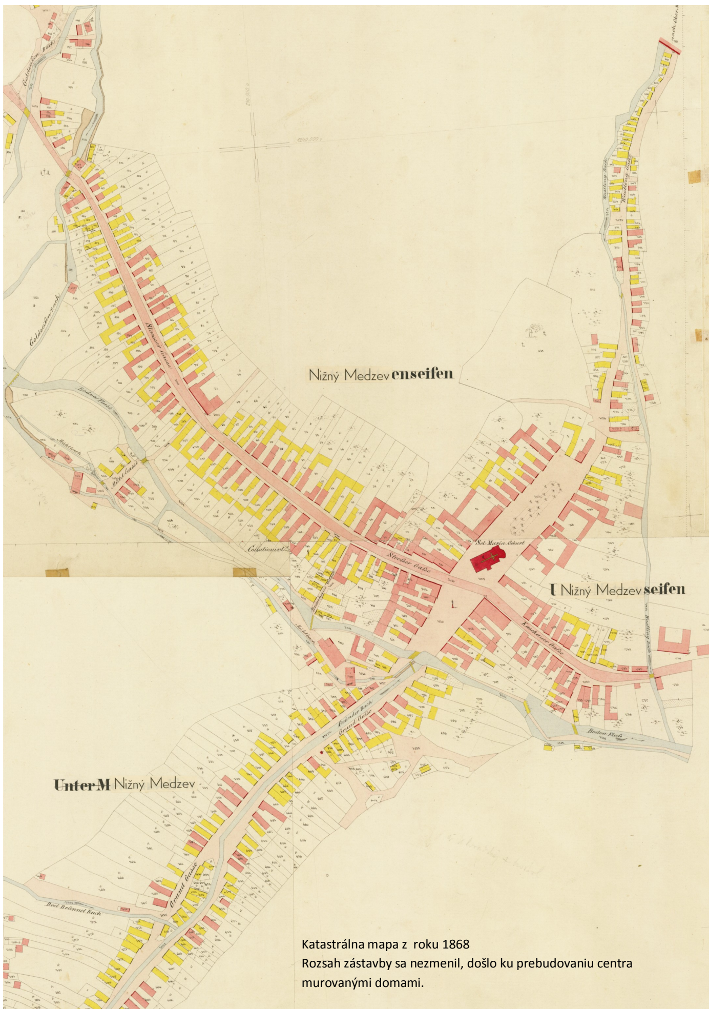
Katastrálna mapa z roku 1868 Rozsah zástavby sa nezmenil, došlo ku prebudovaniu centra murovanými domami.