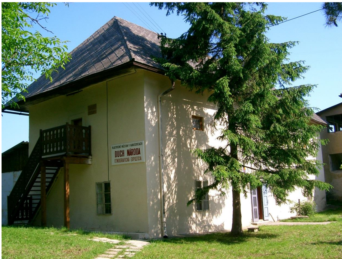
92. Južný pohľad na hospodársku budovu