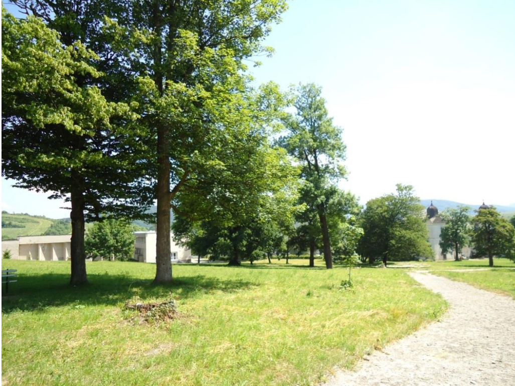
109. Kultúrny dom a kaštieľ v parku od západu (jún 2013)