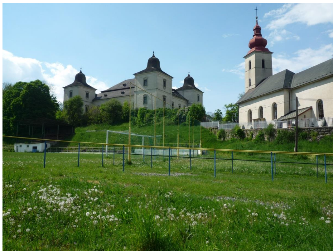
80. Ihrisko (máj 2014)