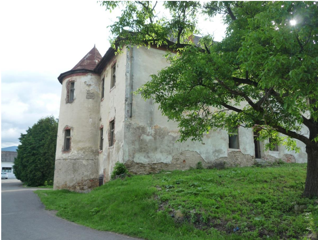
97. Pohľad z východu (jún 2013)