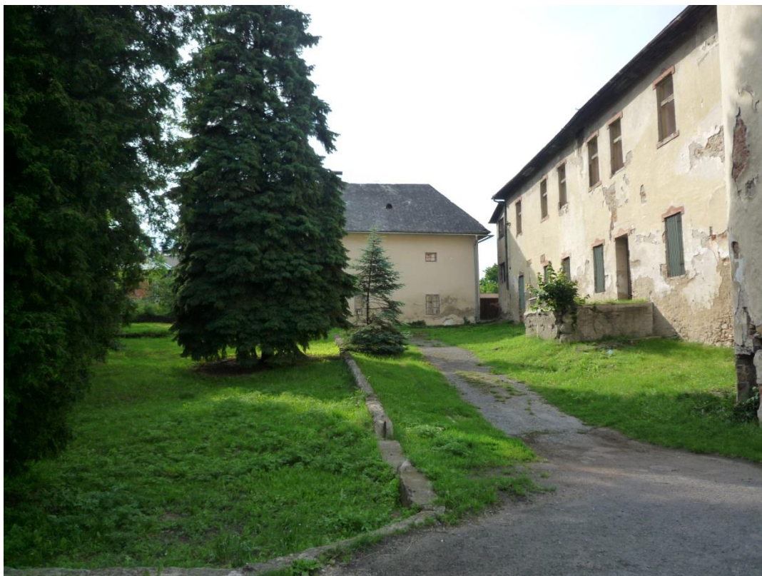
101. Prístupový chodník (jún 2013)