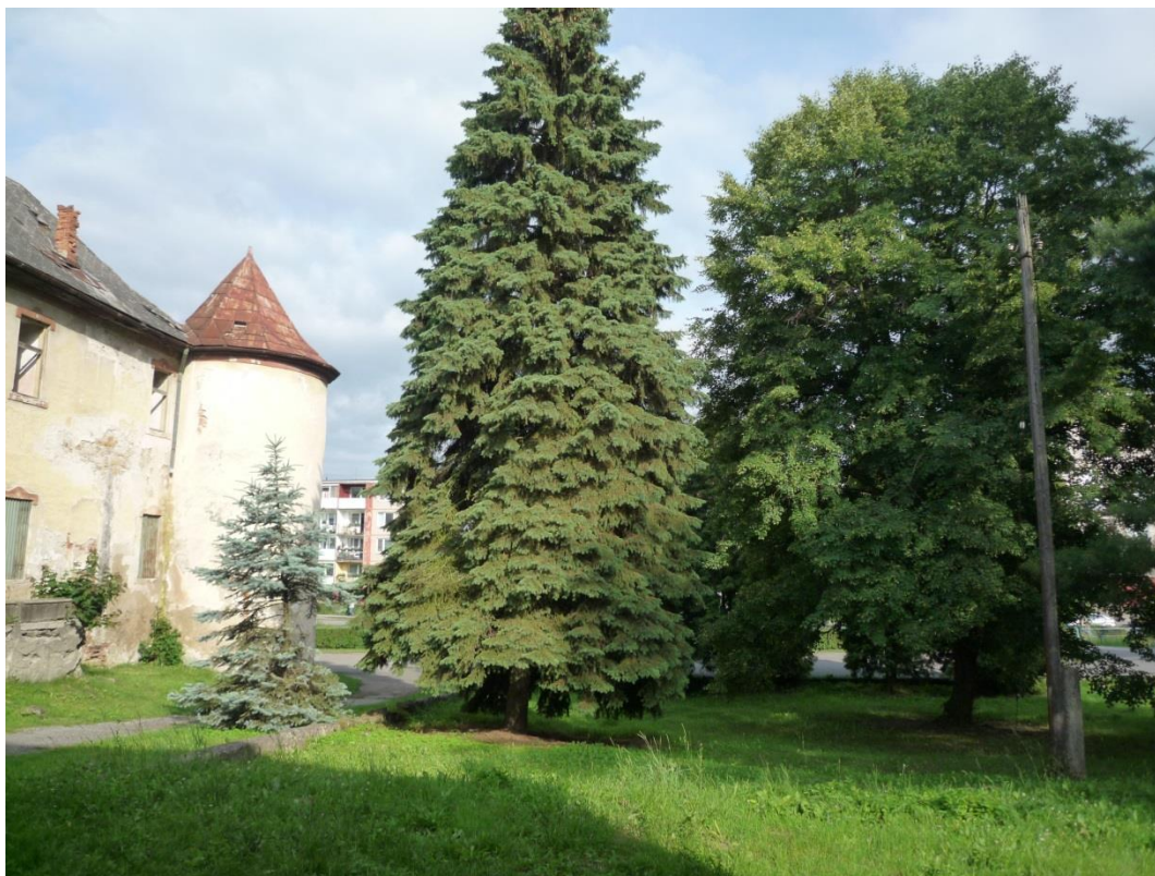
98. Pohľad zo severozápadu (jún 2013)