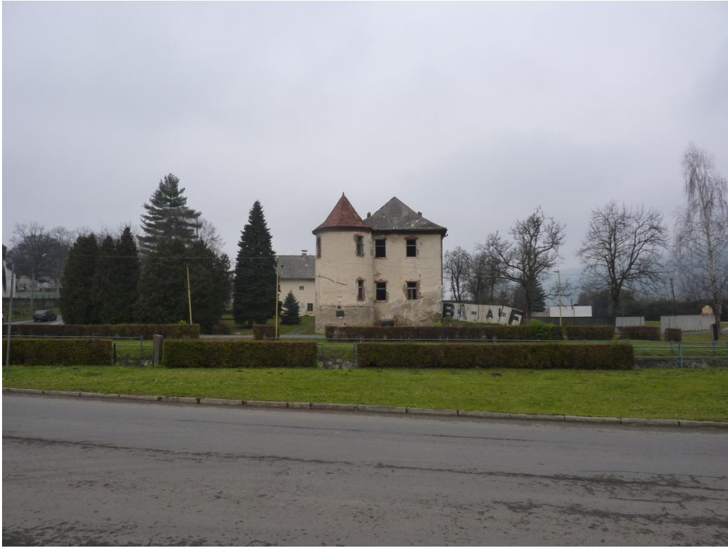
93. Areál malého kaštieľa (r. 2011)