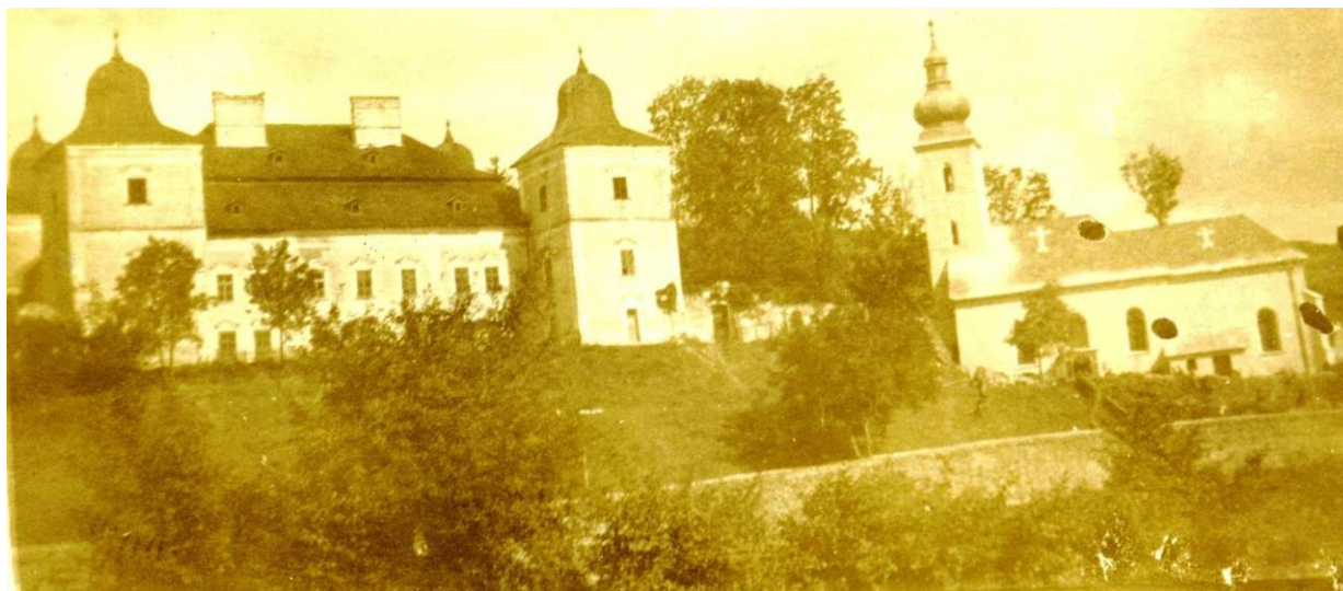
103. Pohľad z južného cípu parcely 15/1 na sever (50. roky 20. stor)