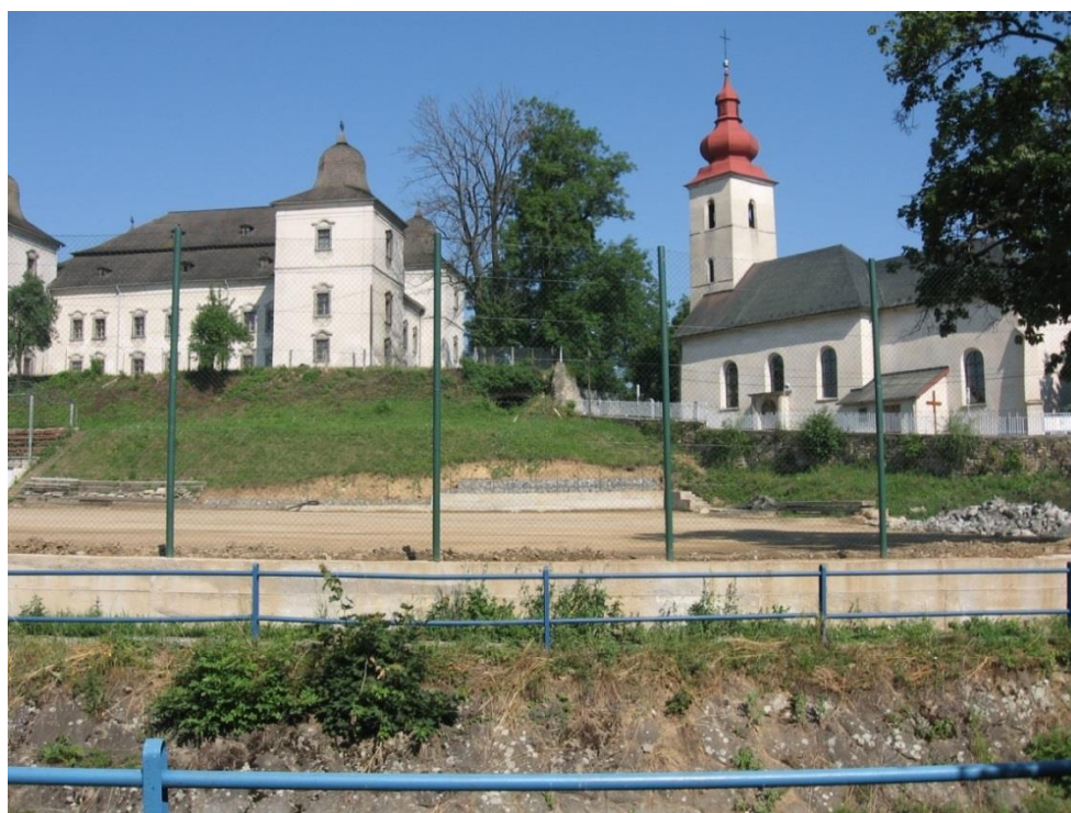
78. Ihrisko - z miestnej komunikácie (r. 2007)