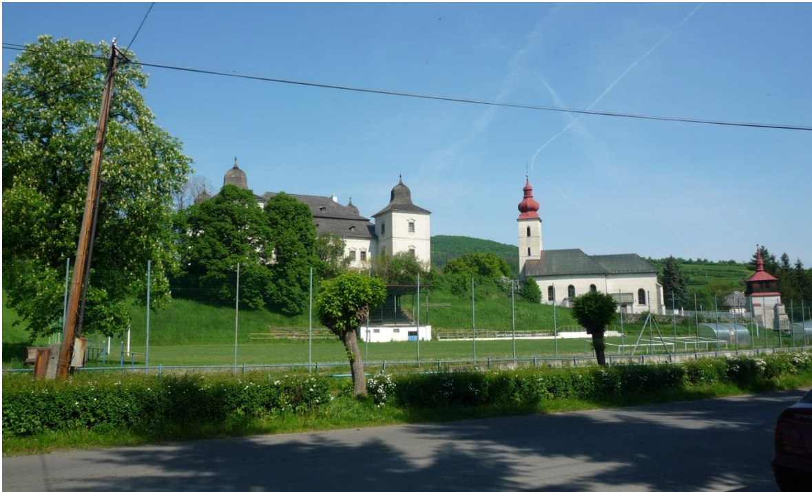
81. Ihrisko - z miestnej komunikácie (máj 2014)