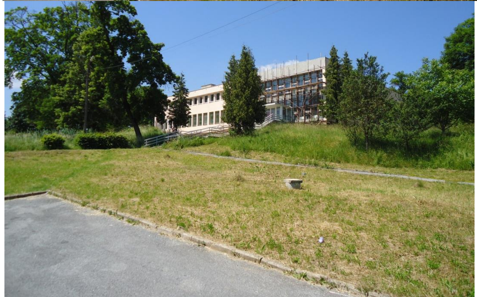
106. Asfaltové povrchy v území (r. 2014) – dole „kultúrny dom“ na parcele 16/2