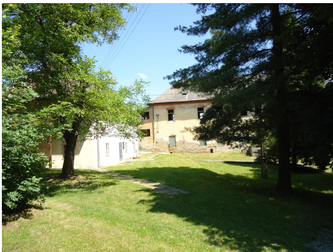
102. Areál Malého kaštieľa a hospodárskej budovy od juhu (jún 2014)