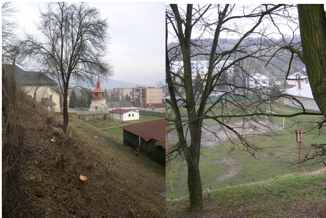
77. Ihrisko v juhovýchodnej časti pôvodného parku (r. 2004)