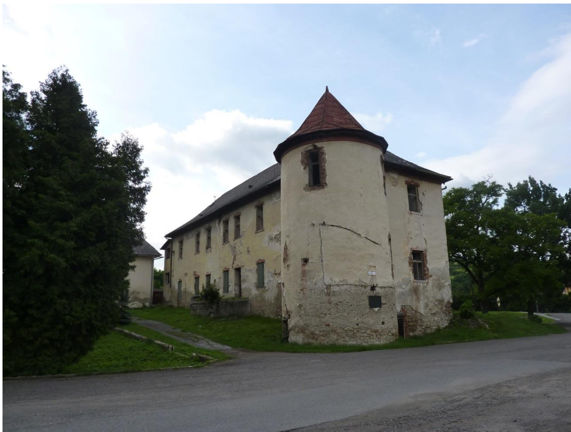
89. Južný pohľad na „Malý kaštieľ“(rok 2013)