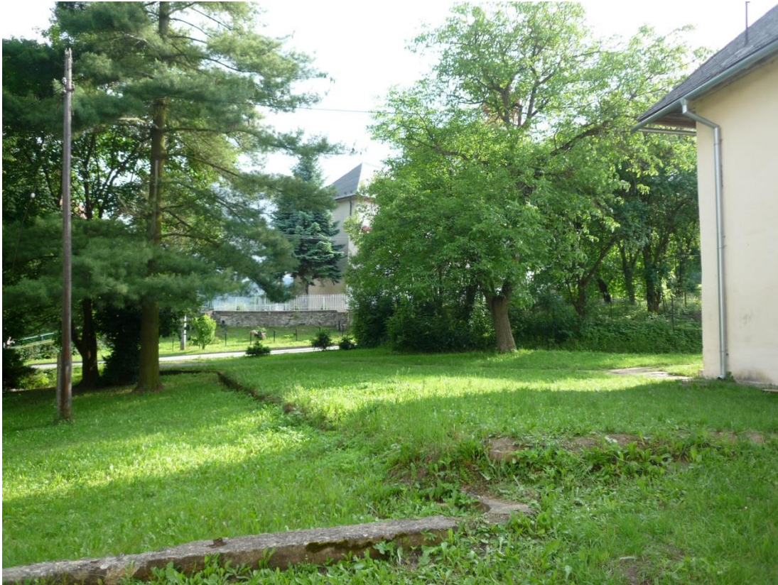
100. Sadovnícka úprava na juhozápade (jún 2013)