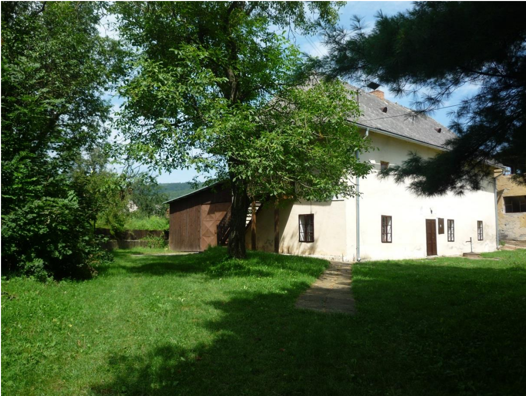
94. Južný pohľad na hospodársku budovu (r. 2014)