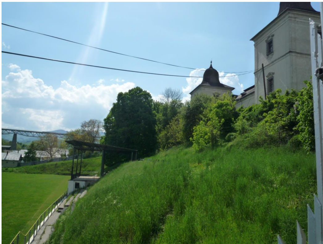
105. Súčasnú pohľad na dotknutú časť územia z troch stanovísk dokumentujúce morfológiu terénu i diaľkové pohľadové vzťahy (viadukt)