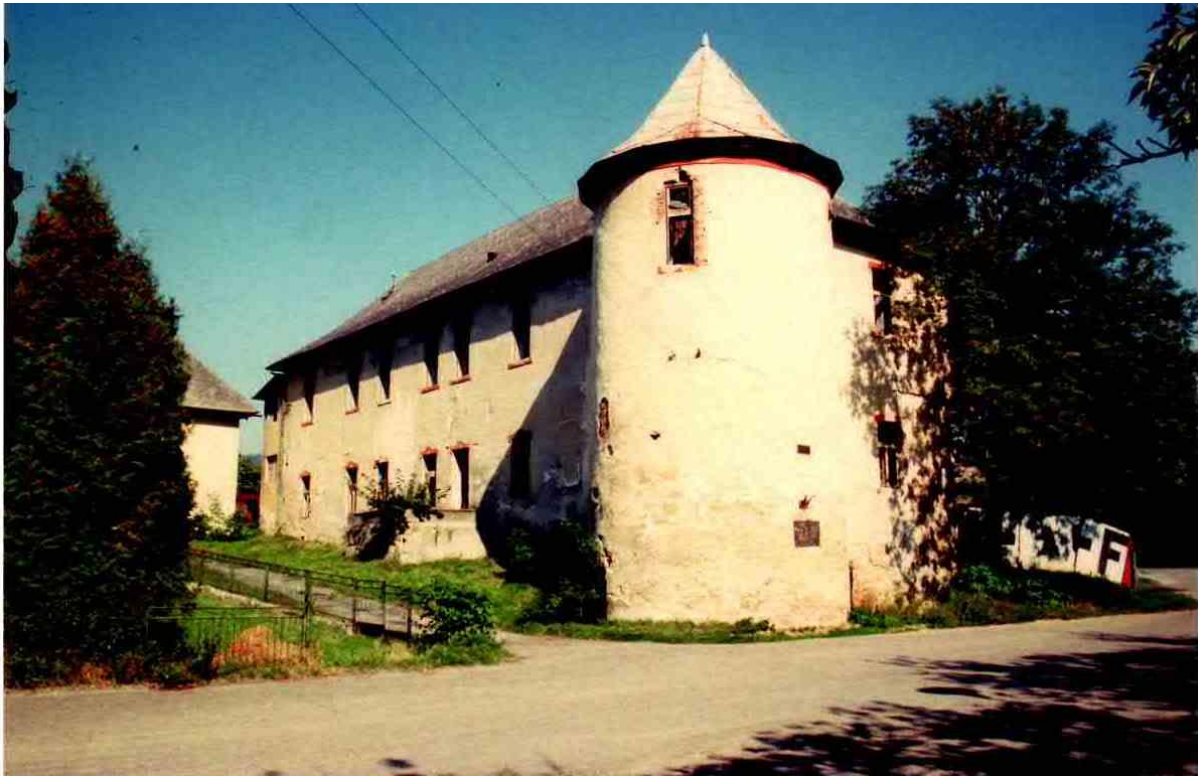
86. Južný pohľad na „Malý kaštieľ“ (rok 2005)