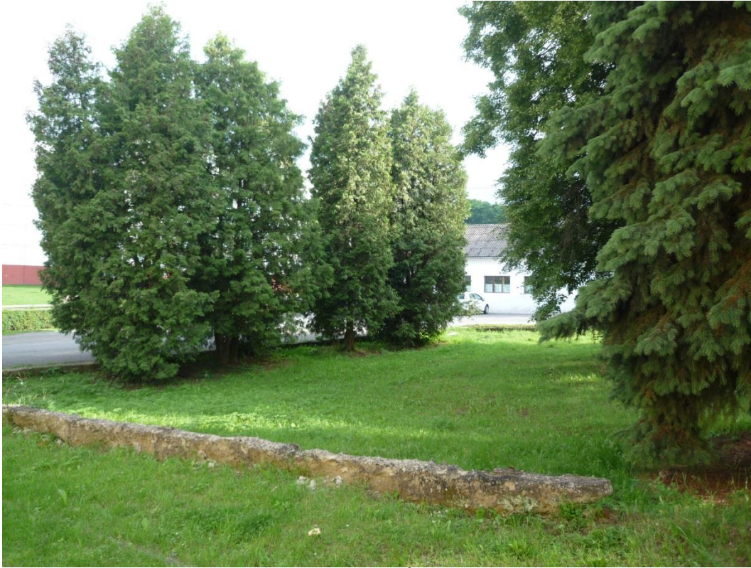
95. Novodobé výsadby pozdĺž komunikácie (jún 2013)