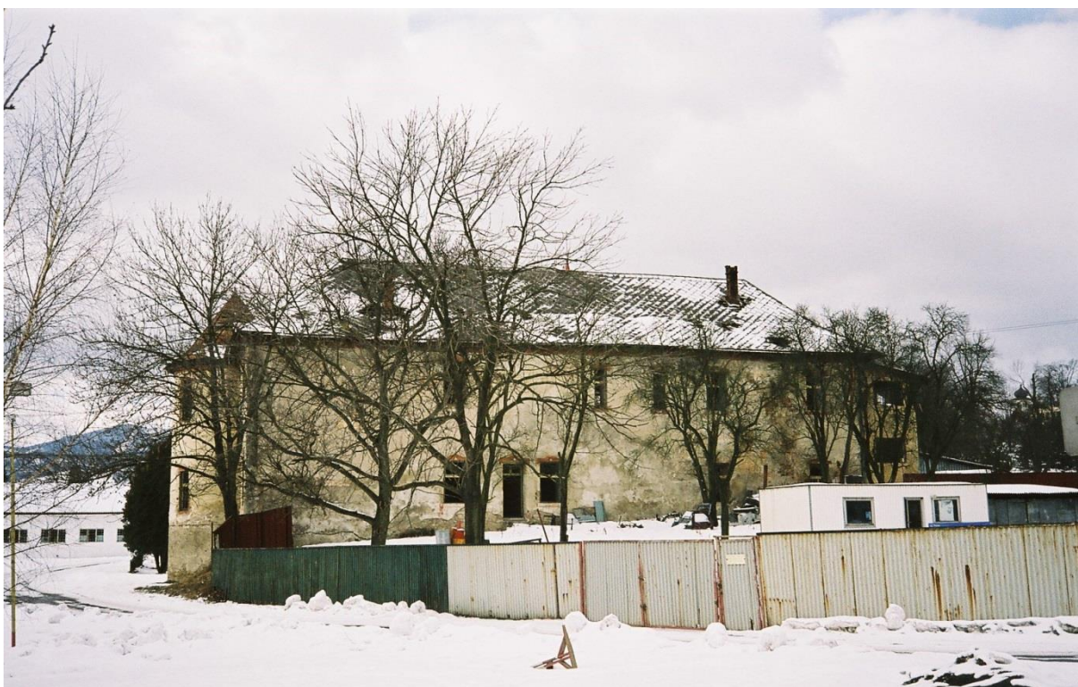
88. „Malý kaštieľ“ s areálom zo severovýchodu (rok 2005)