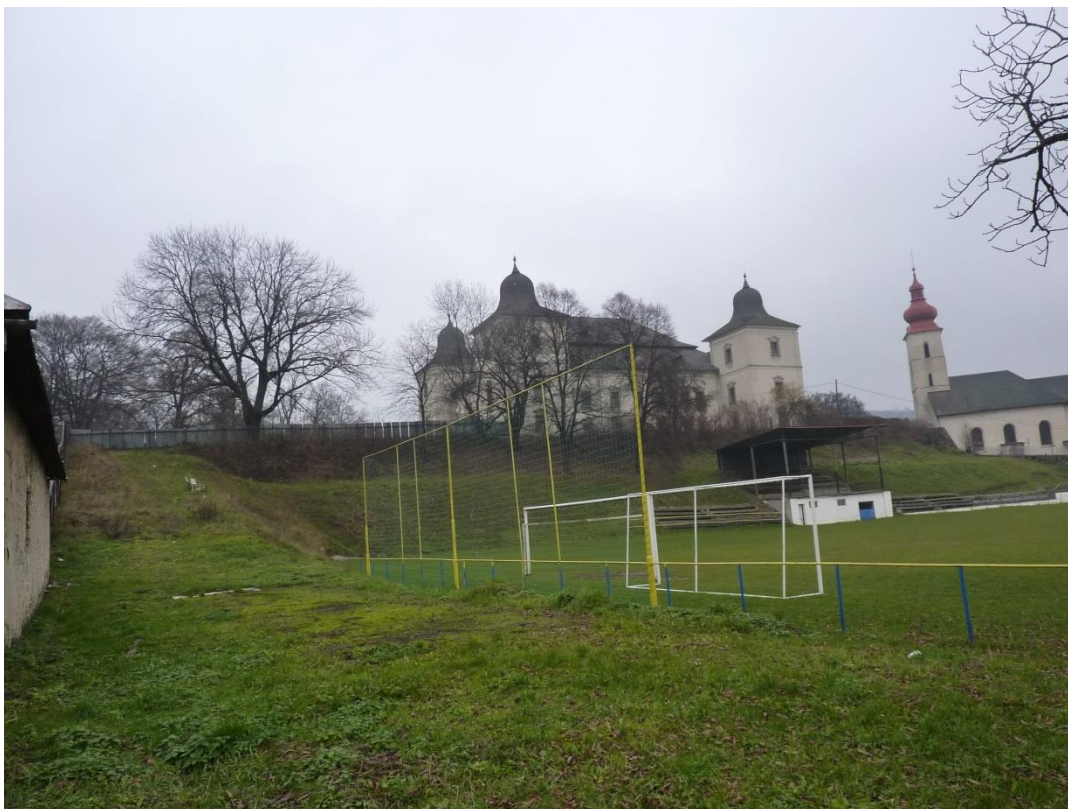
79. Ihrisko (r. 2007)