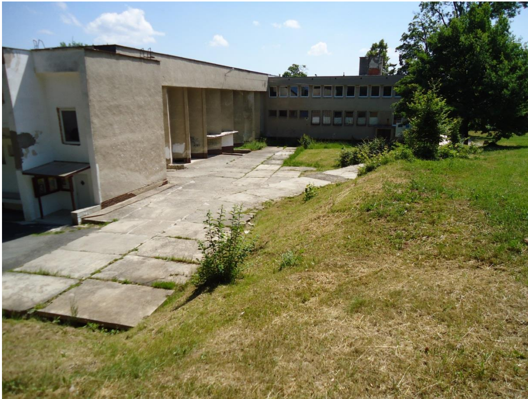
107. Juhozápadný pohľad na kultúrny dom (jún 2014)