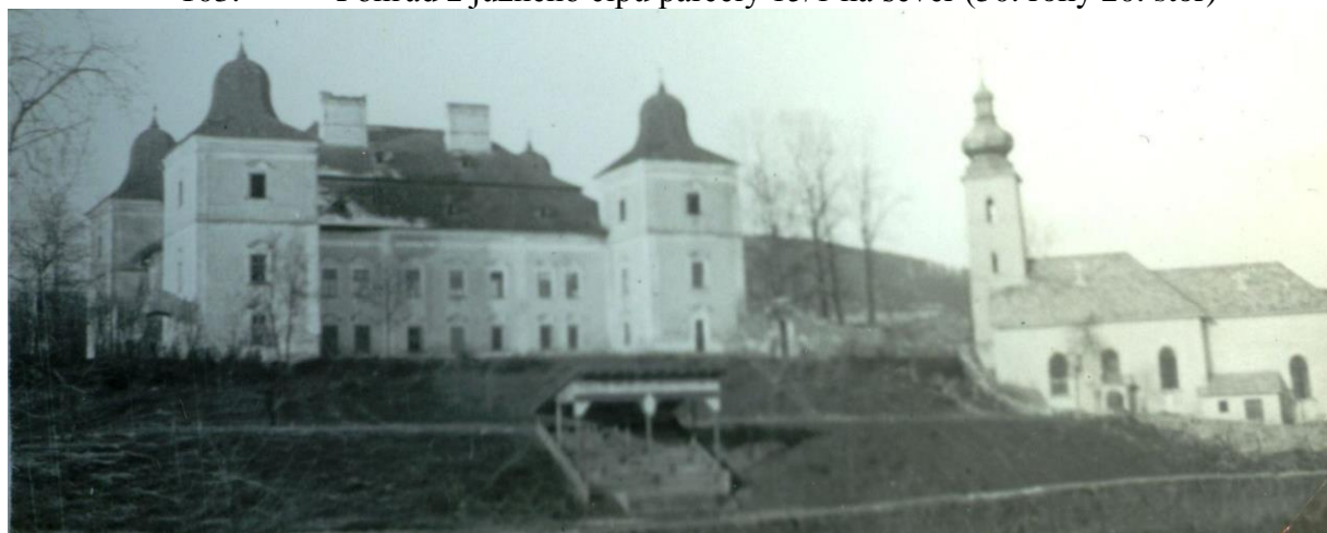
104. Ten istý pohľad o niečo neskôr