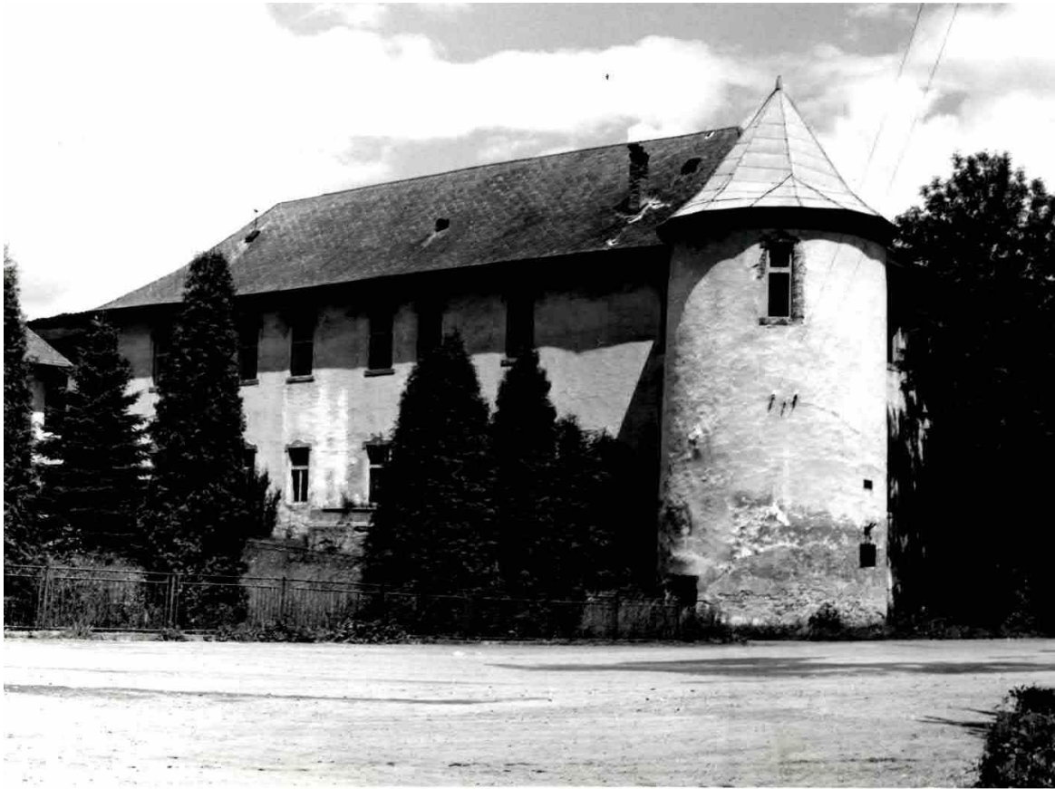
83. Renesančný kaštieľ – tzv. „Malý kaštieľ“ – juhozápadná fasáda (rok 1993)