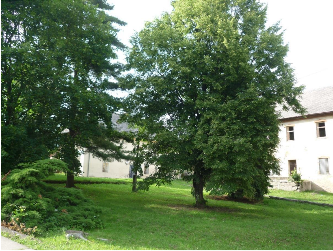
99. Sadovnícka úprava malého kaštieľa (jún 2013)