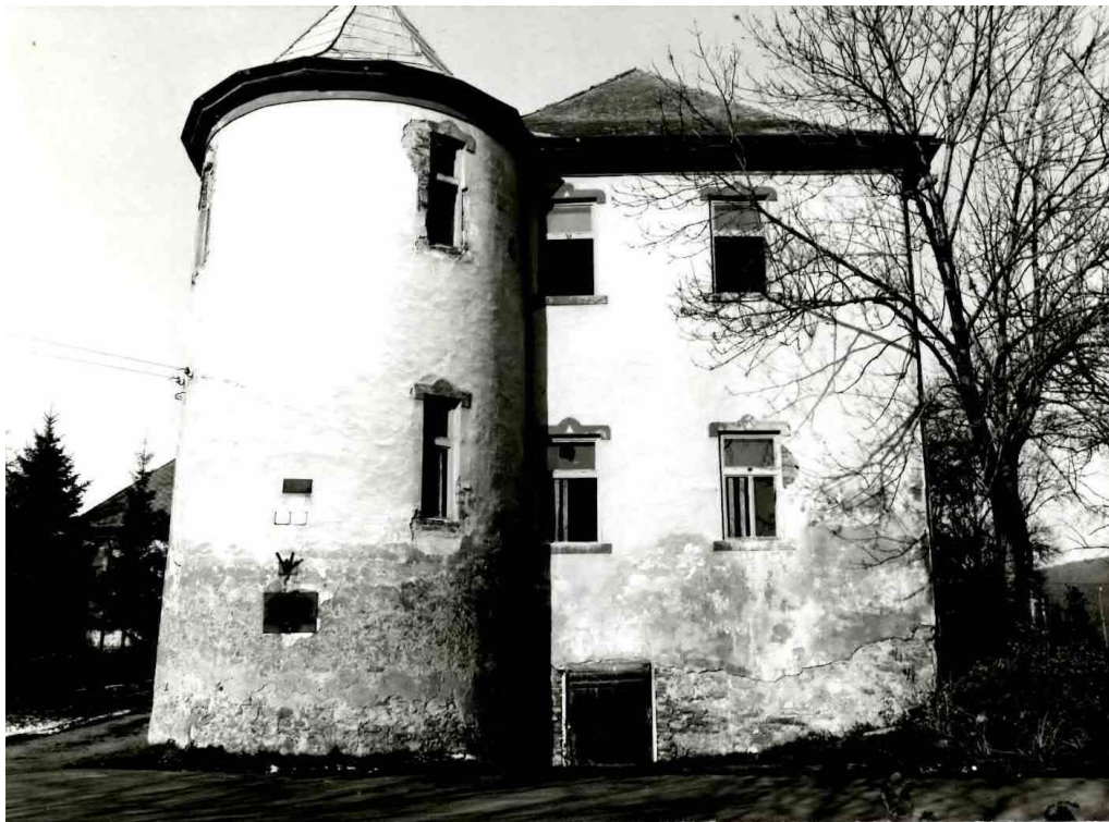
84. Juhovýchodná fasáda „Malého kaštieľa“ (rok 1993)