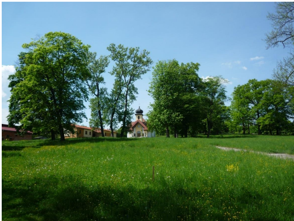
110. Pohľad na gréckokatolícky areál na parcelách 16/2-4 od východu