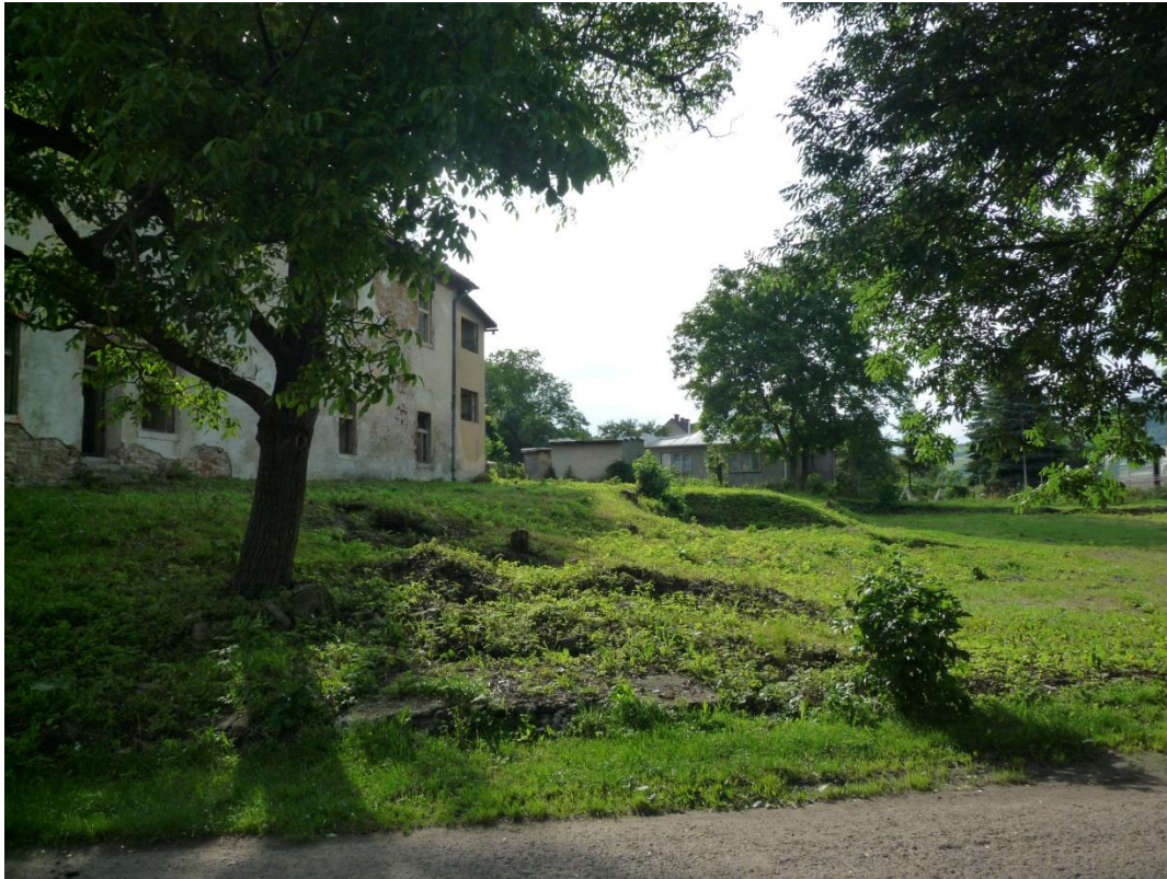
96. Pohľad z juhu (jún 2013)