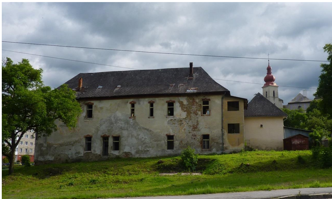
90. „Malý kaštieľ“ s areálom zo severovýchodu (rok 2013)