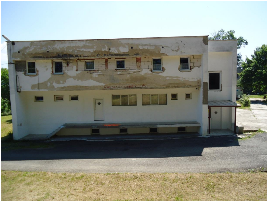
108. Severozápadná fasáda kultúrneho domu (jún 2014)