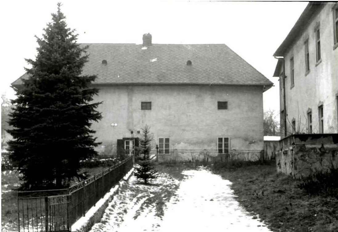
91. Juhovýchodná fasáda hospodárskej budovy pri „Malom kaštieli“ (rok 1993)