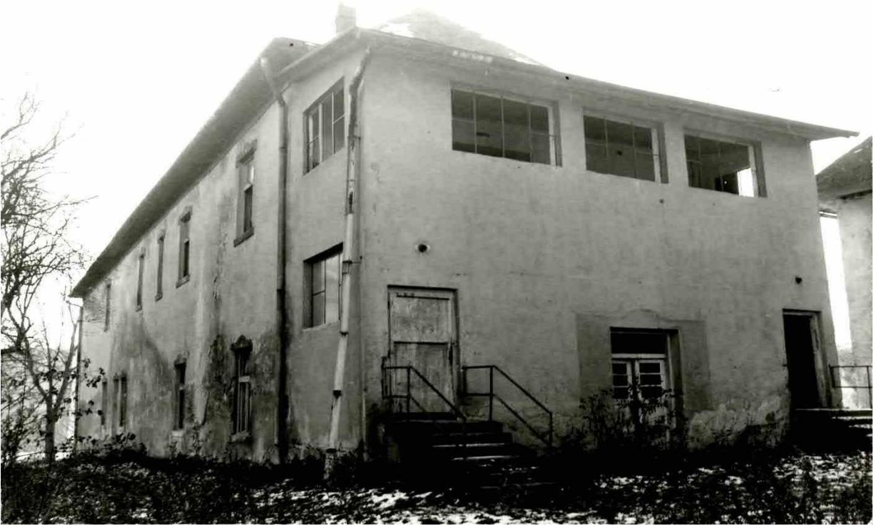
85. Severný pohľad na „Malý kaštieľ“ z 90-tych? rokov 20. stor.