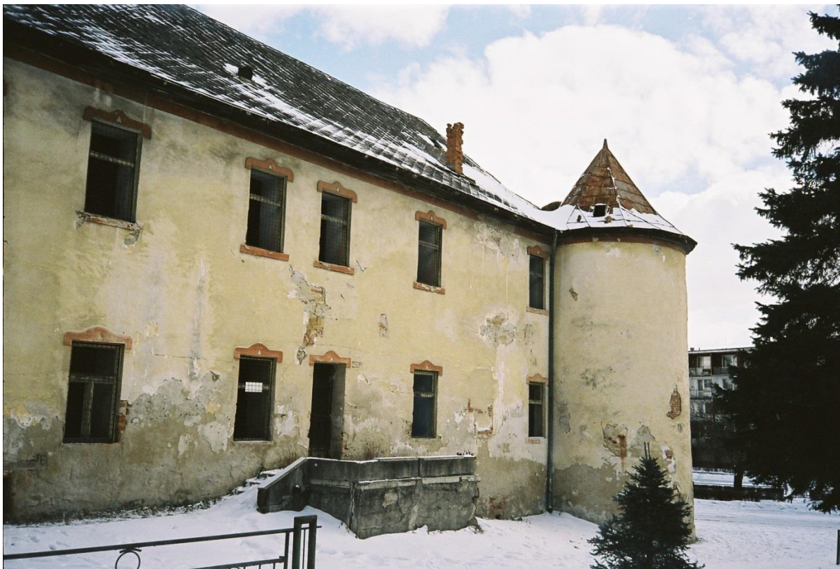
87. Pohľad na juhozápadnú fasádu „Malého kaštieľa“ (rok 2005)