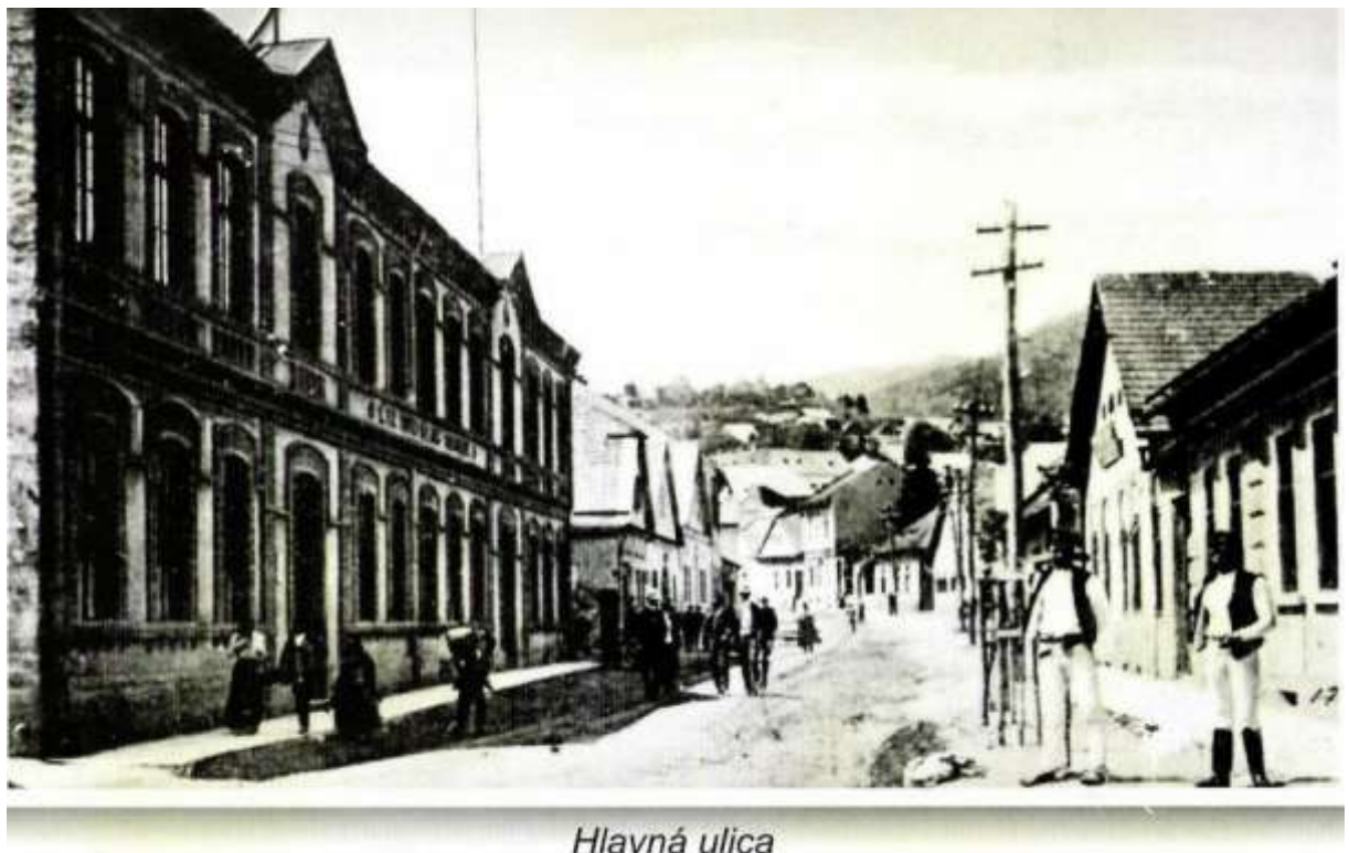
Hlavná ulica v spodnej časti, v blízkosti kamenného mostu. Na ľavej strane je odborná škola (NKP)