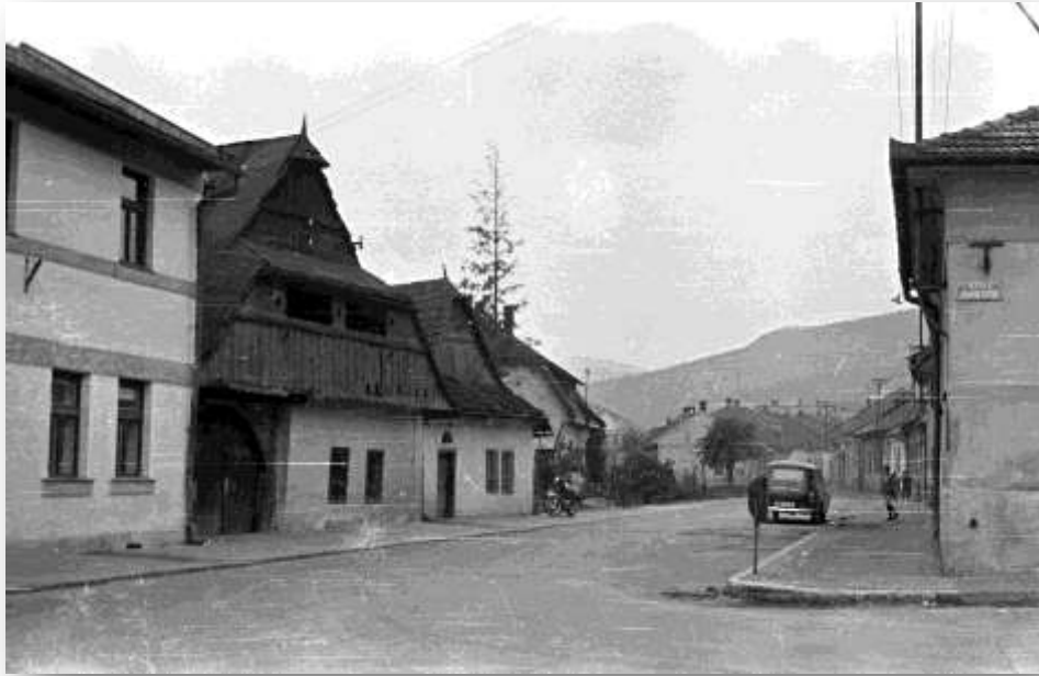
Fotografia Hlavnej ulice č. 88, č. 90, č.92 z roku 1967.