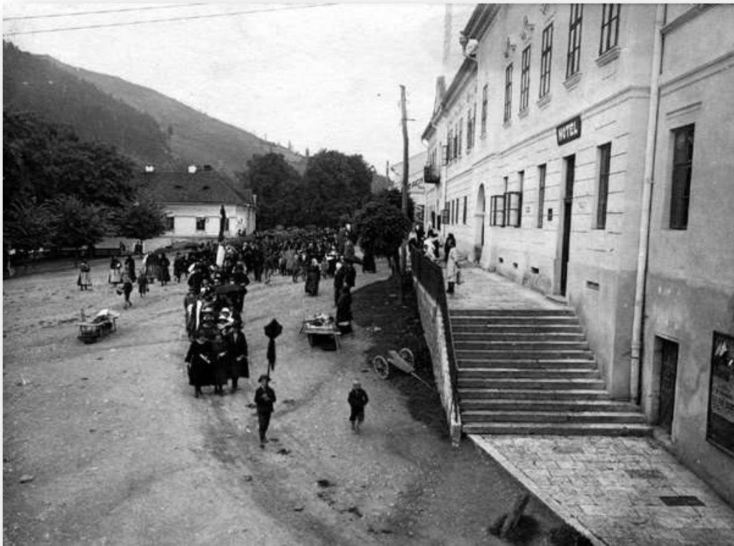
Banícke námestie. V pravo je radnica s vyvýšeným parterom. Schodisko a spevnené plochy sú dláždené travertínovou dlažbou. Pod ňou sa rozprestiera námestie. Ulica nie je spevnená. V severnej časti, ktorá sa zvažuje s rieke Hnilec je park. Fotografia po roku 1933.