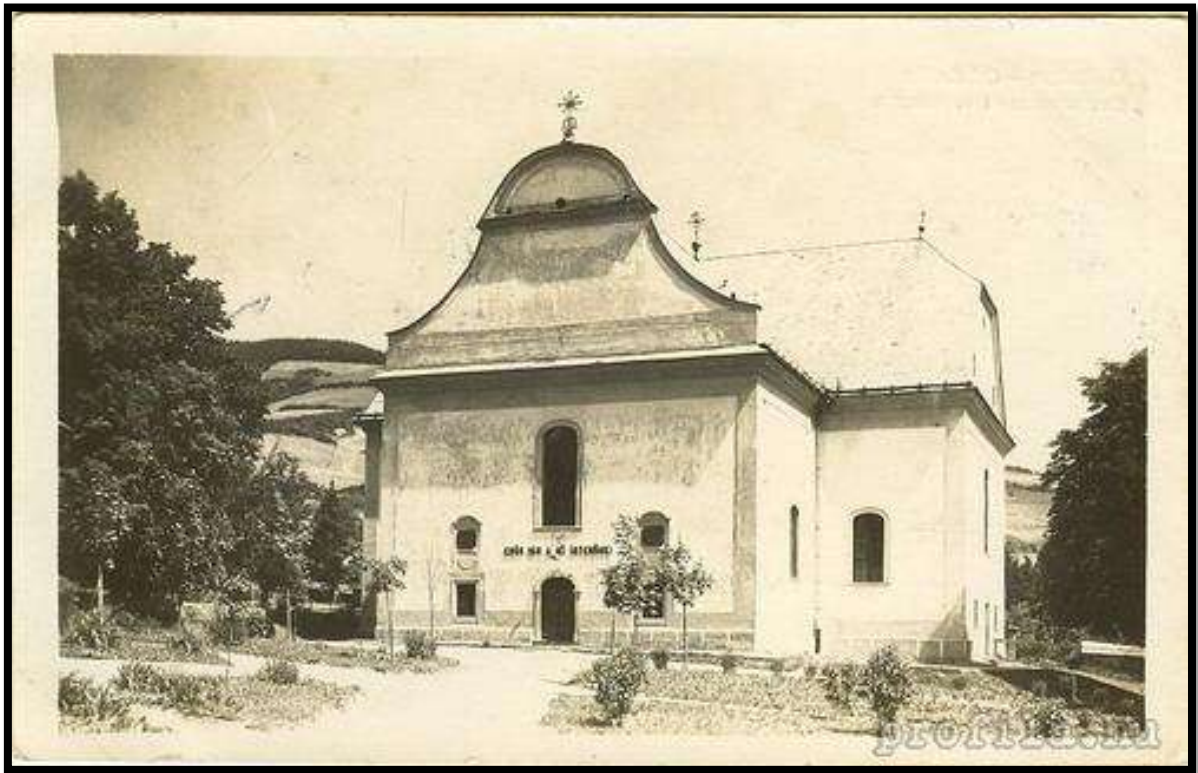
Monumentálny evanjelický kostol z čelnej strany, ktorý je situovaný v rámci Lutherovho námestia. Sadová úprava okolia zostala v tradícii dodnes. Zdroj: Gelnica história a súčasnosť, ISBN 978-80-89082-37-7, str. 244