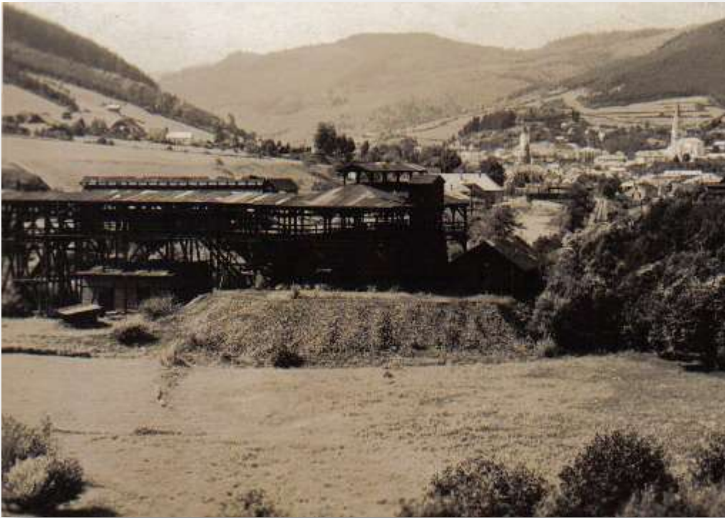
Časť Gelnice pri vodnej nádrži Thurzov, pod Baníckym vrchom, kde je doposiaľ plocha podzemnej ťažby. Vidieť technické ťažobné stavby, toho času už nezachované. Štôlna spracovateľský závod štolne / banskej spol. Roberti.