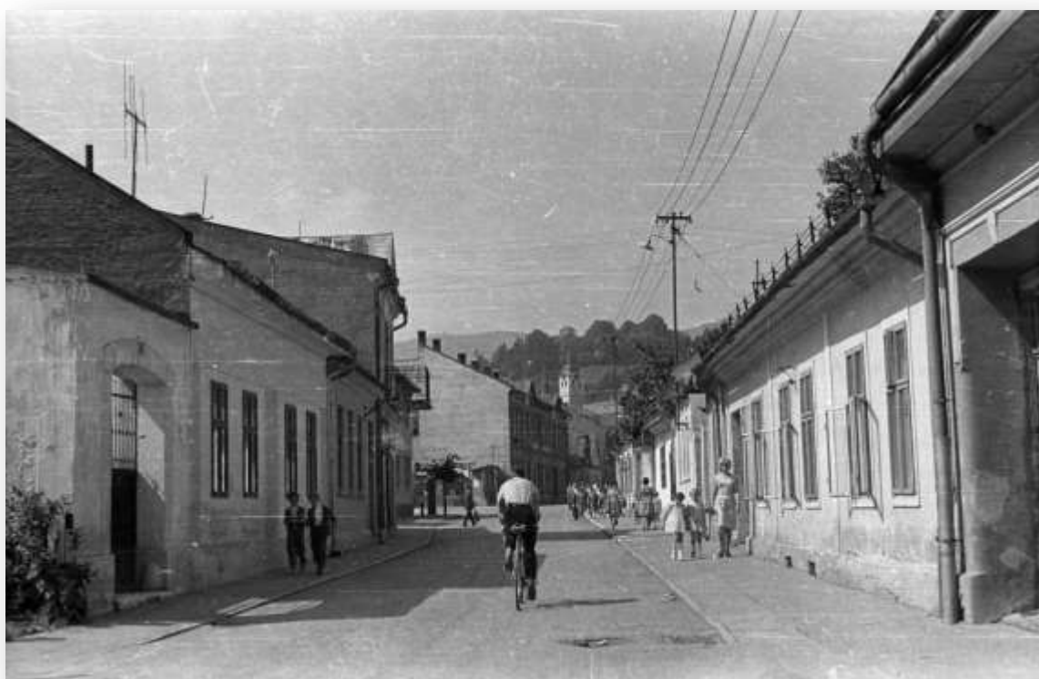
Fotografia strednej časti Hlavnej ulice č. 62, č. 60, č. 50, č. 71 okolo roku 1964.