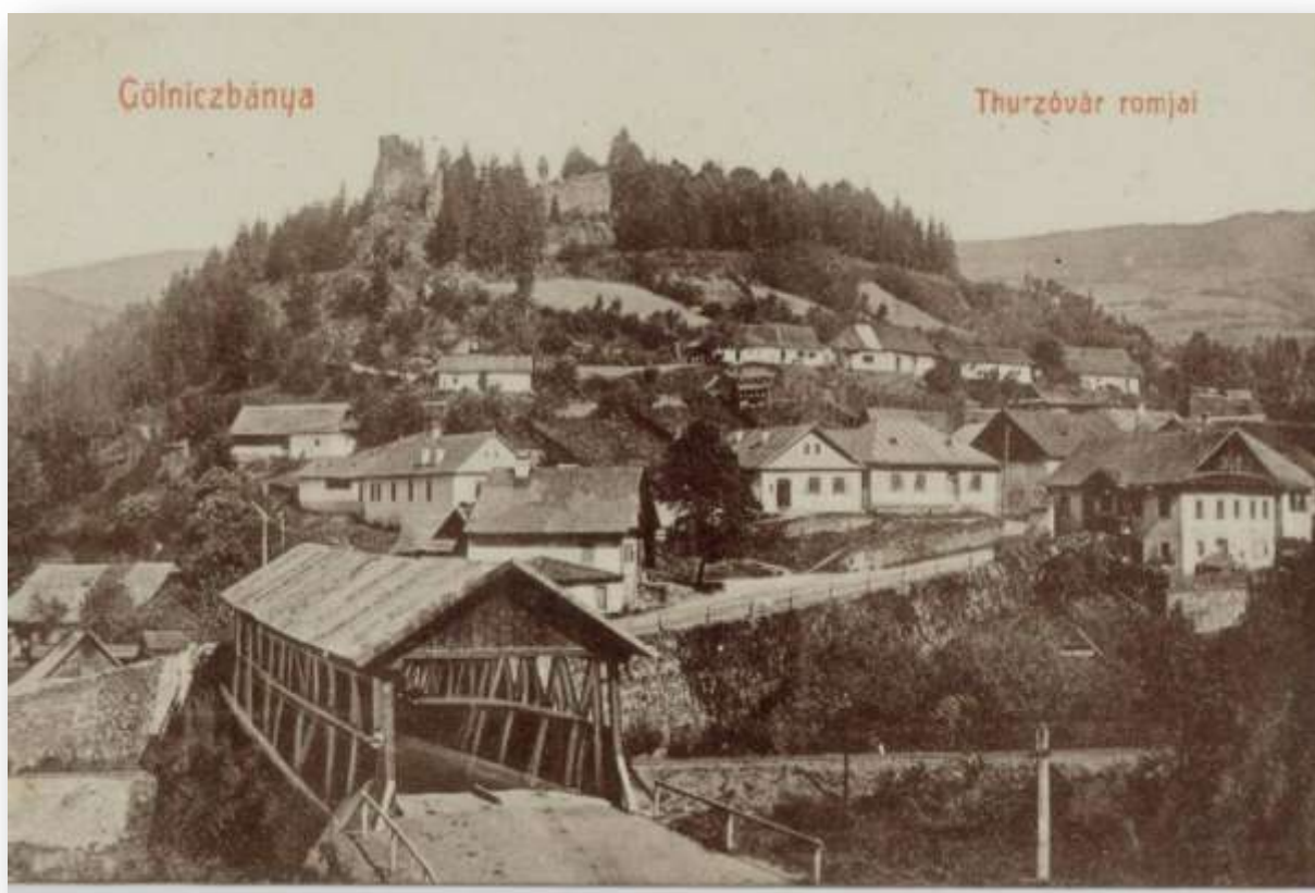
Drevený krytý most nad krajným západným mostom nad riekou Hnilec. Breh rieky je spevnený (kamennou stenou, múrom). Od mosta stúpa Hlavná ulica, ktorá vedie k Baníckemu námestiu. Popri nej sú banícke domy. V pozadí stojí hradný kopec s rozsiahlymi ruinami „Turzovho“ hradu s okolitou vzrastlou zeleňou.