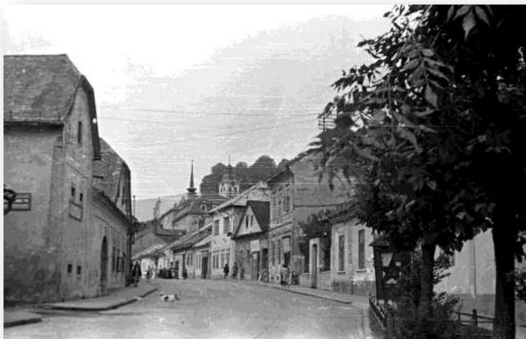
Fotografia zo strednej časti Hlavnej ulice, v popredí Hlavná 36, z roku 1967.