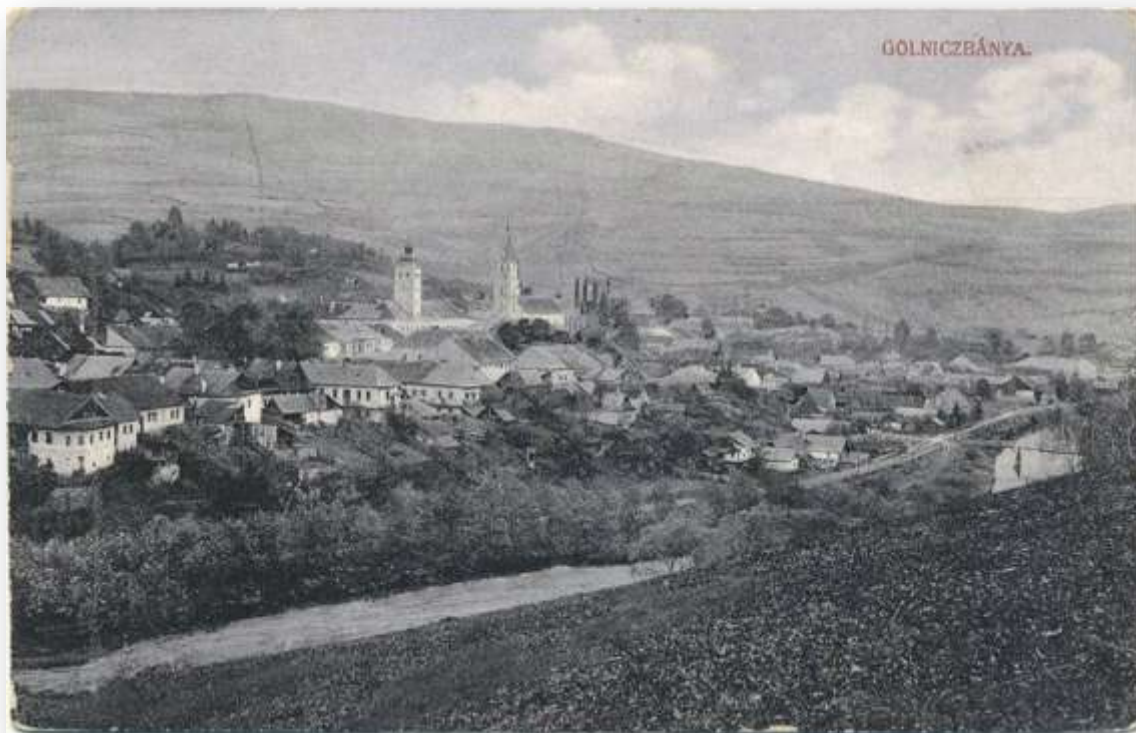
Diaľkový pohľad na sídlo zo západnej strany, z náprotivného kopca. V popredí tok rieky Hnilec, za ktorou sa vinie hlavná cesta ( komunikácia). Z pohľadu je dobre vidieť dvory a záhrady zvažujúce sa k rieke.