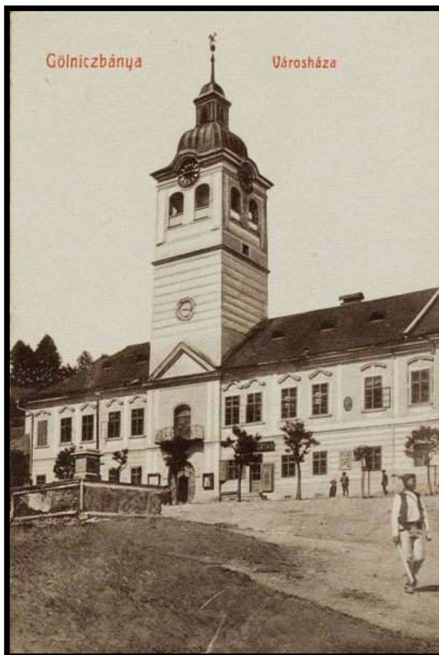
Čelná fasáda radnice s vežou na Baníckom námestí. Pred fasádou bol vysadený rad stromov. Plocha námestia nebola spevnená. V popredí stojí jednoduchá kamenná studňa s ohradou.