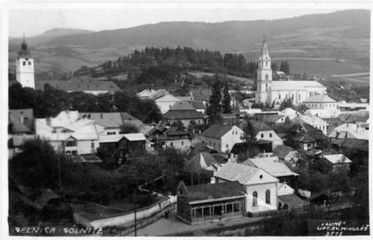
Časť mesta vymedzená medzi radnicou a rímskokatolíckym kostolom Nanebovzatia Panny Márie. V popredí zastávka železničnej stanice, za ktorou stála synagóga (dnes už neexistujúca).