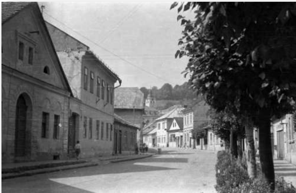
Fotografia Hlavnej ulice č. 32, č. 34, č. 36 z roku 1964.