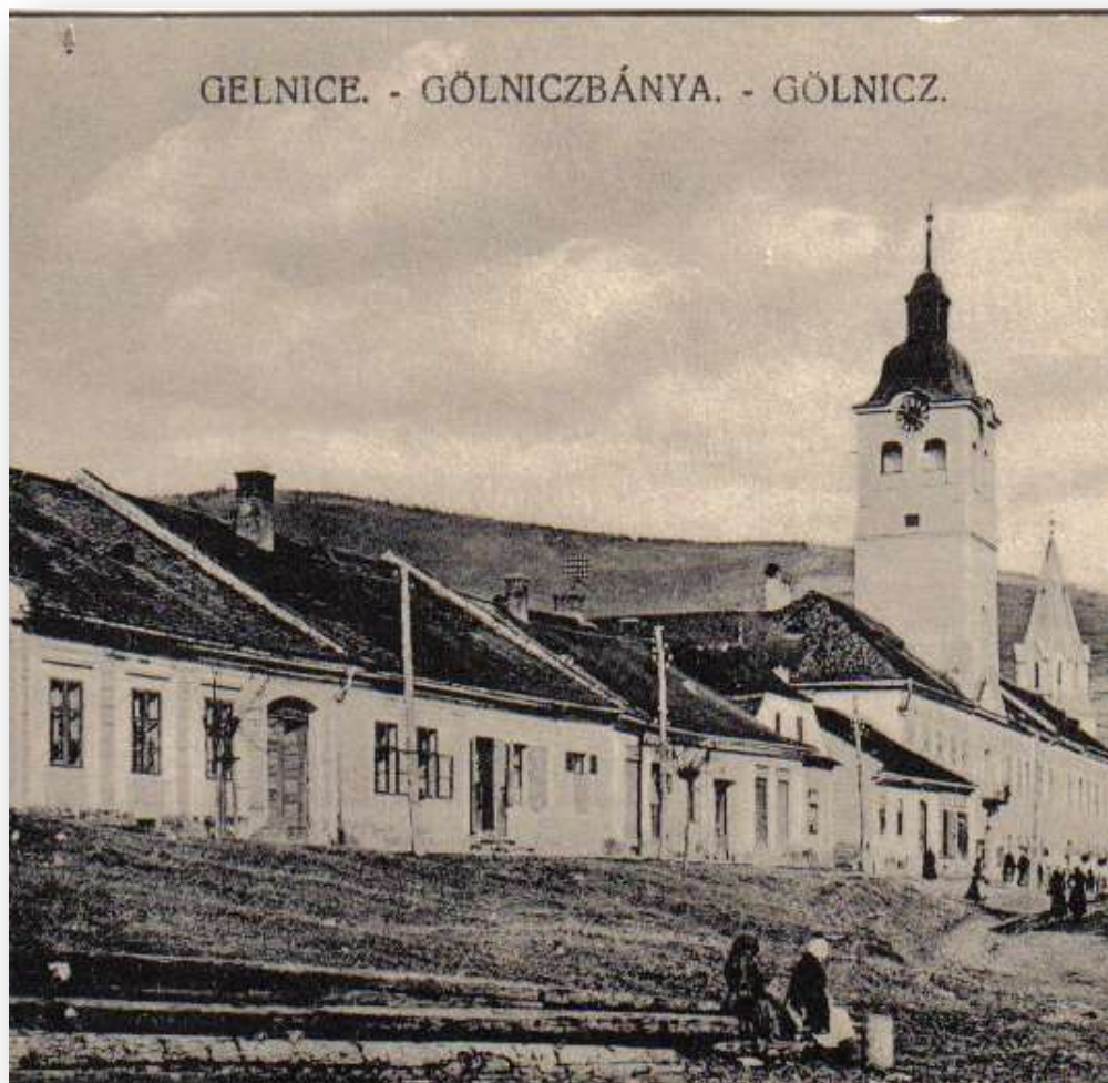
Radová zástavba Banického námestia, západne od radnice. Plocha námestia je nespevnená, s trávňatým porastom. Obdobie približne v 30. – tých rokoch 20. storočia