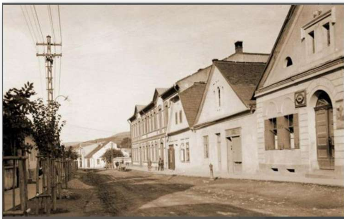
Spodný koniec Hlavnej ulice č. 44 – 50, z roku 1930. V závere pôvodná prvá štátna železiarska odborná škola