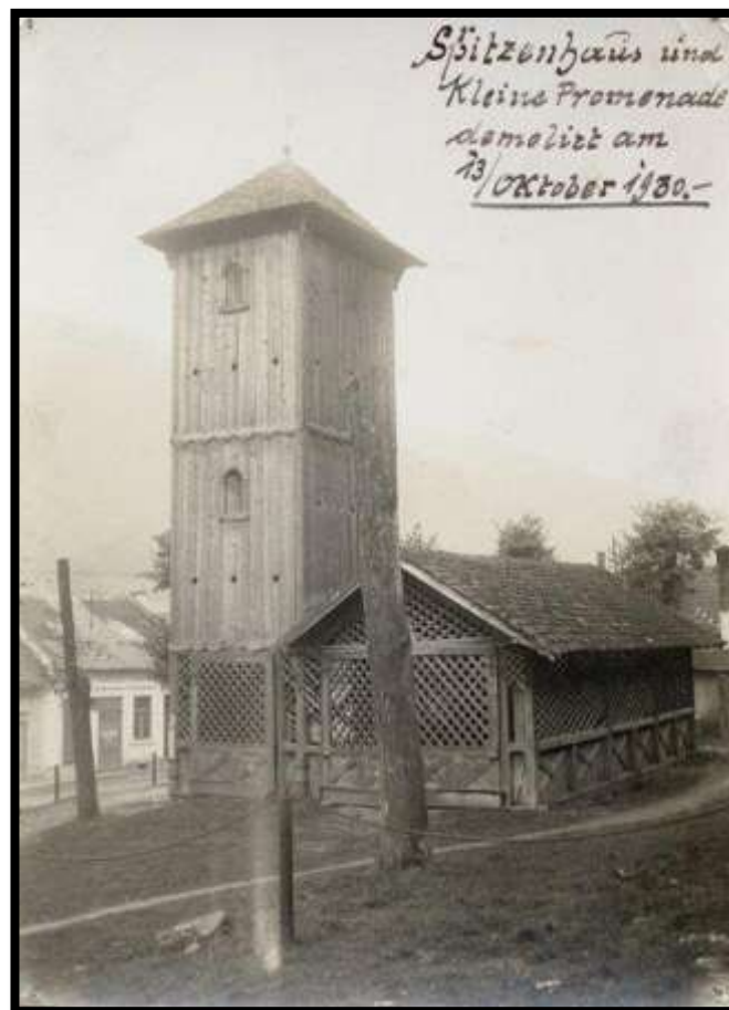
Požiarna zbrojnica na Baníckom námestí (s vežou na sušenie hasičských hadíc) - pri nemocnici. Na obrázku je napísané, že boli zbúrané v októbri 1930.