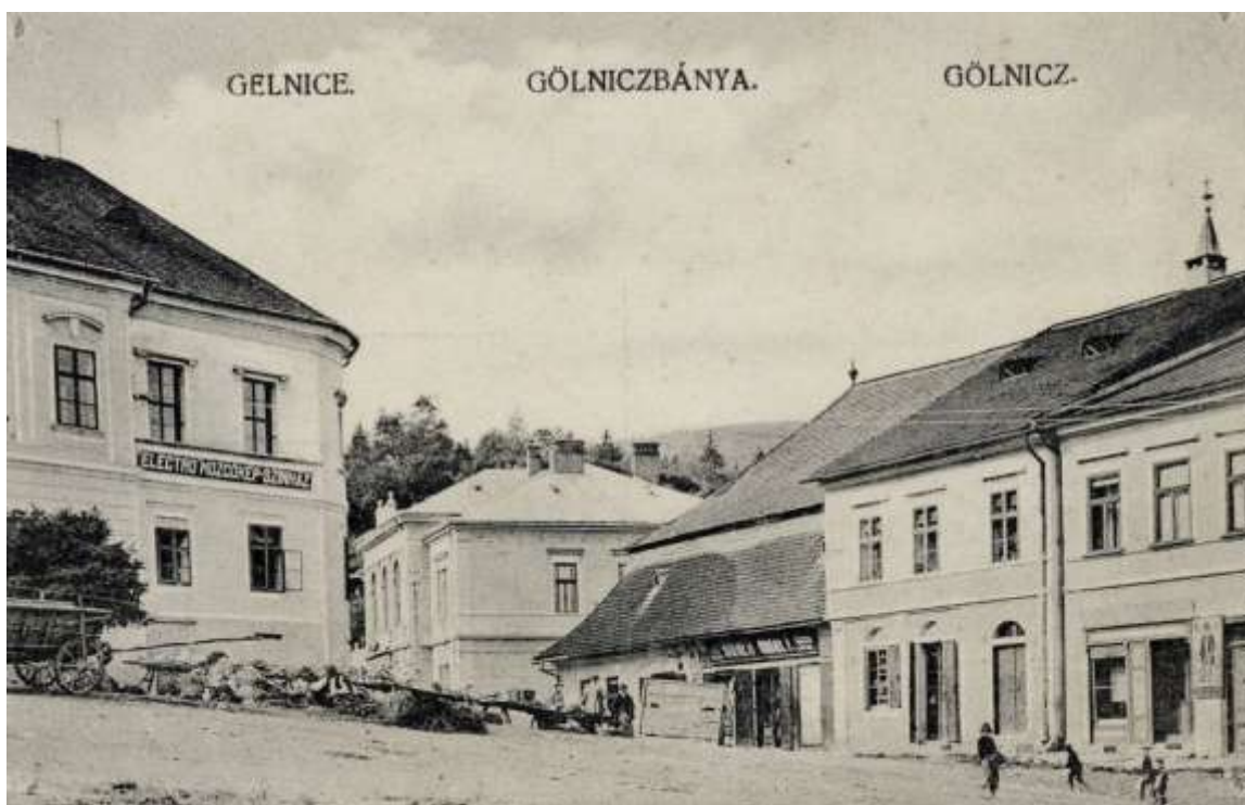
Historická zástavba na východnej hranici Banického námestia. Na ľavom kraji budova radnice.