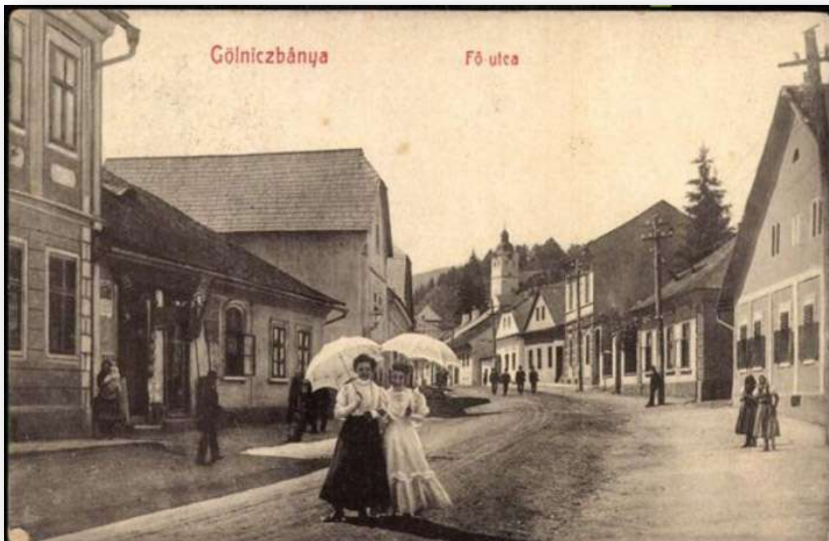
Hlavná ulica č. 36 – 37, fotografia z roku 1910